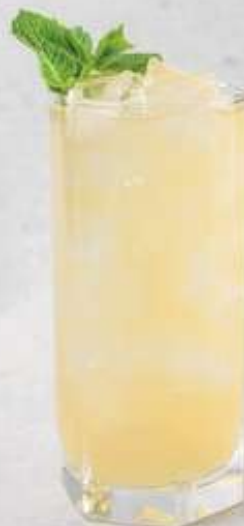
ОСВЕЖАЮЩИЙ ЗЕЛЕНЫЙ ЧАЙ