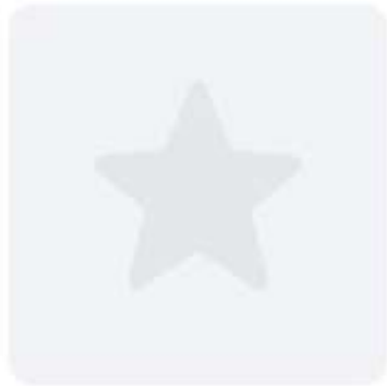
Капамарата с морепродуктами 251 790 Р