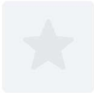
Качо в пепе 380 Р