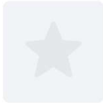
Фрош 400 Р Морковь/Яблоко/Сельдерей/ Апельсин/Грейпфрут