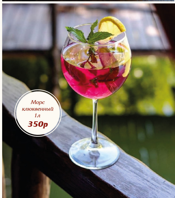
Морс клюквенный 1л 350р