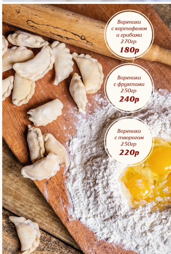
Вареники с картофелем и грибами 270гр 180р