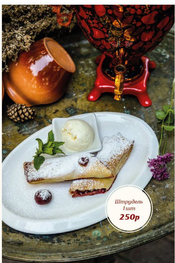
Штрудель 1шт 250р