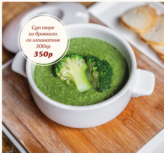
Суп пюре из брокколи со шпинатом 300гр 350р