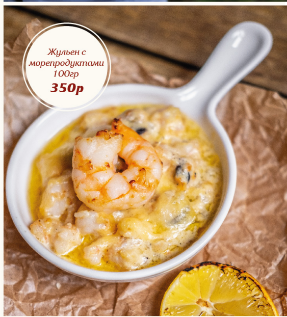
Жульен с морепродуктами 100гр 350р