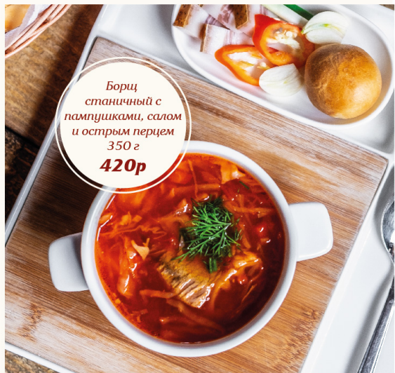
Борщ станичный с пампушками, салом и острым перцем 350 г 420р