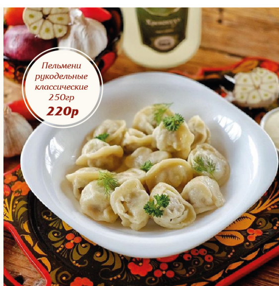
Пельмени рукодельные классические 250гр 220р