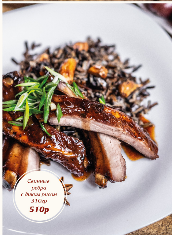
Свинные рёбра с диким рисом 310гр 510р