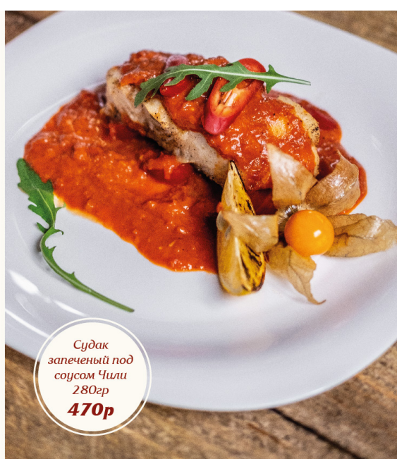
Судак запечённый под соусом Чили 280гр 470р