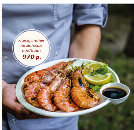
Лангустины на мангале пор/6шт 970 р.