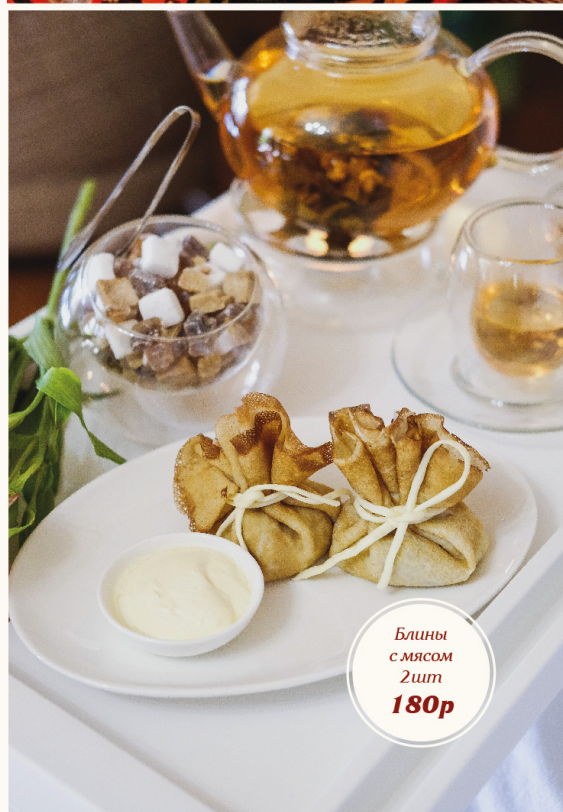
Блины с мясом 2шт 180р