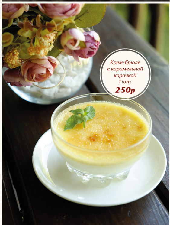
Крем-брюле с карамельной корочкой 1шт 250р