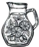
SANGRIA | 2 100