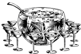
PLANTER'S PUNCH | 2 900