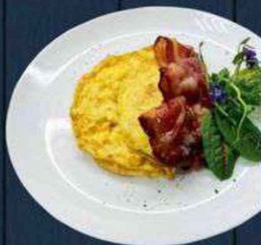
Омлет из 2-х яиц