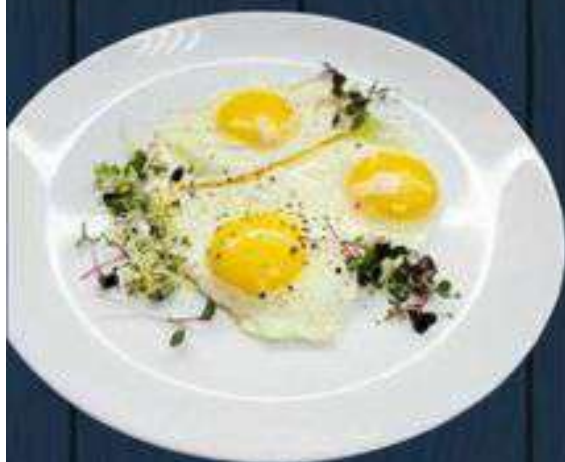
Яичница из 3-х яиц