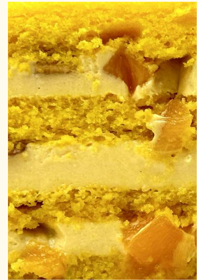
МАНГО – МАНГО

сочетание трёх видов шоколадного мусса из бельгийского шоколада: тёмного, молочного и белого с шоколадным бисквитом