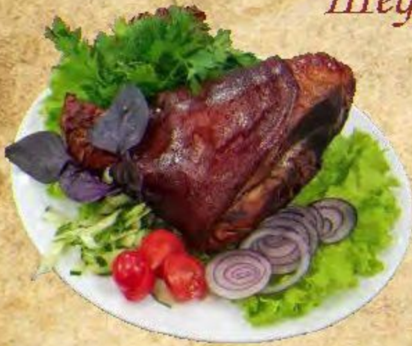
Свиная Фулька 1000/200 г 2500 руб.