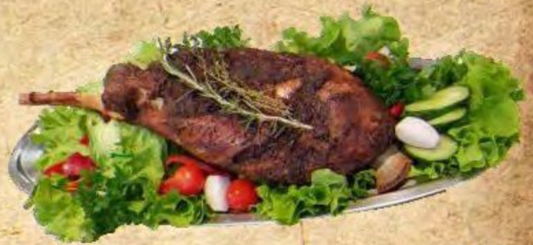
Ростбиф Говяжий под Клюквенным Соусом 1000/700 г 4500 руб.