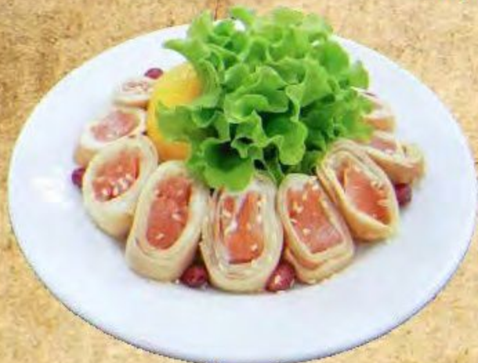
Рулетики из Блинов с Сёмгой