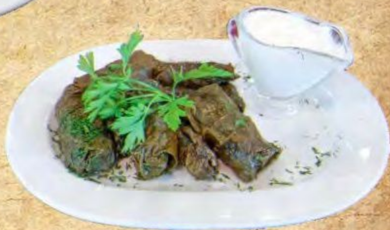
Кавурма на Садже

Мясо на выбор, баклажаны, перец болгарский, лук репчатый, шампиньоны, помидоры, картофель.