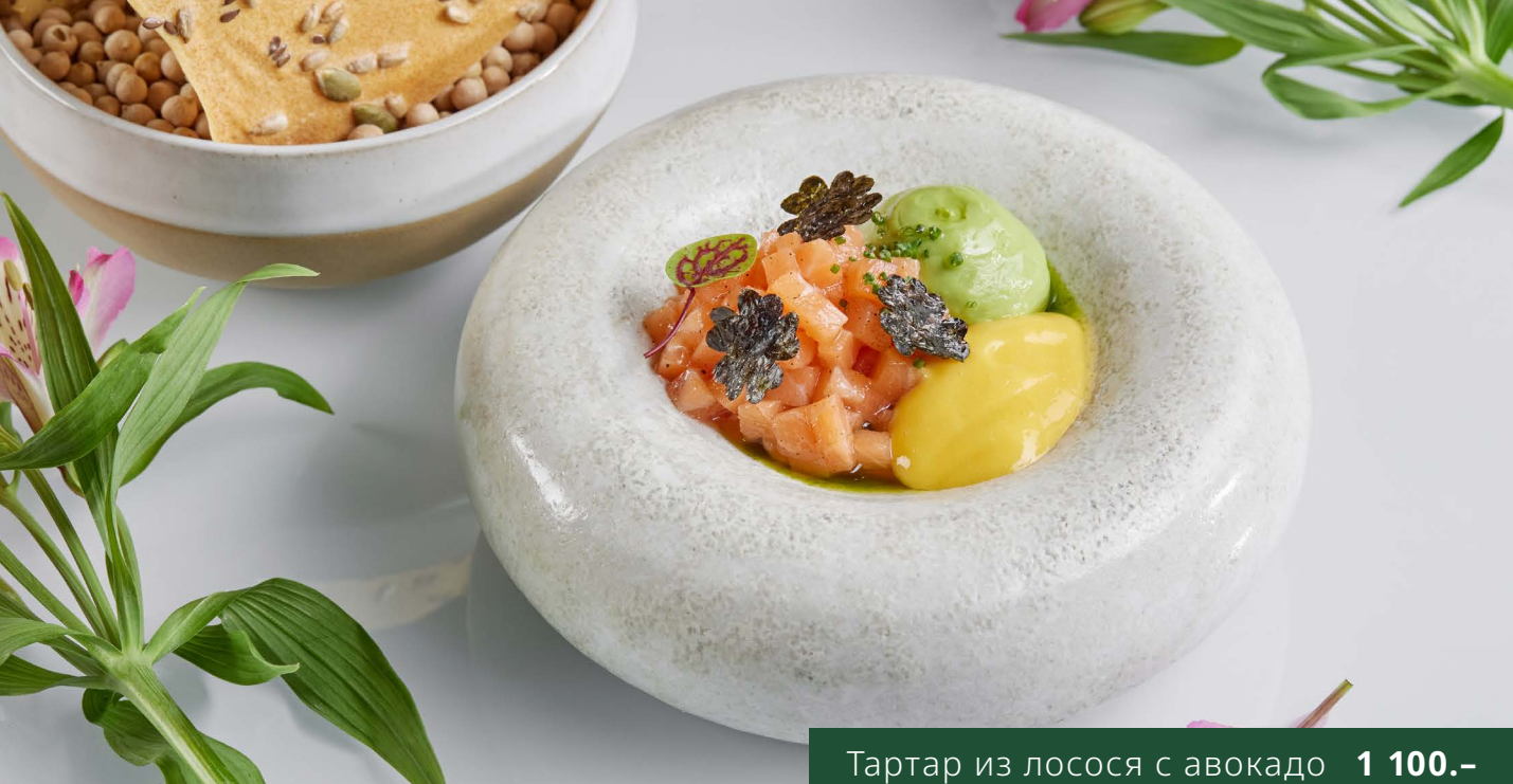
Тартар из лосося с авокадо 1 100.-