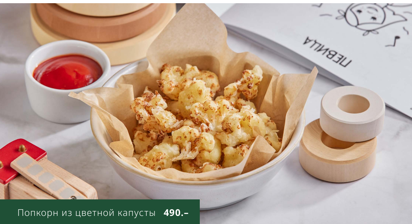
Попкорн из цветной капусты 490.-