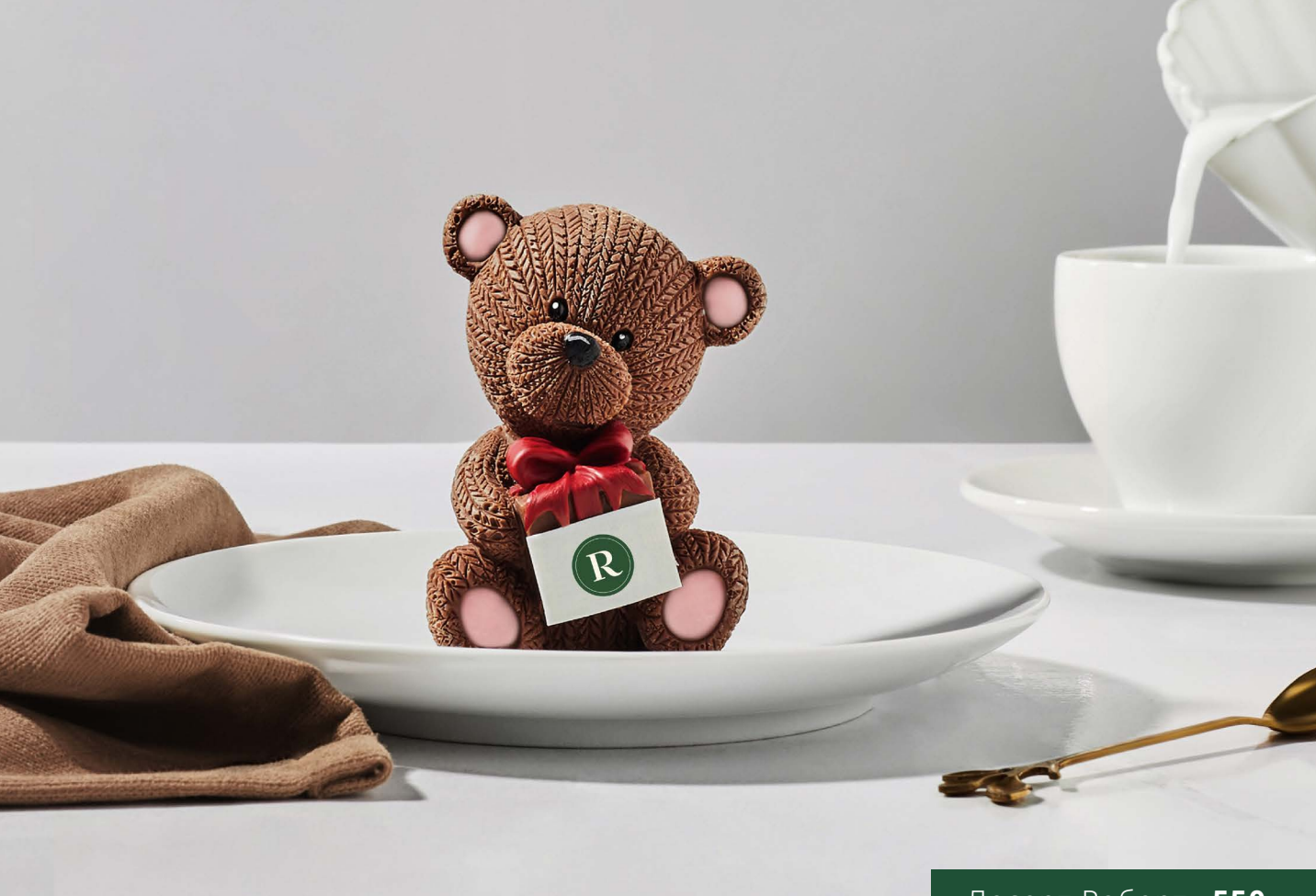
Десерт Роберт 550.-