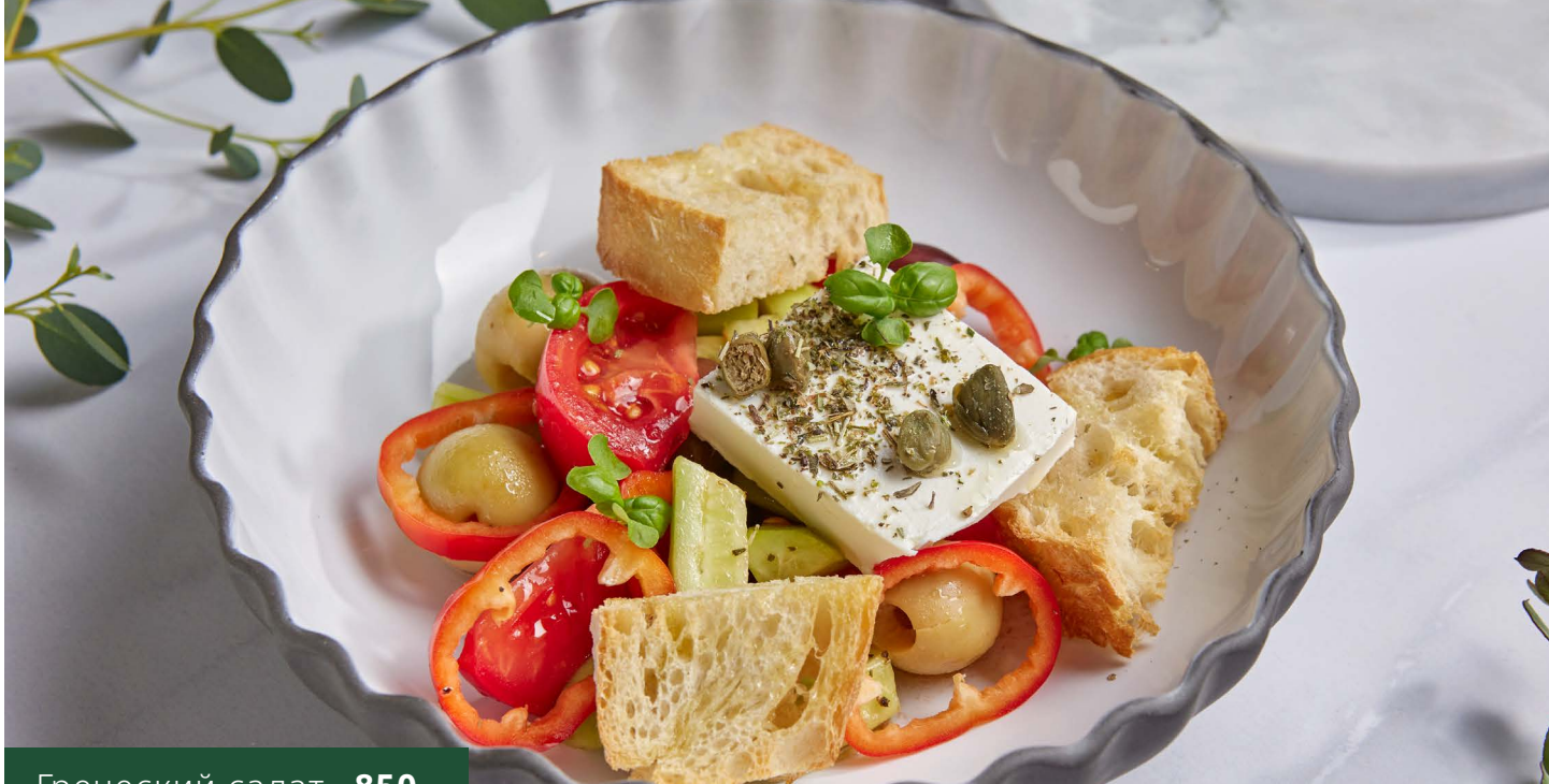
Греческий салат 850.-