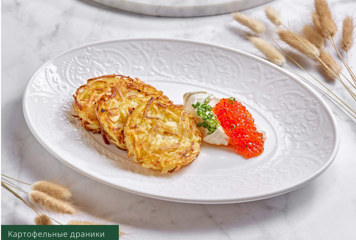
Картофельные драники с красной икрой 890.-