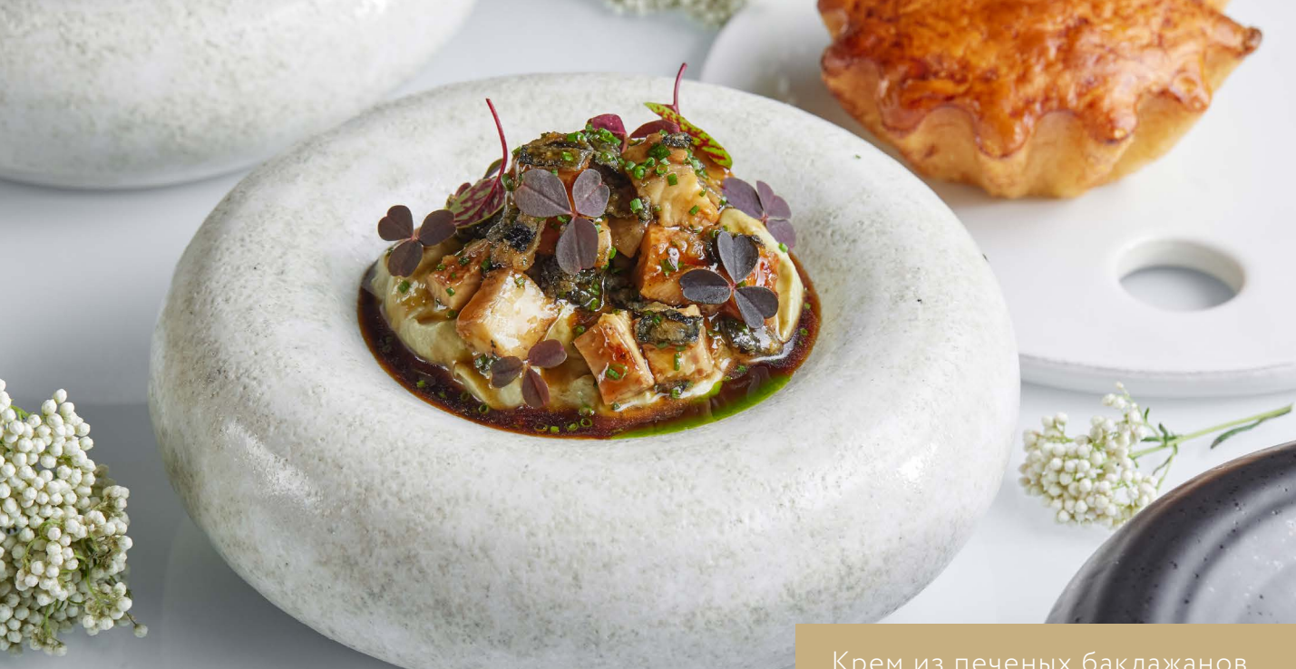
Крем из печеных баклажанов с угрем унаги 790.-