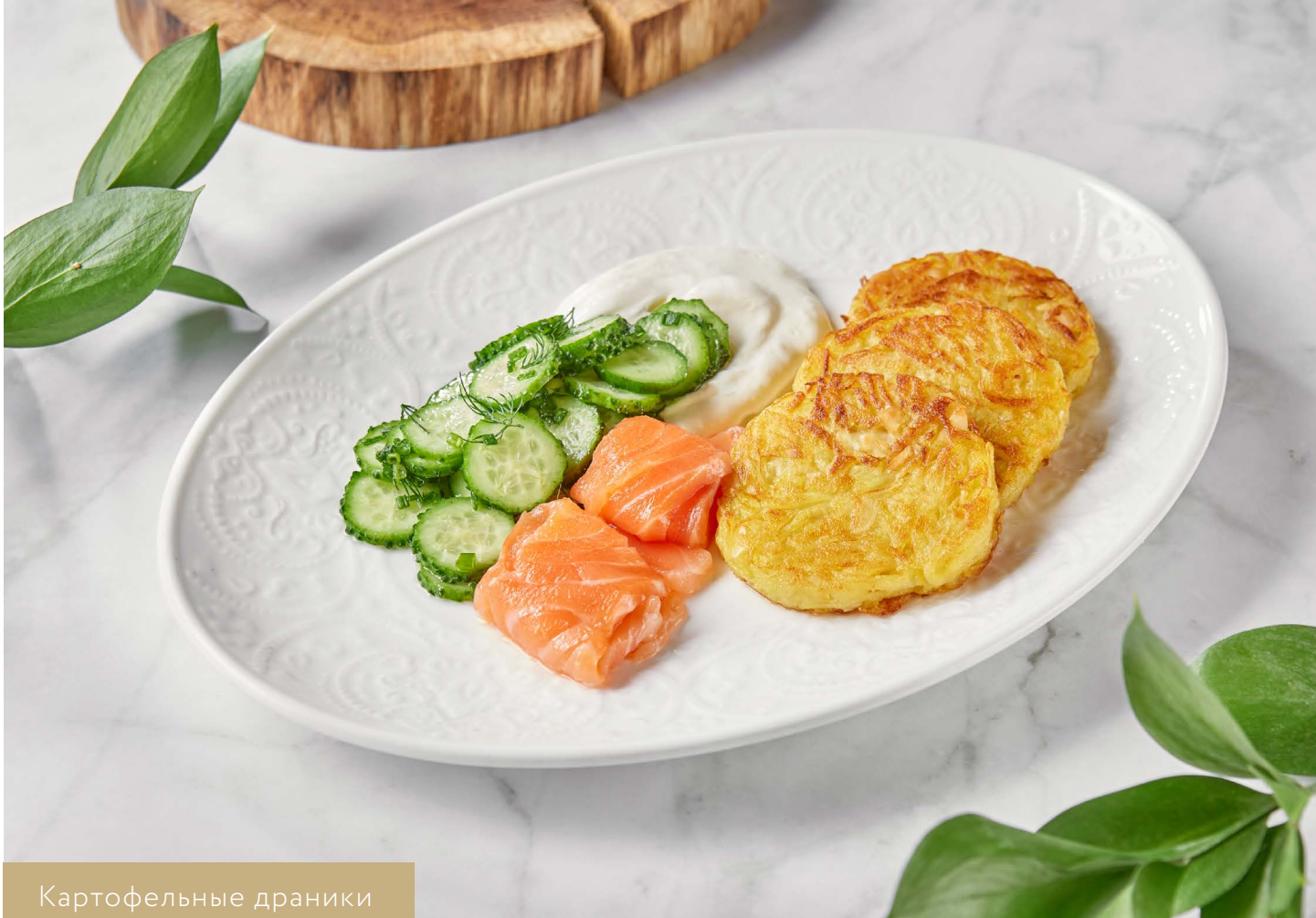
Картофельные драники с лососем 950.-