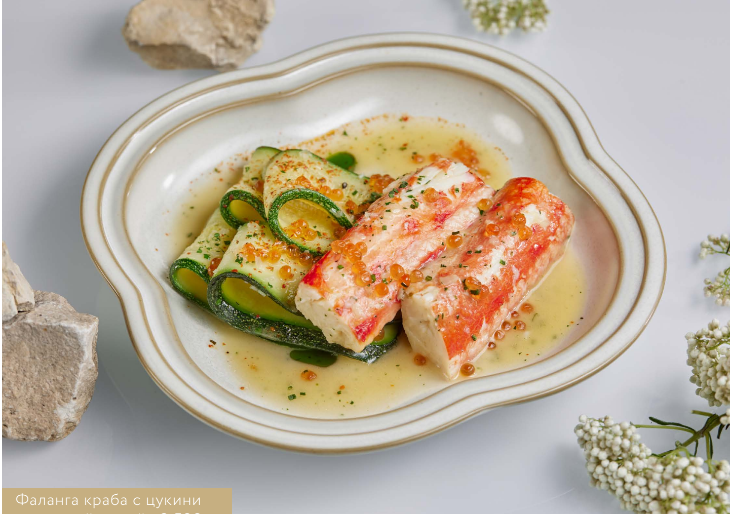
Фаланга краба с цукини и красной икрой 2 500.-