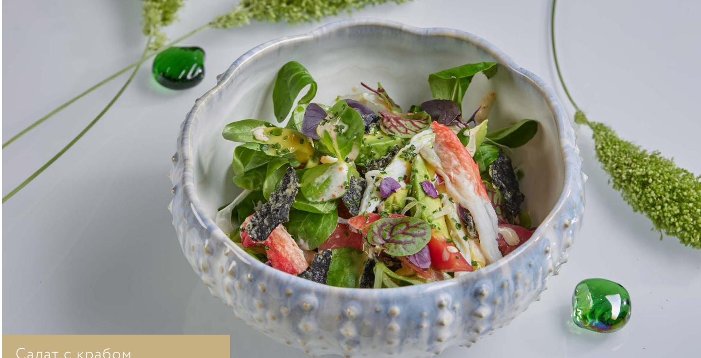
Салат с крабом и соусом манго 1 650.-