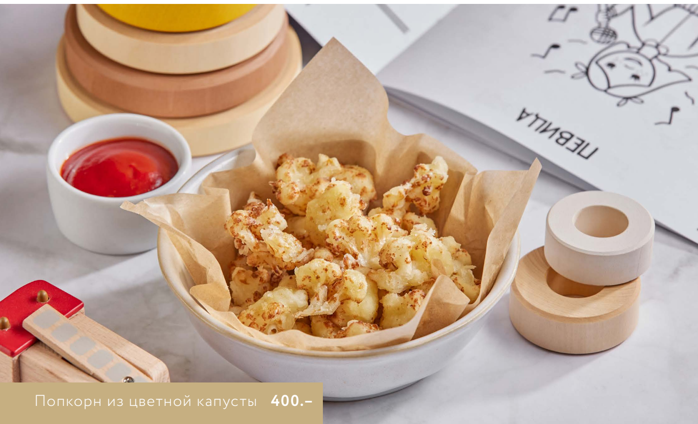
Попкорн из цветной капусты 400.-