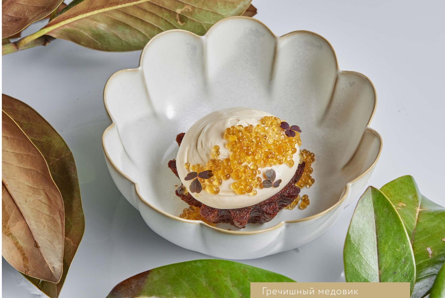
Гречишный медовик со сметанным соусом 600.-