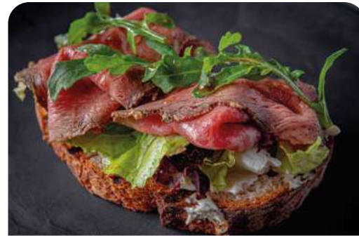
БРУСКЕТТА С РОСТБИФОМ BRUSCHETTA WITH ROAST BEEF

145 г ..... 690 Нежное мясо говяжьих щечек мраморных бычков с салатом «Коул-Слоу» и перцем гриль, авокадо и пармезаном.