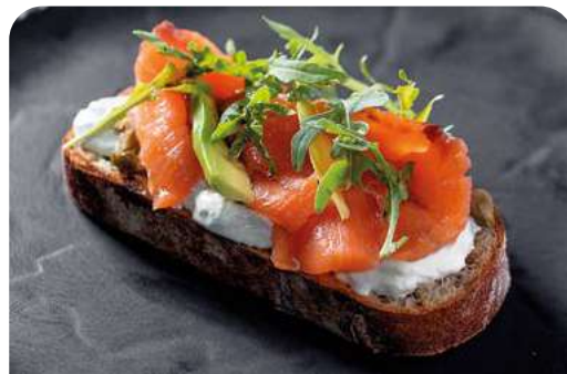
БРУСКЕТТА СО СЛАБОСОЛЕННОЙ СЕМГОЙ BRUSCHETTA WITH LIGHTLY SALTED SALMON

125 г ..... 870 Обжаренный на гриле гречишный хлеб с краб-миксом, сочными томатами и авокадо под медово-горчичным соусом.