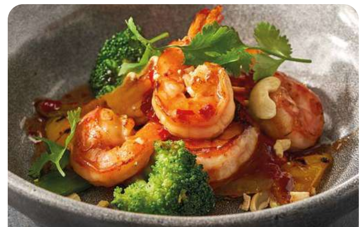
КРЕВЕТКИ В АЗИАТСКОМ СТИЛЕ SHRIMP IN ASIAN STYLE

2 шт./35/30 г ..... 890 Приготовленные в соусе BBQ. С медовым чесноком и карамельным луком. Подаются с пряным соусом и бездрожжевым хлебом.