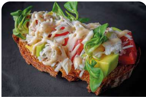
БРУСКЕТТА С КРАБОМ BRUSCHETTA WITH CRAB

125 г ..... 870 Обжаренный на гриле гречишный хлеб с краб-миксом, сочными томатами и авокадо под медово-горчичным соусом.