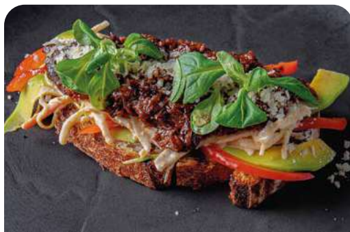
БРУСКЕТТА С ТОМЛЕННОЙ ГОВЯДИНОЙ BRUSCHETTA WITH STEWED BEEF

BRUSCHETTA WITH TOMATOES AND STRACATELLA 125 г ..... 590 Сладкие томаты со страчателлой, соусами песто и бальзамик на гречишном хлебе.