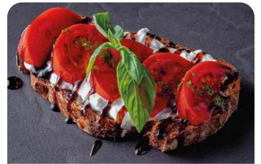
БРУСКЕТТА С ТОМАТАМИ И СТРАЧАТЕЛЛОЙ

130 г ..... 790 Семга со страчателлой, авокадо и каперсами на гречишном хлебе.