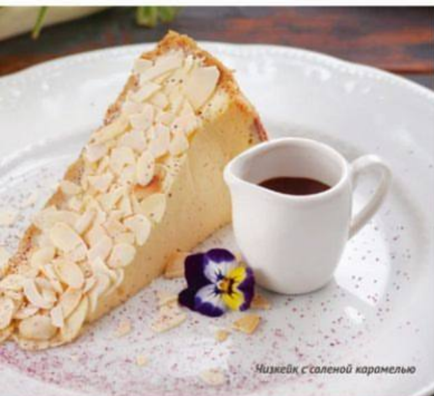
Чизкейк с соленой карамелью