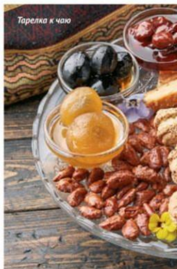
Тарелка к чаю