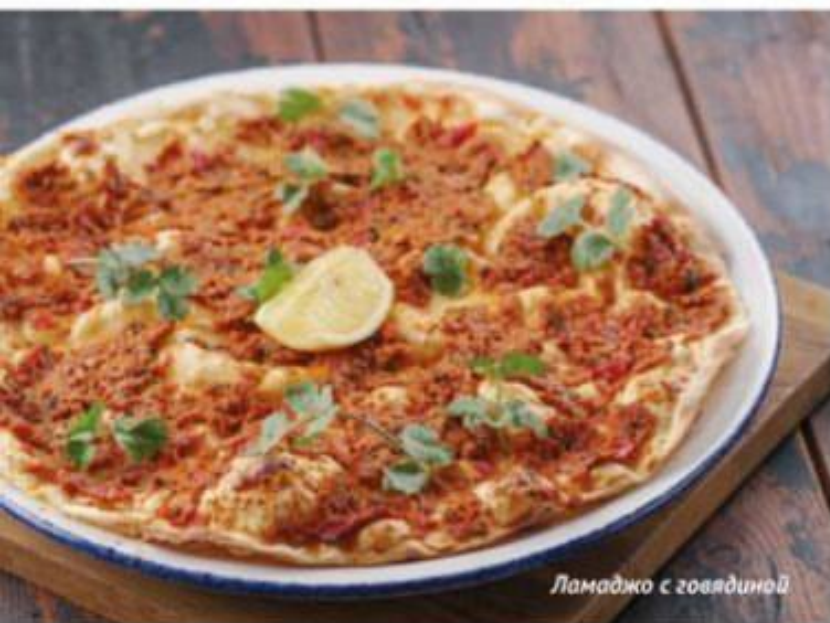
Ламаджо с говядиной