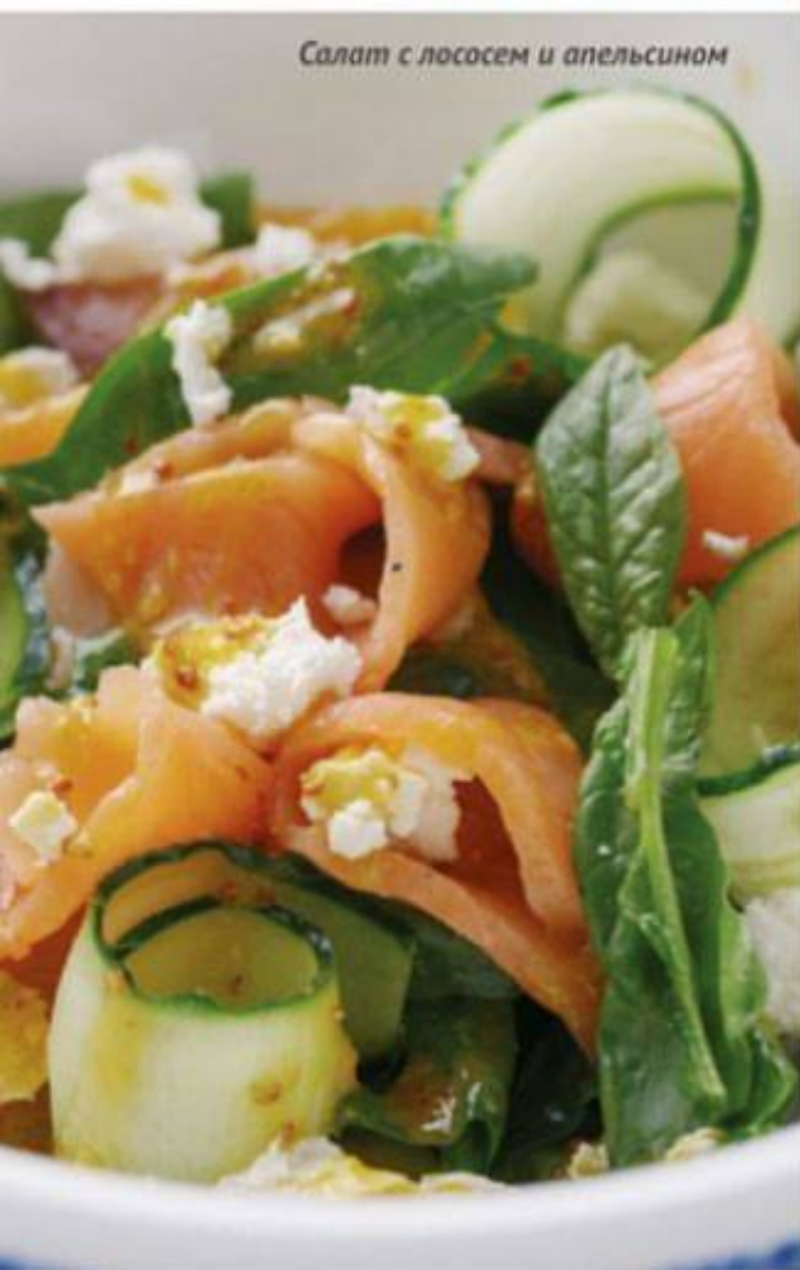
Салат с лососем и апельсином