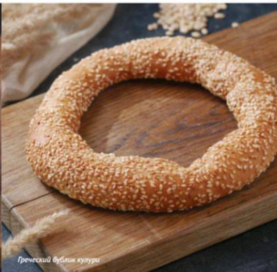
Греческий бублик кулур