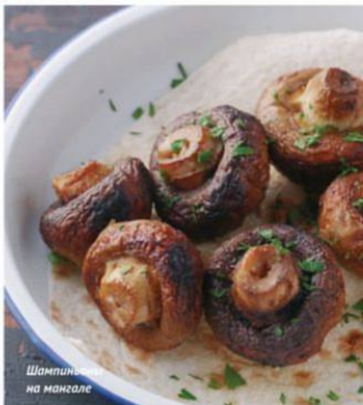
Шампиньоны на мангале