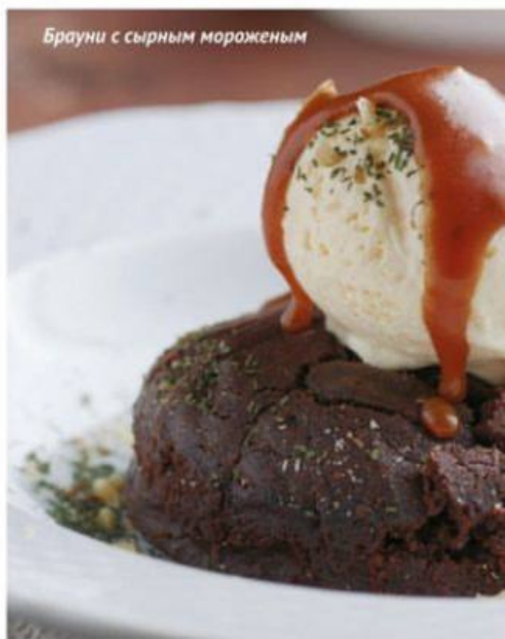
Брауни с сырным мороженым