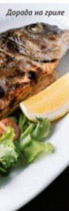
Дорада на гриле