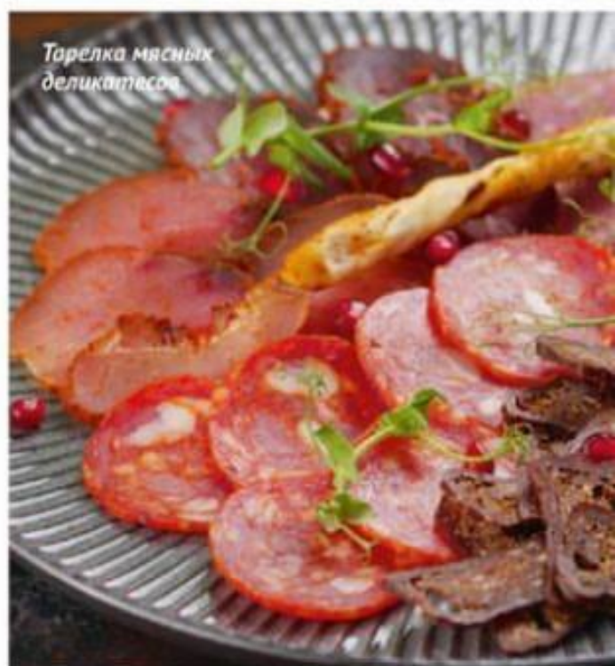
Тарелка мясных деликатесов