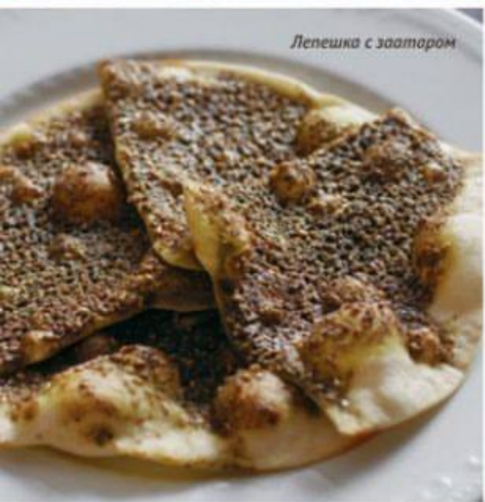
Лепешка с заатаром