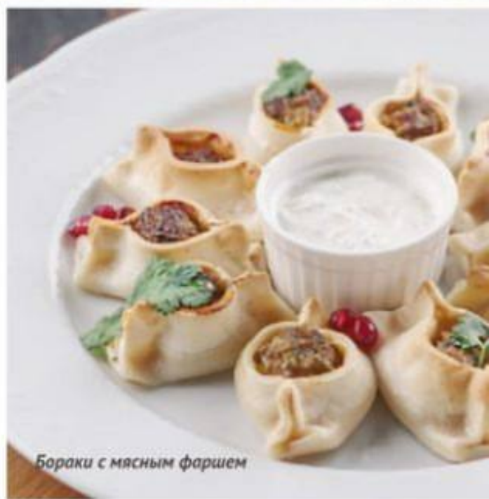
Бораки с мясным фаршем

Подаём со сметанно-чесночным соусом 120/30г | 320.-