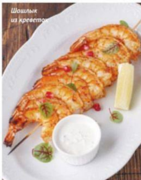
Шашлык из креветок