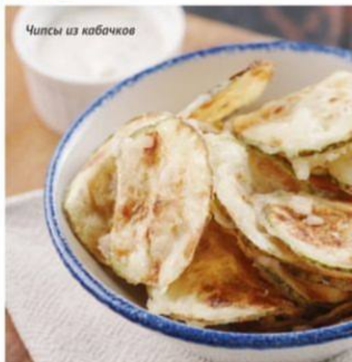
Чипсы из кабачков