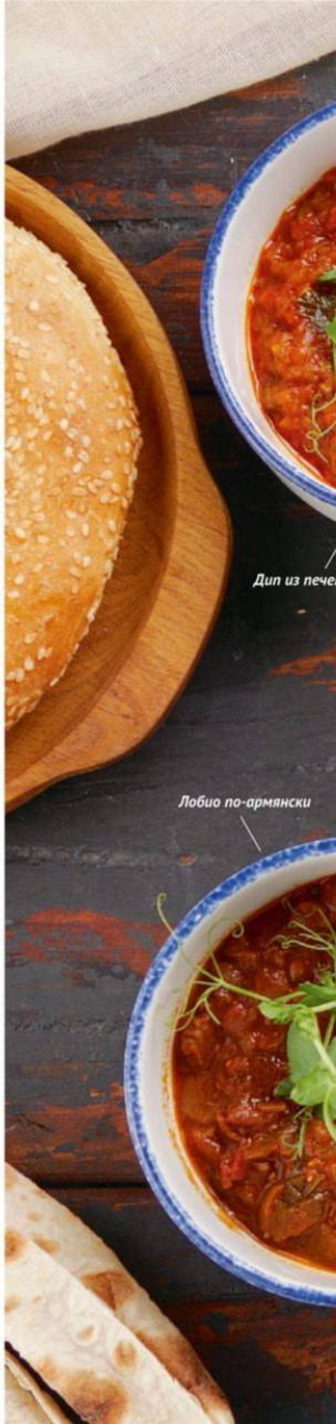
Дип из печёных овощей