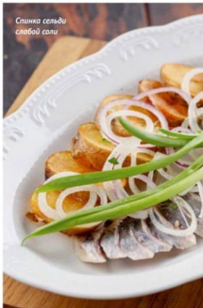
Спинка сельди слабой соли