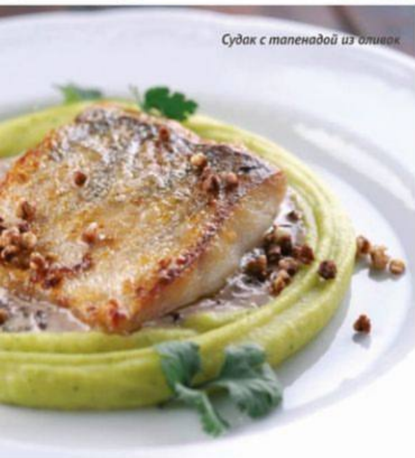
Судак с тапенадой из оливок