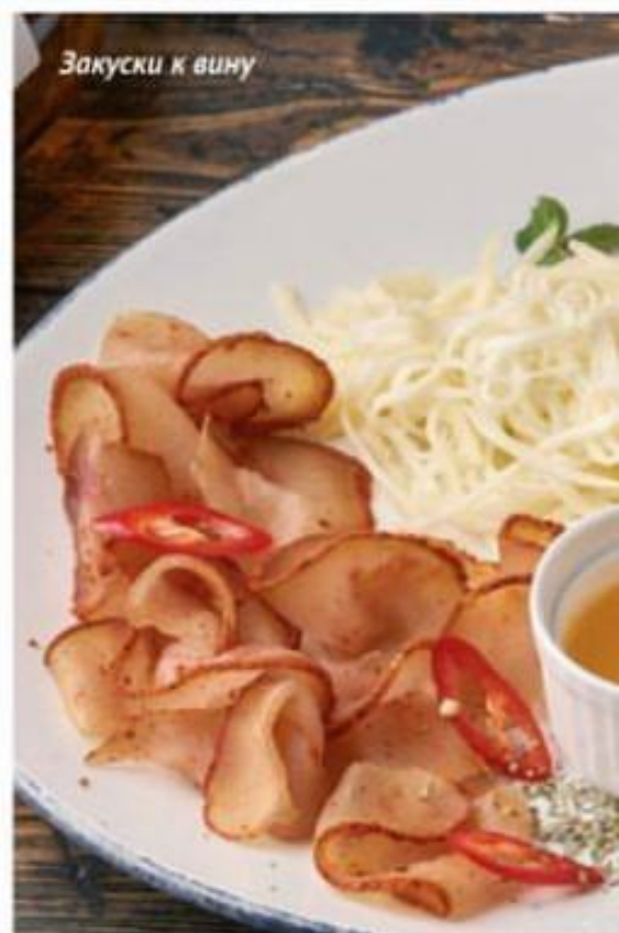
Закуски к вину