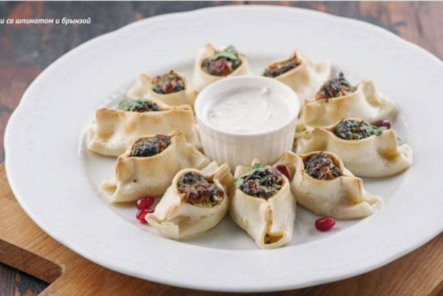
Бораки со шпинатом и брынзой