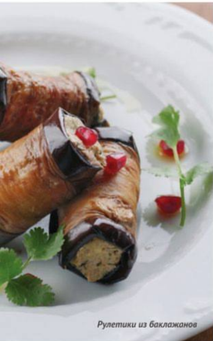
Рулетики из баклажанов