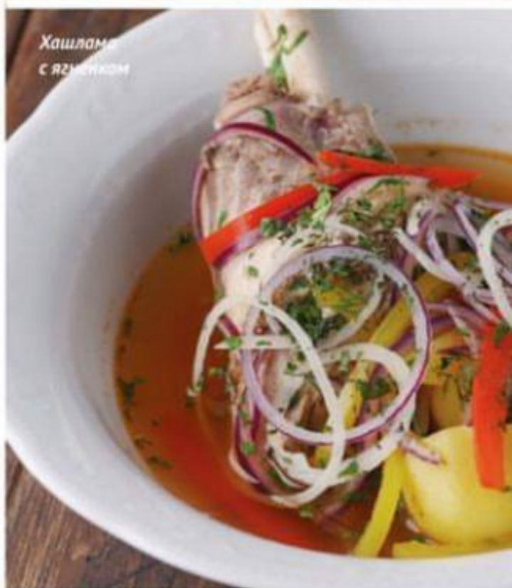
Хашлама с ягнёнком