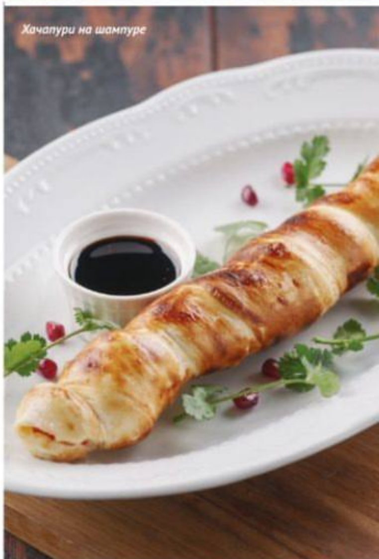
Хачапури на шампуре