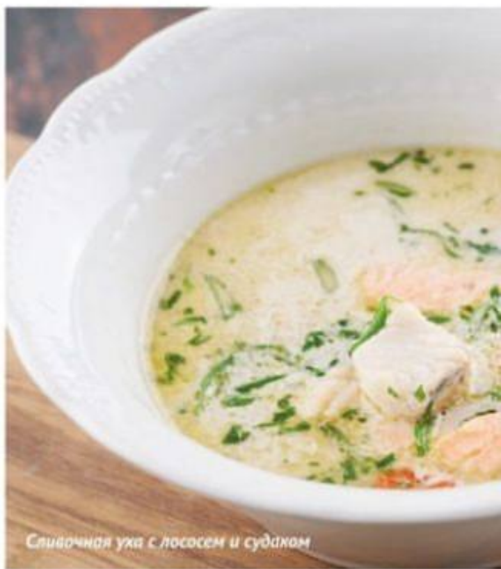
Сливочная уха с лососем и судаком