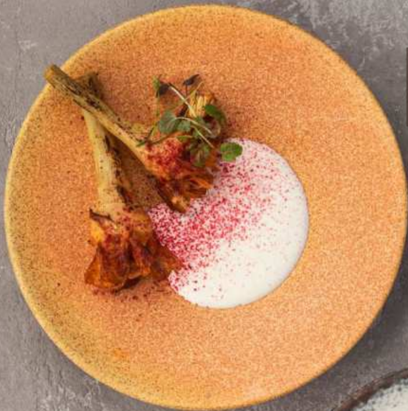
Жареный артишок с муссом из пармезана 800