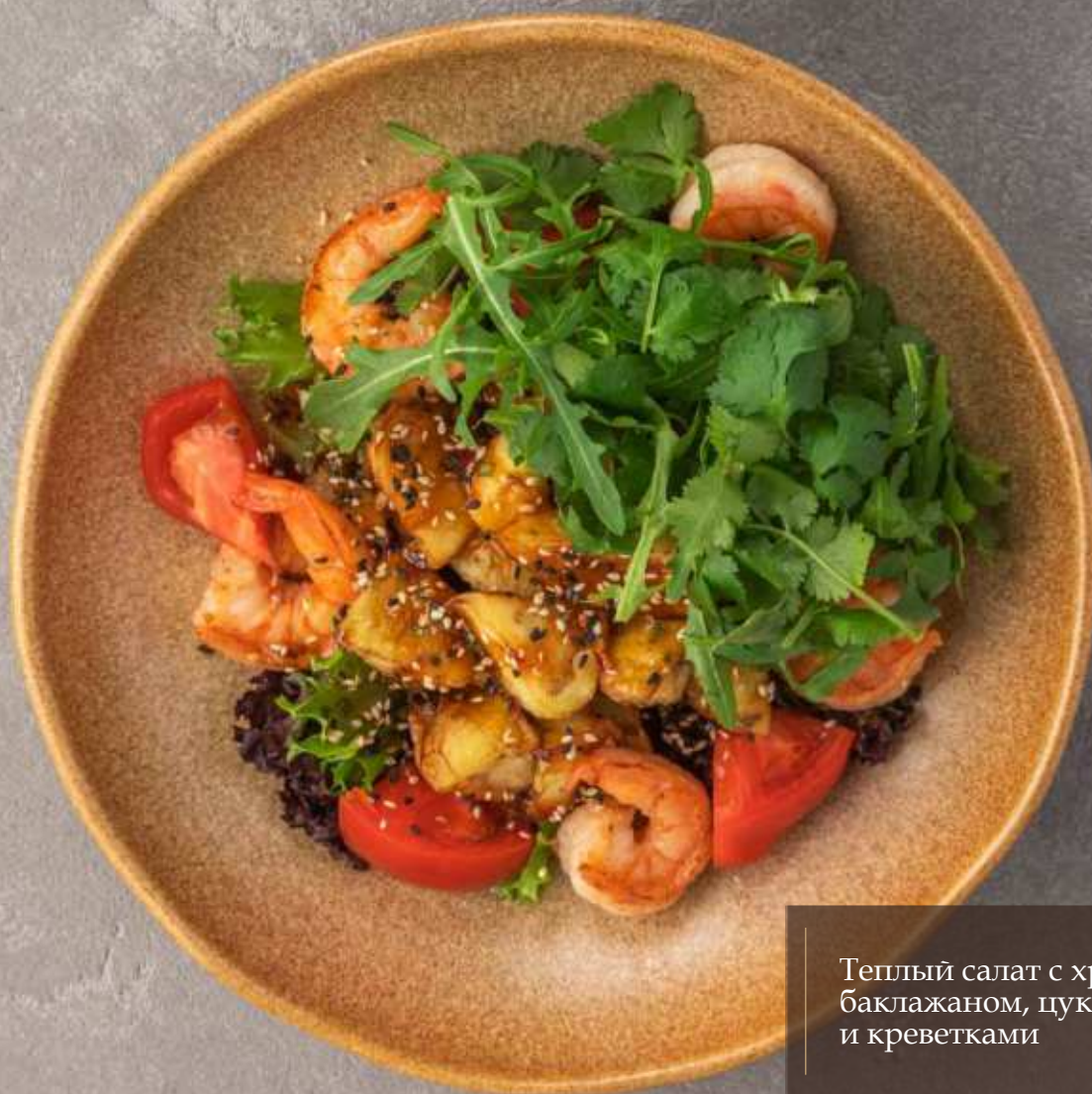
Теплый салат с хрустящим баклажаном, цукини и креветками 1200