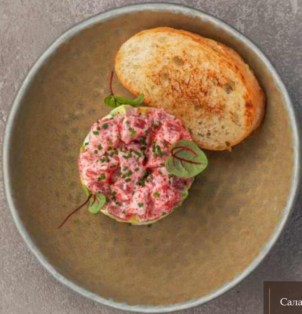
Салат с тунцом и авокадо 990