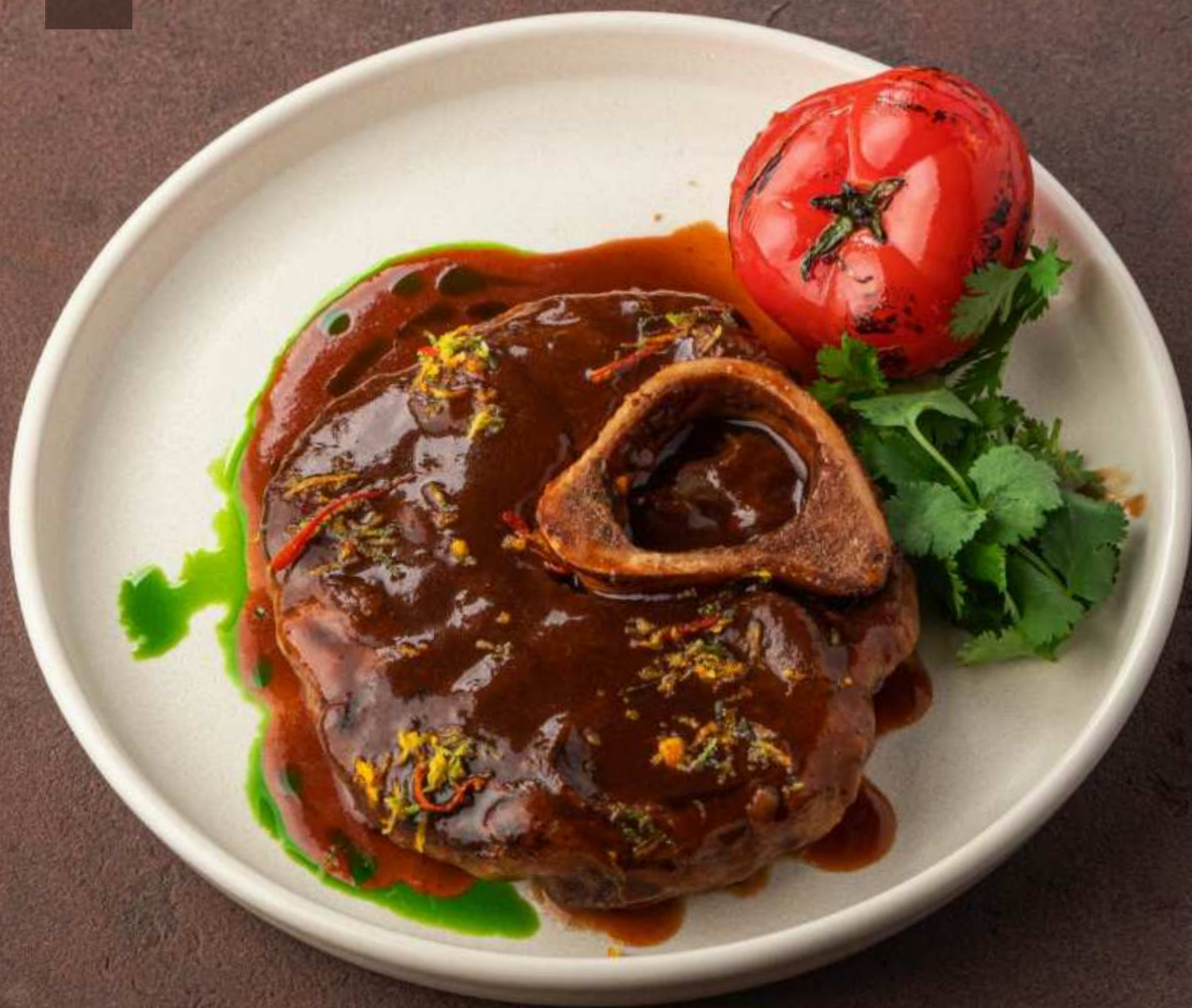
Оссобуко в винно-перечном соусе с печеным томатом и цитрусовой гремолатой 3100