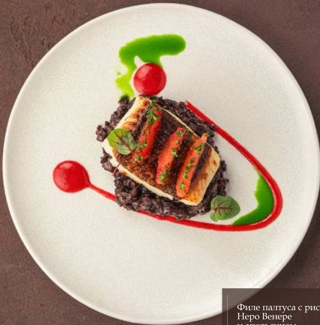
Филе палтуса с рисом Неро Венере и апельсином