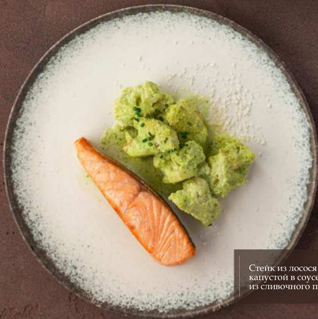
Стейк из лосося с цветной капустой в соусе из сливочного песто 2500