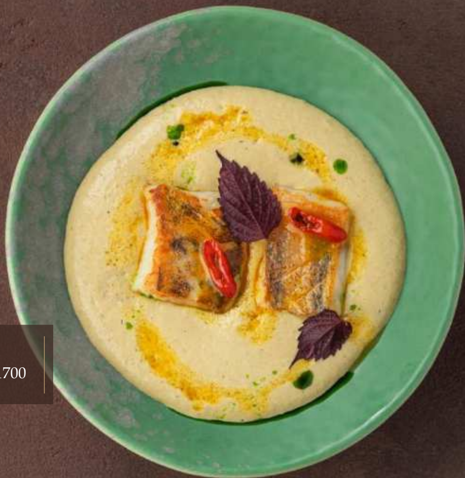
Судак с муссом из печеного лука-порей 1700