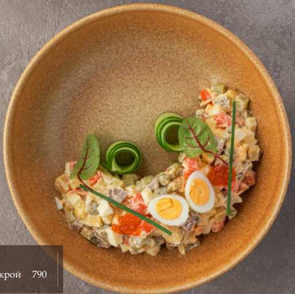
Оливье с телячьим языком и красной икрой 790