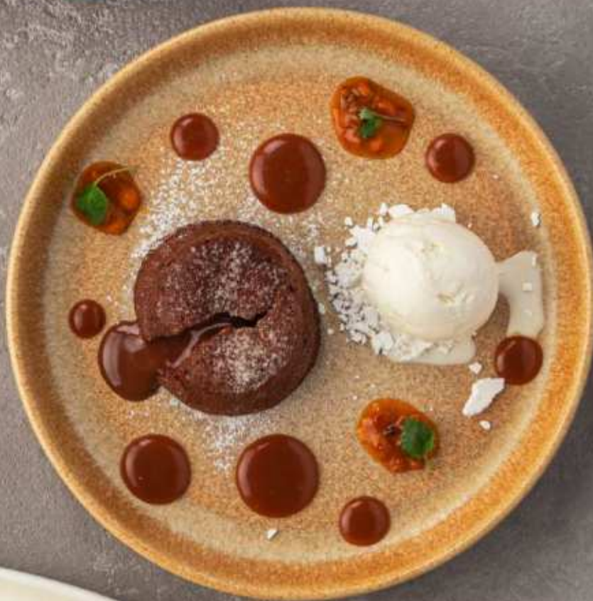
Шоколадный фондан 560