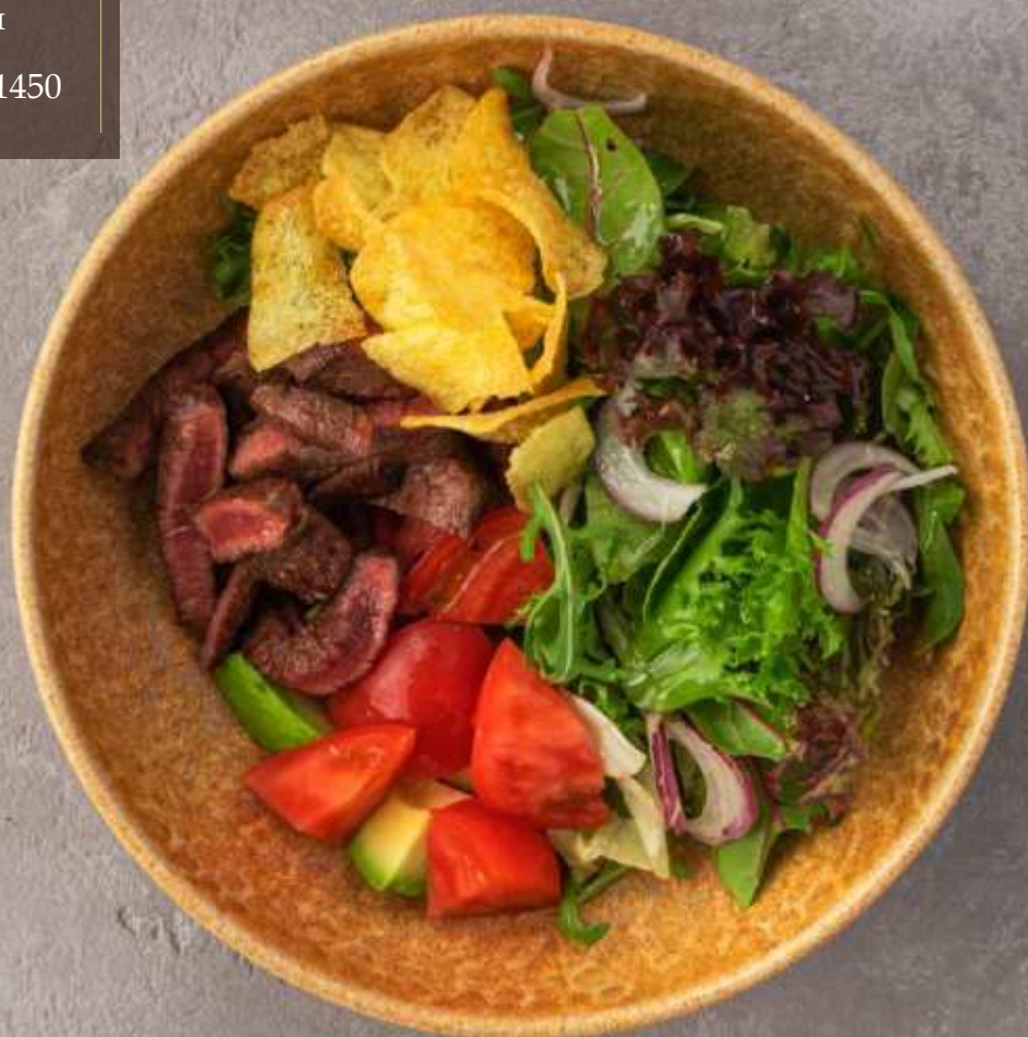
Теплый салат с мраморной говядиной и ореховым соусом 1450