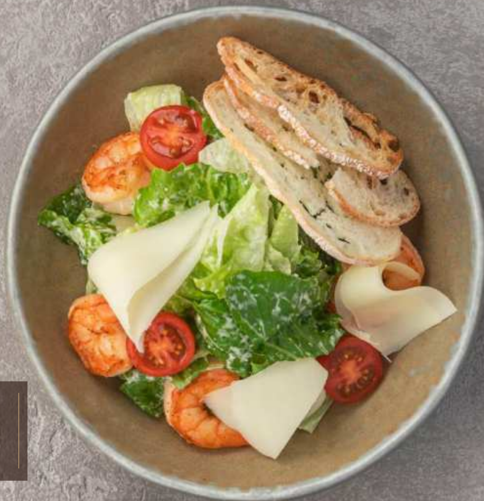
Салат Цезарь с куриной грудкой / тигровыми креветками 850 / 1000