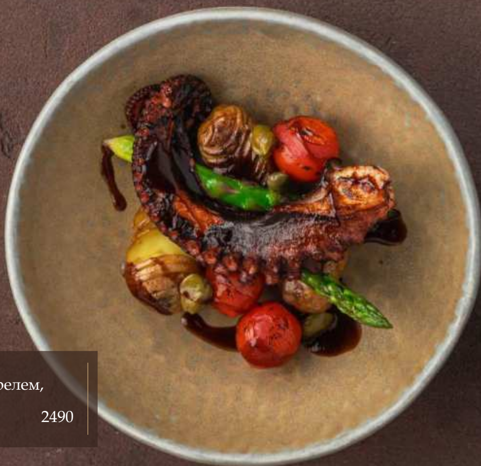
Осьминог с беби-картофелем, зеленой спаржей и помидорами черри