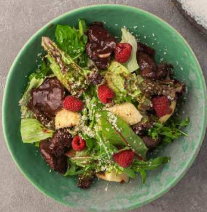
Салат с куриной печенью и грушей в малиновом соусе