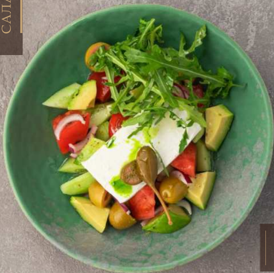
Овощной салат с брынзой и оливками 880