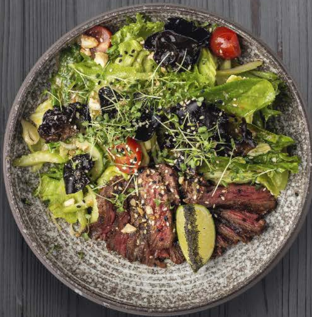
СТЕЙК САЛАТ С КЕШЬЮ И ГРИБАМИ МУЭР / STEAK SALAD WITH CASHEWS AND MUSHROOMS MUER 640, - 280G