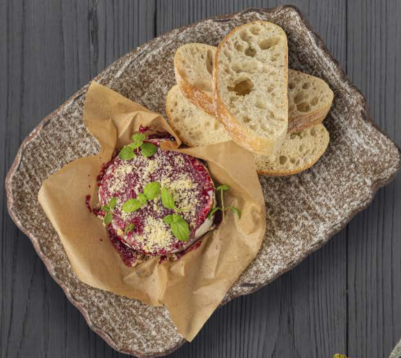
ПЕЧЁНЫЙ КАММБЕР В ГЛАЗУРИ ИЗ КОПЧЁНОЙ МАЛИНЫ / BAKED CAMEMBERT IN SMOKED RASPBERRY GLAZE 650, - 240G