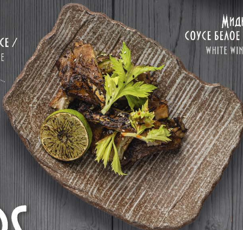
СВИНЫЕ РЁБРА ЗАПЕЧЁНЫЕ В ЯБЛОЧНОМ СОУСЕ / PORK RIBS BAKED IN APPLE SAUCE 650, - 320G