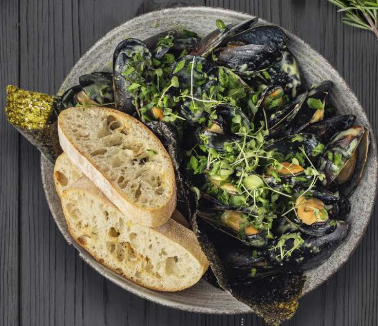
МИДИИ ТОМАЁНЫЕ В СОУСЕ БЕЛОЕ ВИНО / MUSSELS STEWED IN WHITE WINE SAUCE - 950, - 750G