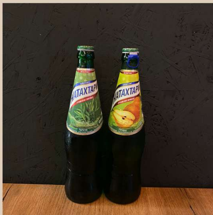
1 ЛИМОНАД В АССОРТИМЕНТЕ