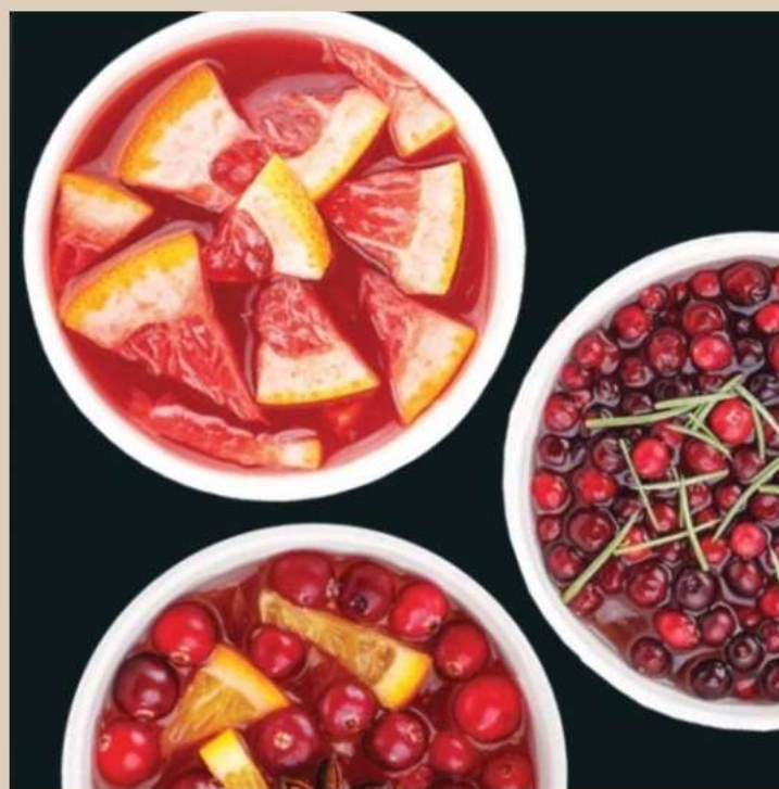
2. ЧАЙ КРАФТОВЫЙ В АССОРТИМЕНТЕ