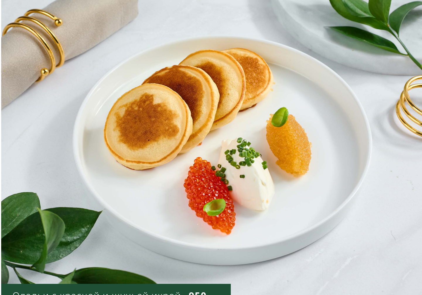
Оладьи с красной и щучьей икрой 950.-