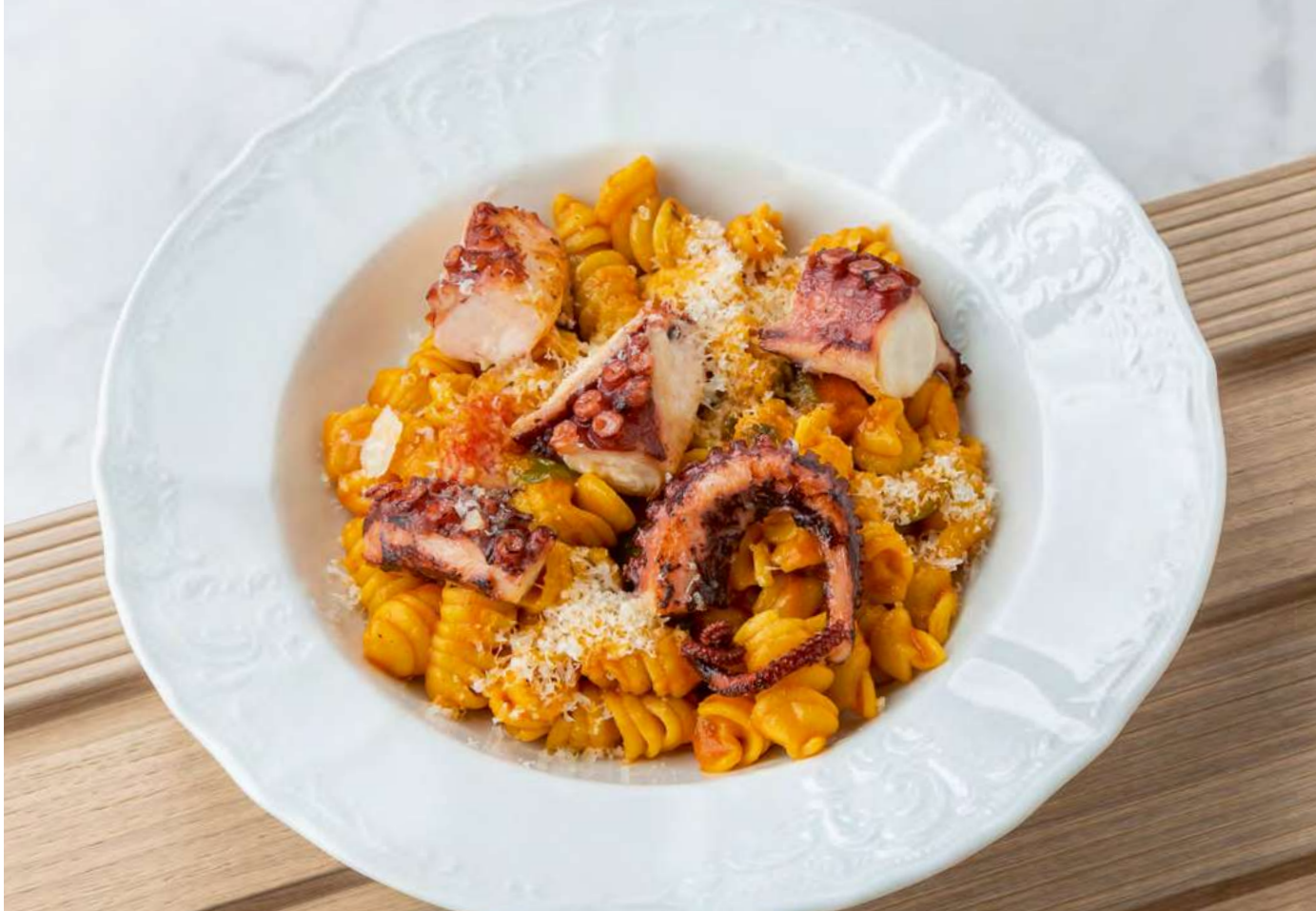
new Паста с осьминогом в неаполитанском соусе _____ 2100 Pasta with octopus in Neapolitan sauce