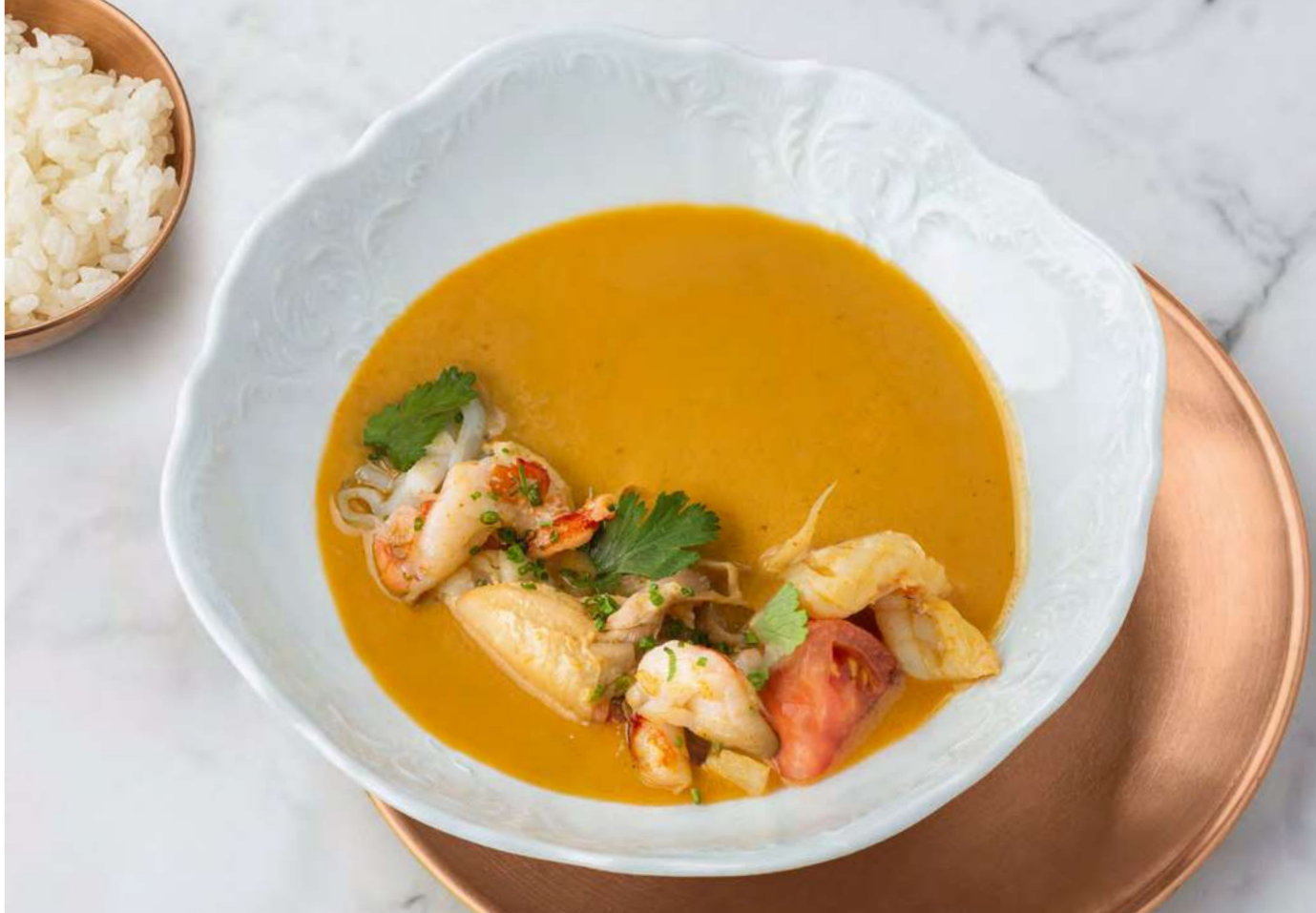
Том ям с кальмаром и креветками _____ 900 Tom yum with squid and shrimps