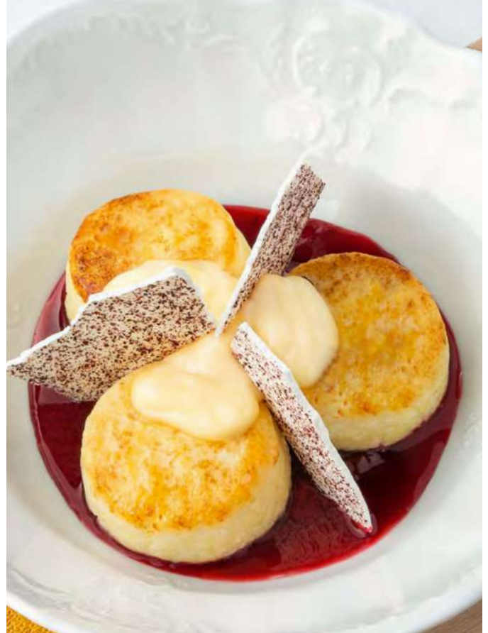
Сырники с вишнёвым конфи и ванильным соусом Cheese pancakes with cherry confit and vanilla sauce 550