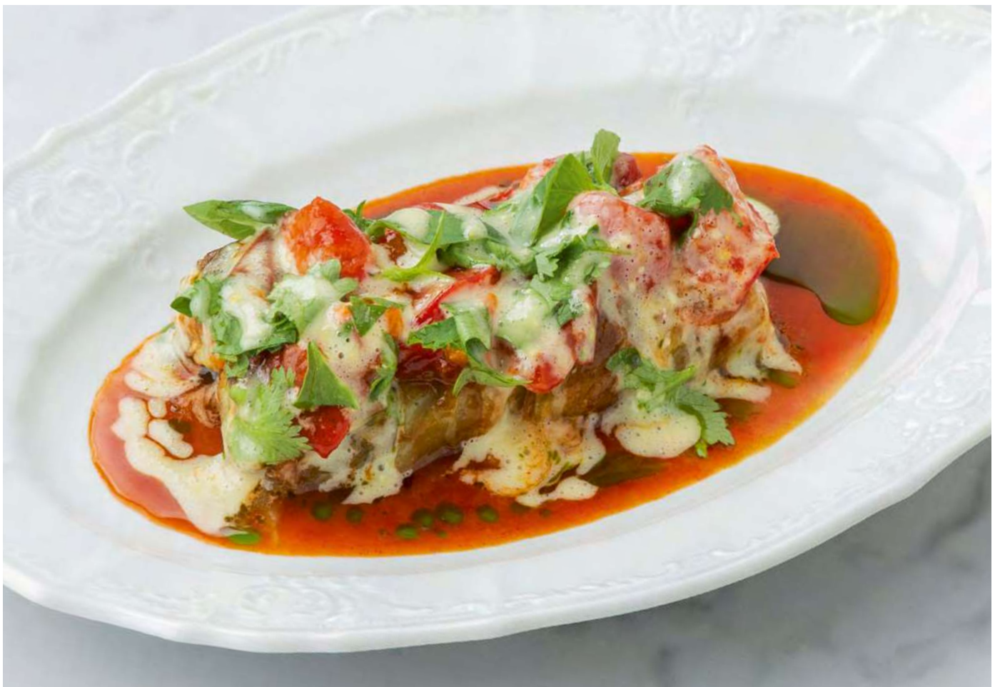
Жареный баклажан со сметаной васаби и томатным кремом _____ 650 Fried eggplant with wasabi sour cream and tomato cream