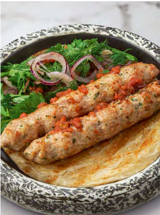
Кебаб из цыплёнка с зеленью и лепёшкой роти Chicken kebab with herbs and roti flatbread