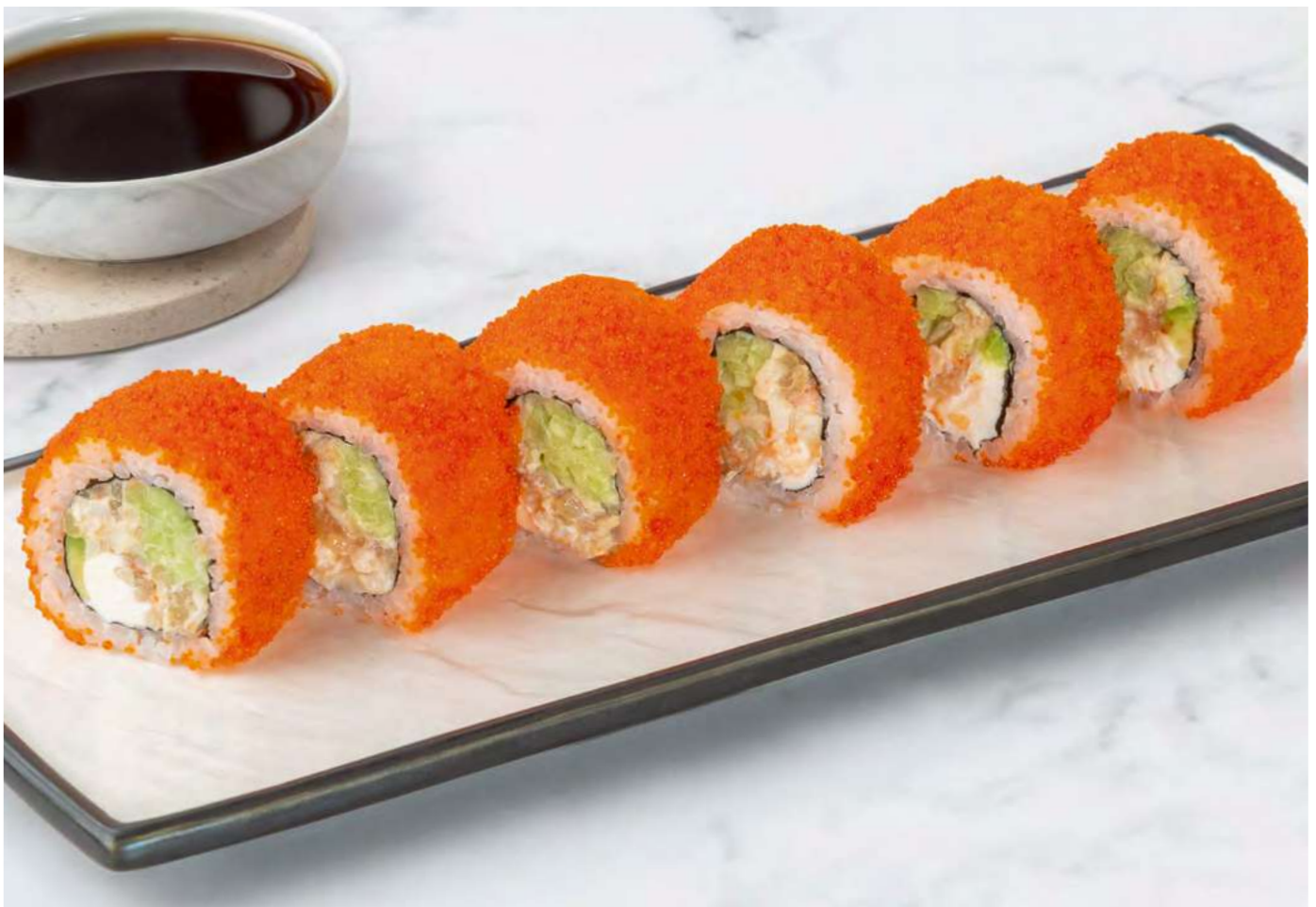
new Калифорния с крабом и креветками _____ 1100 California with crab and shrimps