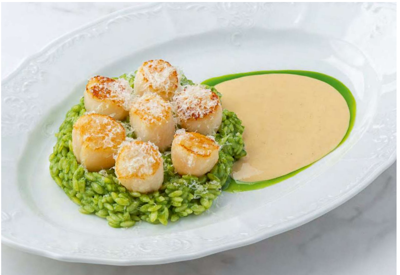
Орзо с гребешками и кремом из цуккини _____ 1100 Orzo with scallops and zucchini cream