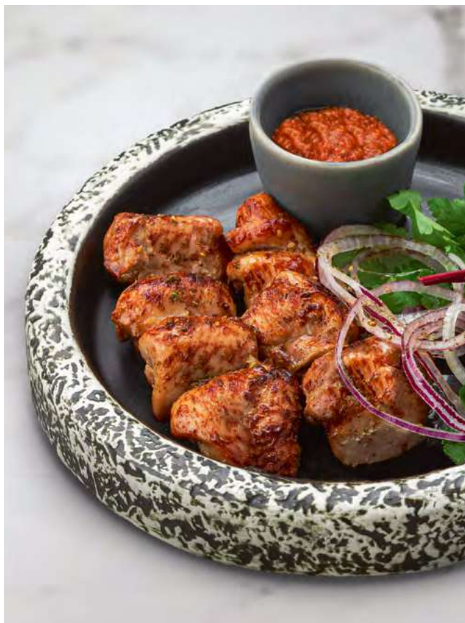
Шашлык из бедра цыплёнка Chicken thigh skewers 700