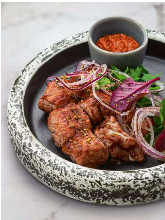
Шашлык из бедра индейки Turkey thigh skewers 850