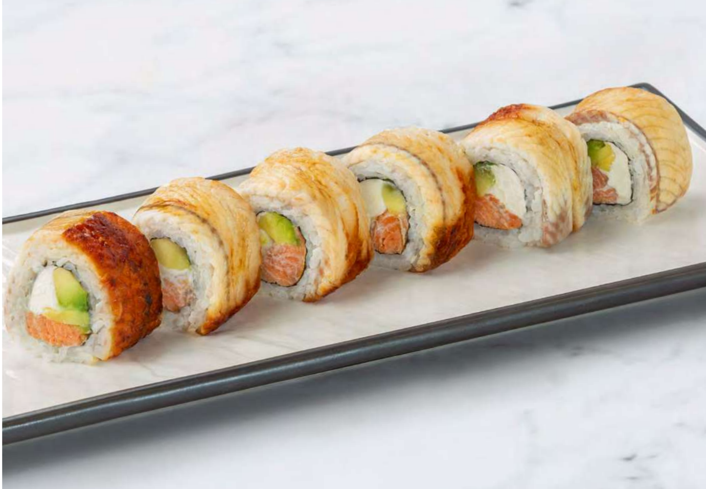
new Ролл с копчёным угрём, лососем и авокадо _____ 950 Roll with smoked eel, salmon and avocado