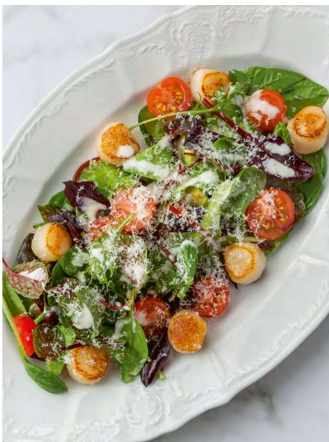
Салат с гребешками и цитрусовым дрессингом Salad with scallops and citrus dressing