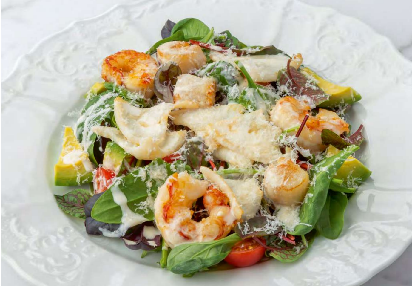
Салат с морепродуктами в сливочном соусе _____ 1200 Salad with seafood in cream sauce