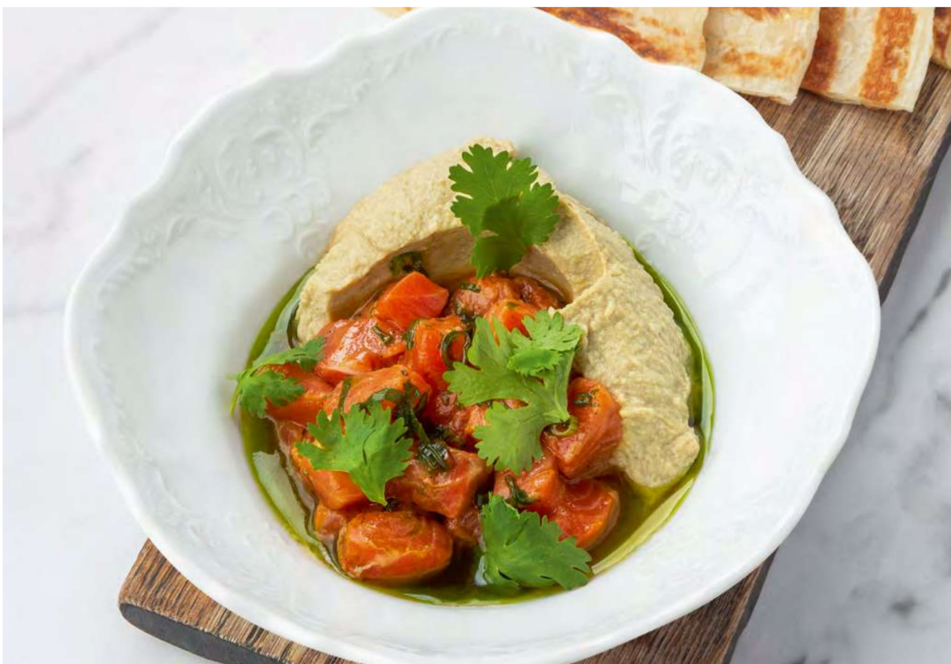
new Хумус из артишоков с маринованной форелью и лепёшкой роти _____ 1200 Artichoke hummus with pickled trout and roti flatbread