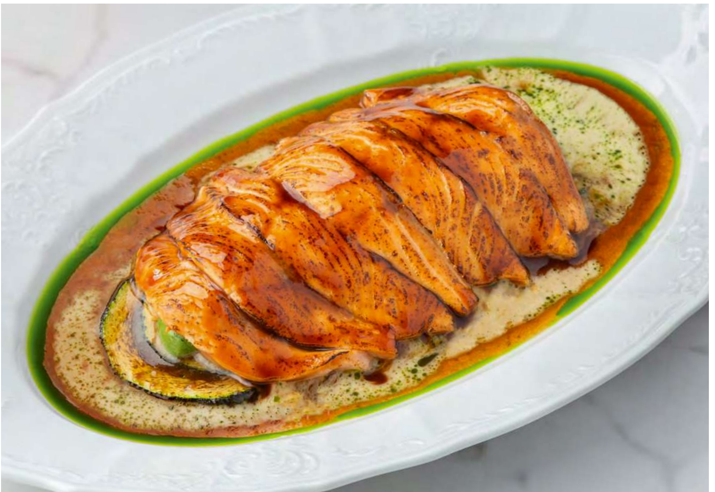
Обождённый лосось с авокадо и цуккини с трюфельным понзу _____ 1450 Pan seared salmon with avocado, zucchini and truffle ponzu