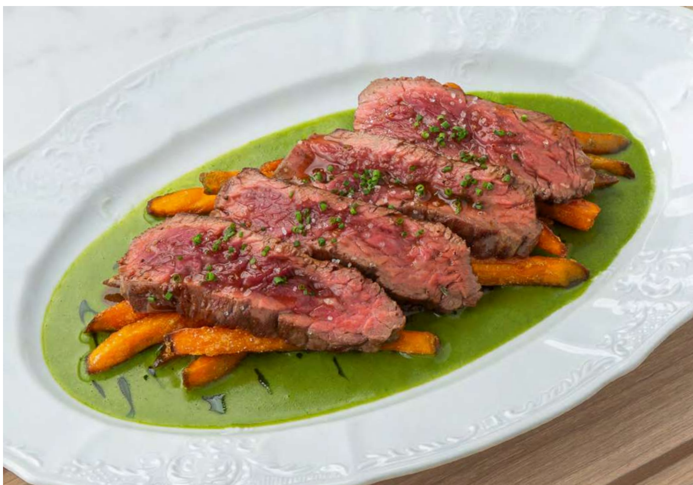
Тальята из говядины с каперсами и соусом из халапеньо _____ 1400 Beef tagliata with capers and jalapeno sauce