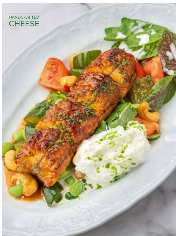
Салат с угрём, страчателлой и битыми огурцами Salad with eel, stracciatella and crushed cucumbers