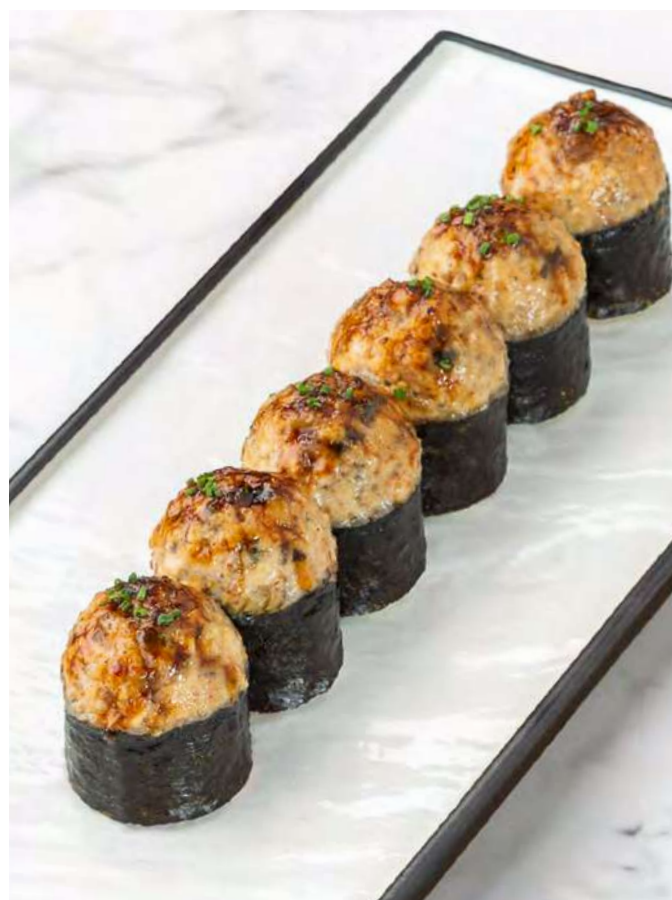
Тёплый ролл с угрём и гребешками Warm roll with eel and scallops 950