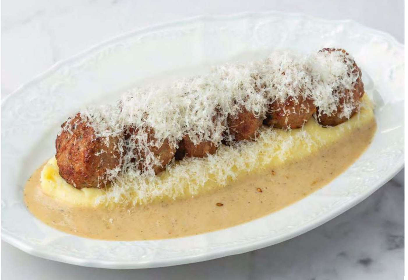
Мини-котлеты из ягнёнка с картофельным пюре _____ 750 Mini lamb cutlets with mashed potatoes