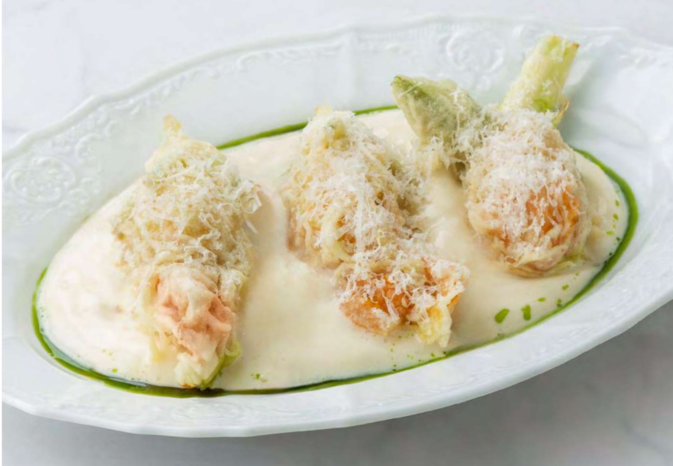
new Цветки цукини с аргентинскими креветками и муссом из пармезана — 1100 Stuffed zucchini flowers with Argentinian shrimps and parmesan mousse