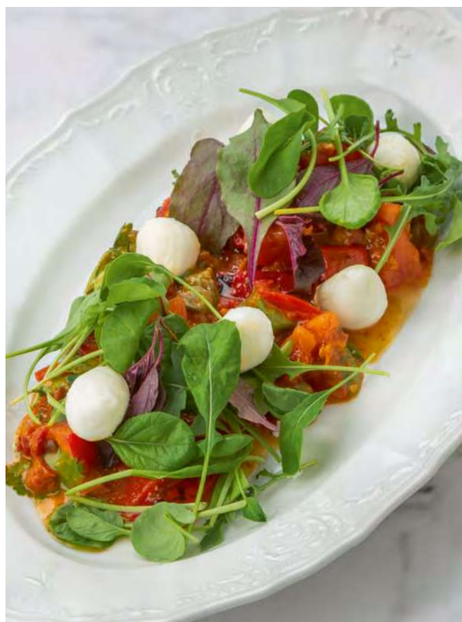
new Салат с печёным перцем рамиро, томатами и моцареллой Salad with baked ramiro pepper, tomatoes and mozzarella