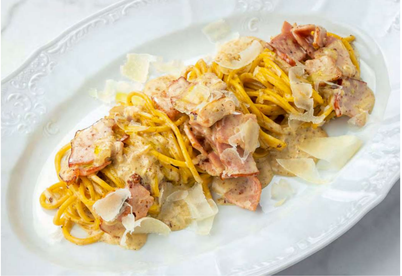
Паста карбонара Carbonara pasta