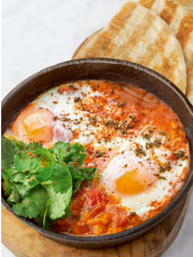
Шакшука с лепёшкой роти Shakshuka and roti flatbread 650