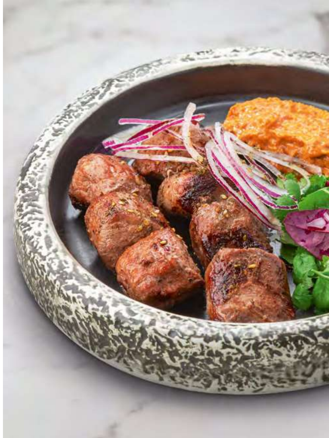
Шашлык из ягнёнка Lamb skewers 1400