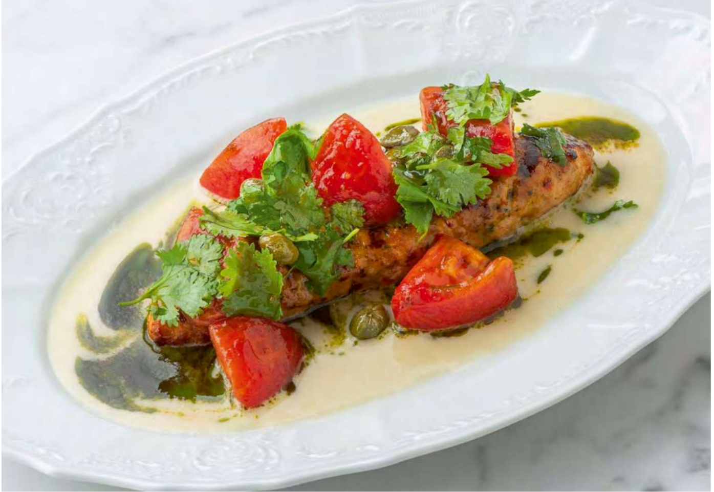
new Котлета из цыплёнка с томатами, каперсами и трюфельным понзу _____ 750 Chicken cutlet with tomatoes, capers and truffle ponzu