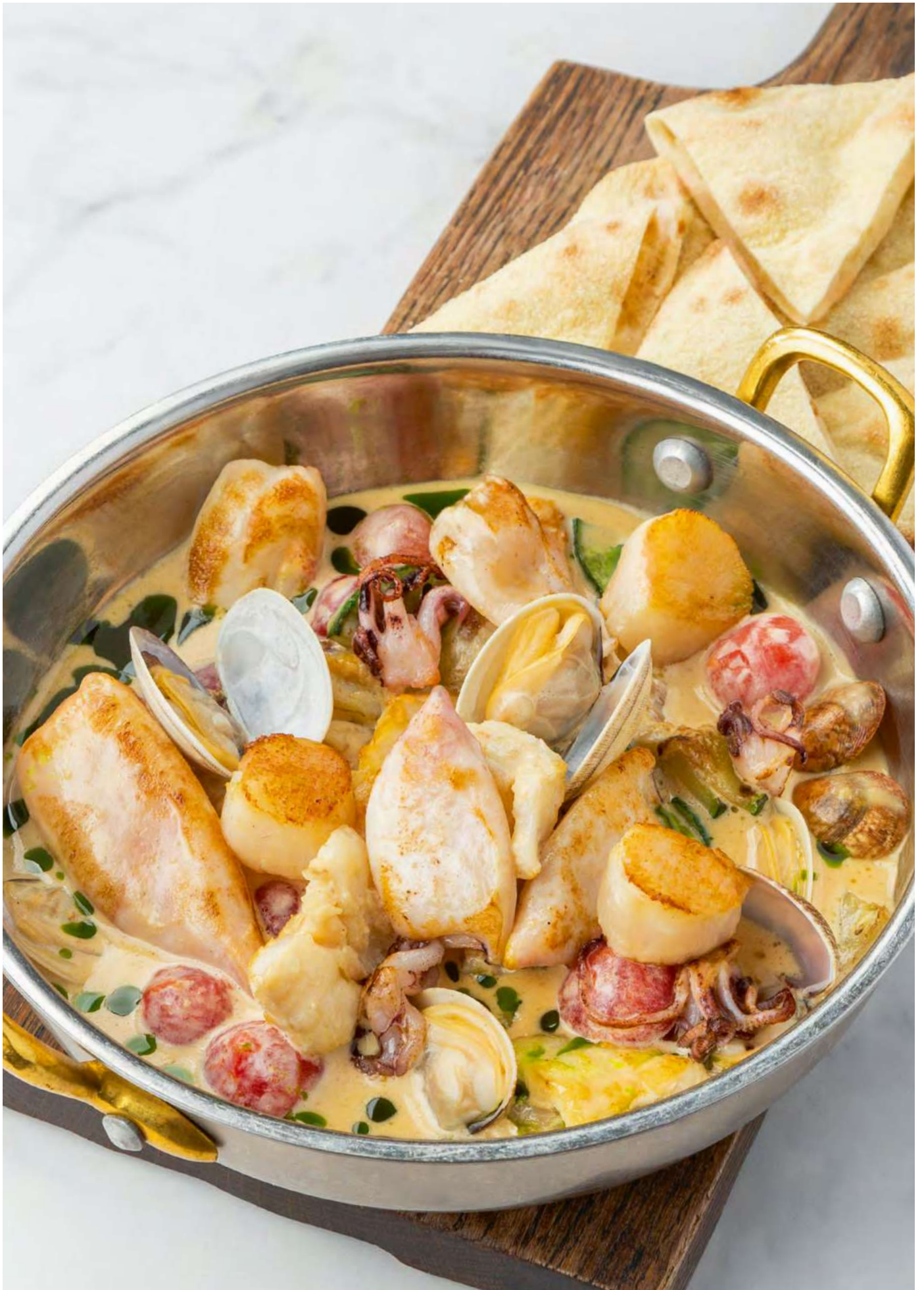
Соте из морепродуктов в соусе из белого вина _____ 1700 Seafood saute with white wine sauce