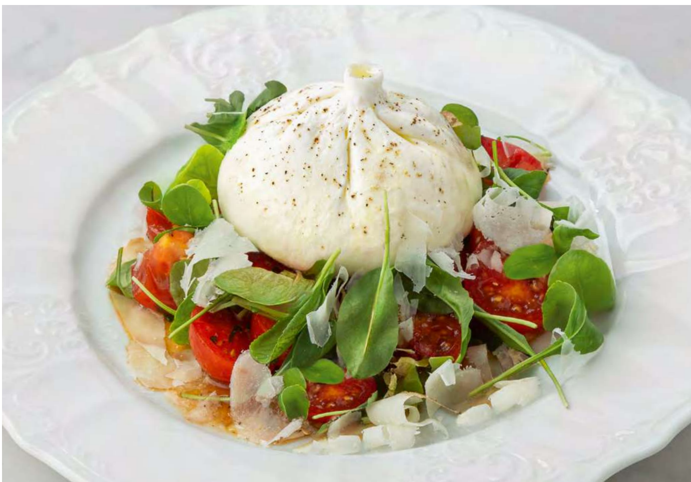
new Капрезе с бурратой _____ 850 Caprese with burrata