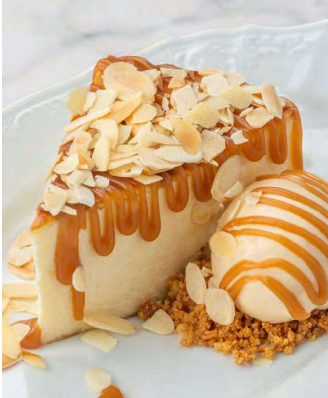
Чизкейк с мороженым из ряженки и соусом солёная карамель Cheesecake with fermented baked milk ice cream and salted caramel sauce 550