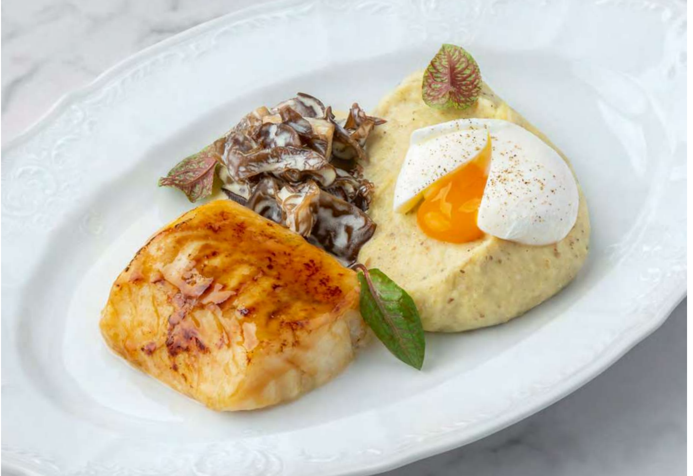
Треска с трюфельным пюре, сезонными грибами и яйцом пашот _____ 1100 Cod with truffle puree, seasonal mushrooms and poached egg