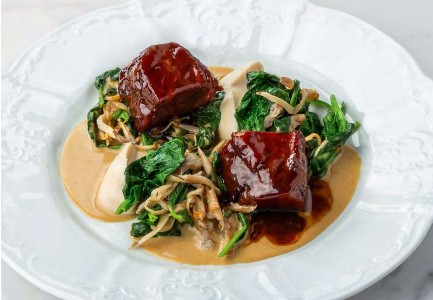
Телячы щёчки с соусом из зелёного перца _____ 1100 Veal cheeks with green pepper sauce