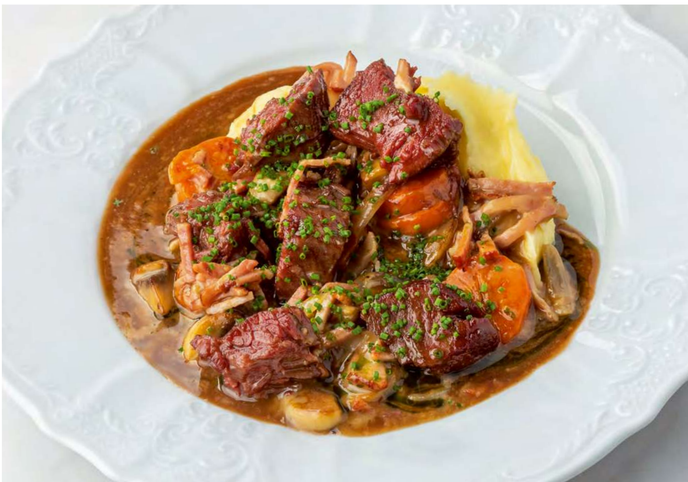
Говядина по-бургундски с картофельным пюре и пармезаном _____ 1050 Beef Bourguignon with mashed potatoes and parmesan