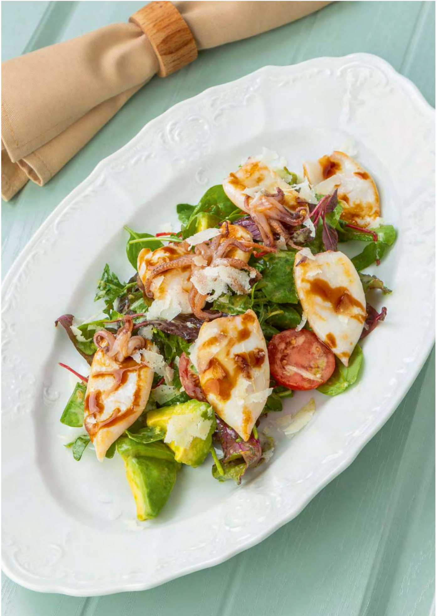
new Салат с мини-кальмарами, руколой и авокадо _____ 950 Salad with mini squid, arugula and avocado