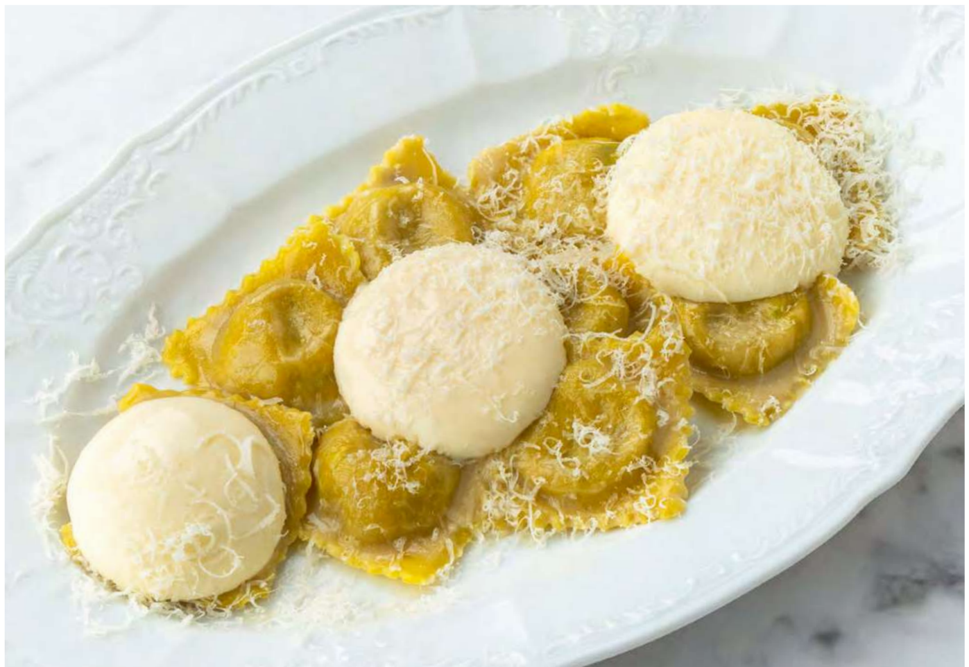
new Равиоли с телячьими щёчками и муссом из пармезана и горгонзолы Veal cheek ravioli and mousse with parmesan and gorgonzola