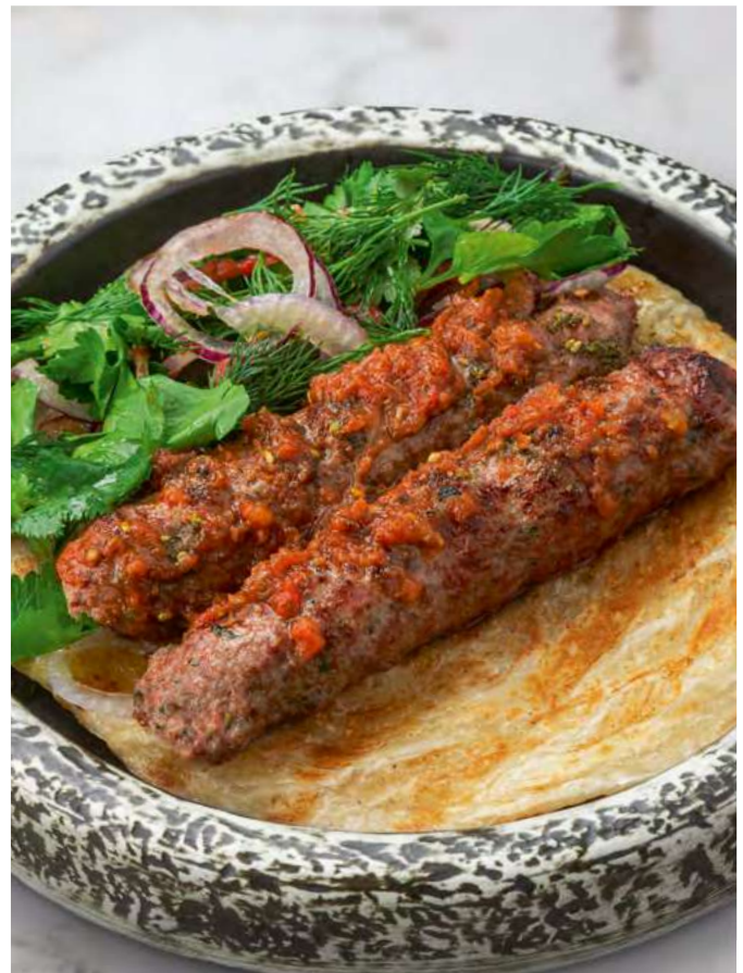
Кебаб из ягнёнка с зеленью и лепёшкой роти Lamb kebab with herbs and roti flatbread