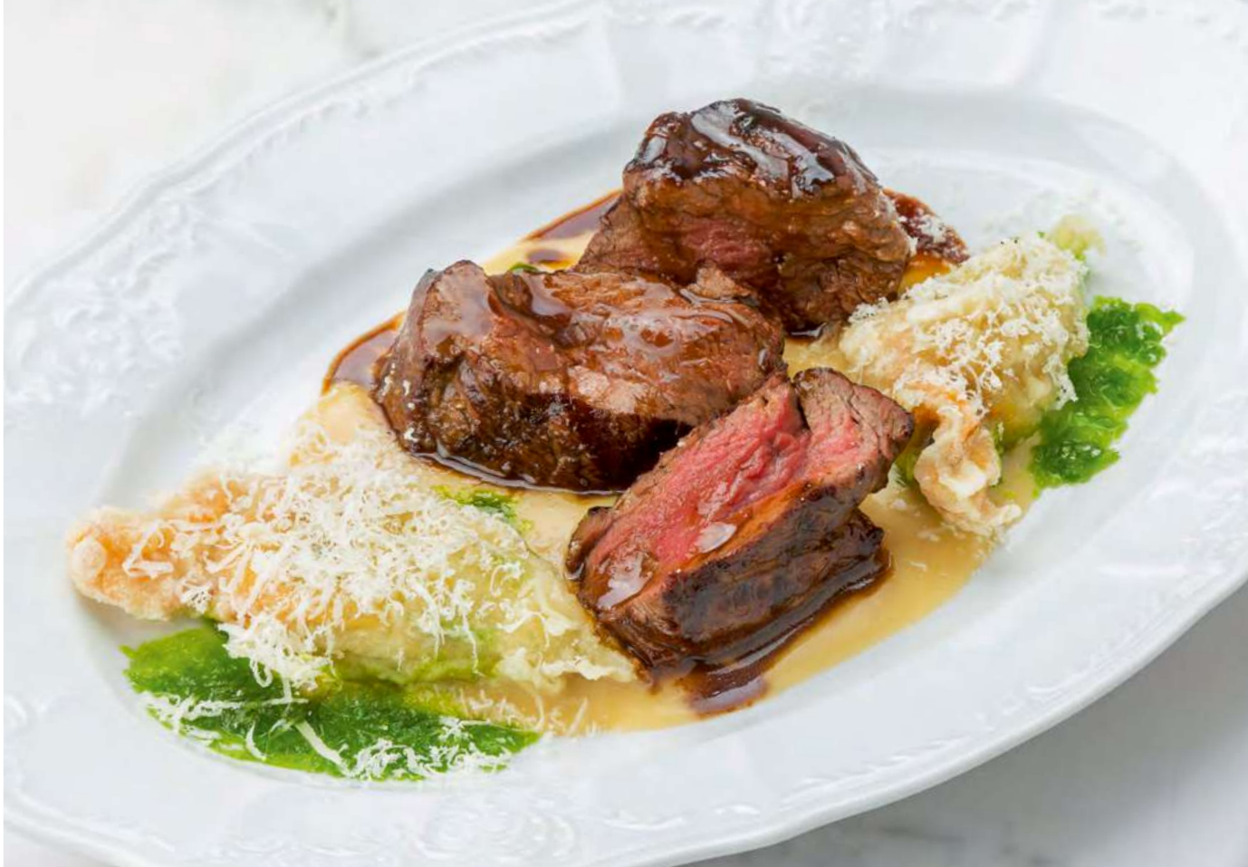
new Стейк из говядины в перечном соусе с цветками цукини _____ 2300 с начинкой из рикотты Beef steak in pepper sauce with zucchini flowers stuffed ricotta