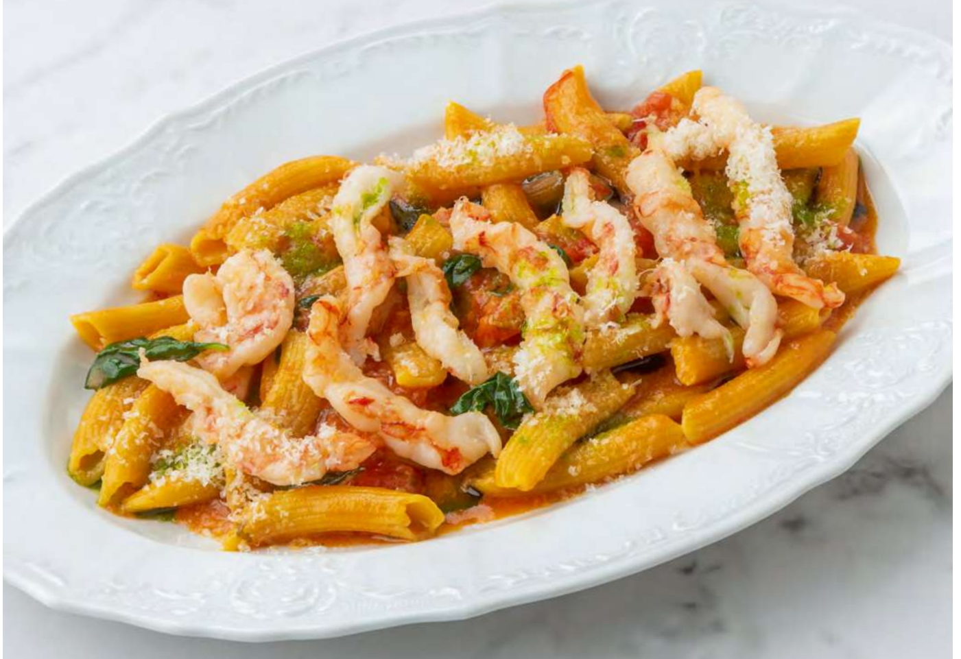
new Паста арабьята с аргентинскими креветками _____ 950 Arrabiata pasta with Argentinian shrimps