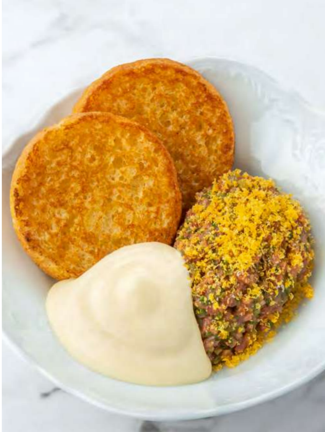
Тартар из говядины с муссом из пармезана и горгонзолы Beef tartare with parmesan and gorgonzola mousse 700