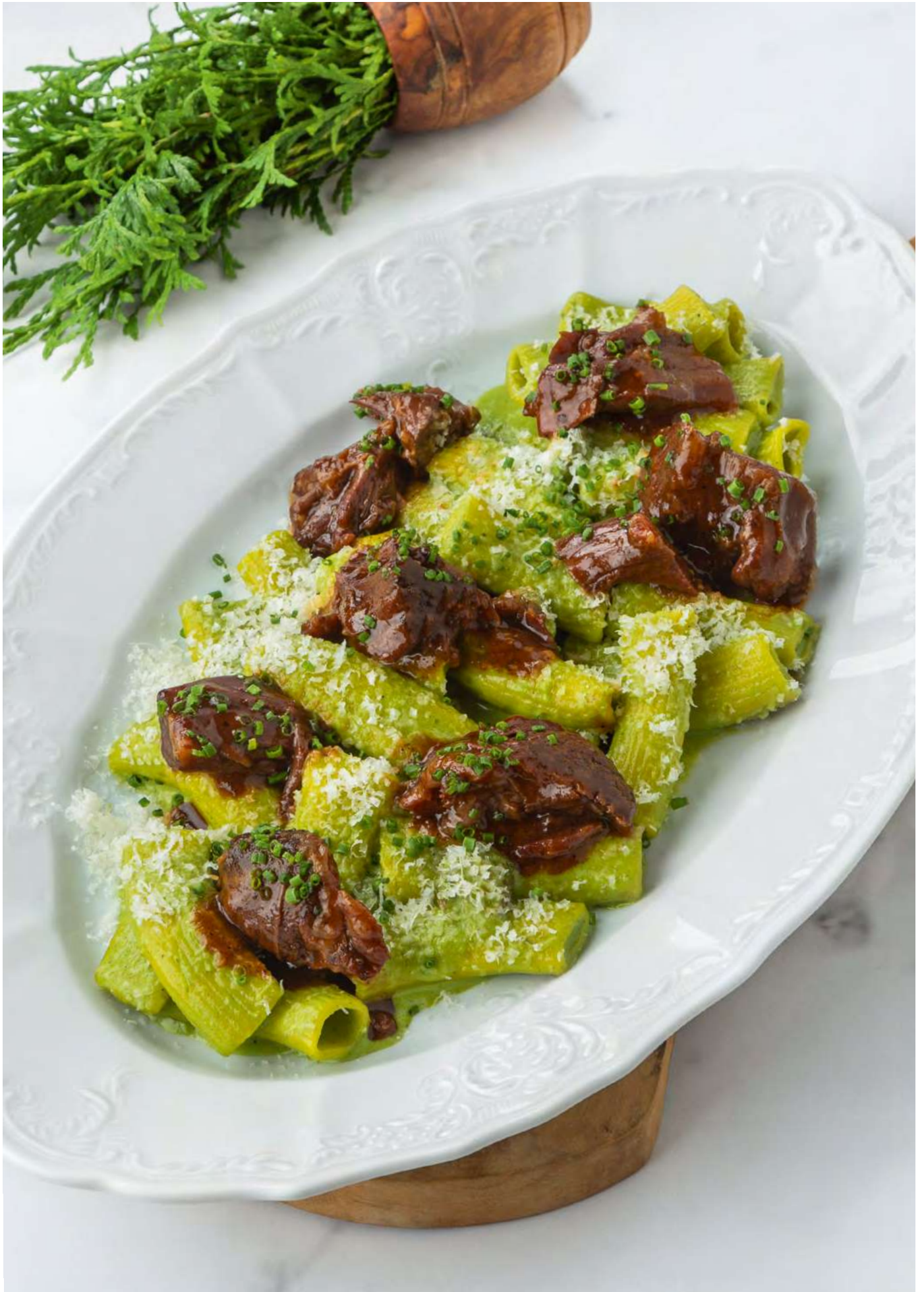
new Паста с телячими щёчками и соусом из халапеньо _____ 1050 Pasta with veal cheeks and jalapeno sauce