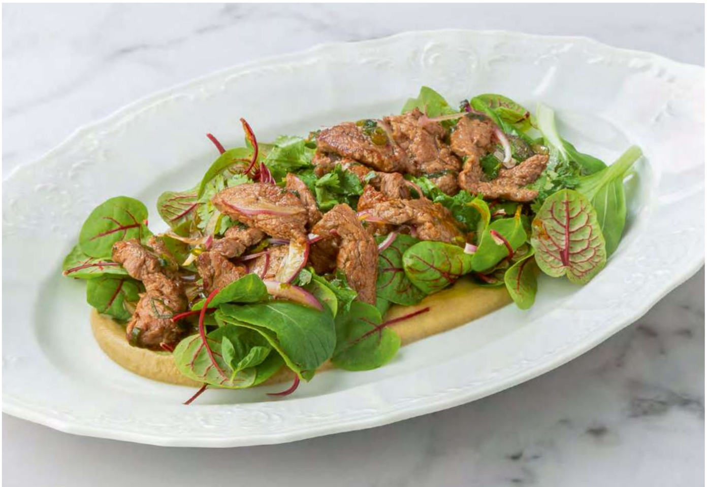
new Салат с жареной говядиной и муссом из баклажанов _____ 1100 Salad with fried beef and eggplant mousse