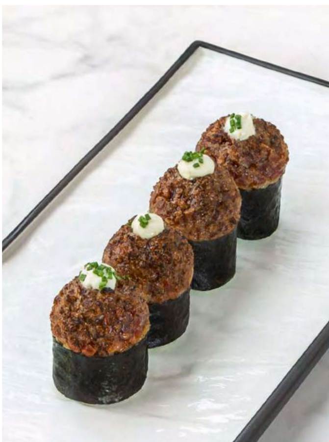
new Ролл с тартаром из говядины Roll with beef tartare 550