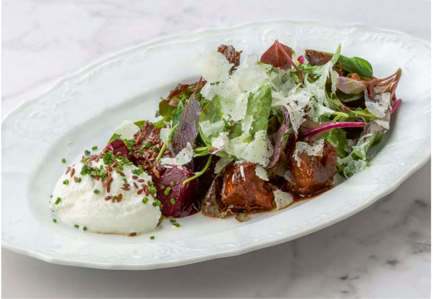
new Салат с телячьими щёчками, свёклой на гриле и рикоттой _____ 850 Salad with veal cheeks, grilled beets and ricotta