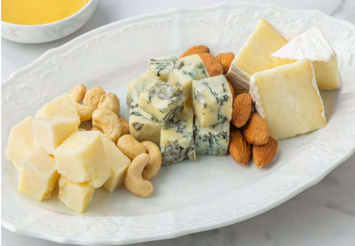
Ассорти сыров _____ 1600 Assorted cheese