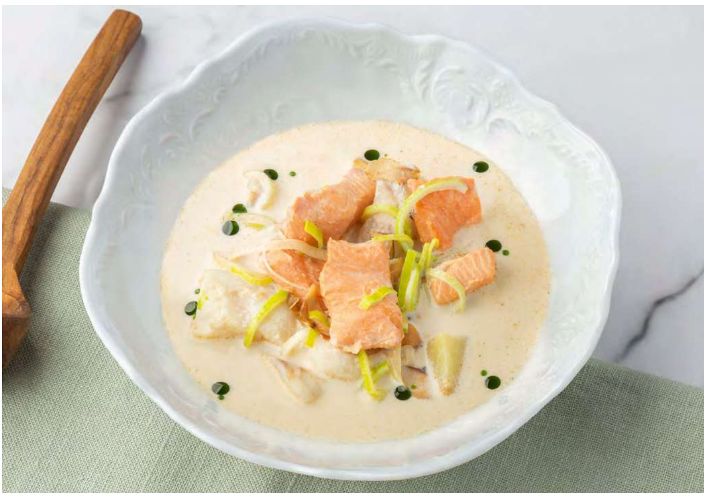
Сливочный суп с треской, форелью, картофелем и луком-пореем _____ 900 Creamy soup with cod, trout, potatoes and leeks