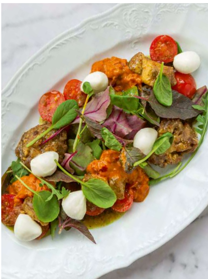
new Салат с печёными баклажанами, моцареллой и хариссой Salad with baked eggplant, mozzarella and harissa