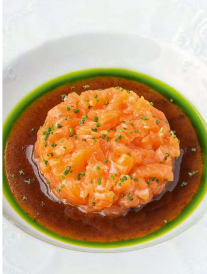
Тартар из лосося с трюфельным понзу Salmon tartare with truffle ponzu 1050