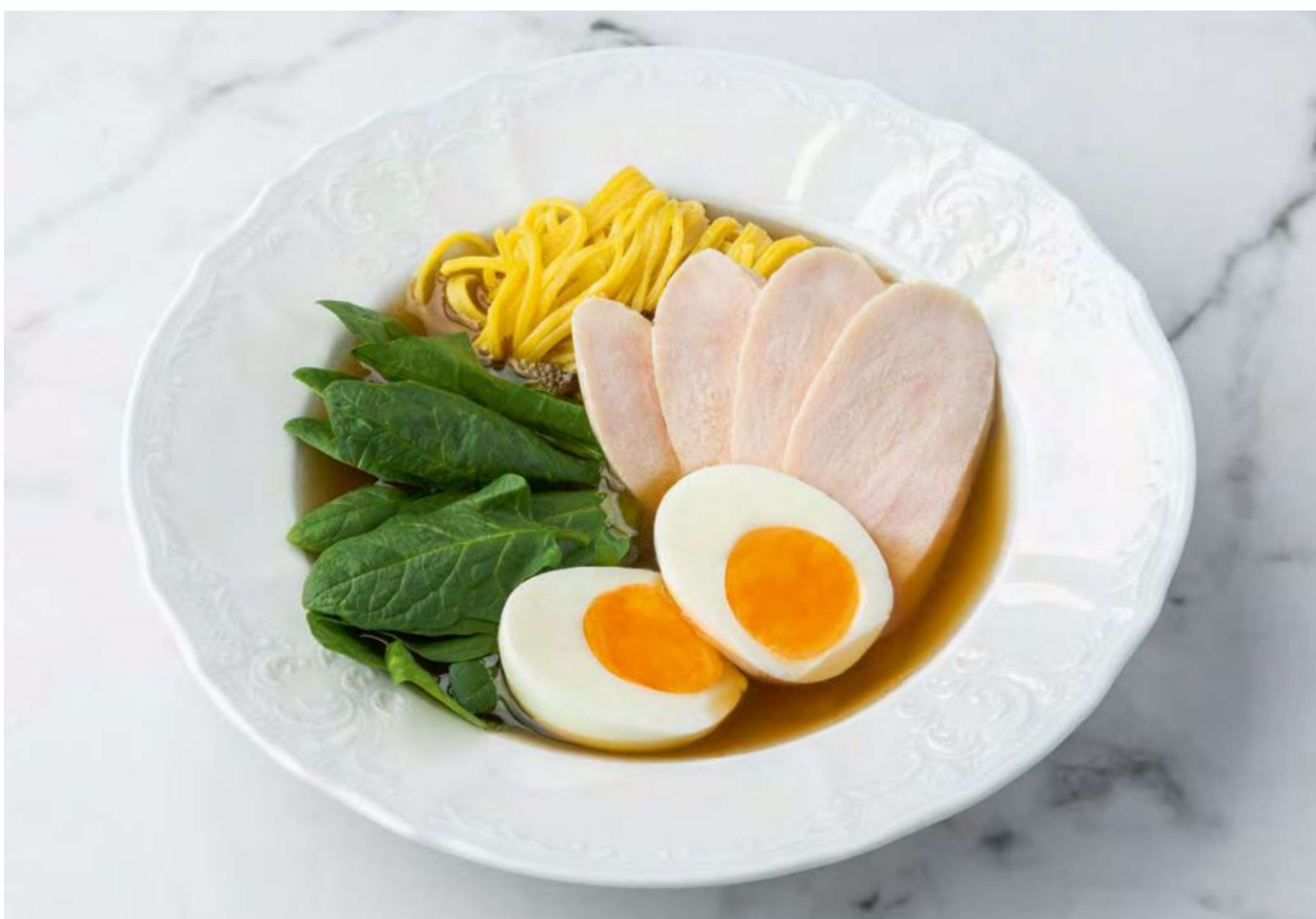
Бульон с цыплёнком и домашней лапшой _____ 550 Chicken broth with homemade noodles