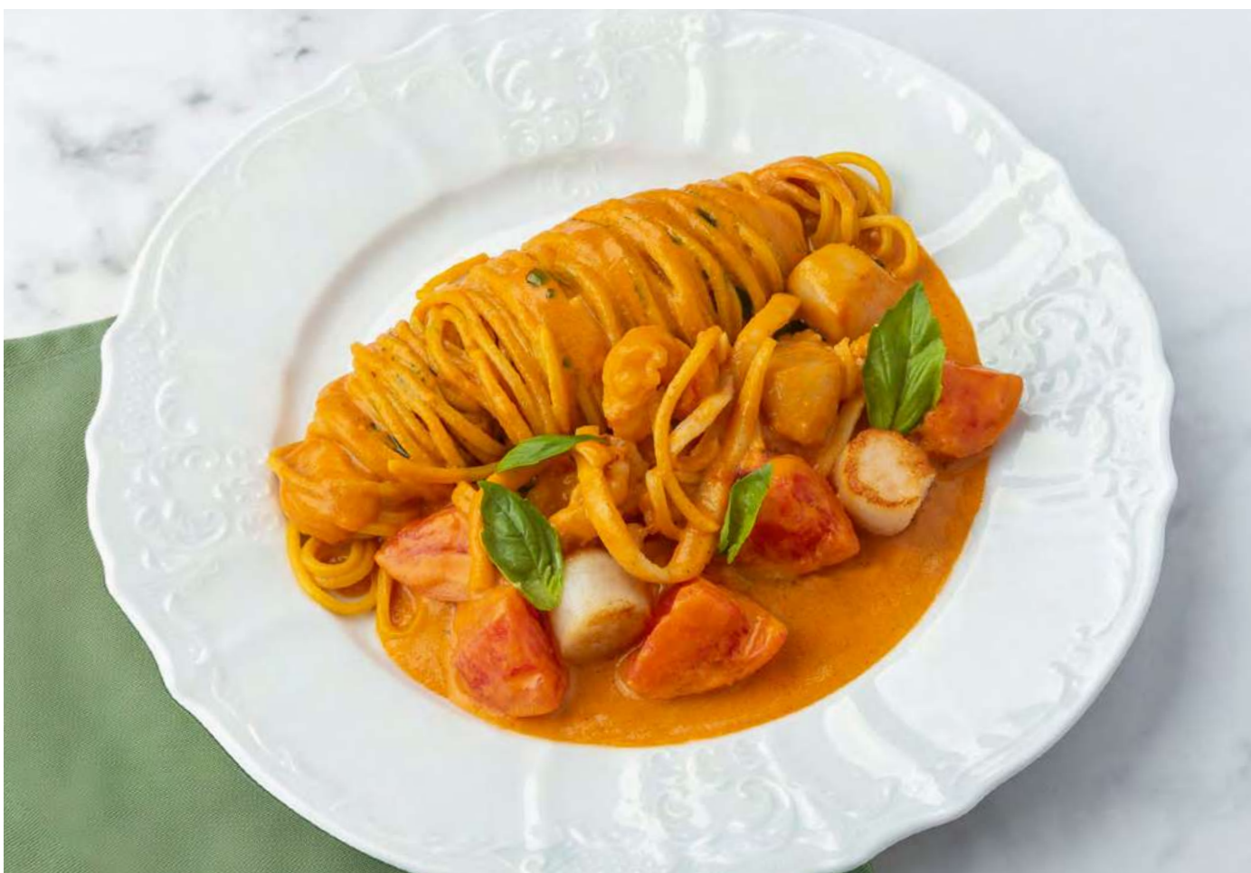
Паста с морепродуктами _____ 1400 Pasta with seafood