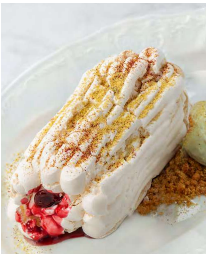
Меренговый рулет с вишней и фисташковым мороженым Meringue roll with cherries and pistachio ice cream 650