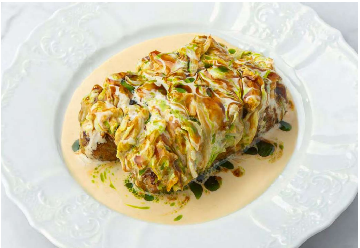
Открытые голубцы с кебабом из индейки и кремом тоннато _____ 750 Unstuffed cabbage rolls with turkey kebab and tonnato cream