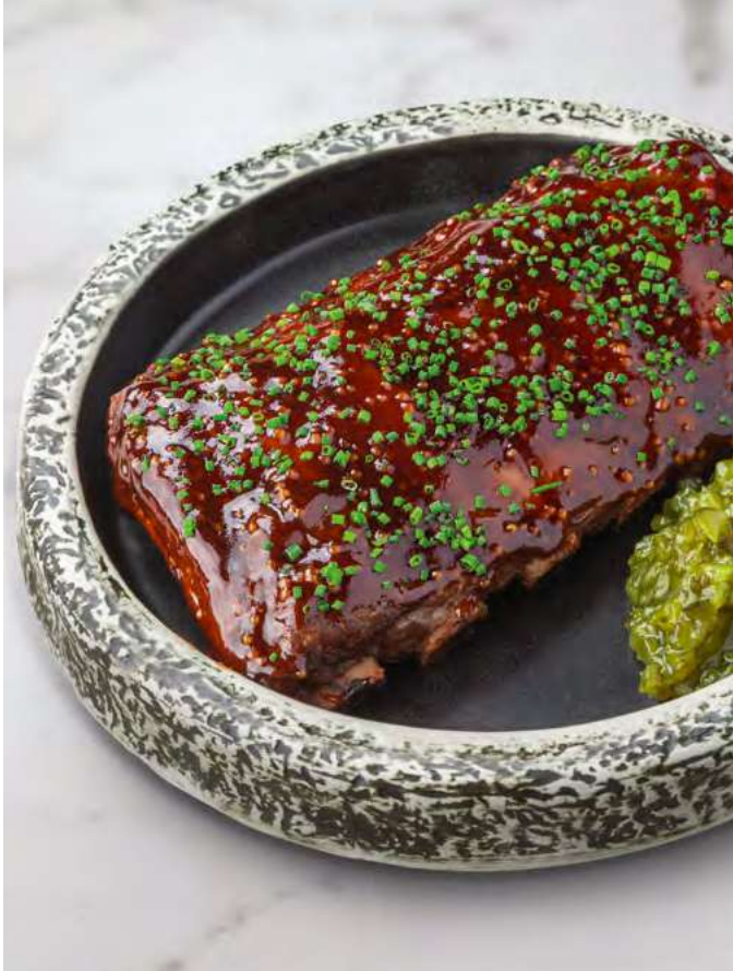
Свинные рёбра с огуречным релишем Pork ribs with cucumber relish 950