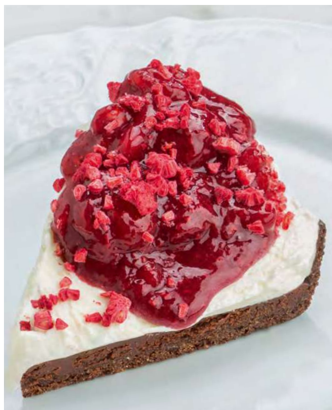
new Шоколадный тарт с малиной и ванильным муссом Chocolate tart with raspberries and vanilla mousse 750

*Фрукты могут меняться в зависимости от сезона. Пожалуйста, уточняйте информацию у официанта. Fruits depend on the season. Please check with the waiter.