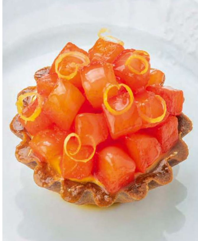
new Тарталетка с кремом юдзу и сезонными фруктами* Tartlet with yuzu cream and seasonal fruits* 500