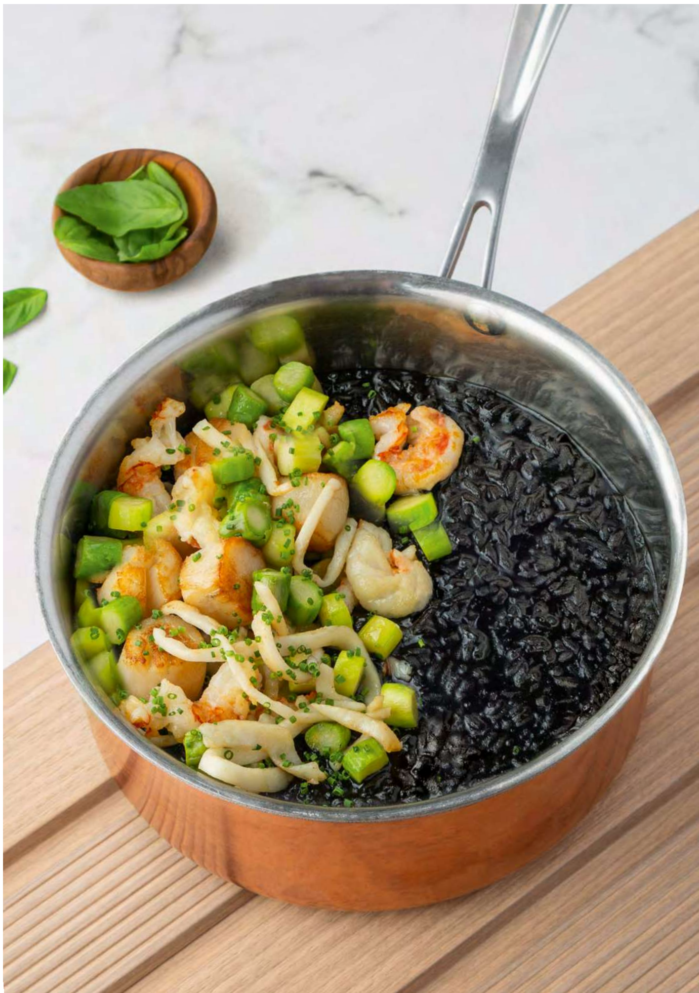
Чёрное ризотто с морепродуктами _____ 1400 / на две персоны 2600 Black risotto with seafood for two persons