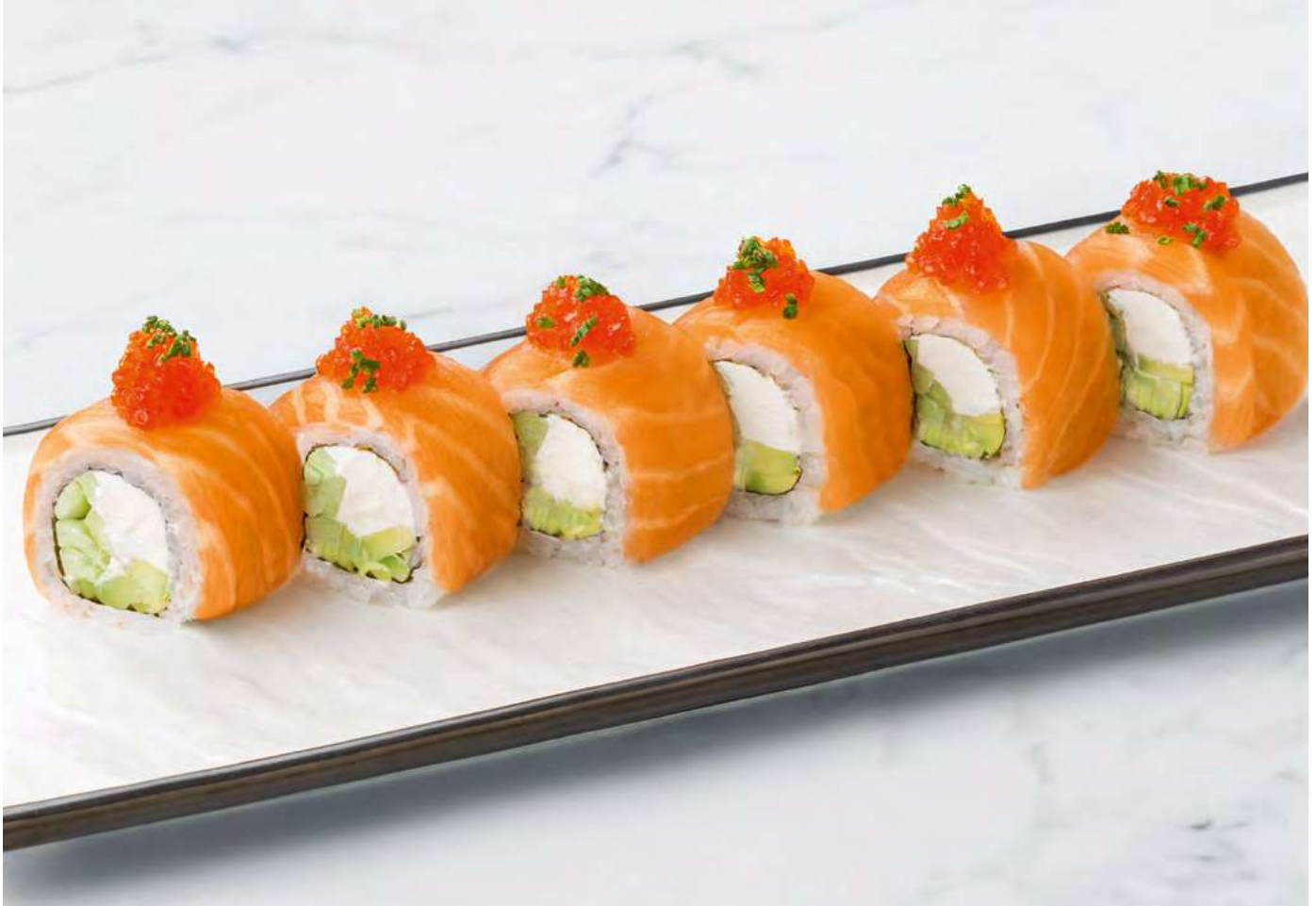
Филадельфия с красной икрой _____ 1200 Philadelphia with red caviar