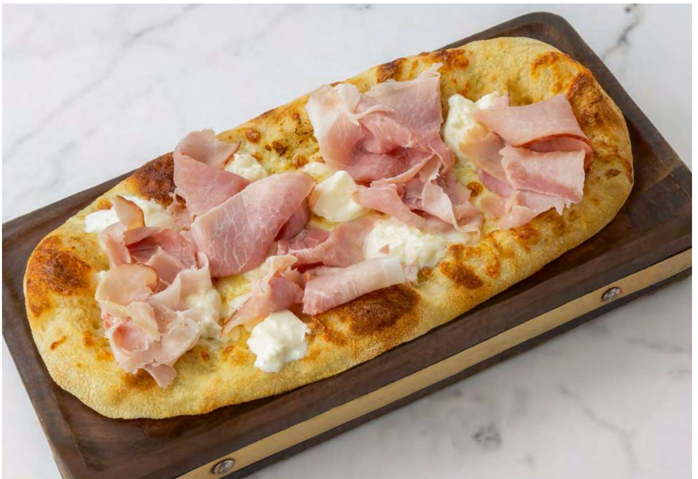
new Пицца с ветчиной и моцареллой _____ 750 Pizza with ham and mozzarella