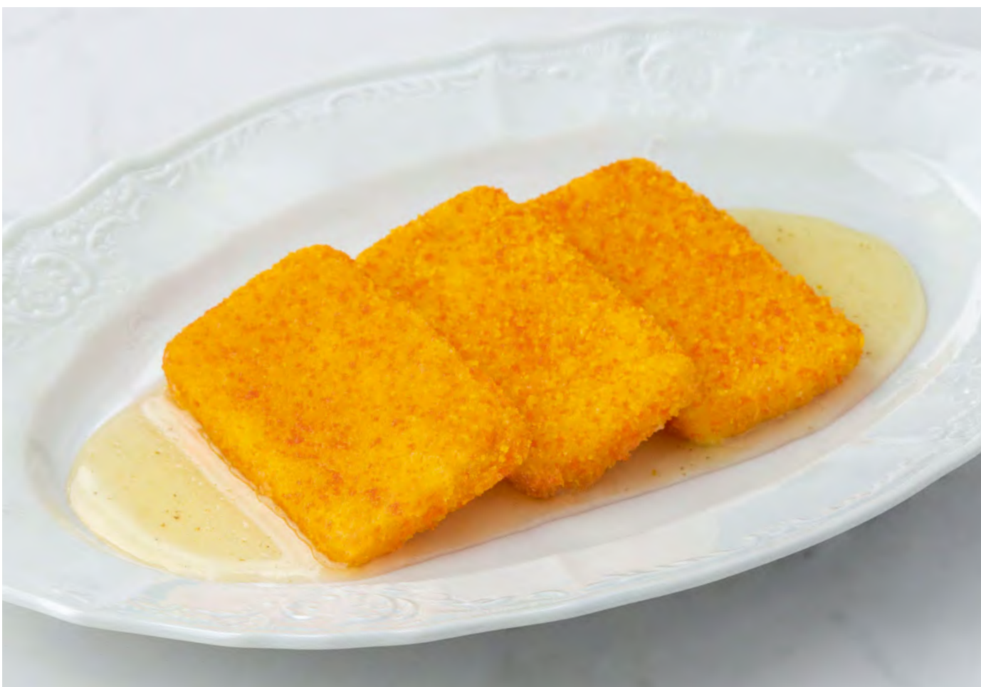
Жареный сыр с трюфельным мёдом — 600 Fried cheese with truffle honey