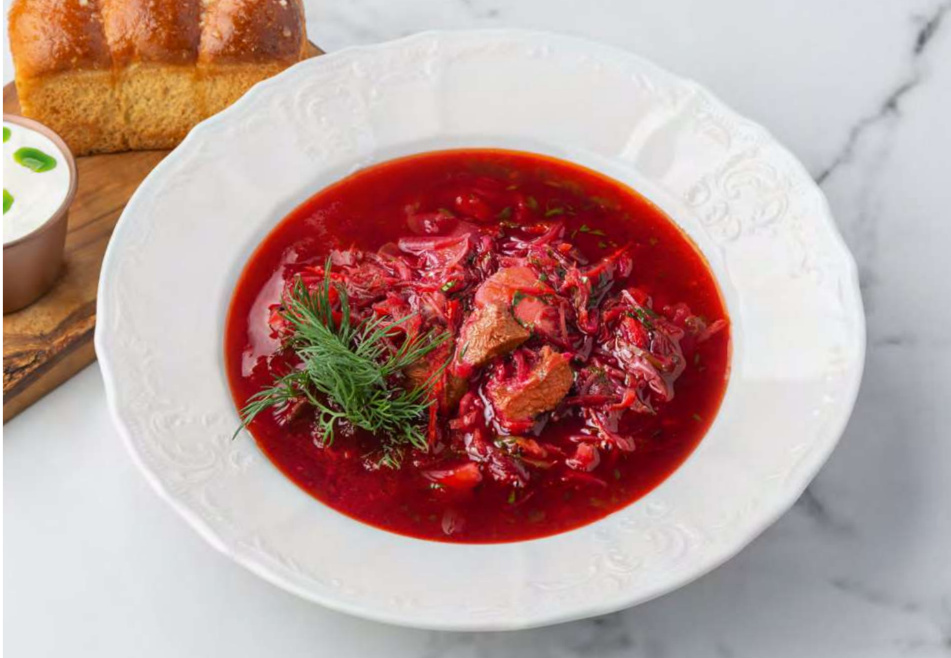
Борщ с телячьими щёчками, фасолью и пампушками _____ 750 Borscht with veal cheeks, beans and doughnuts