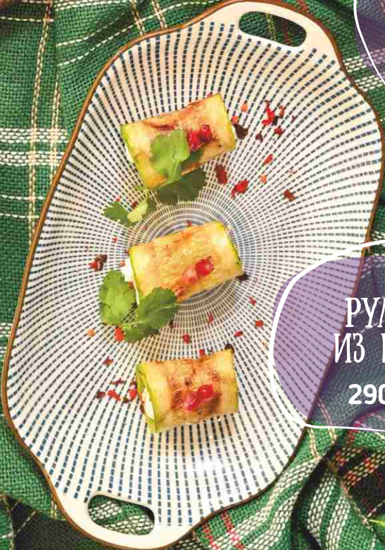
РУЛЕТКИ ИЗ ЦУКИНИ 290 120гр.