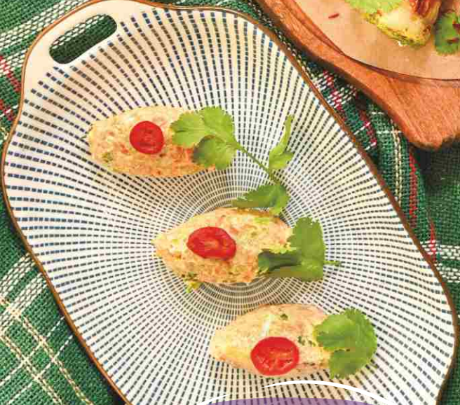
ПХАЛИ ИЗ МОРКОВИ И КАБАЧКА 290 120гр.