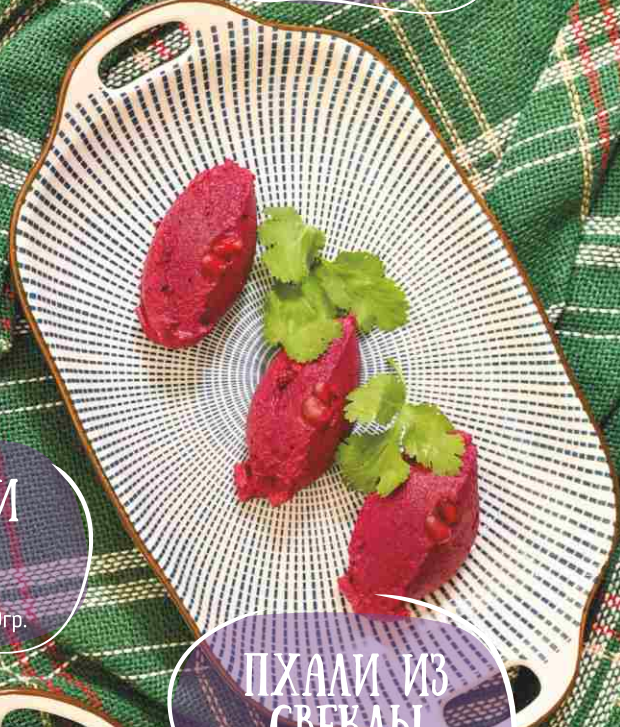
ПХАЛИ ИЗ СВЕКЛЫ 290 150гр.