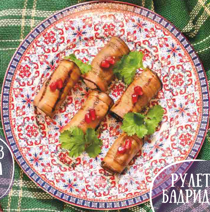
РУЛЕТКИ БАДРИДЖАНИ 425 150гр.