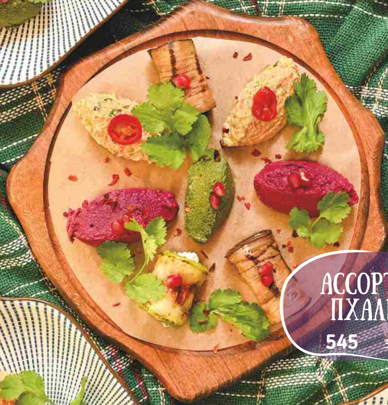
АССОРТИ ПХАЛИ 545 320гр.