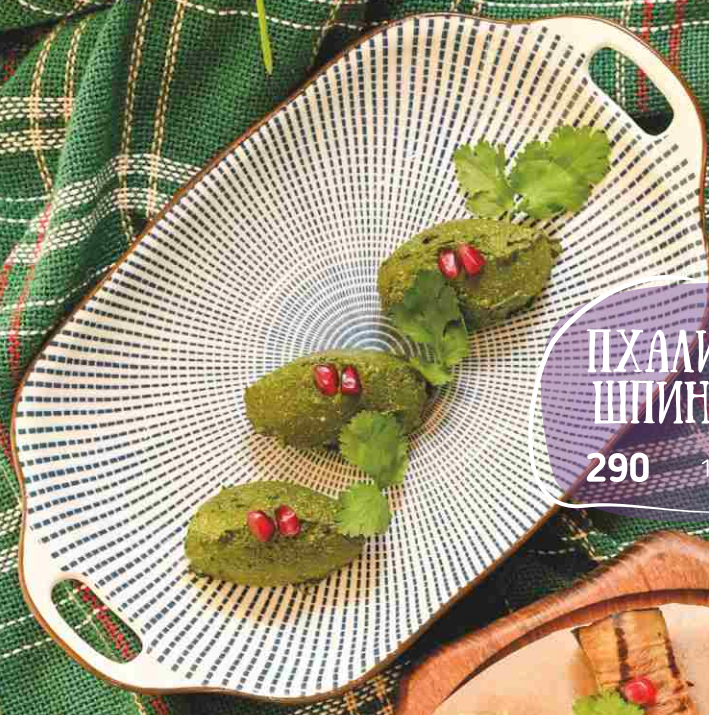
ПХАЛИ ИЗ ШПИНАТА 290 120гр.