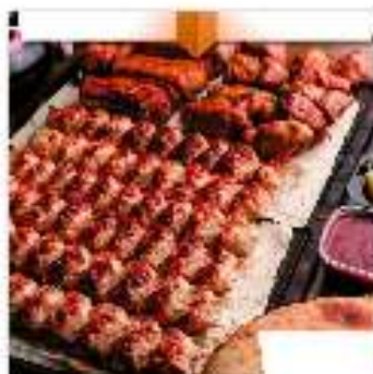
Комбо №3 "На шестерых"