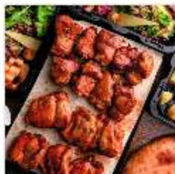
Комбо №2 "На четверых"