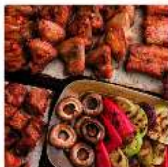
Комбо №6 "На восьмерых"