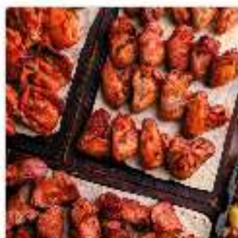
Комбо №8 "На десятерых"