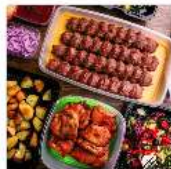
Комбо №1 "На четверых"