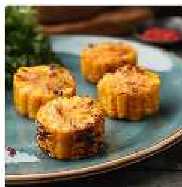
Кукуруза запеченная на гриле