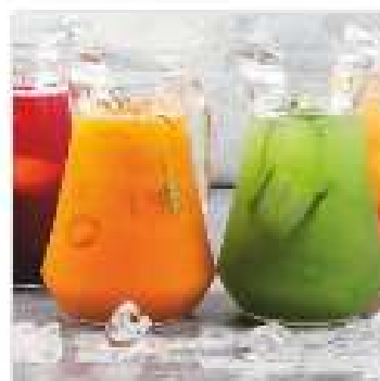
Лимонад облепиха, розмарин 250 мл