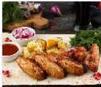
Шашлык из куриных крыльев 200 гр

Подается на тонком армянском лаваше с картофелем по-домашнему, соусом томатный острый.