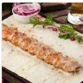
Люля-кебаб из курицы

Сочный фарш из курицы, обжаренный до золотистой корочки на открытом огне.