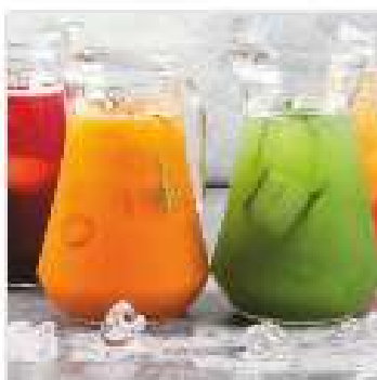
Лимонад грейпфрут, лимон 250 мл