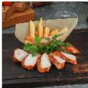
Стейк из куриного филе с картофелем фри