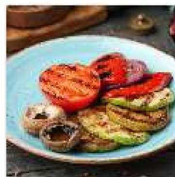
Овощи с гриля