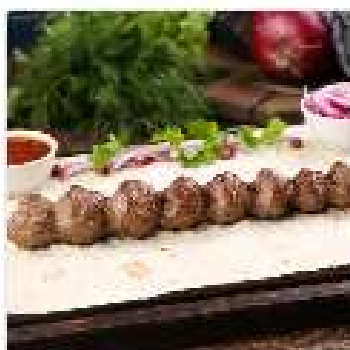
Люля-кебаб из говядины

Сочный фарш из говядины, обжаренный до золотистой корочки на открытом огне.