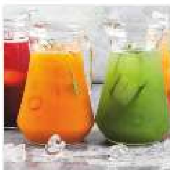
Лимонад грейпфрут, лимон 1 л