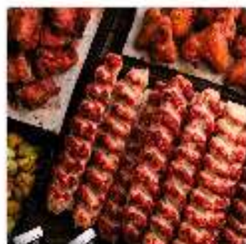
Комбо №7 "На десятерых"