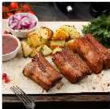
Шашлык из свиных ребер 200 гр

Подается на тонком армянском лаваше с картофелем по-домашнему, соусом томатный острый.