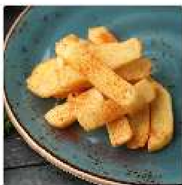
Картофель фри с копченной паприкой