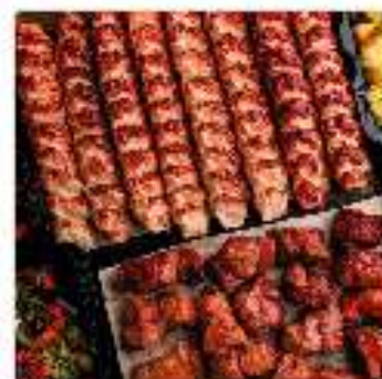
Комбо №5 "На восьмерых"