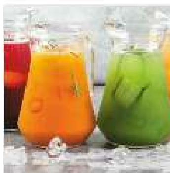
Лимонад облепиха, розмарин 1 л