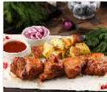
Шашлык из свиной вырезки 200 гр

Подается на тонком армянском лаваше с картофелем по-домашнему, соусом томатный острый.