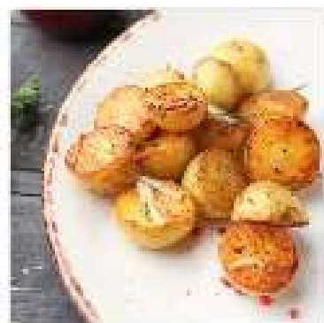
Картофель молодой с розмарином