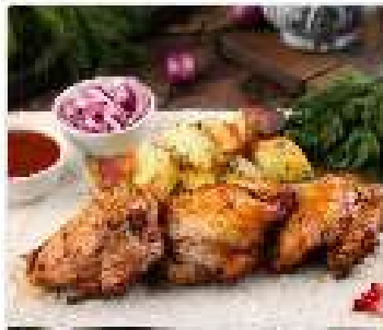
Шашлык из куриного бедра 200 гр

Подается на тонком армянском лаваше с картофелем по-домашнему, соусом томатный острый.