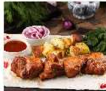
Шашлык из свиной шеи 200 гр

Подается на тонком армянском лаваше с картофелем по-домашнему, соусом томатный острый.