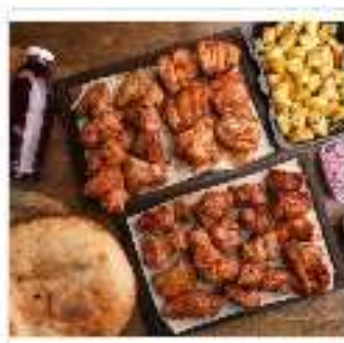
Комбо №4 "На шестерых"