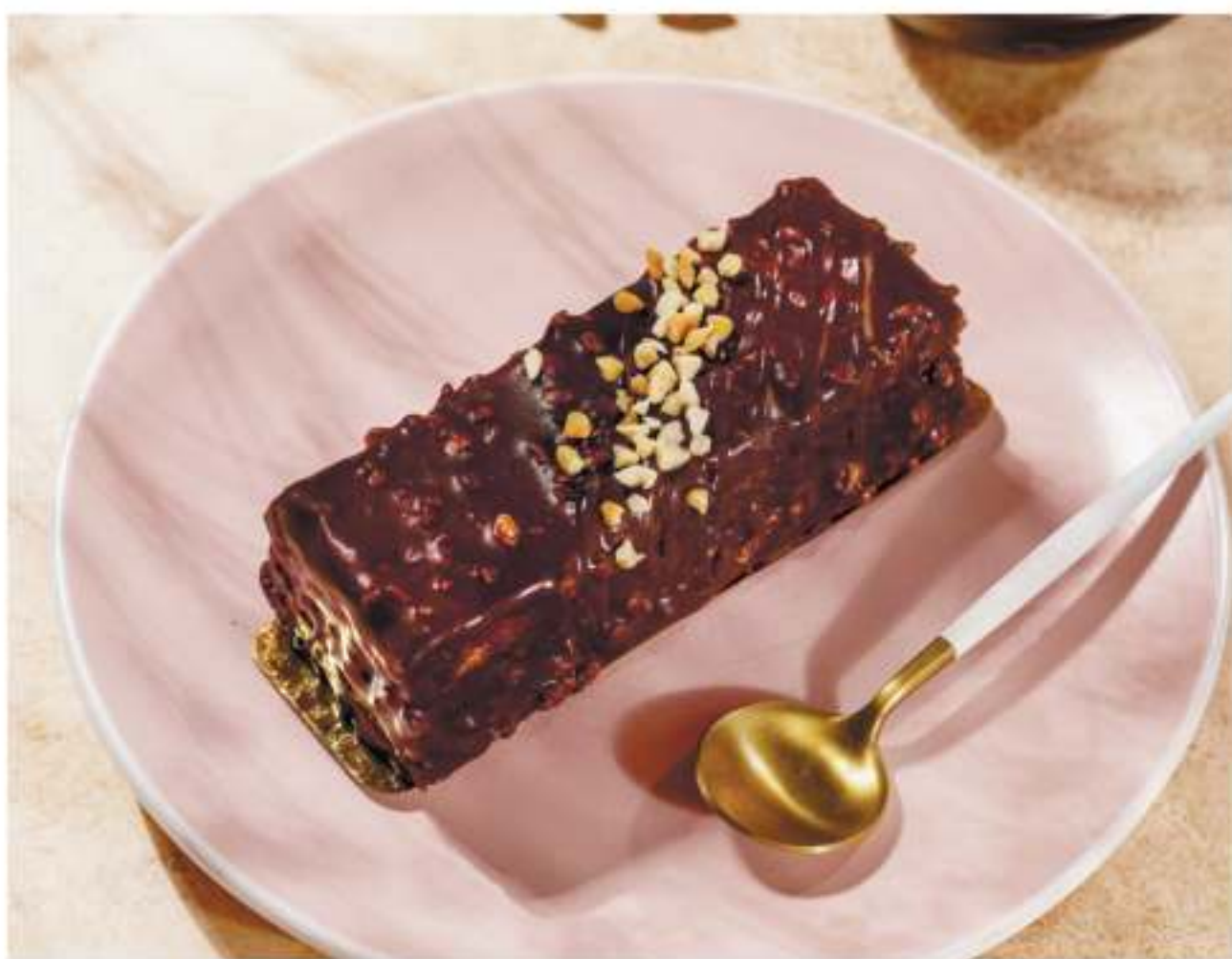
Торт Сникерс.....180г 350P

Внешний вид десерта и сервировки может отличаться