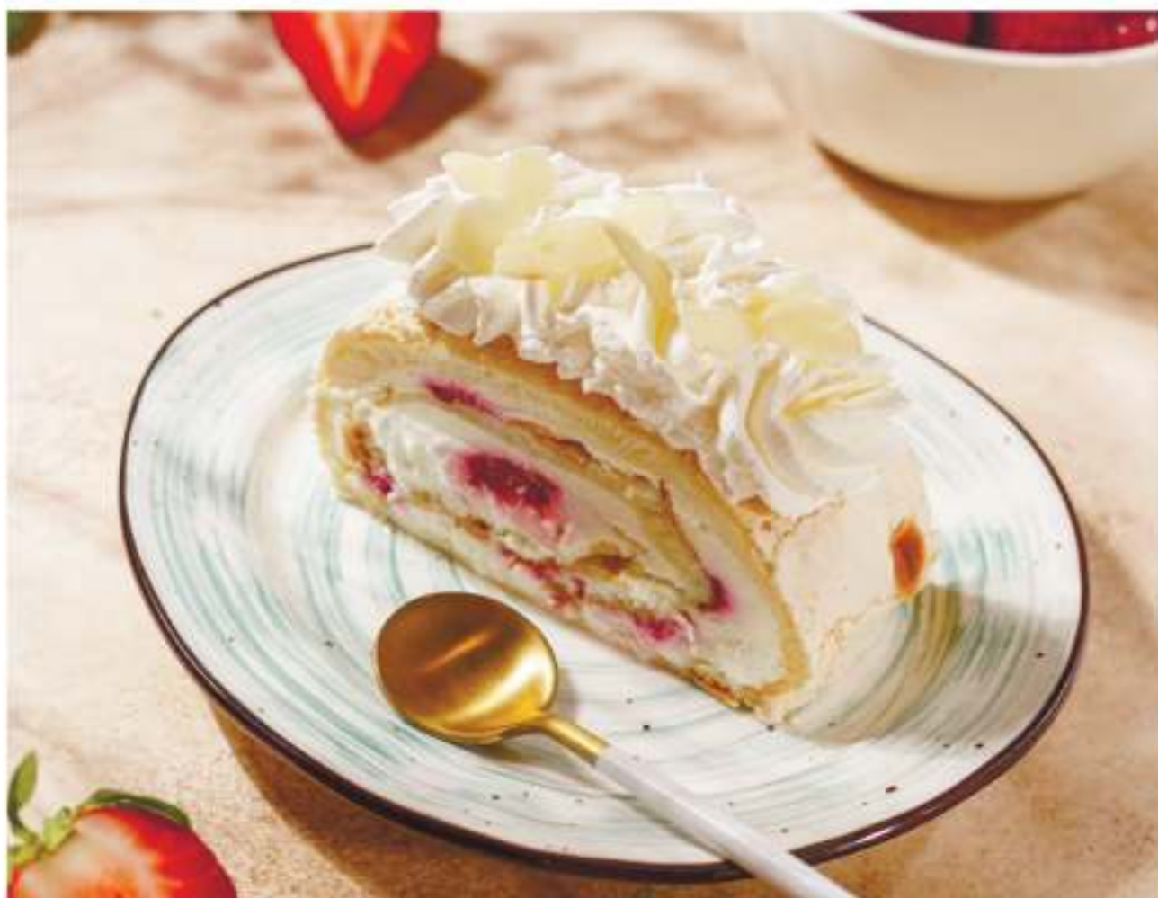
Меренговый рулет.....150г 320P