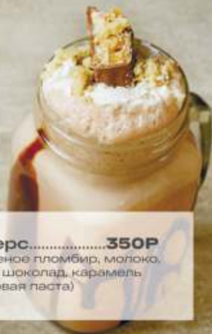
Сникерс.....350P (мороженое пломбир, молоко, топпинг шоколад, карамель арахисовая паста)