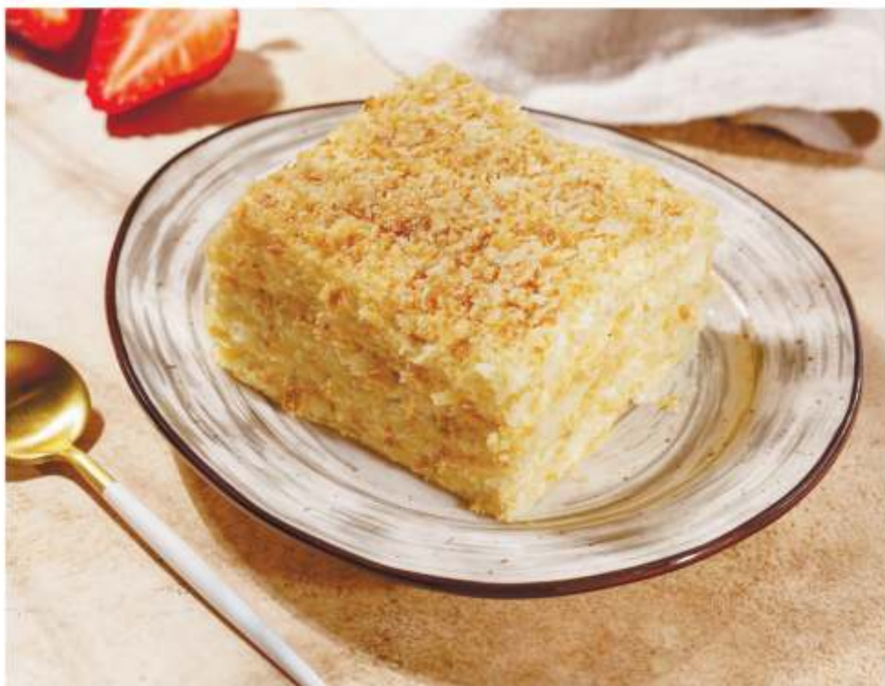
Торт Наполеон.....200г 290P