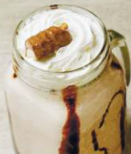
Твикс.....350P (мороженое пломбир, молоко, топпинг шоколад, карамель, печенье)