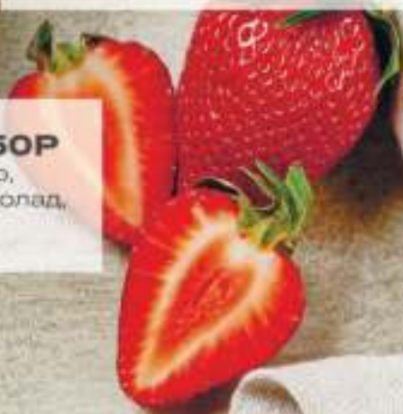
Баунти.....350P (мороженое пломбир, молоко, стружка кокоса, топпинг шоколад, кокосовый сироп)