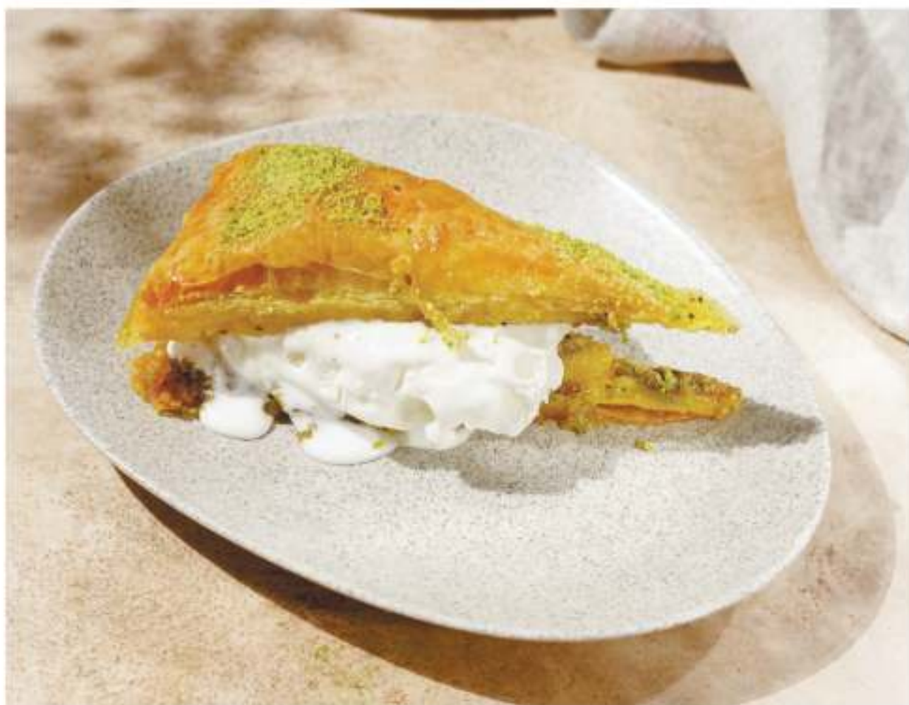
Пахлава с мороженым.....100г 350P