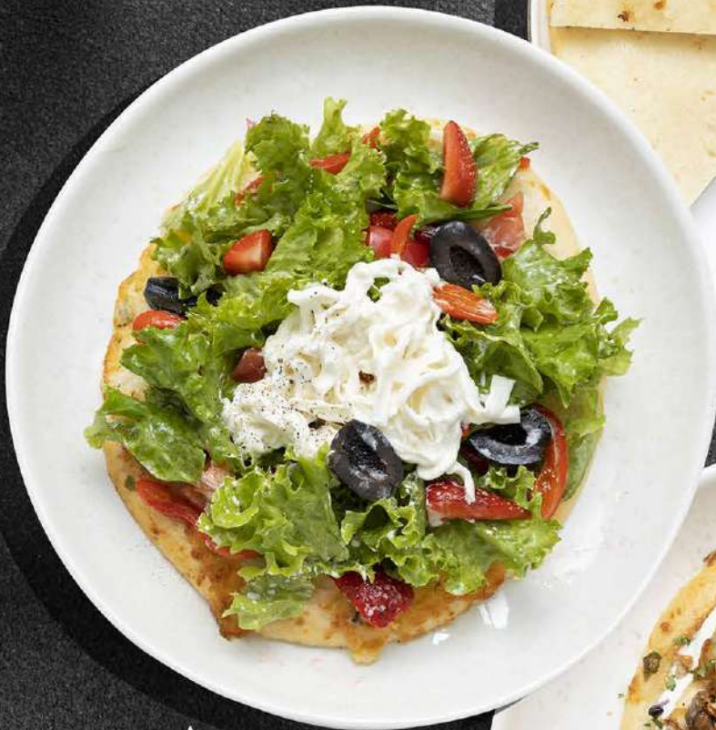
▲ ПИТА СО СТРАЧАТЕЛЛОЙ И КЛУБНИКОЙ 670 330 гр.