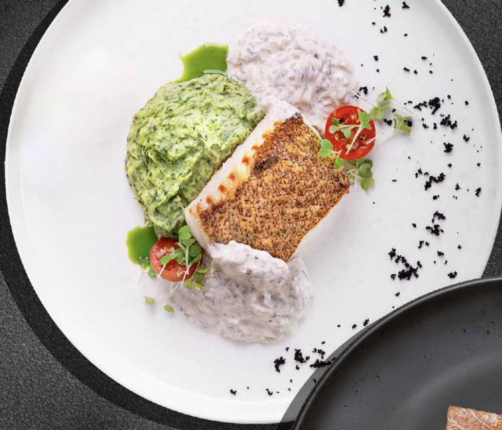
◀ ТРЕСКА С ГРИБНЫМ СОУСОМ И ШПИНАТНЫМ ПЮРЕ 870 270 гр.