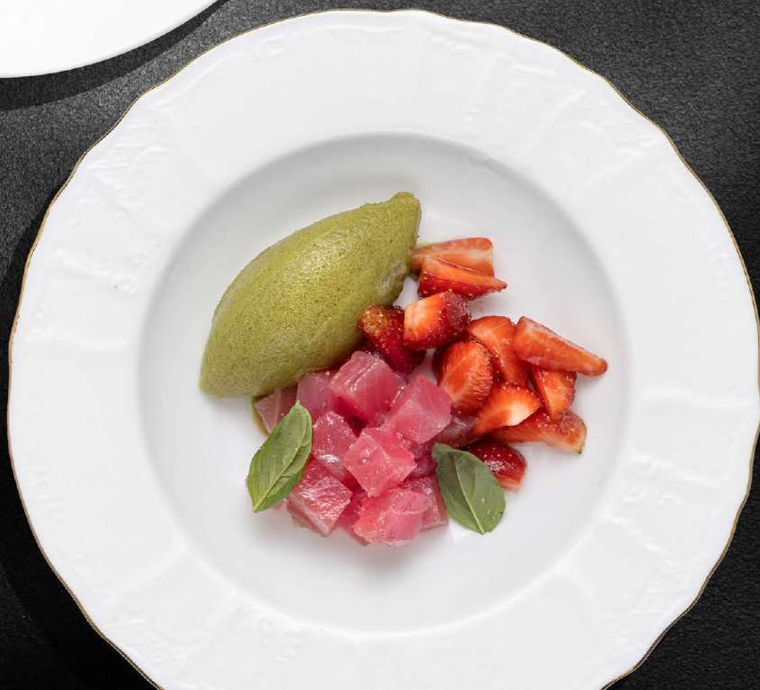
ТУНЕЦ С БАЗИЛИКОВЫМ СОРБЕТОМ И КЛУБНИКОЙ