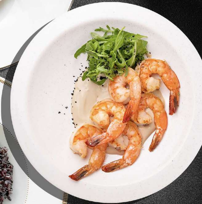
▲ КРЕВЕТКИ КОНЬЯЧНЫЕ 850 190 гр.