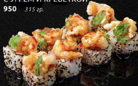
РОЛЛ С КРЕВЕТКОЙ ТЕМПУРА И СОУСОМ СЛАДКИЙ ЧИЛИ