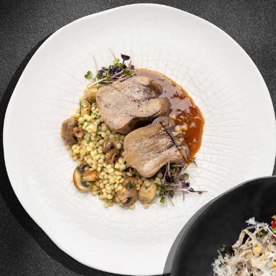
◀ ЯЗЫК С ГРИБНЫМ ПТИТИМОМ И ПЕРЕЧНЫМ СОУСОМ