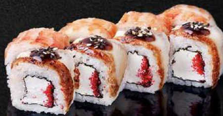
СЛИВОЧНЫЙ РОЛЛ С УГРЕМ И КРЕВЕТКОЙ