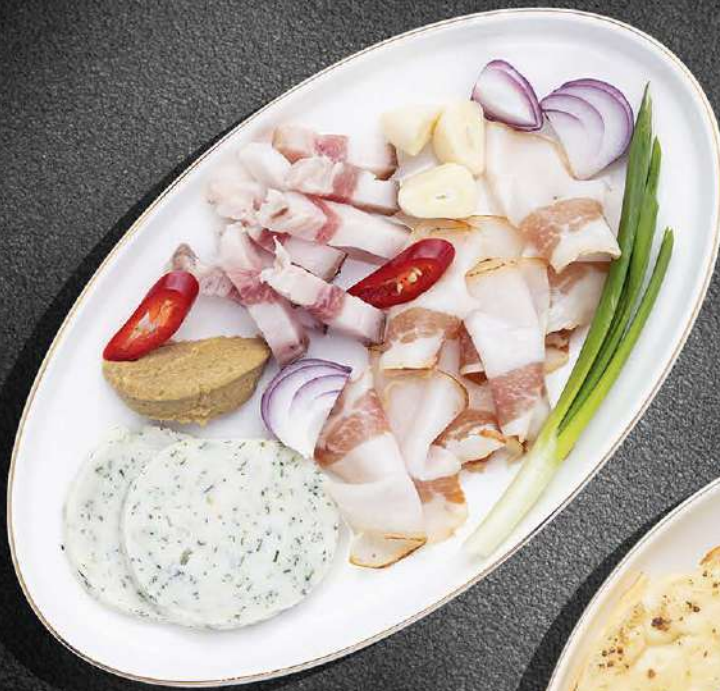
◀ САЛО 500 140 гр.