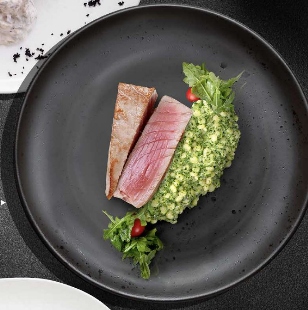
СТЕЙК ТУНЦА СО СЛИВОЧНО- ШПИНАТНЫМ ПЮРЕ 1300 370 гр. ▶