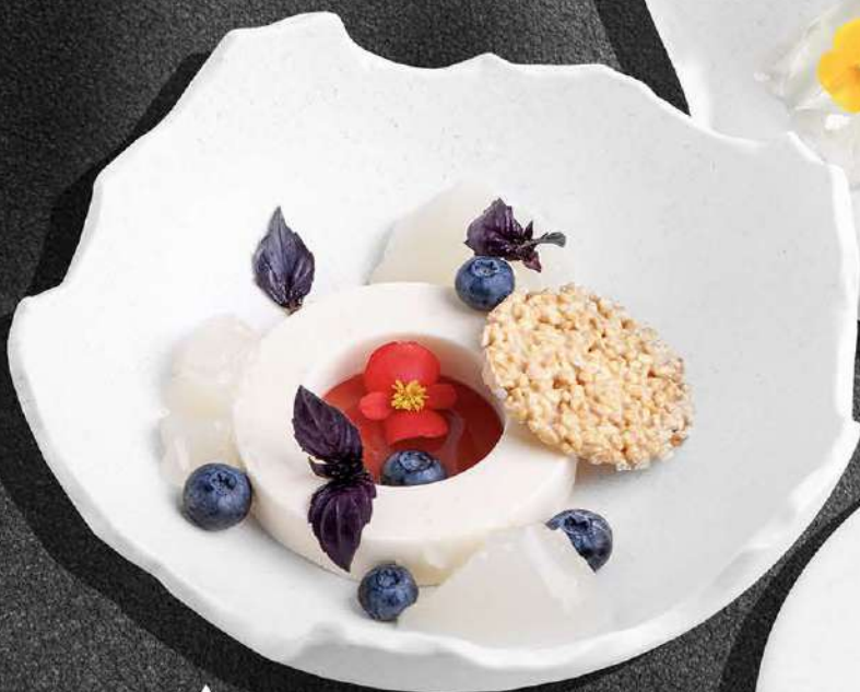
▲ СЛИВОЧНЫЙ МУСС С ДЖЕМОМ АЛОЭ 470