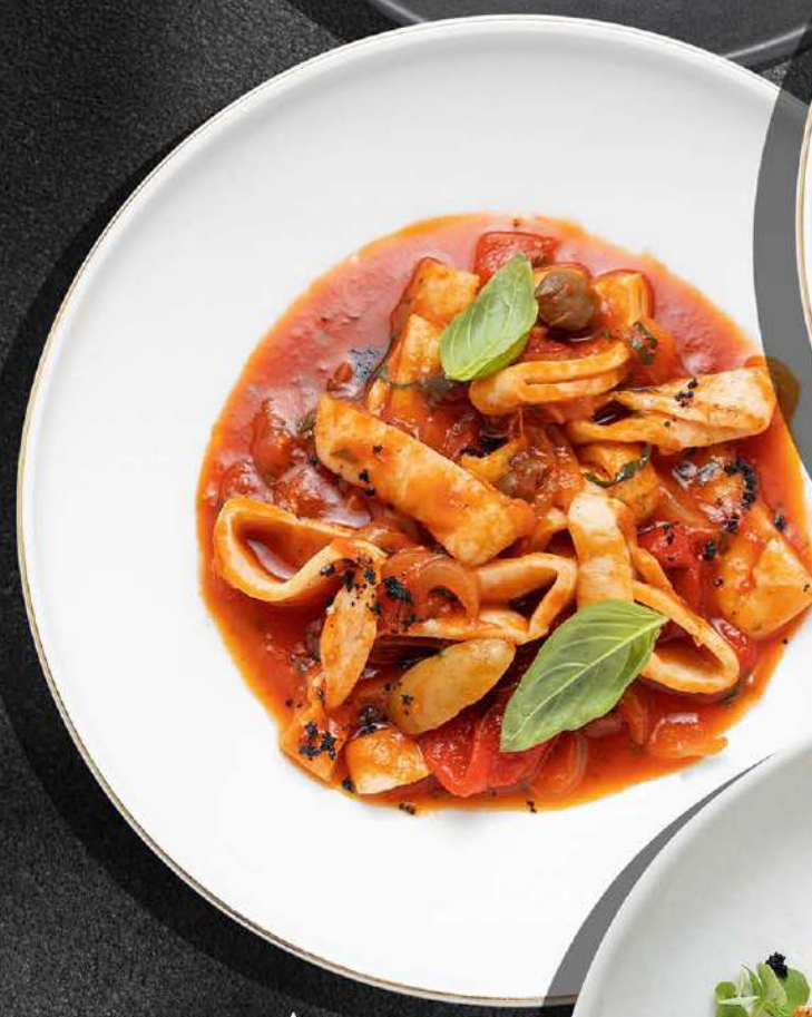
▲ КАЛЬМАР С ЛЕЧО 690 190 гр.