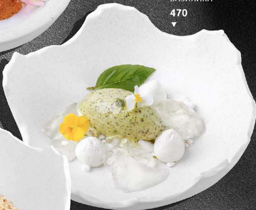
СОРБЕТ ИЗ ЗЕЛЕННОГО БАЗИЛИКА 470 ▼