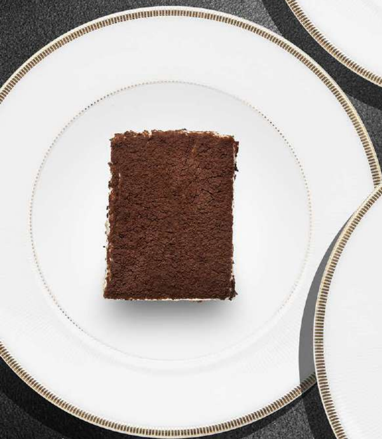
ДОМАШНИЙ ТИРАМИСУ 490