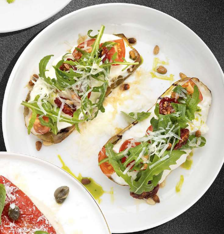
БАКЛАЖАН СО СТРАЧАТЕЛЛОЙ И ТОМАТАМИ