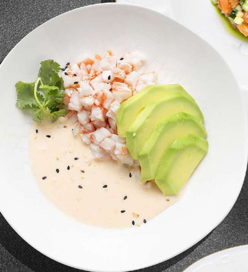
▲ ТАРТАР ИЗ КРЕВЕТКИ С АВОКАДО И СЛИВОЧНЫМ СОУСОМ