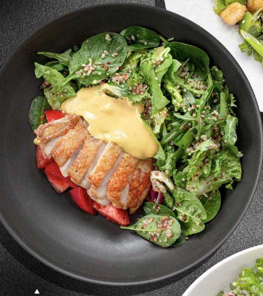
▲ КУРИНЫЙ ОКОРОК с листьями салата, поматами, киноа и мангово-трюфельным соусом 750 260 гр.