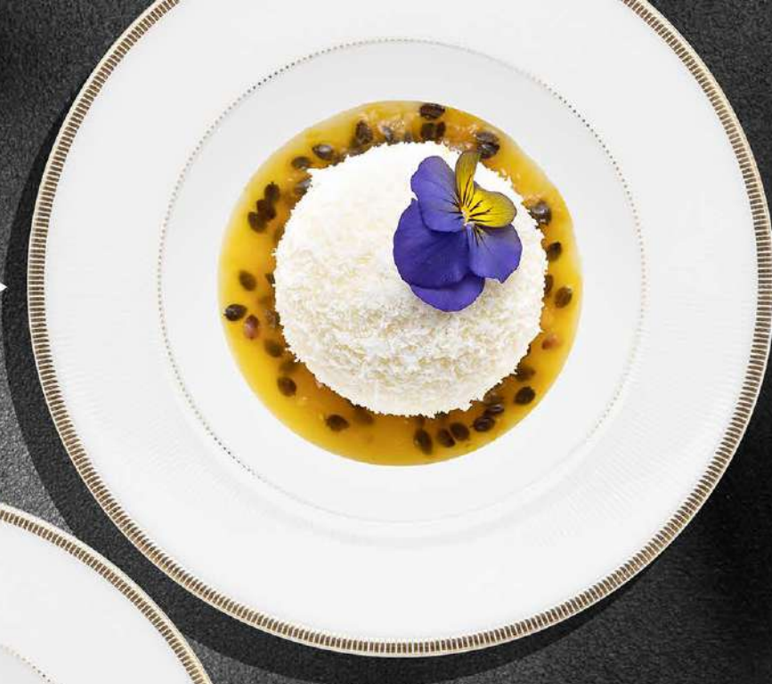
КОКОСОВЫЙ МУСС С АНАНАСОВЫМ КОНФИ 450