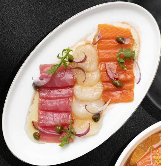
▲ КРУДО ИЗ ФОРЕЛИ С ТУНЦОМ И ГРЕБЕШКОМ