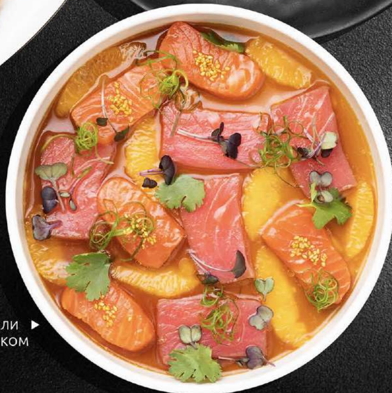
▶ САШИМИ ИЗ ФОРЕЛИ И ТУНЦА В АЗИАТСКОМ СОУСЕ