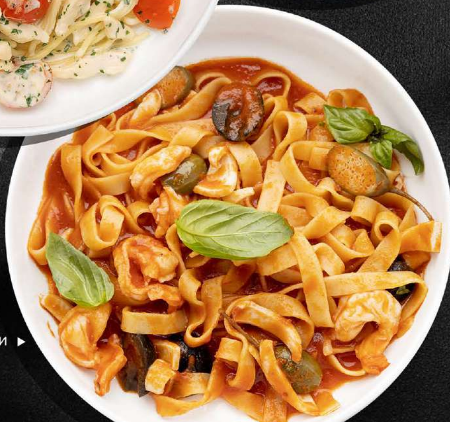
ФЕТУЧИНИ С МОРЕПРОДУКТАМИ ▶