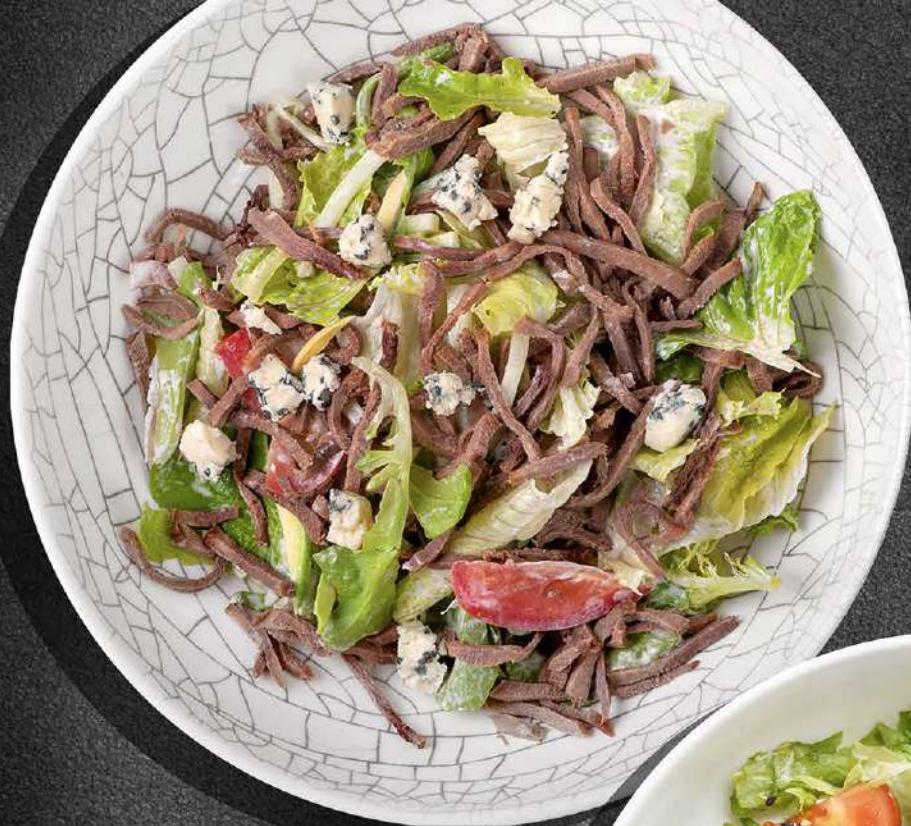
◀ ЯЗЫК С ГОЛУБЫМ СЫРОМ с овощами и горчичной заправкой