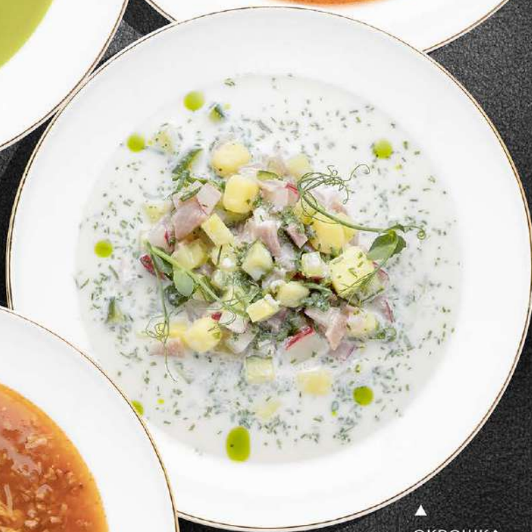
▲ ОКРОШКА С ТЕЛЯТИНОЙ