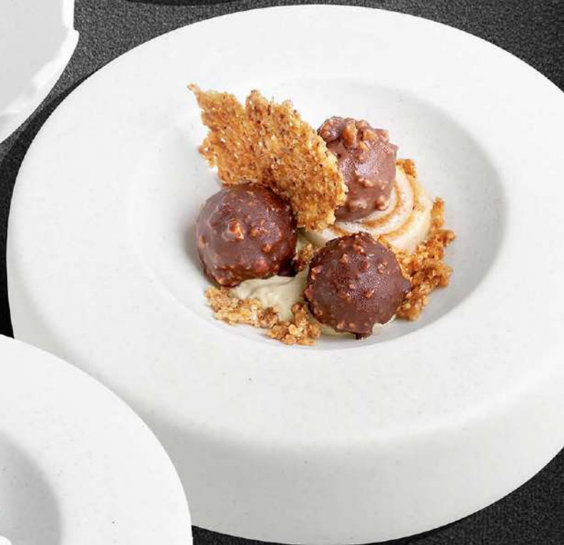
▲ ОРЕХОВЫЙ РУЛЕТ 570