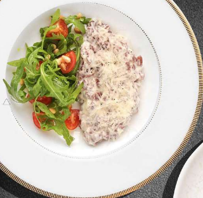
◀ ТАРТАР СЛИВОЧНЫЙ ИЗ ТЕЛЯТИНЫ С РУККОЛОЙ И ТОМАТАМИ