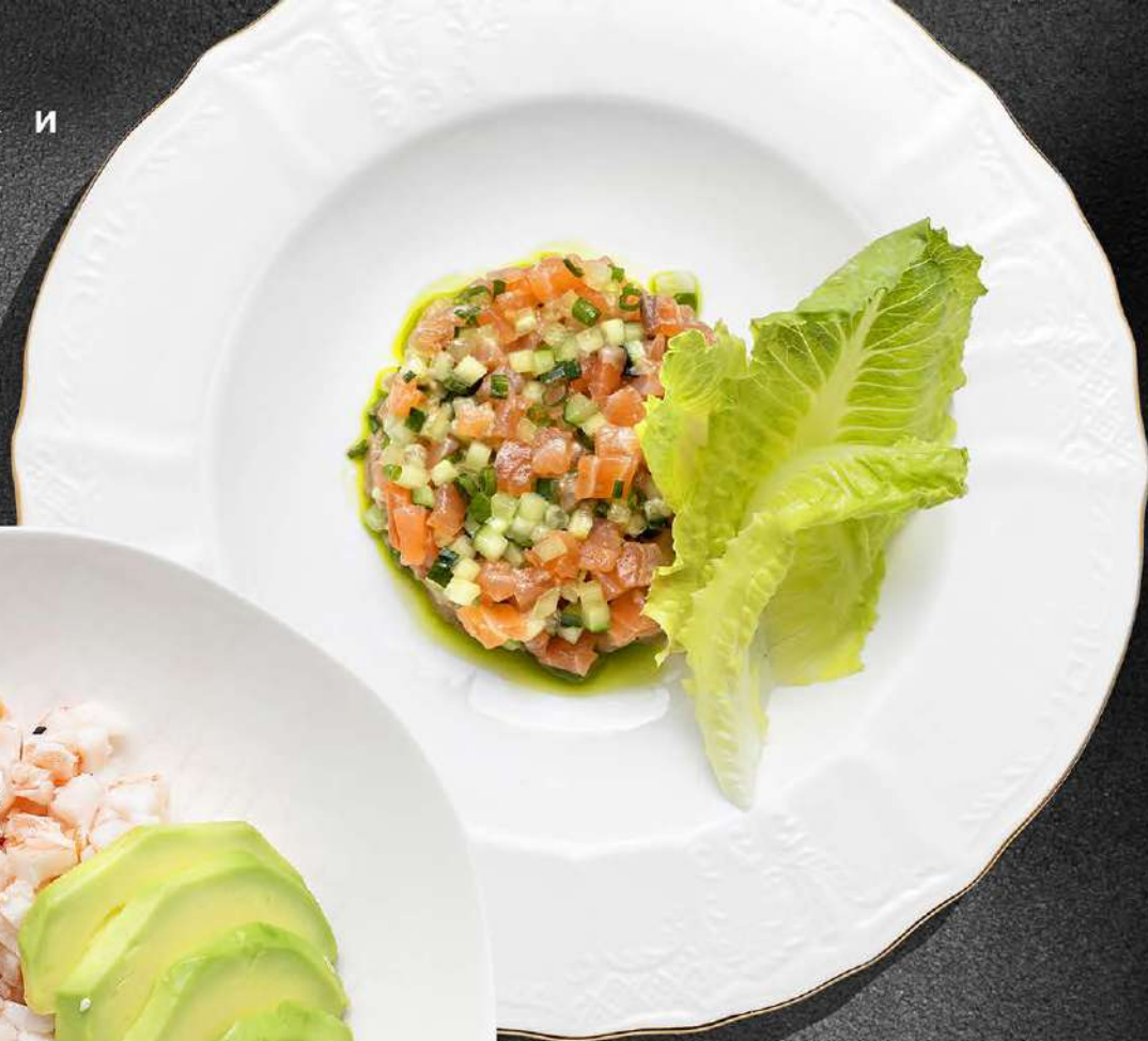
▲ ТАРТАР ИЗ СЛАБОСОЛЕННОЙ ФОРЕЛИ С КРЕМОМ ИЗ КАПУСТЫ