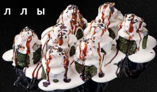
ТЕПЛЫЙ РОЛЛ С УГРЕМ И СЛИВОЧНЫМ СОУСОМ