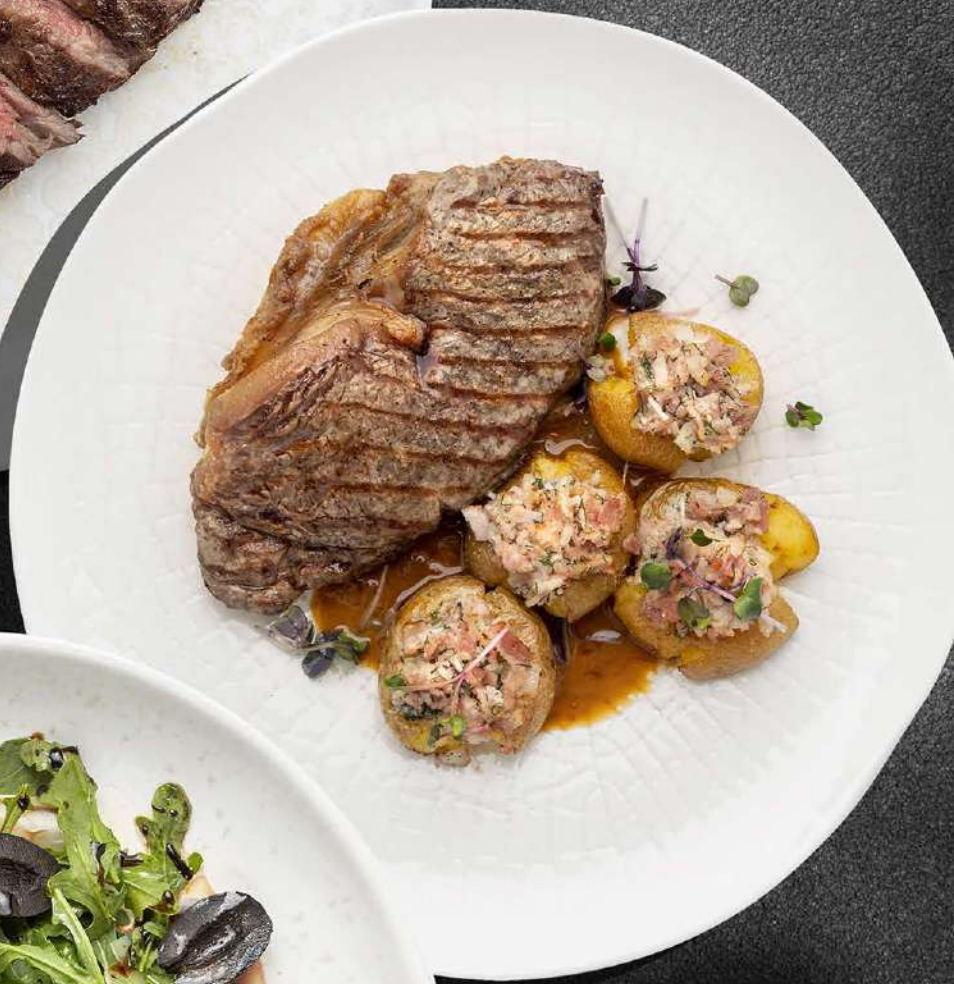
▲ СТРИПЛОЙН С ПЕЧЕНЫМ КАРТОФЕЛЕМ