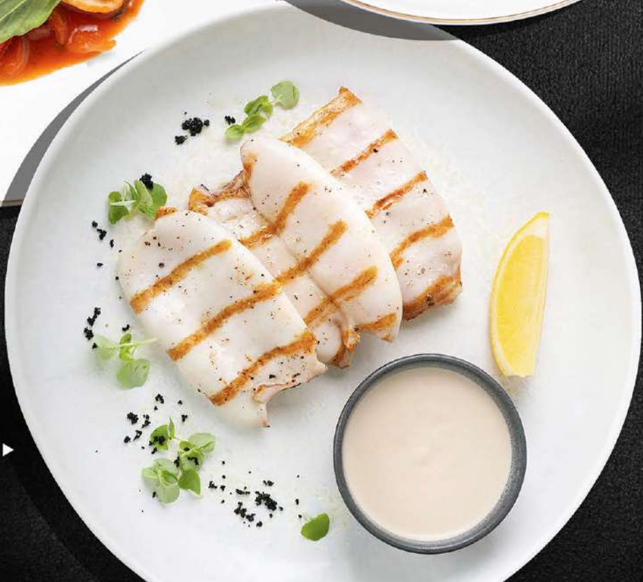
КАЛЬМАР ГРИЛЬ ▶ 690 220 гр.