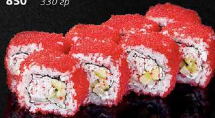
КАЛИФОРНИЯ СО СНЕЖНЫМ КРАБОМ