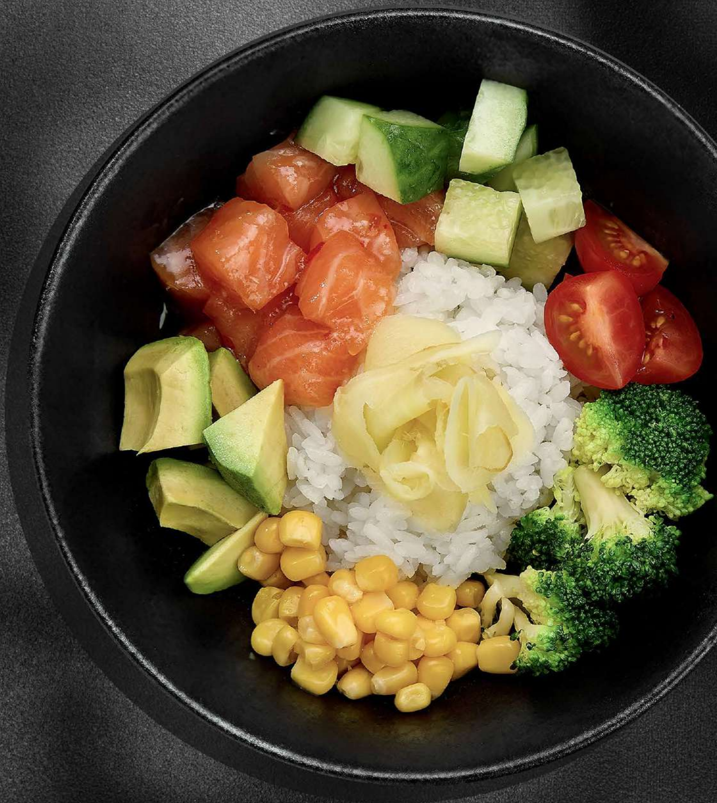
▲ ПОКЕ ФОРЕЛЬ / УГОРЬ / ТУНЕЦ 750 200 гр.