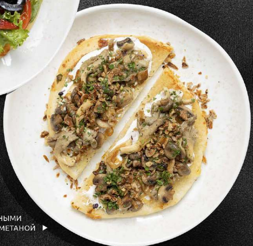
ПИТА С ЖАРЕНЫМИ ГРИБАМИ И СМЕТАНОЙ ▶ 550 280 гр.