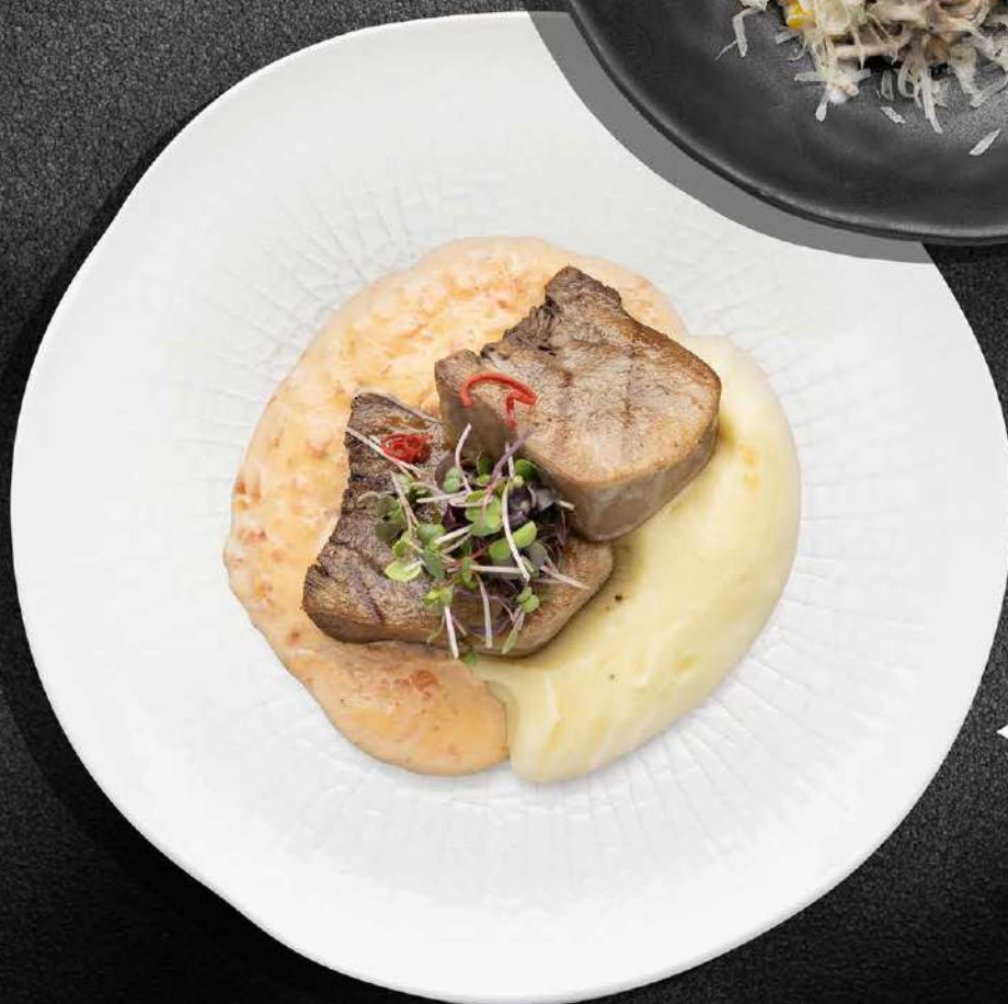
◀ ЯЗЫК С ТОМАТНЫМИ СЛИВКАМИ И ПЮРЕ