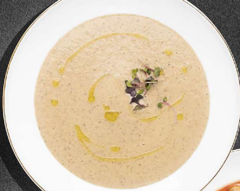
◀ СУП-КРЕМ ГРИБНОЙ С ТРЮФЕЛЬНЫМ МАСЛОМ