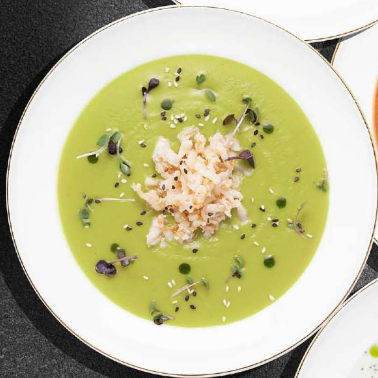
▲ СУП-КРЕМ С КРЕВЕТКОЙ