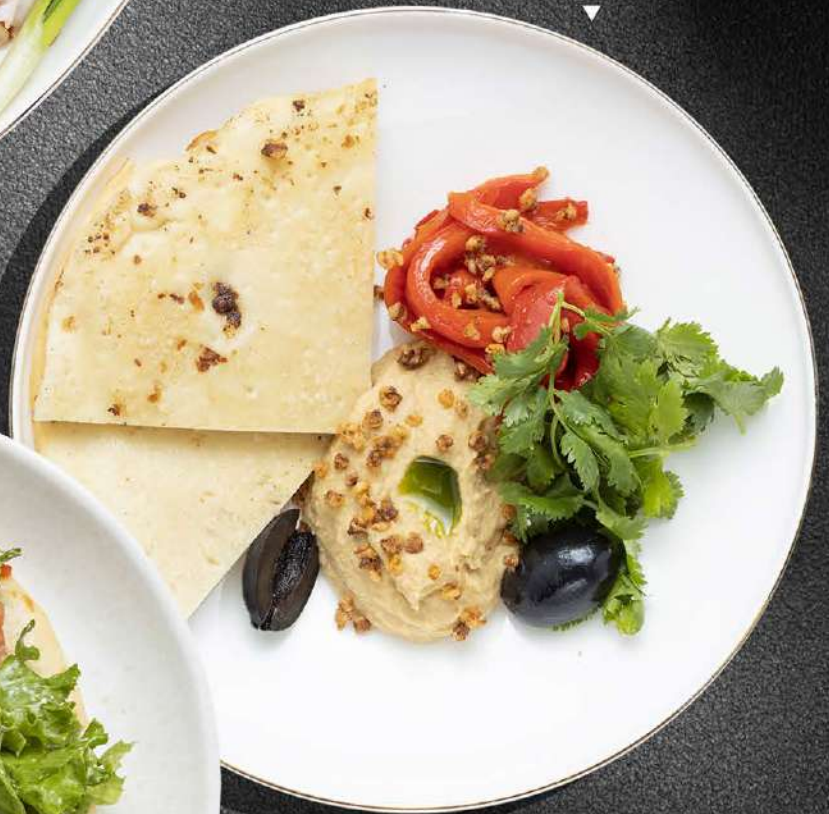
ПИТА С ХУМУСОМ И КОПЧЕНЫМИ ПЕРЦАМИ 490 160 гр.