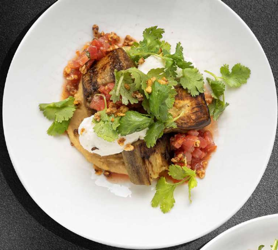
◀ БАКЛАЖАН С ХУМУСОМ И СЛИВОЧНЫМ СЫРОМ