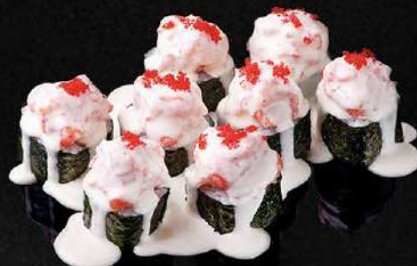
ТЕПЛЫЙ РОЛЛ С СЕВЕРНОЙ ФОРЕЛЮ И СЛИВОЧНЫМ СОУСОМ