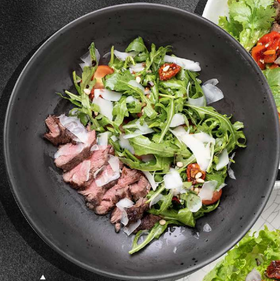
▲ СТЕЙК САЛАТ телятина с рукколой, томатами, пармезаном и перечно-оливковой заправкой