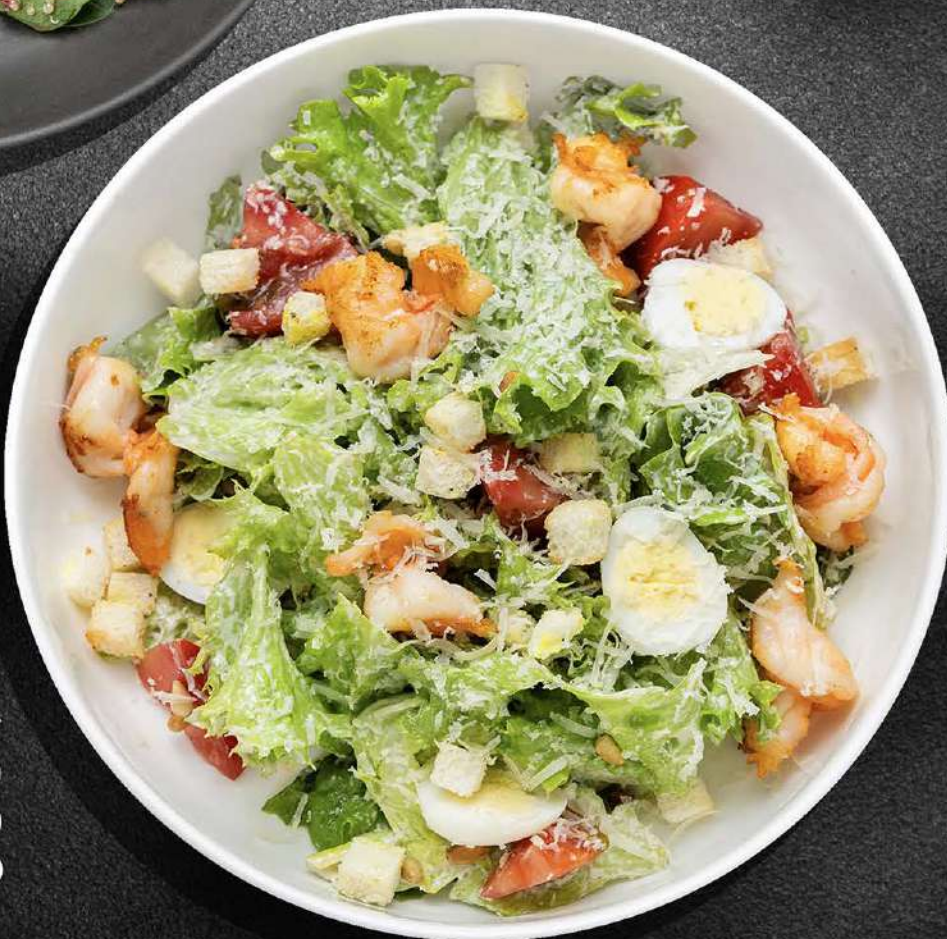
ЦЕЗАРЬ ▶ ИНДЕЙКА 650 ФОРЕЛЬ 850 КРЕВЕТКА 750 190 гр.