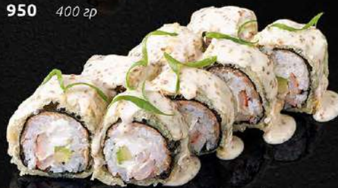
ЖАРЕНЫЙ РОЛЛ С КРЕВЕТКОЙ ПОД ОРЕХОВЫМ СОУСОМ