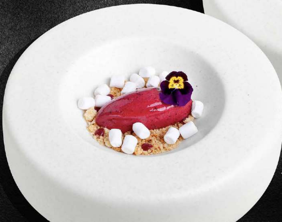
◀ ЯГОДНЫЙ СОРБЕТ 450