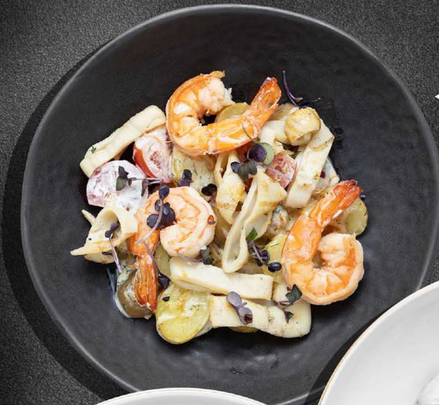
◀ МОРЕПРОДУКТЫ С КАРТОФЕЛЕМ