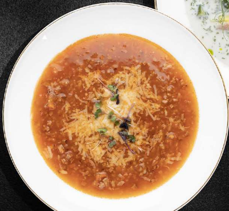
◀ СУП-ГУЛЯШ ИТАЛЬЯНСКИЙ