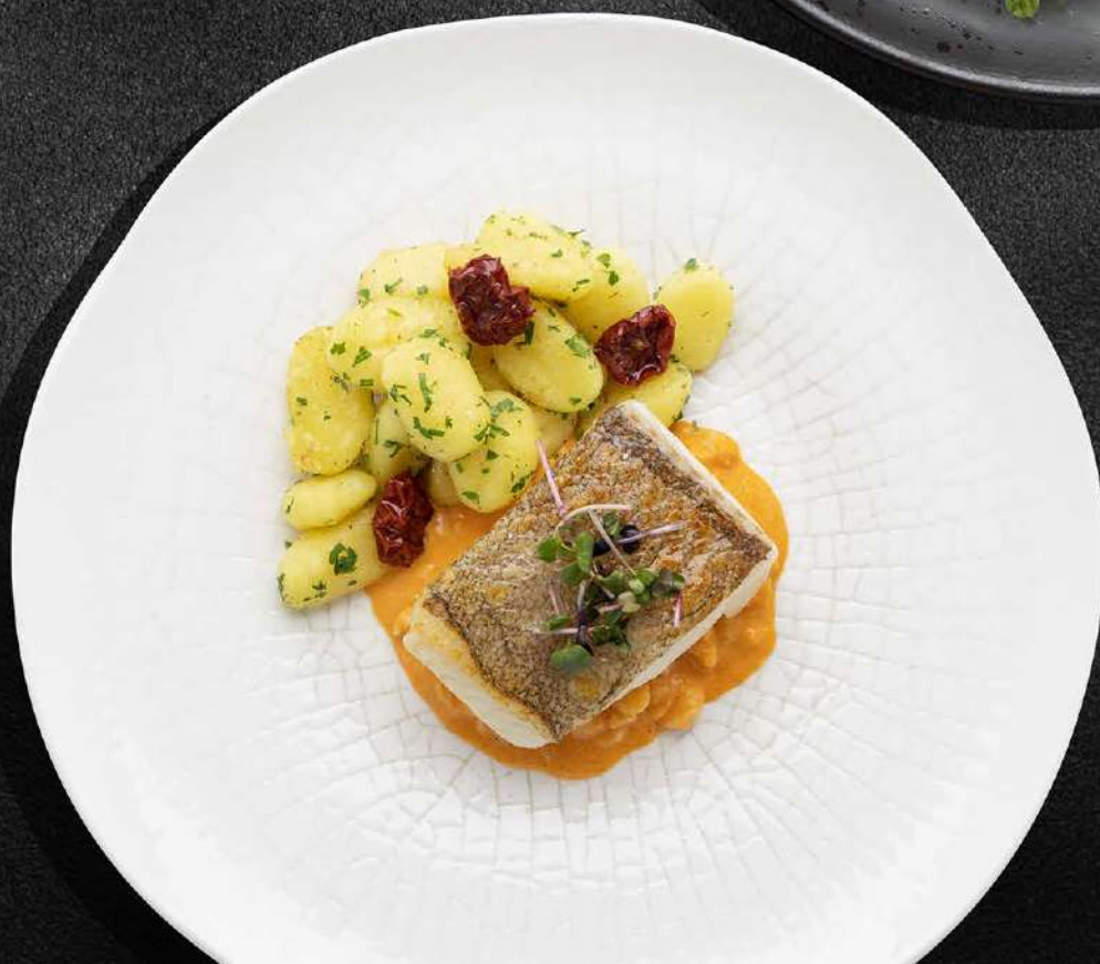
◀ ТРЕСКА С НЬОККАМИ И КРЕВЕТОЧНЫМ СОУСОМ 870 250 гр.