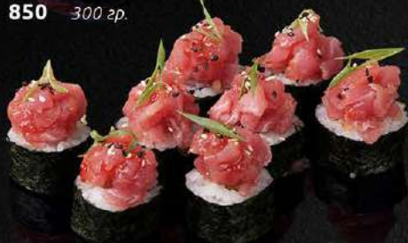
РОЛЛ С ТАРТАРОМ ИЗ ФИЛЕ ТУНЦА