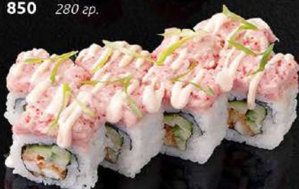
РОЛЛ С КРЕВЕТКОЙ ТЕМПУРА И ТАРТАРОМ ИЗ ТУНЦА