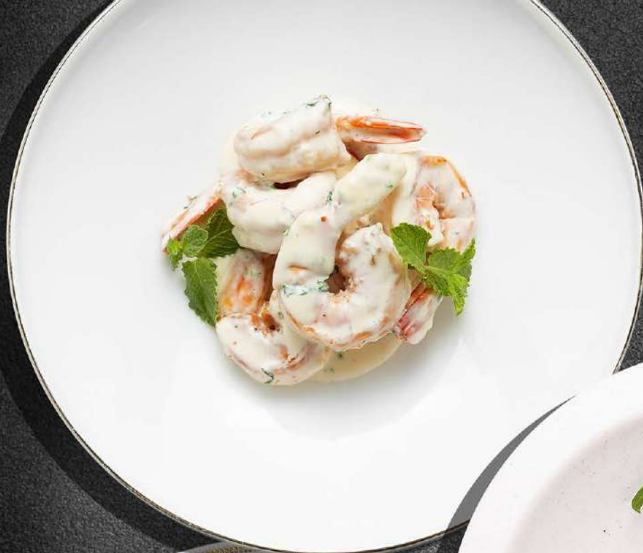
◀ КРЕВЕТКИ МЯТНЫЕ 750 200 гр.