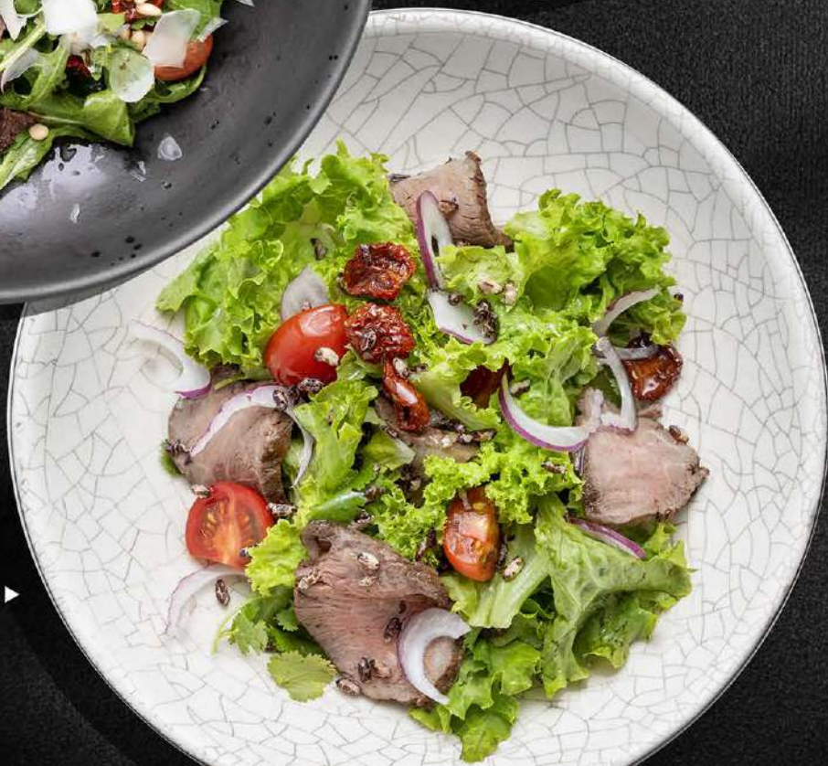
ОВОЩИ С РОСТБИФОМ ▶ и соусом из тунца