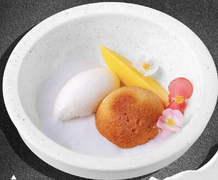
▲ НЕЖНЫЙ ПИРОГ С СЕЗОННЫМИ ФРУКТАМИ/ ЯГОДАМИ 470