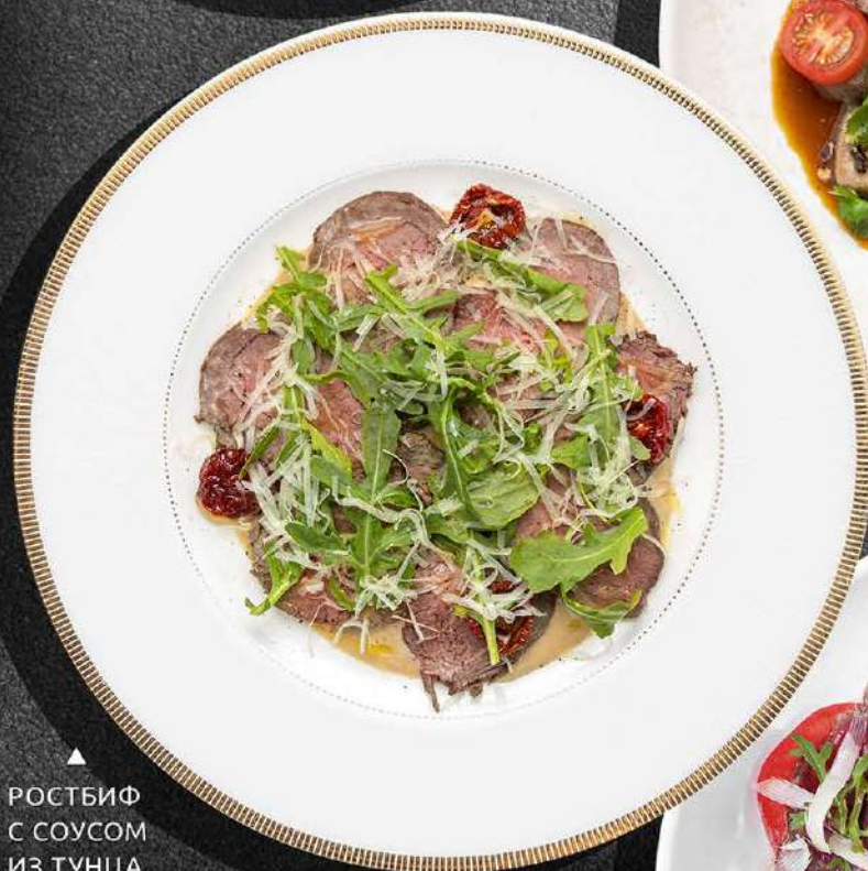
▲ РОСТБИФ С СОУСОМ ИЗ ТУНЦА