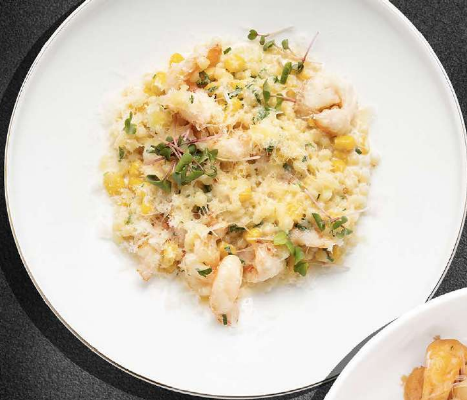
◀ ПИТИМ С КРЕВЕТКАМИ И КУКУРУЗОЙ