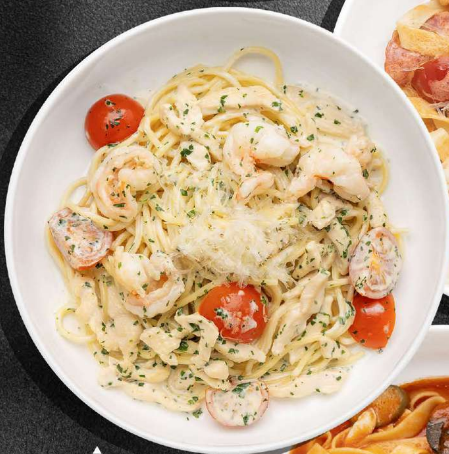
▲ СПАГЕТТИ С КРЕВЕТКАМИ И ТОМАТАМИ