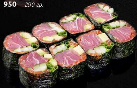
САШИМИ РОЛЛ ИЗ ТУНЦА, СЕВЕРНОЙ ФОРЕЛИ И ОВОЩЕЙ