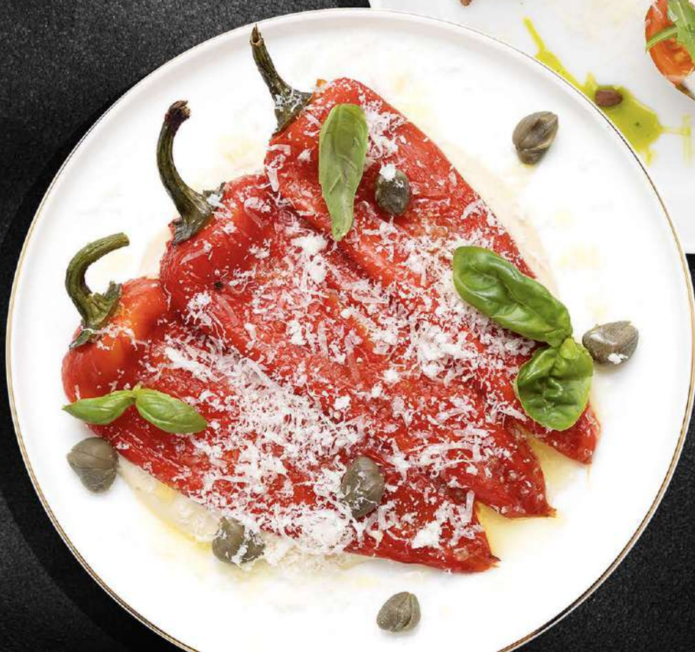
◀ ПЕРЦЫ РАМИРО С СОУСОМ ИЗ ТУНЦА