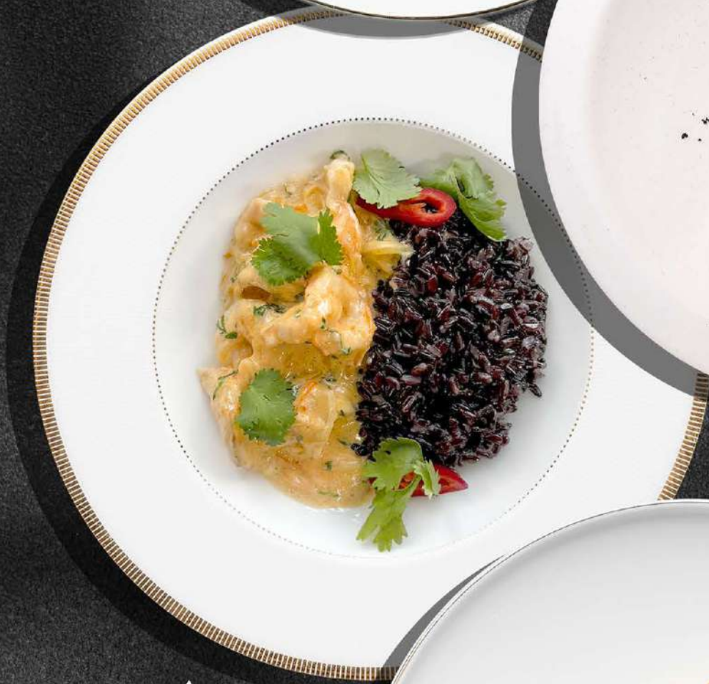
▲ КРЕВЕТКИ СЛИВОЧНЫЙ КИМЧИ 670 190 гр.