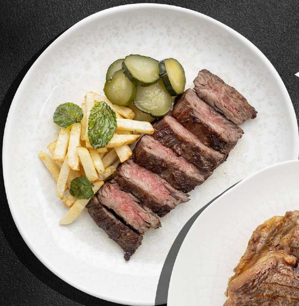
◀ СТЕЙК МЯСНИКА С ЖАРЕНЫМ СЕЛЬДЕРЕЕМ И МАРИНОВАННЫМИ ОГУРЧИКАМИ