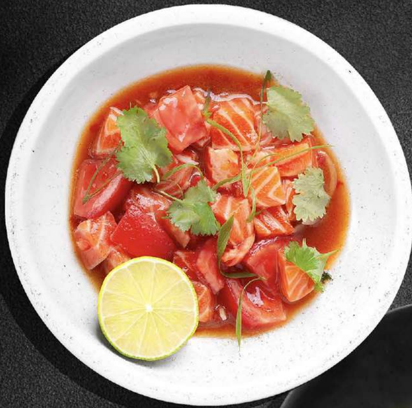
◀ СЕВИЧЕ ИЗ ФОРЕЛИ С ТОМАТАМИ И КРЫМСКИМ ЛУКОМ