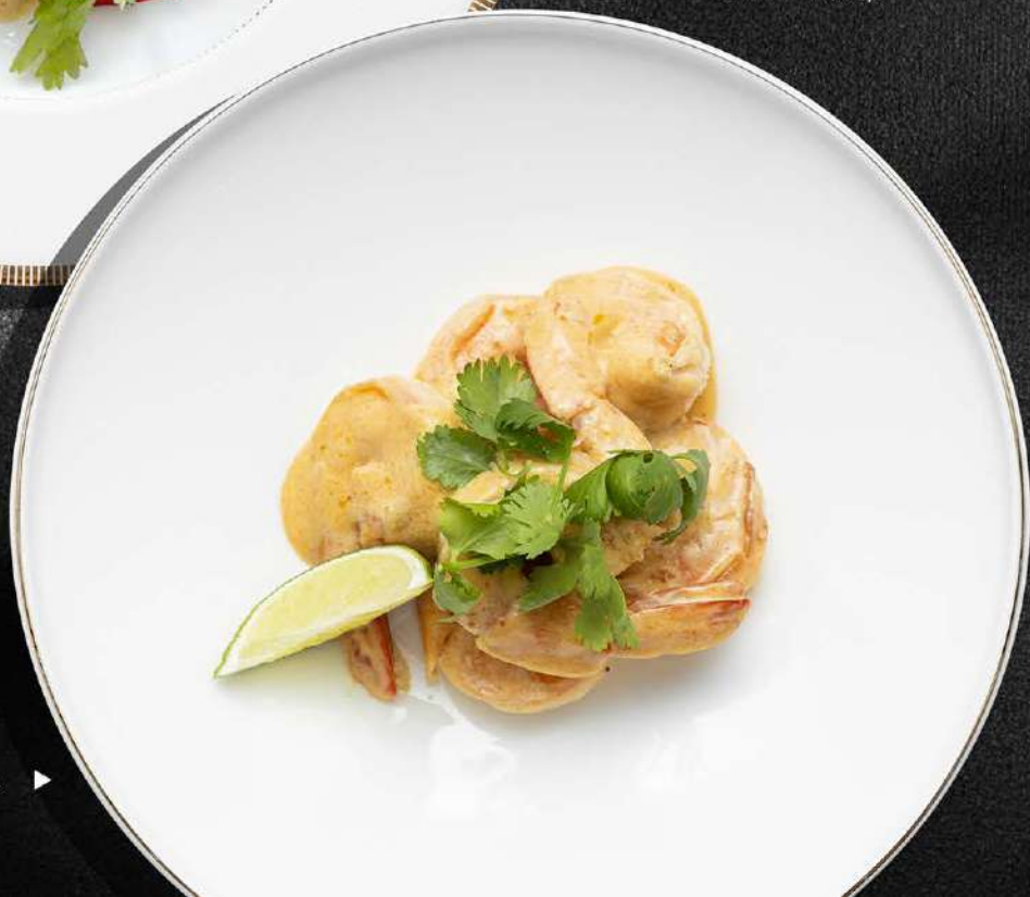
КРЕВЕТКИ ТОМ ЯМ 750 200 гр. ▶