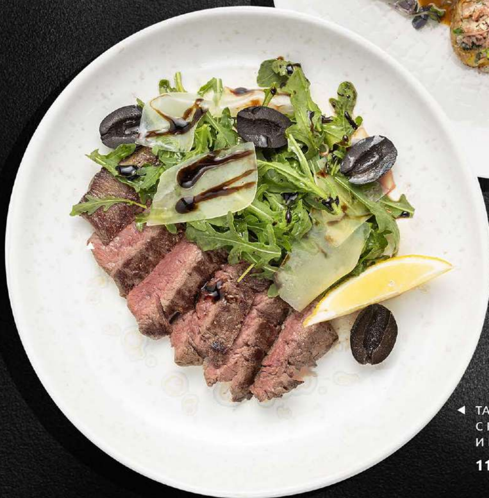
◀ ТАЛЪЯТА С РУККОЛОЙ И ПАРМЕЗАНОМ