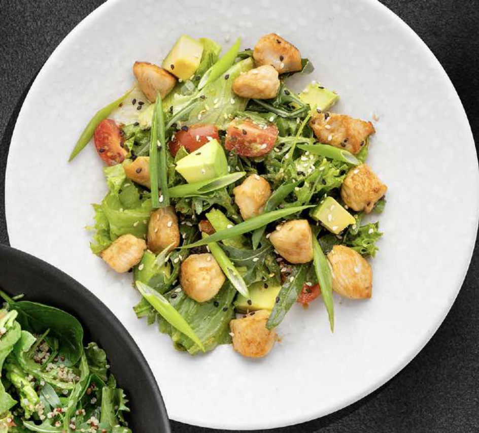
▲ ИНДЕЙКА КИМЧИ с авокадо, томатами, зеленым луком и имбирной заправкой 590 230 гр.