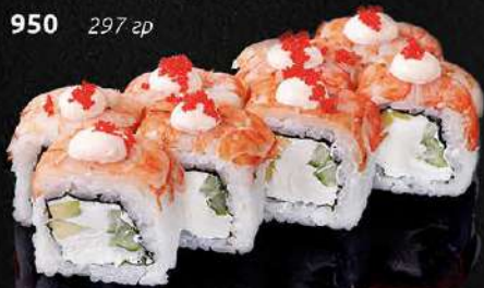
РОЛЛ С КРЕВЕТКОЙ, СЫРОМ И СОУСОМ СПАЙСИ