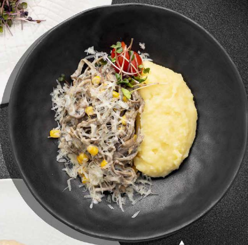
▲ ЯЗЫК В СЛИВКАХ С ПАРМЕЗАНОМ И КУКУРУЗОЙ