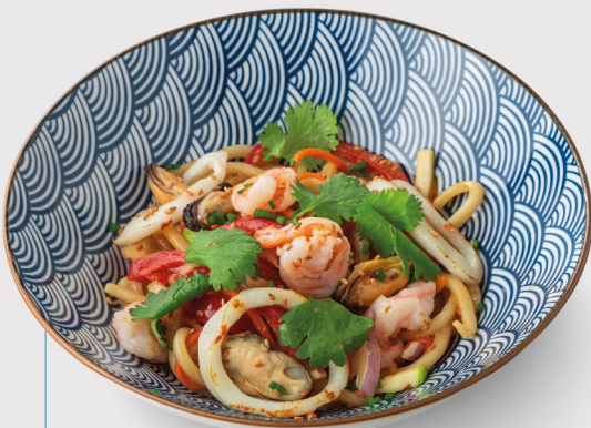
Лапша с морепродуктами 400 гр. 520.-