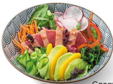
Салат с тунцом, авокадо и манго