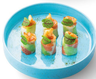
Ролл с лососем и креветками в рисовой бумаге