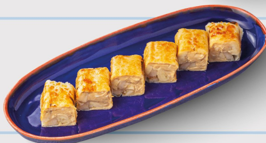
Фруктовый ролл с варёной сгущенкой 250 гр. 290.-