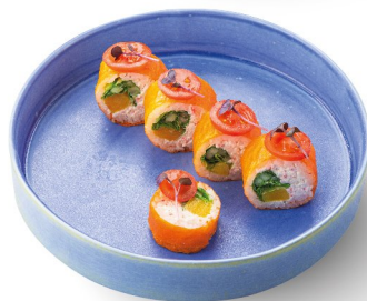
Ролл со снежным крабом и манго