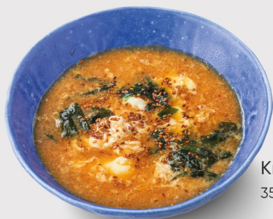
Кимчи 350 гр. 300.-