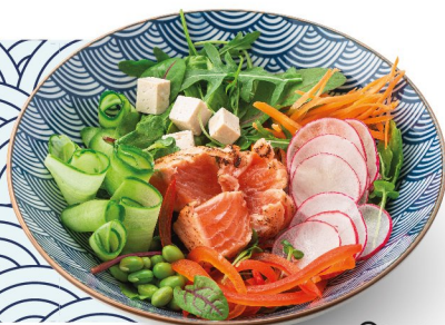
Салат с опаленным лососем и цитрусовым соусом