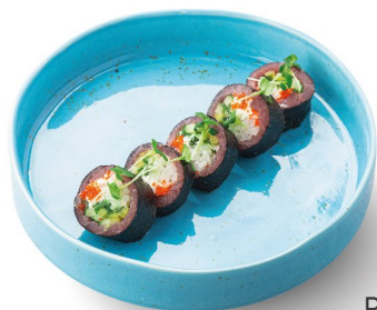
Ролл с тунцом