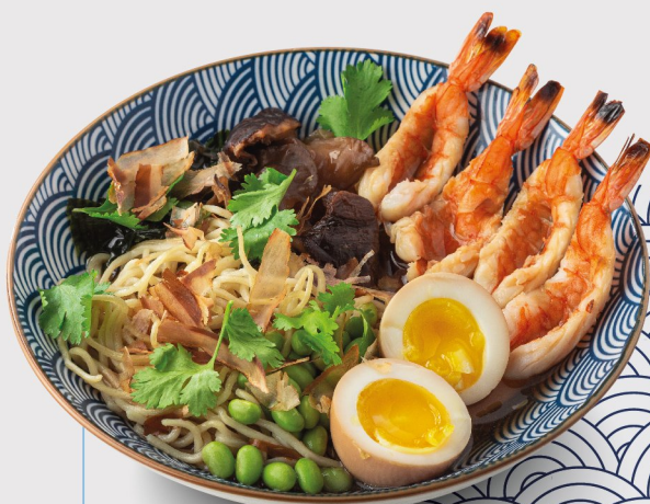
Рамен с креветками 600 гр. 520.-