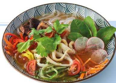
Холодный суп с кальмаром