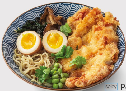
spicy Рамен с цыпленком кацу 630 гр. 400.-