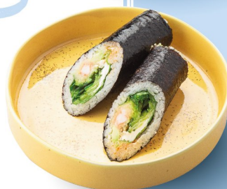
Суши ролло с креветками