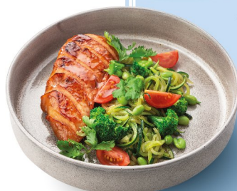
Куриная грудка в азиатском стиле с лапшой из цукини