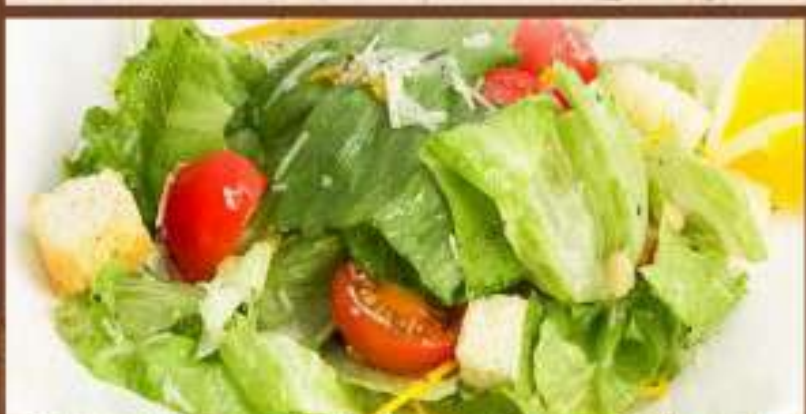
Салат «Легкий» 290 р. пармезан, томаты черри, салатный лист, пикантный соус 200 гр.

«Цезарь» с семгой гриль 330 р. маслины, гренки, соус, семга, сыр, салат, помидоры черри 200 гр.