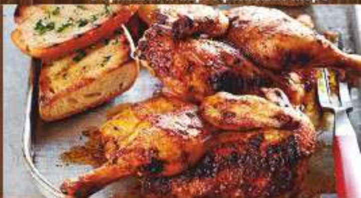
Цыпленок по-гальски подается с соусом Ткемали