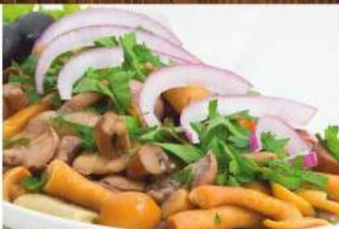
Ассорти из маринованных грибов