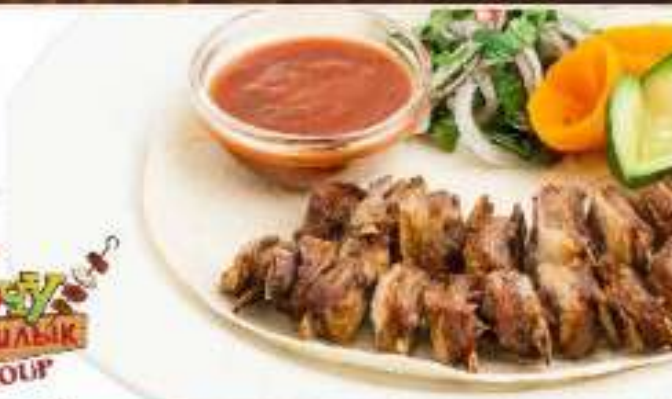
Шашлык «ребрышки ягненка» 270 р