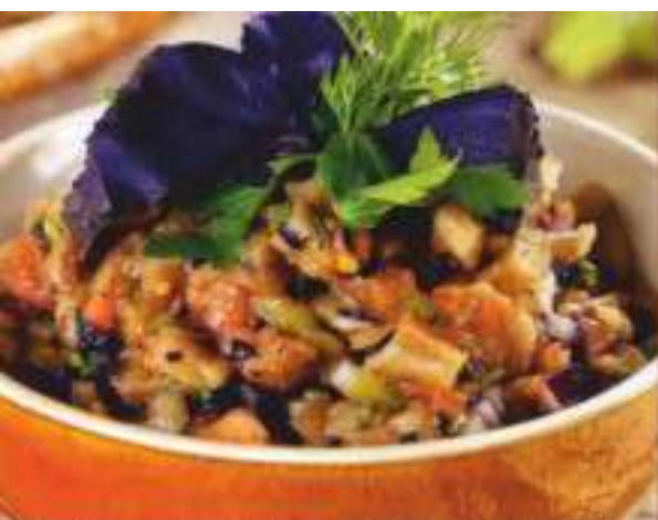
Мангал салат 260 р. запеченные овощи (баклажаны, помидоры, перец), зеленый лук 200 гр.