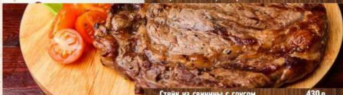
Стейк из свинины с соусом демиглас