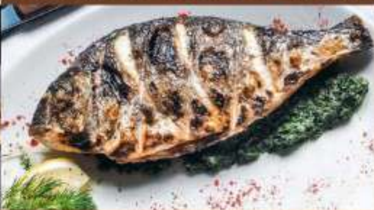
Дорадо на мангале со шпинатом