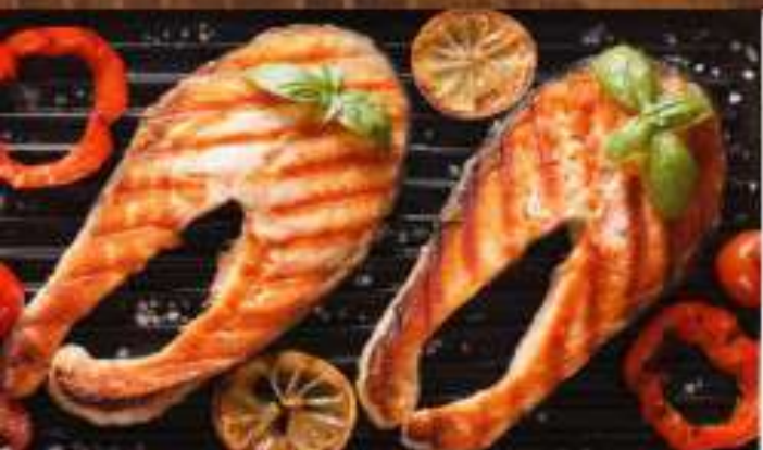
Шашлык из форели