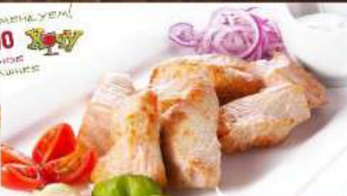
Шашлык из куриного филе