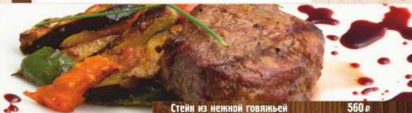
Стейк из нежной говяжьей вырезки с овощами гриль