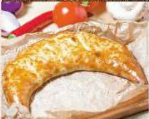
Хачапури по-гурийски 320 ₺ 350 гр. Пирог в форме полумесяца с сыром сулугуни и рубленым отварным яйцом