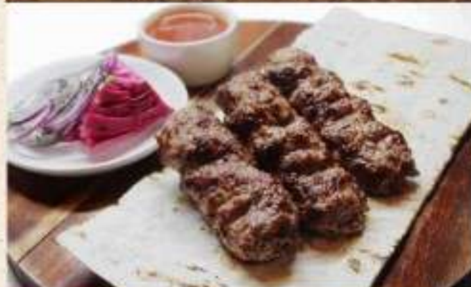
Люля-кебаб из телятины 330 р