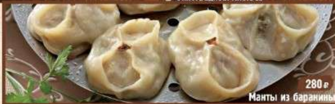
280 р Манты из баранины