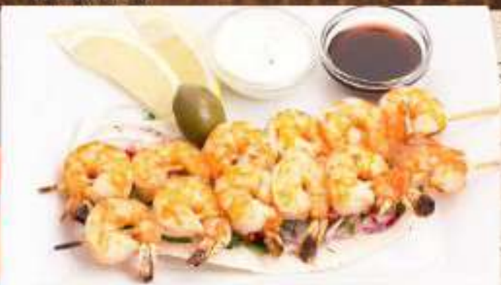
Тигровые креветки на мангале