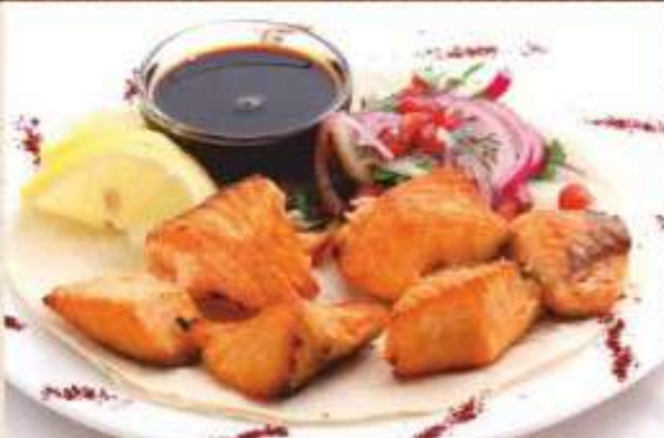
Шашлык из лосося