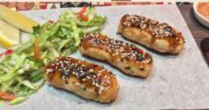
Фиш кебаб Люля-кебаб из лосося