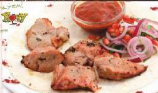
Шашлык из мякоти телятины 390 р