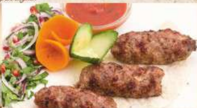
Люля-кебаб из ягненка 320 р