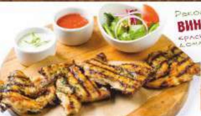
Шашлык из цыпленка