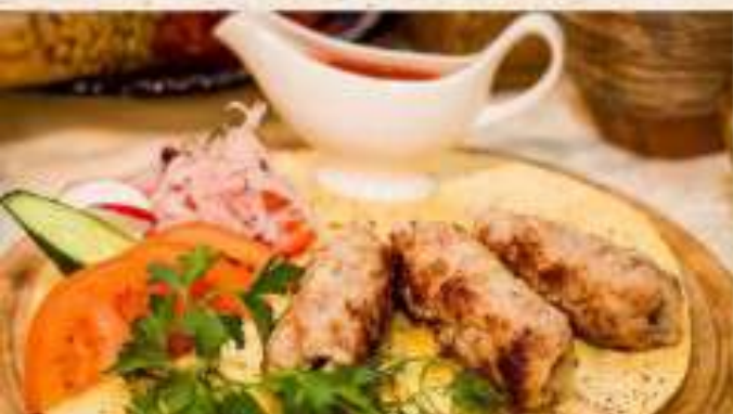
Люля-кебаб из свинины