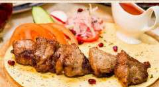
Шашлык из свиной шейки