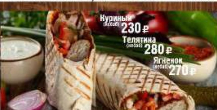
Куриный (с соусом) 230 р