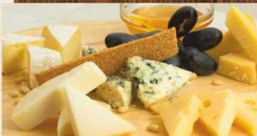
Европейские сыры с медом и кедровым орехом