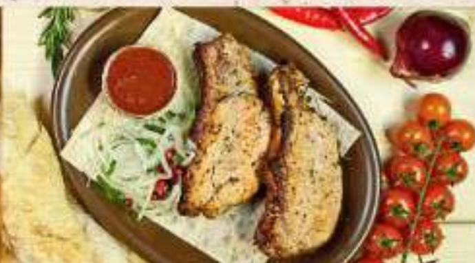
Шашлык из свиной корейки