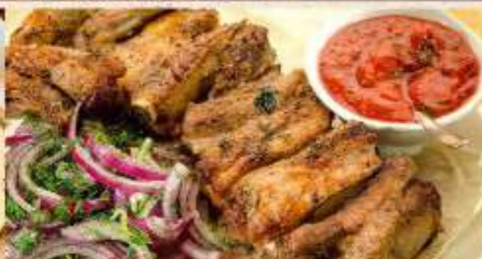
Свинина на ребре