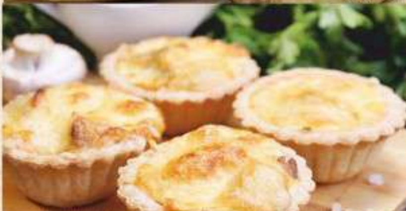
Жюльен грибной запеченный в тарталетках