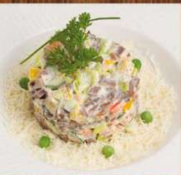
Салат из говяжьего языка 260 р. зелень, язык говяжий, салат, нура, сыр, огурцы соленые, грибы маринованные, заправлен домашним майонезом 200 гр.