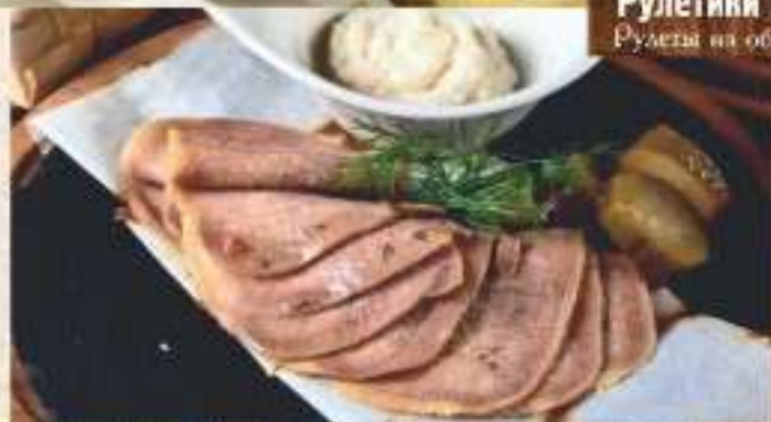
Телячий отварной язык