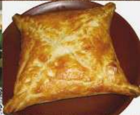
Хачапури слоеное 180 ₺ слоеное тесто, сыр сулугуни, сыр Гауда 250 гр.