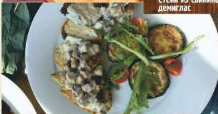
Куриное филе с жульеном из грибов в сливочном соусе с гарниром жареными цукини