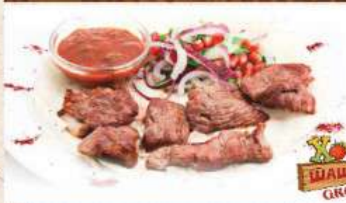
Шашлык из мякоти ягненка 390 р