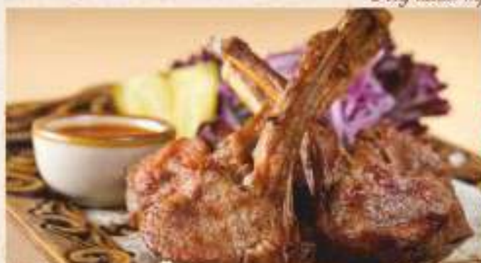
Шашлык по-азербайджански (каре ягненка) 440 р

Шашлыки из парного мяса, приготовленные на березовых углях в лучших традициях