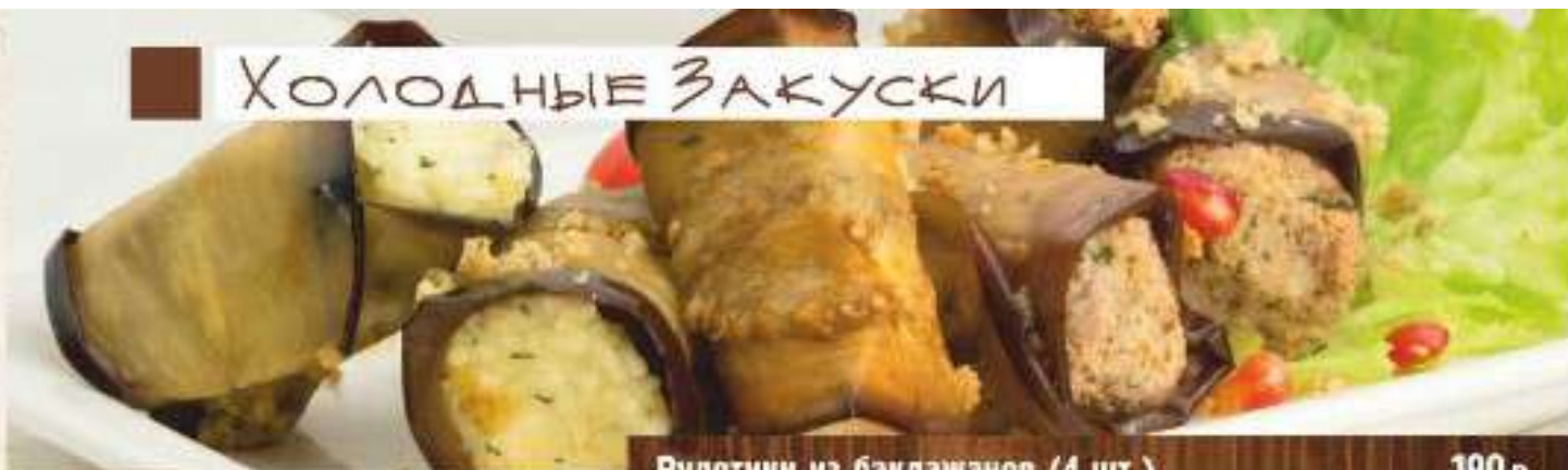
Рулетки из баклажанов (4 шт.)

Рулетки из обжаренных баклажанов с сырной начинкой из грецкого ореха