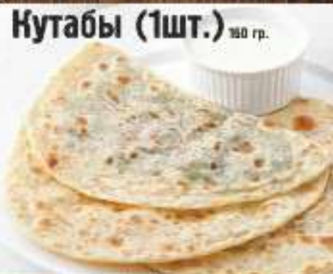
Кутабы (1шт.) 180 гр.