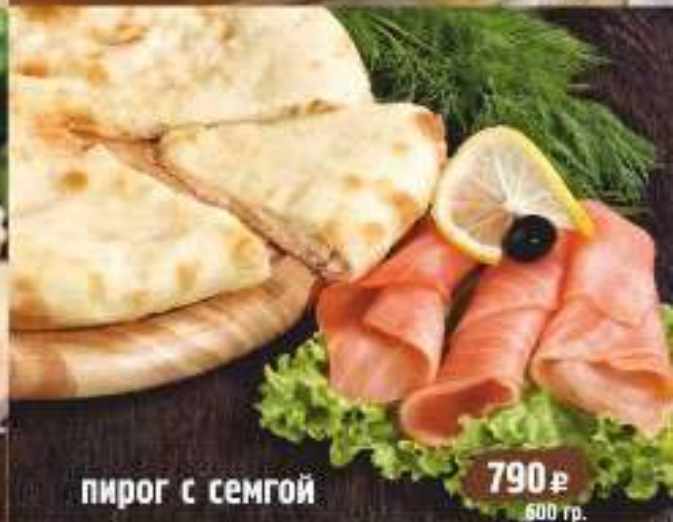
пирог с семгой