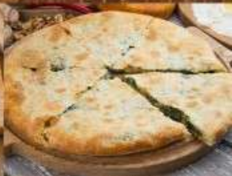
Хачапури со шпинатом и сыром сулугуни 380 ₺ 500 гр.