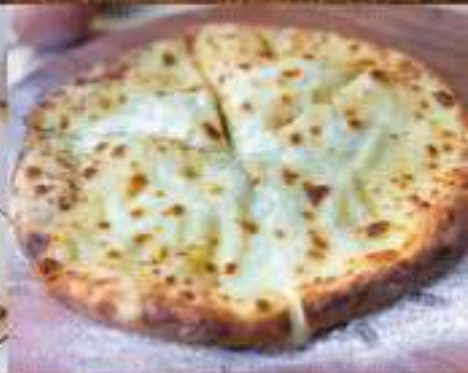
Хачапури тети Нины 350 ₺ 600 гр. открытый пирог с начинкой из взбитых с яйцом сыра сулугуни и имеретинского сыра