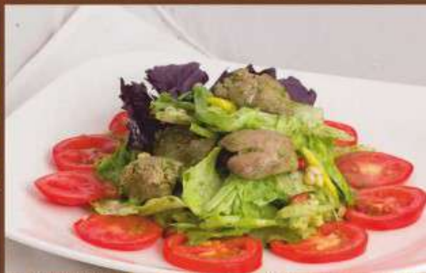
Теплый салат из куриной печени 330 р. салатный лист, манго, орех кедровый, помидор, стебель сельдерея, гранат, соус песто 200 гр.