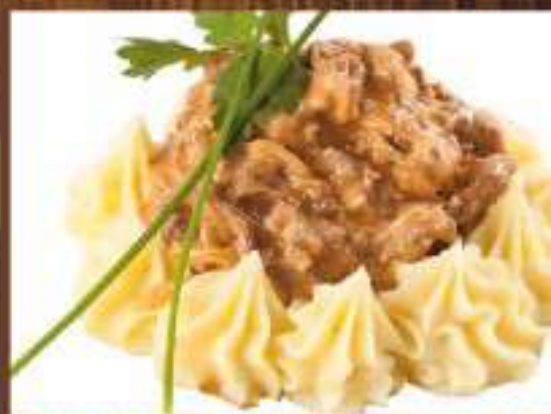
Бефстроганов из говяжьей вырезки с грибами и картофельным пюре