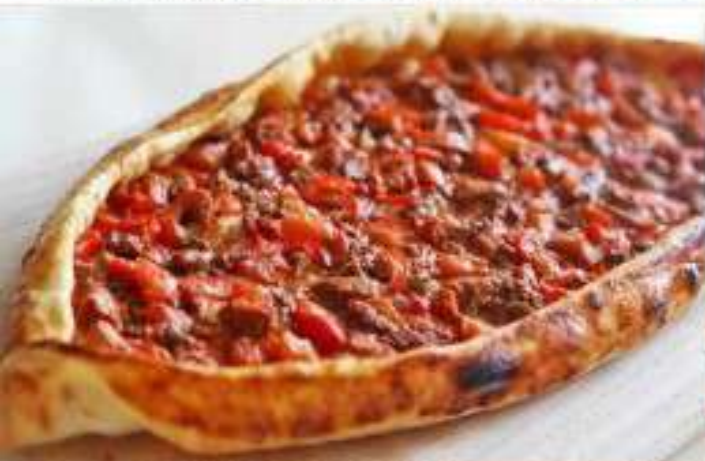
с мясом ягненка в томатном соусе 600 гр. 450 р