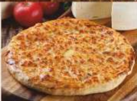
Хачапури по-мегрельски 300 гр. - 190 ₺ 600 гр. - 340 ₺ традиционный круглый пирог с начинкой и запеченным до золотистой корочки сыром сулугуни сверху