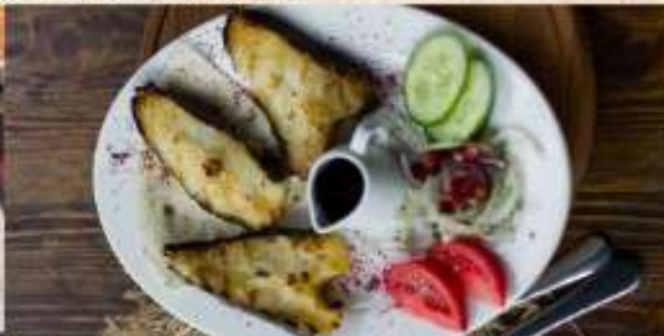
Осетрина на мангале