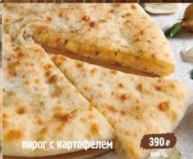
пирог с картофелем