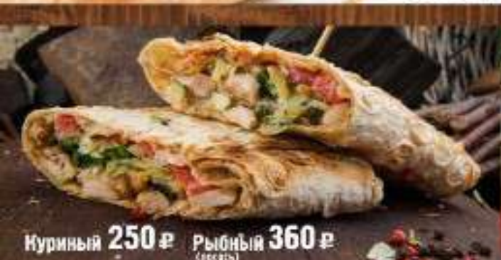
Куриный 250 р Рыбный 360 р (с соусом)