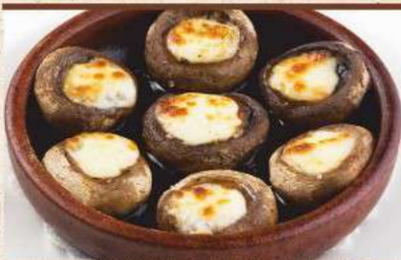
Шампиньоны, запеченные с сыром на кефи