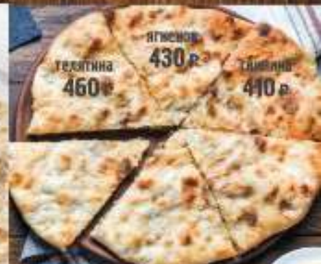
Кубдари 500 гр. Сочный домашний пирог с мясом на выбор и ароматными специями, лук репчатый, сливки, сыр сулугуни