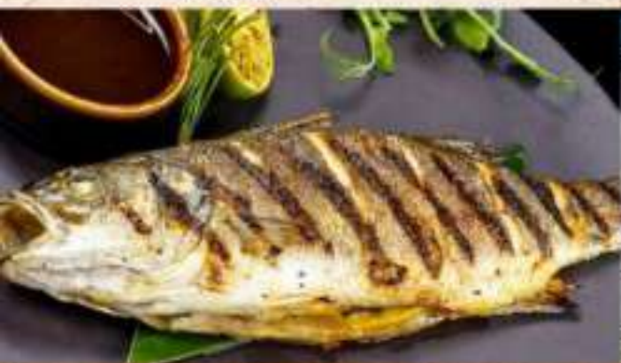
Сибас на гриле