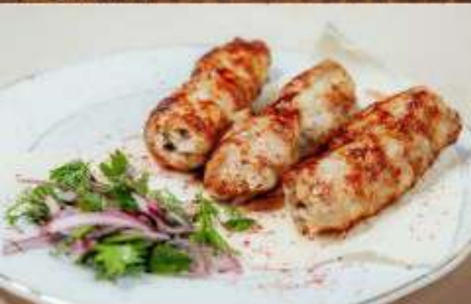
Люля кебаб из курицы