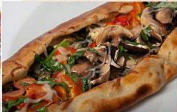
с шампиньонами и овощами 600 гр. 370 р