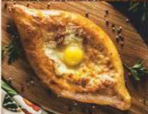
Хачапури по-аджарски 250 ₺ 350 гр. открытый пирог с начинкой из сыра сулугуни, слегка запеченным куриным яйцом и маслом