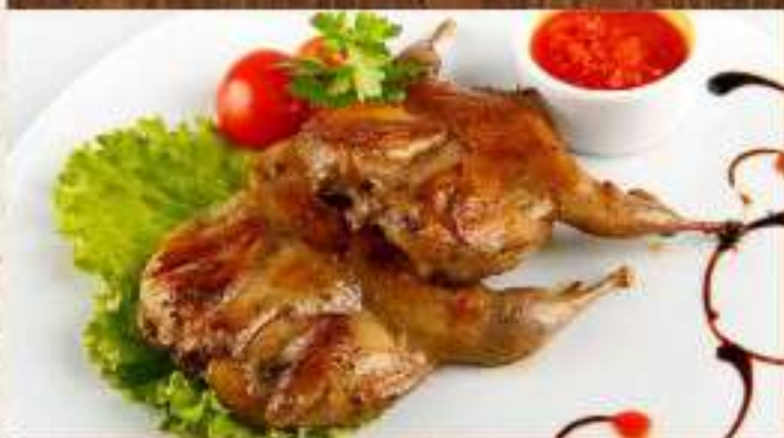
Перепелка на гриле