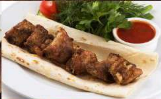
Шашлык «телячьи ребрышки» 280 р