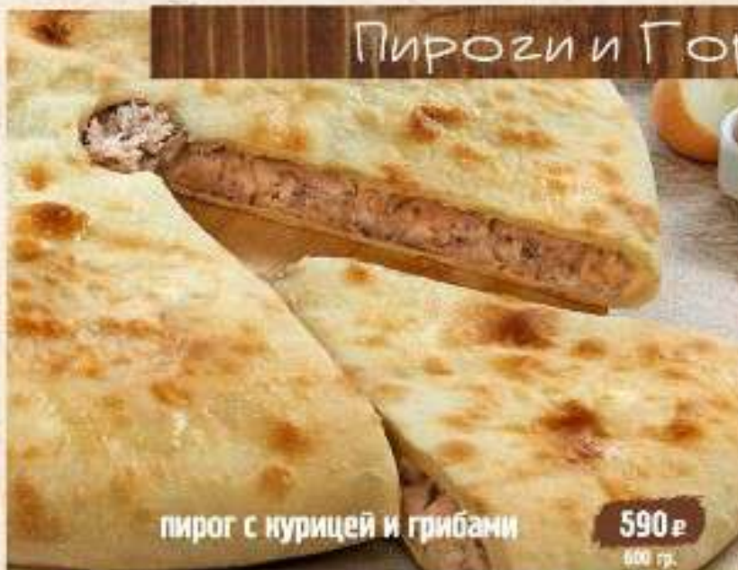
пирог с курицей и грибами