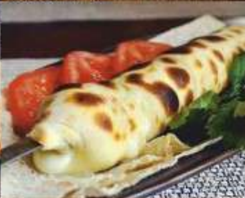
Хачапури на мангале 290 ₺ 300 гр.