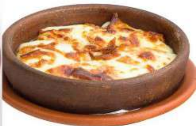
Жареный сыр сулгуни с запечеными помидорами