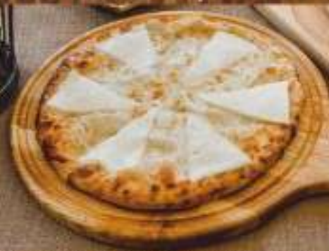
Хачапури по-царски 480 ₺ 600 гр. традиционный круглый пирог с начинкой и запеченным до золотистой корочки сыром сулугуни