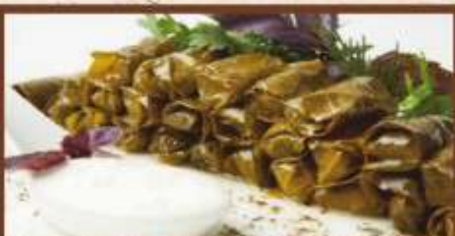
Долма из виноградных листьев