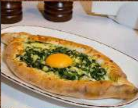
Хачапури по-аджарски со шпинатом 370 ₺ 500 гр. открытый пирог с начинкой из сыра сулугуни, слегка запеченным куриным яйцом, маслом и шпинатом