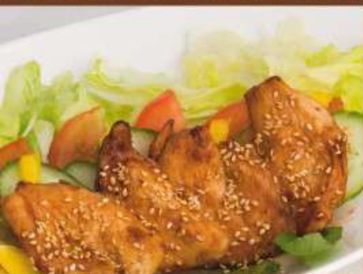
Теплый салат из куриного филе 320 р. жареное куриное филе, огурцы, перец болгарский, помидоры, салат Айсберг 200 гр.