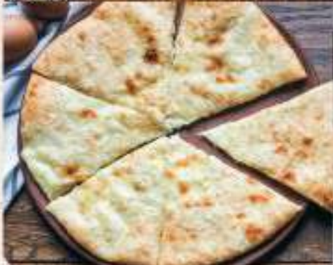
Хачапури по-имеретински 300 гр. - 170 ₺ 600 гр. - 300 ₺ круглый закрытый пирог с начинкой из сыра сулугуни и имеретинского сыра