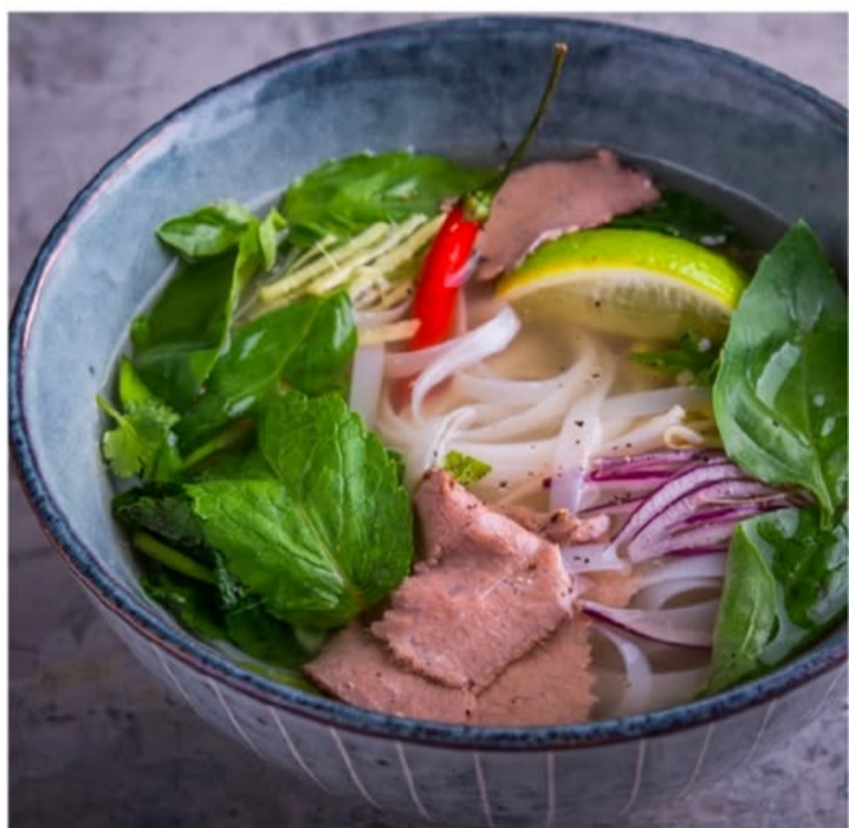
ФО БО 680.-