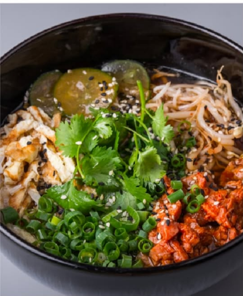
ГОРЯЧИЙ КУКСУ С ГОВЯДИНОЙ 580.-