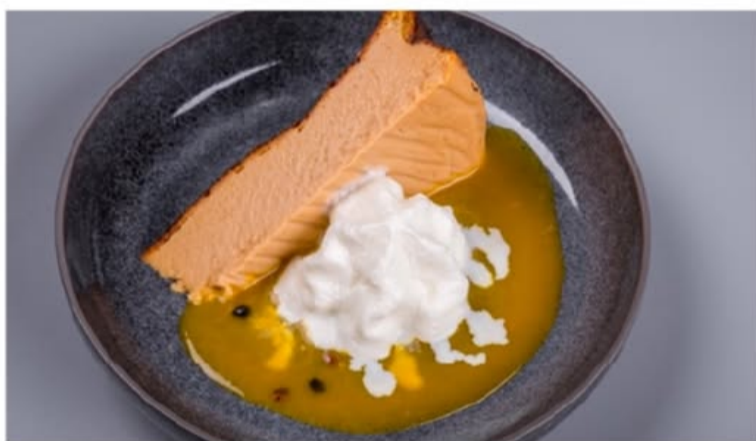
ИСПАНСКИЙ ЧИЗКЕЙК с соусом из маракуйи