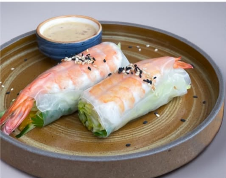
СПРИНГ-РОЛЛ с креветкой, манго и огурцом 540.-