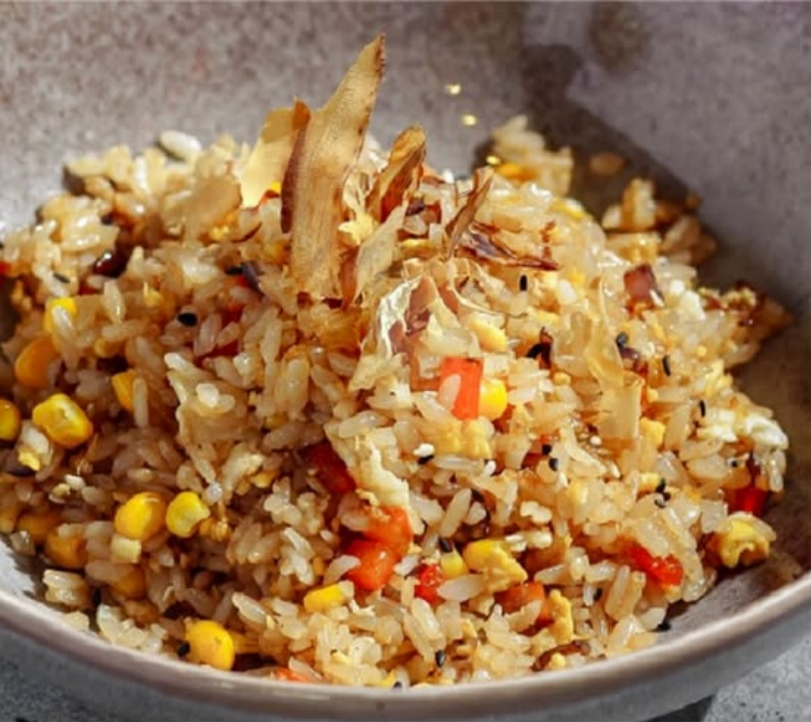
РИС НА ВОКЕ