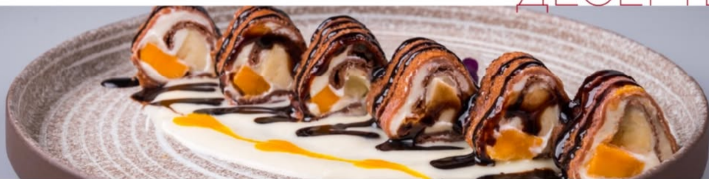
ШОКОЛАДНЫЙ РОЛЛ С МАНГО