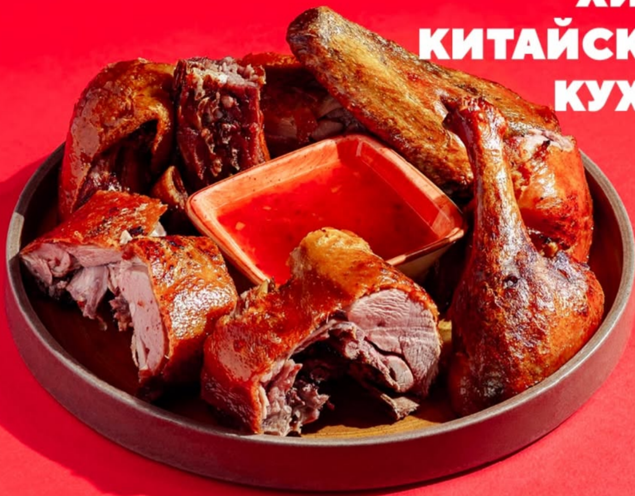
РУБЛЕННАЯ ХРУСТЯЩАЯ УТКА С СОУСОМ СВИТ ЧИЛИ