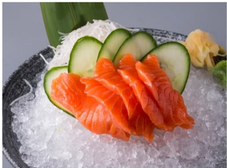
САШИМИ ИЗ ЛОСОСЯ 1240.-