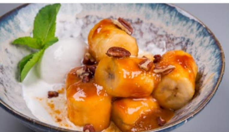
ЖАРЕНый БАНАН В СЛИВОЧНОЙ КАРАМЕЛИ