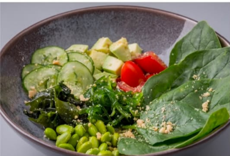
ЗЕЛЁНЫЙ САЛАТ С АВОКАДО, ЭДАМАМЕ, ВОДОРОСЛЯМИ, ОВОЩАМИ И АРАХИСОМ 540.-