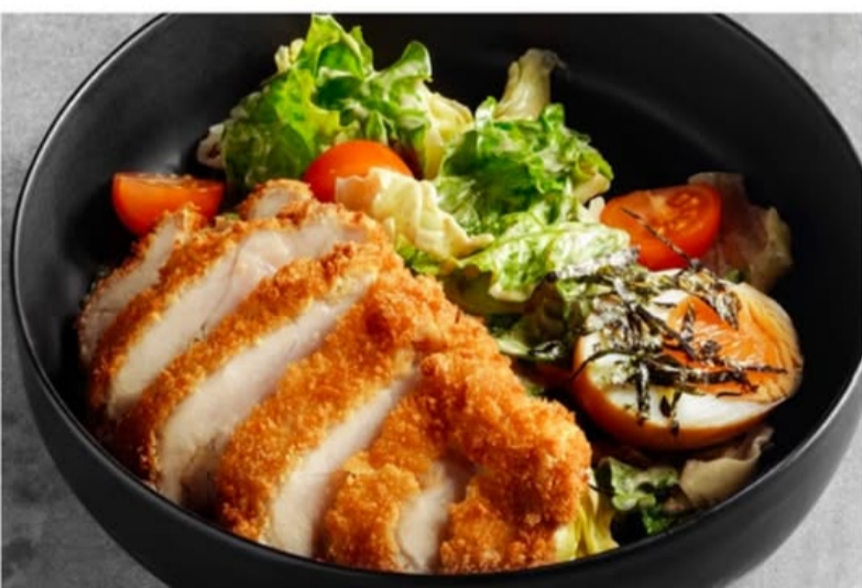
МИКС САЛАТА С ХРУСТЯЩИМ ЦЫПЛЁНКОМ 540.-