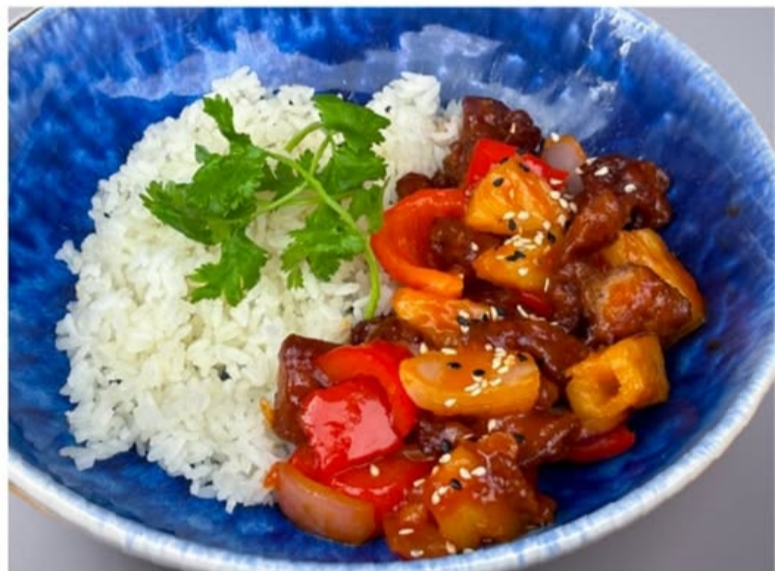
СВИНИНА В КИСЛО-СЛАДКОМ СОУСЕ с ананасом и овощами