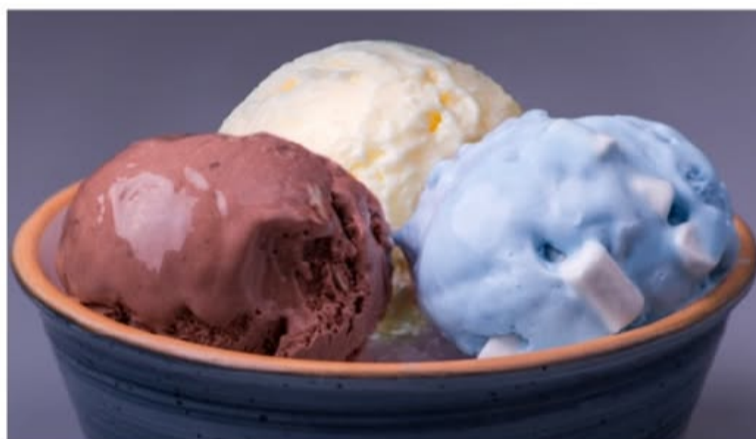
МОРОЖЕНОЕ: пломбир / бабл гам / шоколад