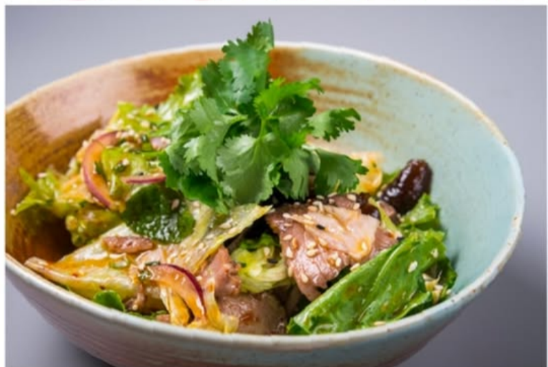
ЗЕЛЁНЫЙ САЛАТ С МАРИНОВАННОЙ ГОВЯДИНОЙ 640.-