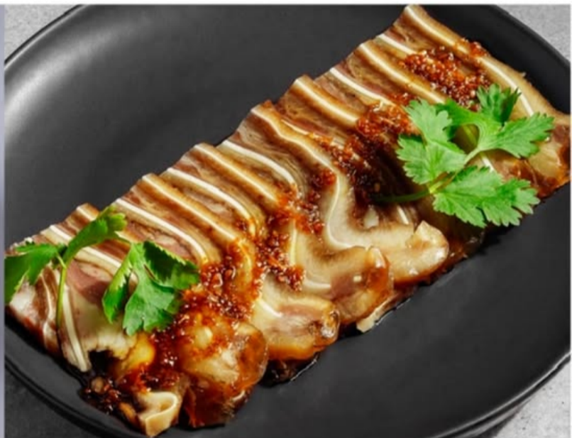
СВИНЫЕ УШКИ 380.-