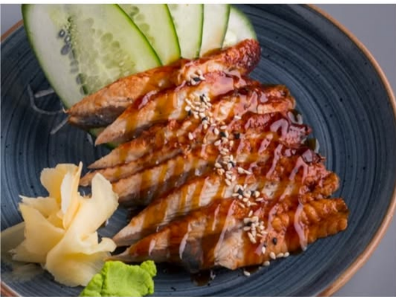
САШИМИ ИЗ УГРЯ 840.-