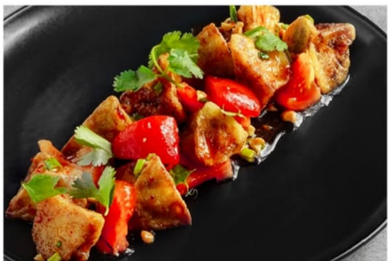
ТЕПЛЫЙ САЛАТ ИЗ БАКЛАЖАНОВ И СЛАДКИХ ПОМИДОРОВ с кисло-сладким соусом 540.-