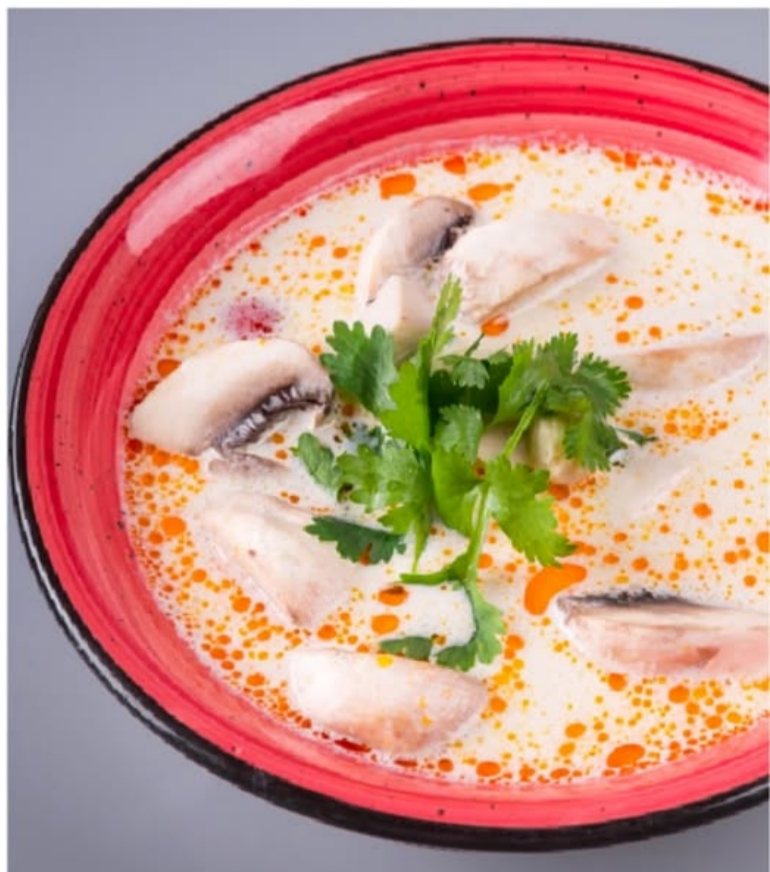
ТОМ КХА 740.-