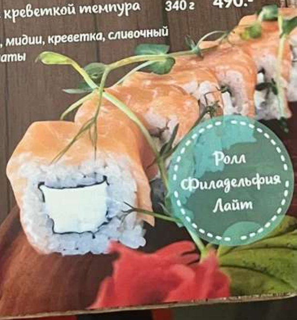
Ролл Филадельфия Лайт

Рис, нори, мидии, креветка, сливочный сыр, томаты