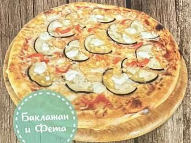
Баклажан и Фета

Пепперони, бекон, ветчина, шампиньоны, помидор, перец болгарский, маслины, сыр Гауда, сыр Моцарелла, соус томатный, пряное масло