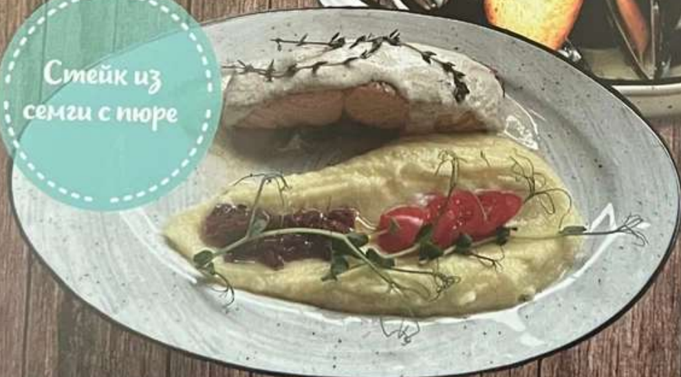
Стейк из семги с пюре