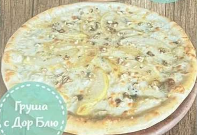
Груша с Дор Блю