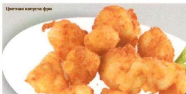
Цветная капуста фри