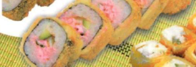
ГОРЯЧИЙ РОЛЛ С УГРЕМ