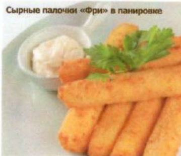
Сырные палочки «Фри» в панировке