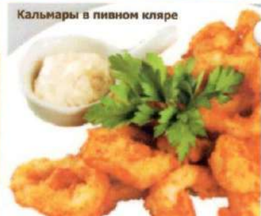
Кальмары в пивном кляре