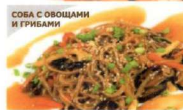
СОБА С ОВОЩАМИ И ГРИБАМИ