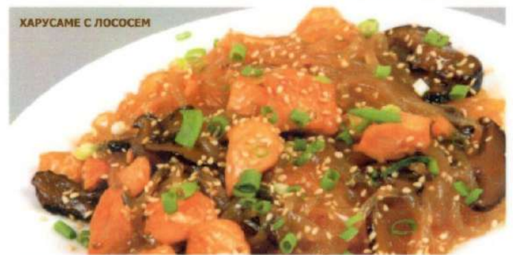
ХАРУСАМЕ С ЛОСОСЕМ