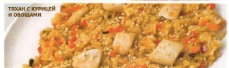
ТЯХАН С КУРИЦЕЙ И ОВОЩАМИ