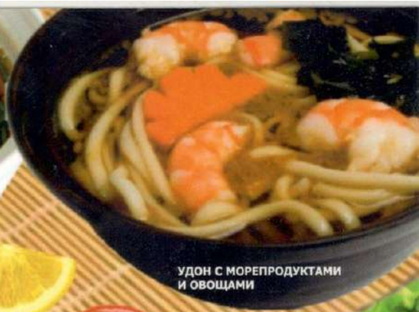
УДОН С МОРПРОДУКТАМИ И ОВОЩАМИ