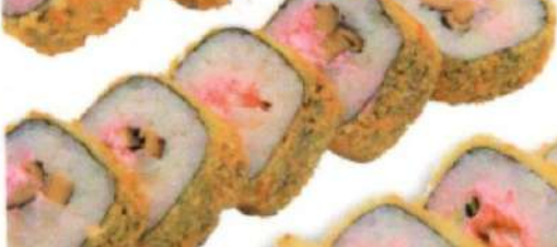
ГОРЯЧИЙ РОЛЛ С КАЛЬМАРОМ