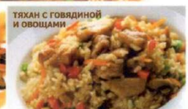
ТЯХАН С ГОВЯДИНОЙ И ОВОЩАМИ