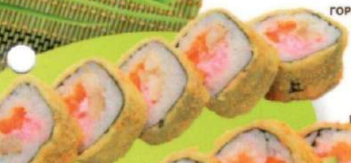
ГОРЯЧИЙ РОЛЛ С КУРИЦЕЙ