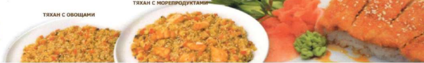
ТЯХАН С МОРПРОДУКТАМИ