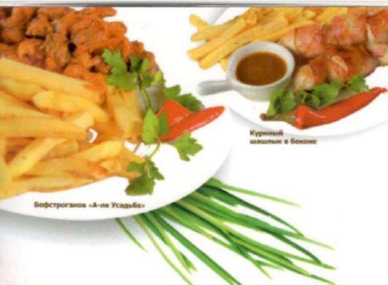
Куриный шашлык в беконе