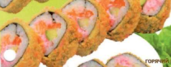
ГОРЯЧИЙ РОЛЛ С ЛОСОСЕМ