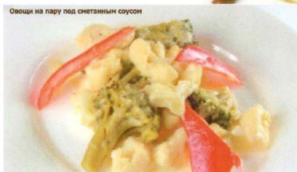
Овощи на пару под сметанным соусом