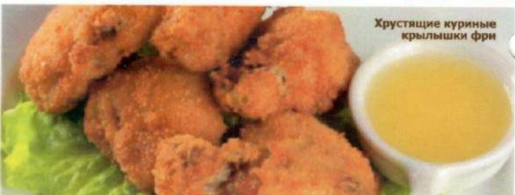
Хрустящие куриные крылышки фри