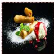
Спринг ролл с яблоком/ с ананасом 290 рублей Рулетки из рисового теста с начинкой из яблока или ананаса подается с мороженым 3 шт. 30/10/ 3 шт./30/10 191/194 ккал