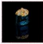
Суши Спайс на выбор - мидии, лакедра, лосось, гребешок, окунь, креветки коктейльные, копченый угорь, тунец, осьминог 160 рублей Острые суши "Тункан" с начинкой на выбор 15/15 г 70-85 ккал