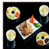
Утка по-пекински 2500 рублей

Половинка утки с блинчиками, овощным гарниром с легким супом и соусами трех видов