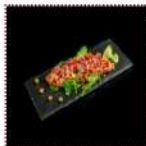
Тар-тар из тунца 600 рублей Мелко рубленное филе тунца с каперсами и луком