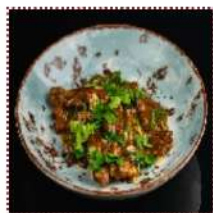
Говядина сингапурская 650 рублей

Говядина в панирровке, припущенная соев, с перчиком чили с добавлением кинзы