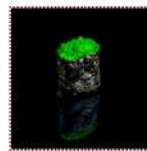
Масаго васаби 130 рублей Суши с икрой тобиго маринованной в васаби 10/15 г 46 ккал