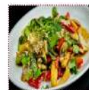
БОК китайский с грибами 350 рублей Капуста китайская, фасоль стручковая, перец сладкий, мини кукуруза, перец чили, киноа, грибы, растительное соевое "Мокиш", чеснок, горчица зернистая, кунжутное семя 250 г 119 ккал