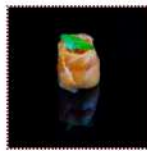
Гламур 170 рублей Суши с лососем и икрой 10/15 г 34 ккал