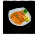
Лосось маринованный 630 рублей Нежные ломтики лосося, маринованные в апельсиновом и лимонном соке