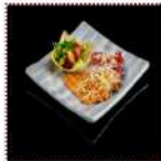
Карпаччо из лосося 600 рублей Нарезка из свежей рыбы подается с салатом в корзинке из рисового блина