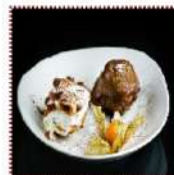
Профитропи 290 рублей Воздушное тесто с нежным легким муссом из темного и белого шоколада 2 шт. 290 ккал