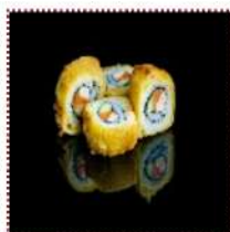
Тайфу маки 350 рублей

Мяса краба, лосось, огурец, обернут сыром