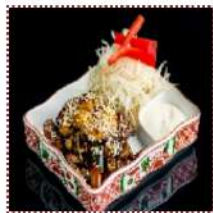
Бута сёга яки 490 рублей

Нежная свинина с грибами и луком порей в имбирном соусе с японским майонезом и стейк-салатом