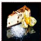
Чиз-кейк с шоколадной крошкой и орехами 330 рублей Классический чиз-кейк со сливочной карамелью, кусочками шоколада и ореха лекан 95 г 337ккал