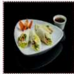
Нэм со свинойной 330 рублей Сочная закуска с овощами, в сочетании со свинойной и крахмальной паштой