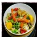
Ясай теппан-яки 290 рублей Очень вкусное, яркое блюдо из овощей, с максимальной термической обработкой 150 г 93 ккал