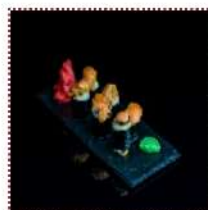
Тёплый ролл с мидиями 450 рублей

Мидии, омлет слоеный, сыр, водоросли нори, рис