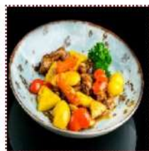
Свинина по-тайски 480 рублей

Маринованные кусочки свинины, обжаренные во фритюре, в остром соусе с болгарским перцем и ананасом