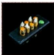
Горячий ролл «Две стихии» 550 рублей

Ролл с лососем и угрем, подается с острым и сливочным соусами