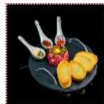
Тар-Тар из говядины 550 рублей Фирменный рецепт нежной говядины вырезки, икры лосося и перепелиного яйца. Подается с тостами и миксом добавок.