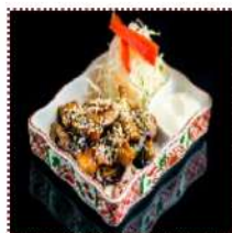
Тори терияки 390 рублей

Куриное филе под соусом терияки с японским майонезом и стейк-салатом