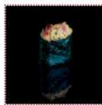
Кани/Кани спайс/ Запеченный Кани 170 рублей Суши с крабовым мясом(острый или запеченный на выбор) 10/15 г 39 ккал