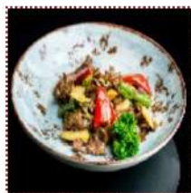
Говядина в устричном соусе 650 рублей

Обжаренная говядина с фасолью, болгарским перцем и бамбуком под устричным соусом