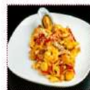
Яши удон с морепродуктами 550 рублей Пшеничная лапша в остром соусе с ароматным вкусом морепродуктов 200 г 164 ккал