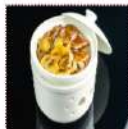
Говкю 350 рублей Паровый рис с кусочками нежной говядины под устричным соусом 250 г 205 ккал