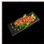
Тар-тар из окуня 550 рублей Мелко рубленное филе окуня с каперсами и луком