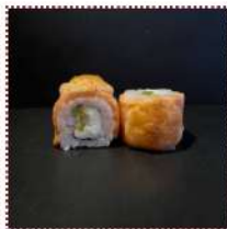
Запеченная Филадельфия 650 рублей

Лосось, сыр сливочный, авокадо, тобико, японский майонез