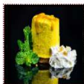
Пирожное "Манго-маракуйя" 290 рублей Нежное суфле из манго с ароматной начинкой из маракуйи на корже из кокосовой стружки 140 г 295 ккал