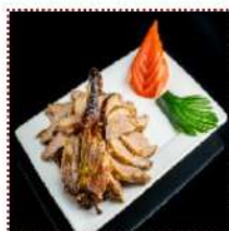
Утка по-пекински 2500 рублей

Половинка утки с блинчиками, овощным гарниром с легким супом и соусами трех видов