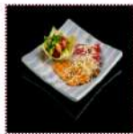
Карпаччо-Ассорти 600 рублей Нарезка из свежей рыбы подается с салатом в корзинке из рисового блина