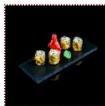
Мидори маки 330 рублей