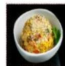
Техан 410 рублей Японский "Техан" - очень ароматное, сытное и необыкновенно вкусное блюдо 200 г 226 ккал