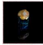
Запеченные спайс суши на выбор - мидии, угорь, гребешок, лакедра, лосось, окунь 170 рублей Острые запеченные суши "Тункан" с начинкой на выбор 30/30/1/2/3 г 71-86 ккал