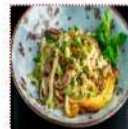
Лапша китайская жареная 390 рублей Традиционная лапша "БОК" с кусочками свинины и овощами 200 г 166 ккал