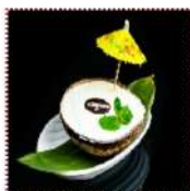
Мороженое в "Кокосе" 350 рублей Мороженое с мякотью кокосового ореха 80 г 193 ккал