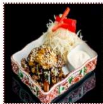
Бифу сёга яки 610 рублей

Нежная говядина с грибами и луком порей в имбирном соусе с японским майонезом и стейк-салатом