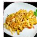
Яши удон 290 рублей Классическая японская пшеничная лапша 200 г 171 ккал