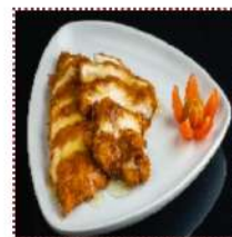
Курица в лимонном соусе 390 рублей

Нежное филе курицы в панировке, обжаренное до золотистой корочки под лимонным соусом