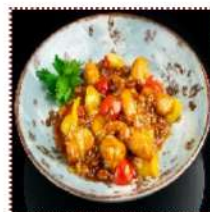
Курица КУНГ-ПАО 390 рублей

Традиционное китайское блюдо из куриного филе, сладкого перца и арахиса.