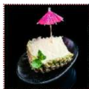
Мороженое в ананасе 350 рублей Ананасовое мороженое с кусочками ананаса 100 г 172 ккал