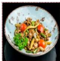
Утиная грудка с овощами 560 рублей

Утиная грудка с перцем, фасолью, молодой кукурузой и грибами