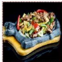
Баранина на тхе-пане 850 рублей

Нежная сочная обжаренная баранина с овощами