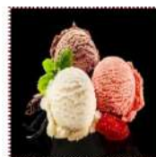
Мороженое в ассортименте 150 рублей Ванильное, шоколадное, фисташковое, сорбет лимон-лайм 50 г 131-217 ккал