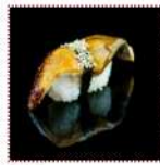
Унаги 160 рублей Суши с угрем 12/15 г 67 ккал