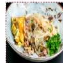
Лапша рисовая жареная 390 рублей Традиционная рисовая лапша "БОК" с кусочками свинины и овощами 200 г 183 ккал