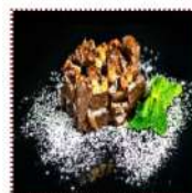
Брауни "Рокслайд" 290 рублей Два слоя сочного шоколада брауни, пропитанные густой карамелью, украшен орехами pekan 95 г 480 ккал