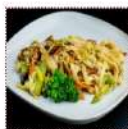
Яши удон токи 350 рублей Классическая японская пшеничная лапша с добавлением куриного филе 200 г 165 ккал