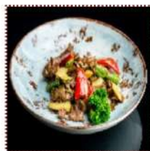
Баранина в устричном соусе 700 рублей

Обжаренная баранина с фасолью, болгарским перцем и бамбуком под устричным соусом