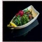
Кайсо сарыада 450 рублей Салат из пяти видов морских водорослей, с оригинальным ореховым соусом