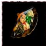
Канпай сарыада 450 рублей Традиционный салат ассорти