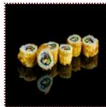
Кииро 410 рублей