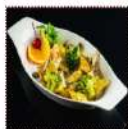
Жареные баклажаны в чесночном соусе 490 рублей Нежные кусочки баклажанов, тушенные с чесноком, грибами и брокколи 200 г 184 ккал