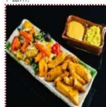
Тори теппан Яки 550 рублей

Обжаренное куриное филе с овощами и ореховым соусом гамадари