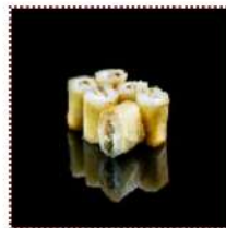
Хрустящий сливочный ролл 450 рублей