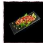
Тар-тар из лосося 600 рублей Мелко рубленное филе лосося с каперсами и луком