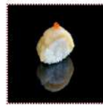
Морской гребешок 160 рублей Суши с морским гребешком 12/15 г 42 ккал