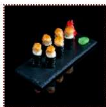
Тёплый ролл с гребешком 490 рублей

Гребешок, омлет слоеный, сыр, водоросли нори, рис