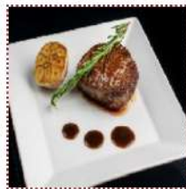
Стейк "Филе - Миньон" 650 рублей