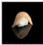
Окунь 130 рублей Суши с окунем 12/15 г 40 ккал