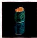
Икра лосося 170 рублей Суши с икрой лосося 10/15 г 54 ккал