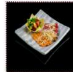
Карпаччо из тунца 600 рублей Нарезка из свежей рыбы подается с салатом в корзинке из рисового блина