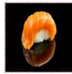
Лосось 170 рублей Суши с лососем 15/15 г 52 ккал