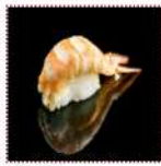
Креветка 160 рублей Суши с креветкой 12/15 г 41 ккал