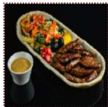
Бифу теппан Яки 850 рублей

Нежная сочная обжаренная говядина с овощами подается с соусом гамадари