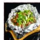
Баклажаны на тхе-пане 550 рублей Баклажаны фаршированные свиной под зestyм оригинальным соусом 300 г 162 ккал