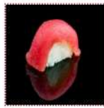
Тунец 160 рублей Суши с тунцом 12/15 г 40 ккал