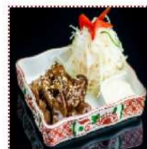
Леба терияки 370 рублей

Куриная печень под соусом терияки с японским майонезом и стейк-салатом