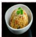
Ясай ири яши меши 290 рублей Японский рис с овощами 200 г 243 ккал