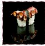
Осьминог 160 рублей Суши с осьминогом 12/15 г 41 ккал