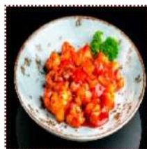
Курица в кисло-сладком соусе 390 рублей

Обжаренная в кляре куриная грудка под традиционным соусом