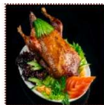
Китайская праздничная утка 2600 рублей

Запеченная утка, маринованная в китайском кулинарном вине с добавлением соевого соуса, меда и специй, заказывается предварительно, не менее чем за один день