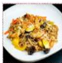
Яши соба с курицей в томатном соусе 350 рублей Вкусная речневая лапша с куриным филе и овощами 250 г 175 ккал