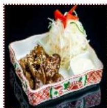
Мотцу терияки 370 рублей

Куриные сердечки под соусом терияки с японским майонезом и стейк-салатом