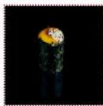
Кими 130 рублей Суши с желтком свежего яйца 10/15 г 30 ккал