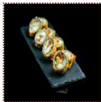
Тори Яки 350 рублей

Курица, пекинская капуста, томат и сырный соус