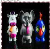
Мороженое "Игрушка" 290 рублей Ванильное, шоколадное, клубничное 1 шт. 176 ккал