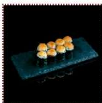
Запеченный ролл Татаки 410 рублей

Тунец, лист салата, авокадо, апельсиновая икра летучей рыбы