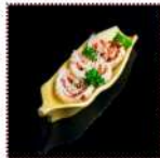
Кимчи 220 рублей Острая китайская капуста