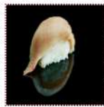
Лакедра желтохвостая 130 рублей Суши с лакедрой 12/15 г 57 ккал