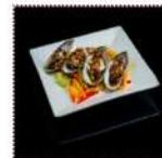
Мидии Мацужиро 630 рублей Мидии под легким чесночным соусом с бальзамической заправкой