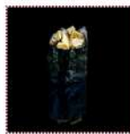
Така 130 рублей Суши с омлетом и шампиньонами 20/15 г 95 ккал