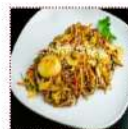
Яши соба 290 рублей Классическая японская речневая лапша 200 г 177 ккал