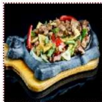
Говядина на тхе-пане 750 рублей

Нежная сочная обжаренная говядина с овощами