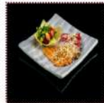
Карпаччо из окуня 550 рублей Нарезка из свежей рыбы подается с салатом в корзинке из рисового блина