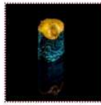
Запеченные суши на выбор - мидии, угорь, гребешок, лакедра, лосось, окунь 170 рублей Запеченные суши "Тункан" с начинкой на выбор 30/30/1/2/2 г 71-85 ккал