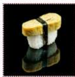
Спленый омлет 130 рублей Суши со спленым омлетом 20/15 г 68 ккал