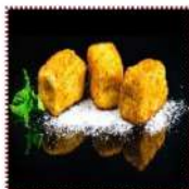
Мороженое в кляре 370 рублей Классический китайский десерт 200 г 245 ккал