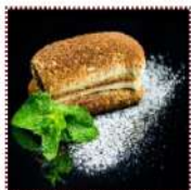
Тирамису 330 рублей Крем-сыр маскарпоне на печенье савоярди, пропитанным кофе 110 г 255 ккал