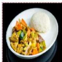
Курица в соусе карри с овощами и рисом 390 рублей

Нежные кусочки курицы карри с овощами и рисом на пару