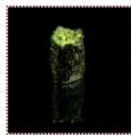
Чука 130 рублей Суши с водородями "Чука" 12/15 г 39 ккал