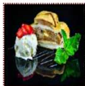
Яблочный штрудель 330 рублей Десерт из слоеного теста с начинкой из яблок, подается с мороженым 1 шт. 193 ккал