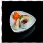
Нэм с курицей и креветками 390 рублей Легкая закуска из тигровой креветки, курицы и крахмальной пашты