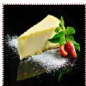
Чиз-кейк "Нью Йорк" 330 рублей Классический чиз-кейк из сливочного крем-сыра на тонком песочном тесте 95 г 355 ккал