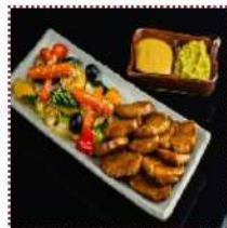
Бута теппан-яки 700 рублей

Нежная сочная обжаренная свинина с овощами (пекинский лист салата, морковь, цукини, грибы, перец) и соусом гамадари