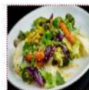
БОК китайский овощной 350 рублей Капуста брокколи, шунги, салат "Айсберг", морковь, лук шалот, кинза, кукуруза, чеснок, горчица зернистая, кунжутное семя 250 г 102 ккал