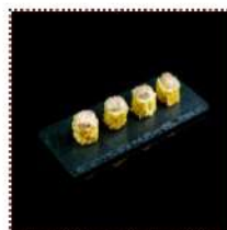
Хофу 330 рублей

Лосось, огурец, китайская капуста под икорно- майонезным соусом