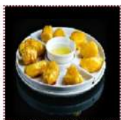
Фрукты в карамели Банан/ананас/яблоко/ ассорти/ 350 рублей Оригинальный десерт из карамелизированных фруктов с лимонным соусом Яблоко в карамели-290руб, Ананас в