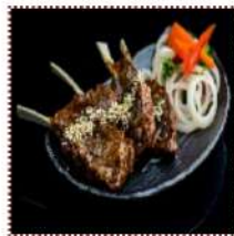
Кушияки Канпай 990 рублей

Ребрышки ягненка с маринованным луком и клюквой