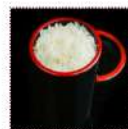
Гохан 100 рублей Традиционный отварной японский рис без приправ, специй и соли 150 г 178 ккал