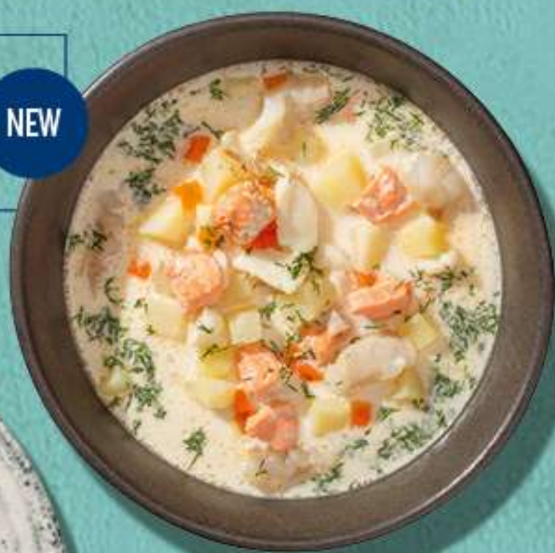
Марсельский Буйабес с морепродуктами