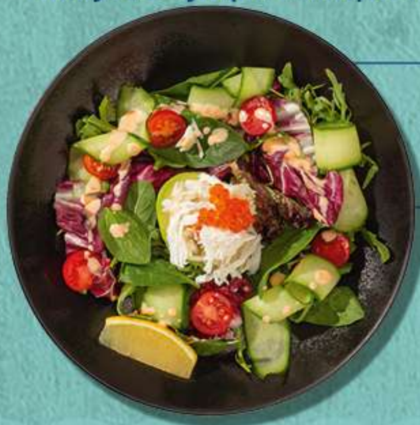
Салат с мясом камчатского краба 849.-