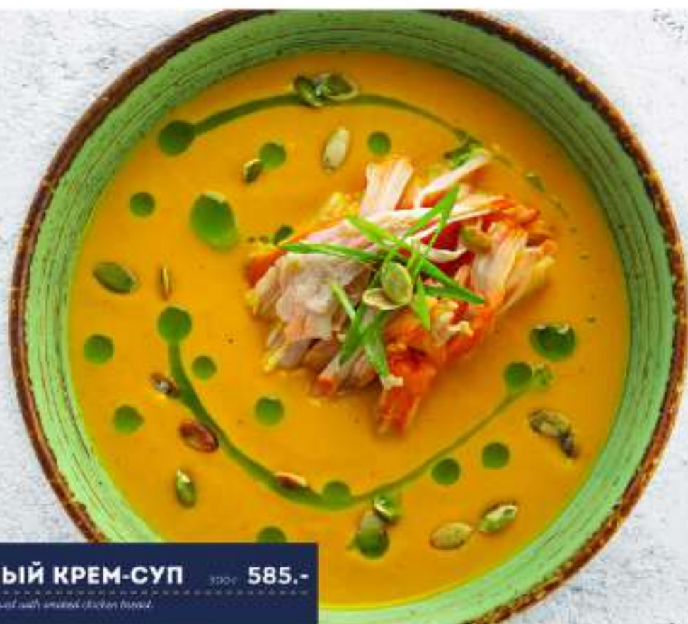
ТЫКВЕННЫЙ КРЕМ-СУП 300г 585.- Pumpkin cream soup. Served with sliced chicken breast.