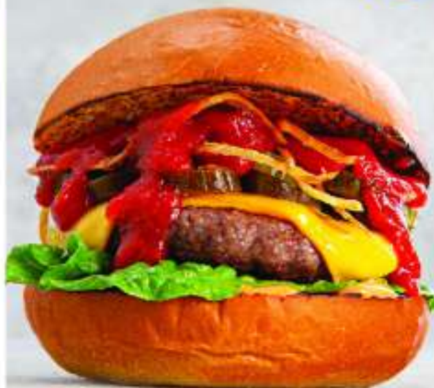
ВВО С ПЕРЦЕМ ХАЛАПЕНЬО 280/100/30 - 975.-

Блюничный бургер с говяжьей котлетой из говядины, хрустящим луком, сыром чеддером, салатом айсберг, маринованным огурцом, томатом, красным луком и соусом. Подается с картошкой фри и кетчупом.