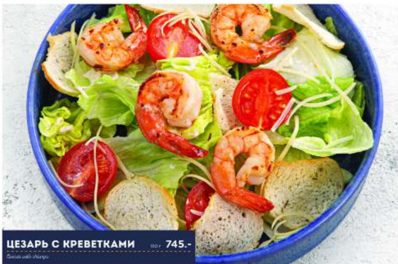
ЦЕЗАРЬ С КРЕВЕТКАМИ № 745.-