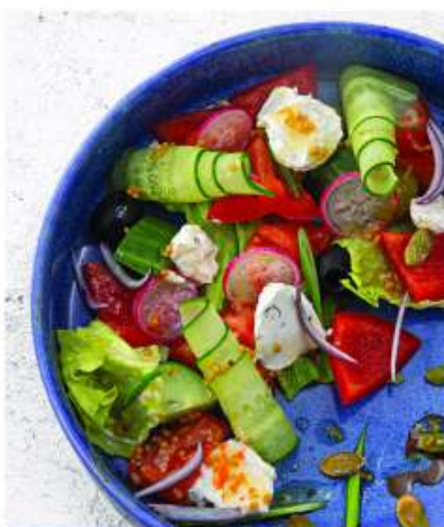
ОВОЩНОЙ ОТ ШЕФА 200 г 585.-

Рисош: Pochodni egg, fried potatoes, canned tuna, carrots, lettuce, tomatoes, green beans