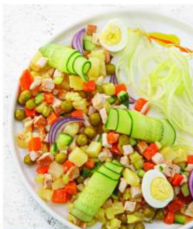
ОЛИВЬЕ ФИРМЕННЫЙ 200 г 575.-