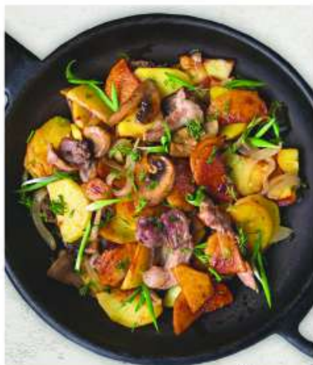
КАРТОФЕЛЬ С ГОВЯДИНОЙ И ГРИБАМИ 340 г 795.-