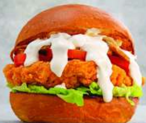
КУРИНЫЙ ЦЕЗАРЬ 280/100/30 - 885.-

Бургер с куриным филе в хрустящей панировке, соусом цезарь, салатом, сыром пармезан и томатом. Подается с картошкой фри и кетчупом.