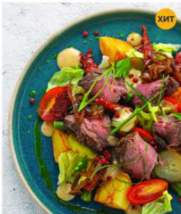
САЛАТ С МАРИНОВАННЫМ РОСТБИФОМ 250 г 775.-