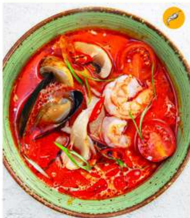
ТОМ ЯМ 250г/100г 795.- Tom Yum.