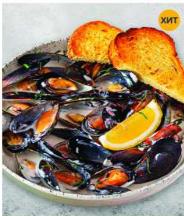
МИДИИ В СЛИВОЧНОМ СОУСЕ 400/10 г 895.-