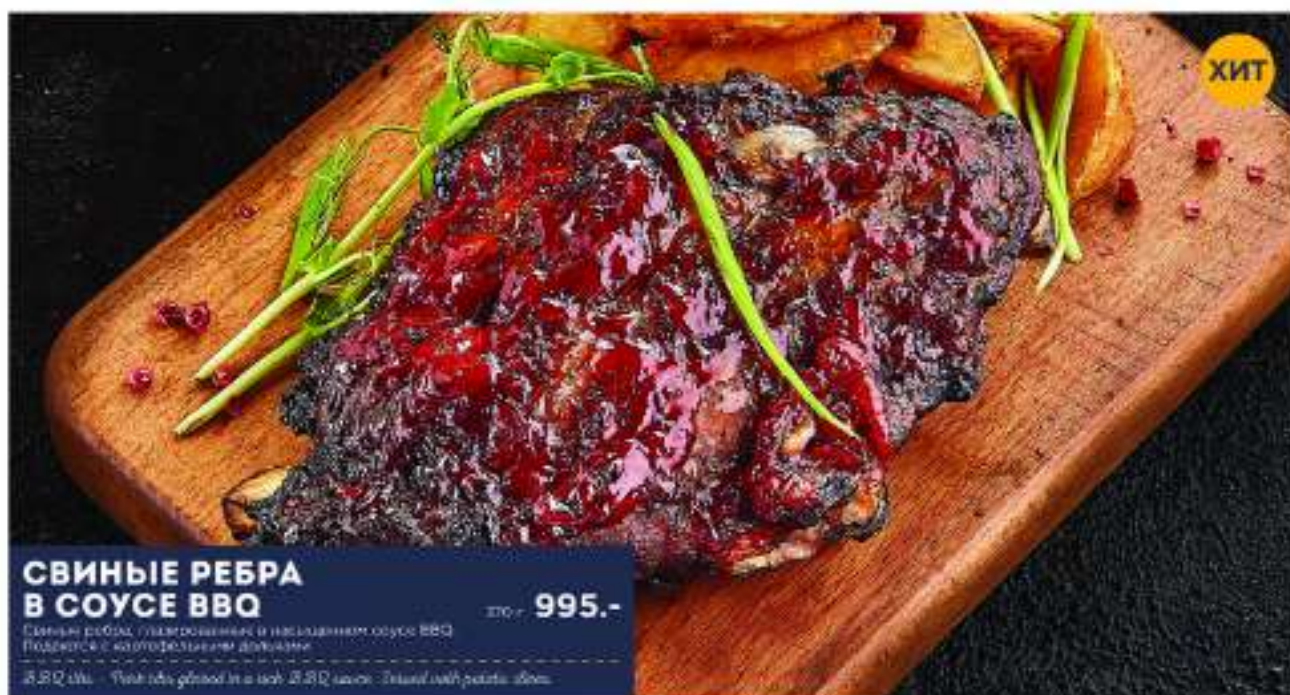
СВИНЫЕ РЕБРА В СОУСЕ BBQ