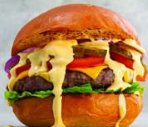
ЧИЗБУРГЕР 290/100/30 - 995.-

Классический бургер с говяжьей котлетой, сырным соусом, салатом айсберг, маринованным огурцом, томатом, сыром чеддер и красным луком. Подается с картошкой фри и кетчупом.