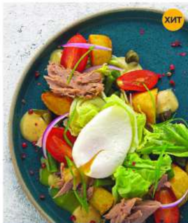
НИСУАЗ 250 г 735.-

Рисо пачот, обжаренный картофель, консервированный тунец, капуста, лист салата, помидоры, стручковая фасоль.