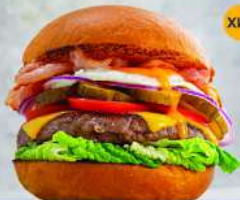
С БЕКОНОМ И ЯЙЦОМ 280/100/30 - 985.-

Бургер с говяжьей котлетой, беконом, яйцом, салатом, сыром чеддер, томатом, красным луком и соусом. Подается с картошкой фри и кетчупом.