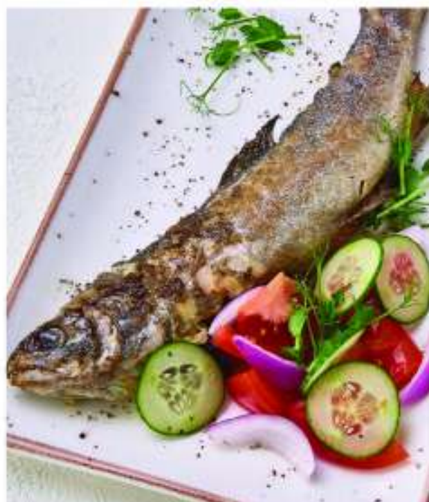
АДЛЕРСКАЯ ФОРЕЛЬ 795.-