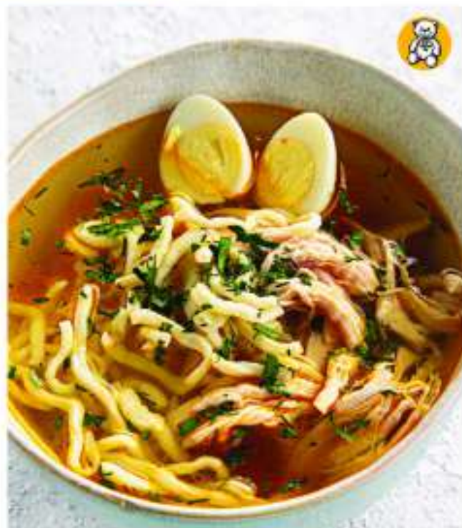
КУРИНЫЙ БУЛЬОН С ДОМАШНЕЙ ЛАПШОЙ 200г 465.- Chicken broth with homemade udon.