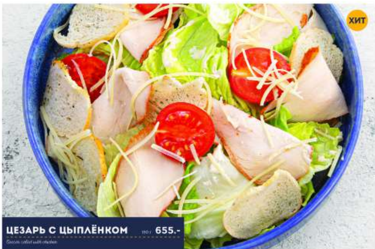
ЦЕЗАРЬ С ЦЫПЛЁНКОМ № 655.-