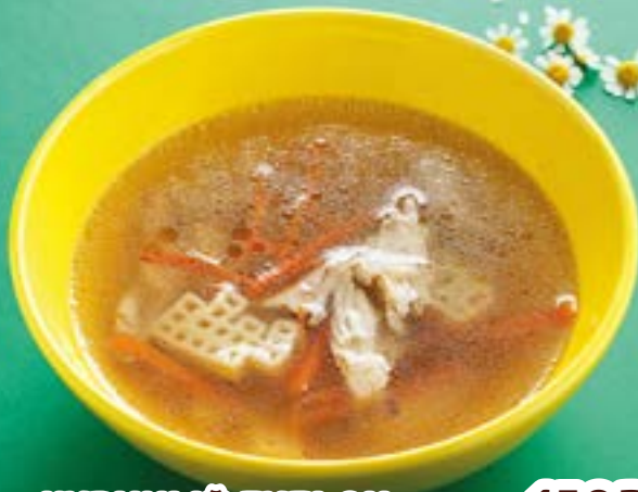
КУРИНЫЙ БУЛЬОН САЛФАВИТОМ Chicken broth with alphabet noodles