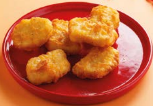
НАГГЕТСЫ КУРИНЫЕ В КЛЯРЕ Chicken nuggets in batter