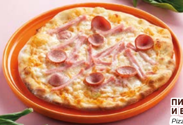
ПИЦЦУРИ С СЫРОМ И ВЕТЧИНОЙ 210Р Pizzuri with cheese and ham 150 г