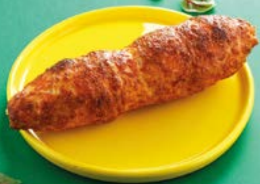
СОСИСКА В ТЕСТЕ 240Р Sausage in pastry 150 г