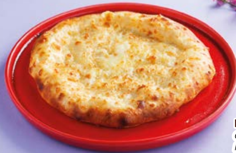
МЕГРЕЛИК 210Р Cheese khachapuri Megreli style 150 г