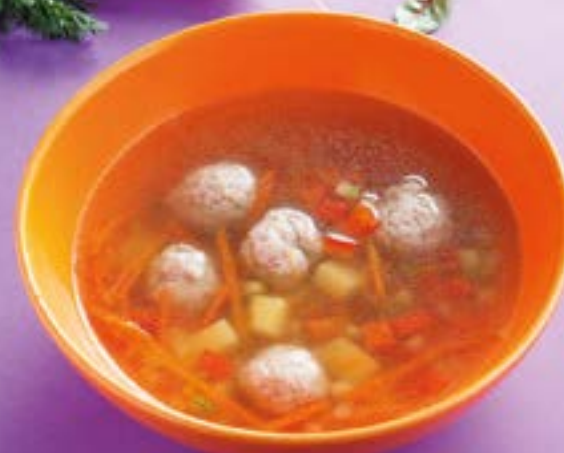
СУП С ФРИКАДЕЛЬКАМИ Meatball soup