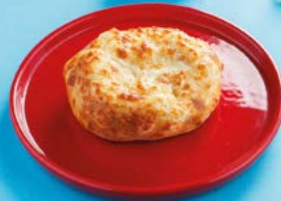
ДЕТСКИЙ ХАЧАПУРГЕР 250Р Khachapurger 150 г