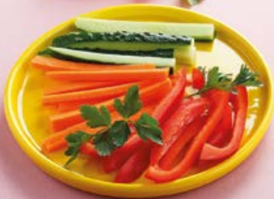
ОВОЩНЫЕ ПАЛОЧКИ Vegetable sticks