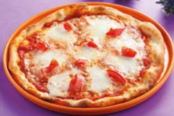
ПИЦЦА МАРГАРИТКА 210Р Only cheese pizza 180 г