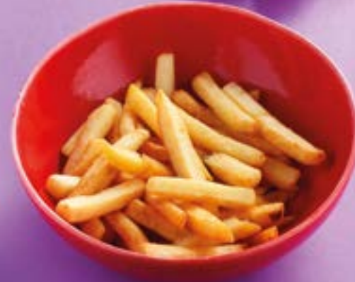
КАРТОФЕЛЬ ФРИ 140Р French fries 120 г