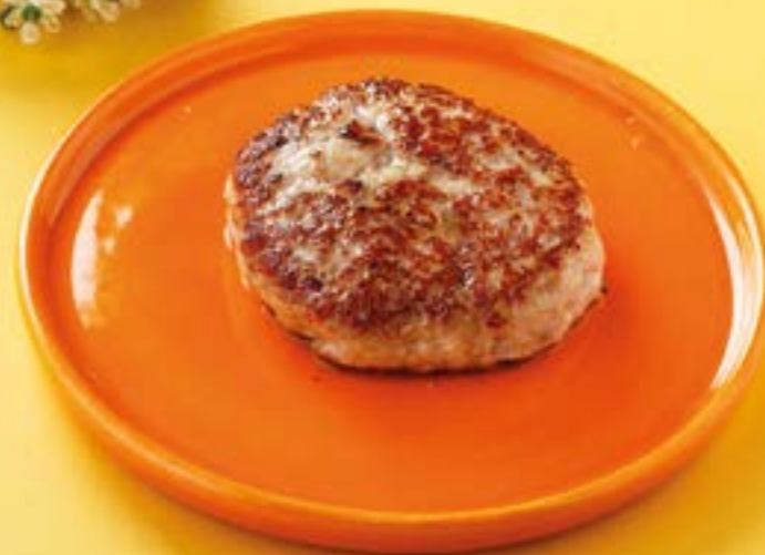
КУРИНАЯ КОТЛЕТА Chicken cutlet