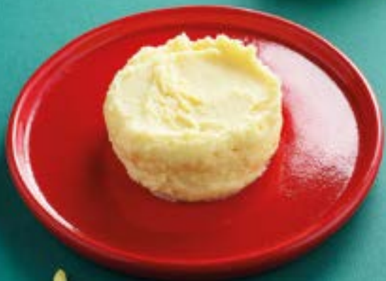
КАРТОФЕЛЬНОЕ ПЮРЕ Mashed potatoes