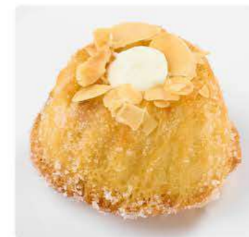
Куглоф с изюмом NEW и цедрой лимона Кекс с изюмом, ромом, цедрой лимона, миндальными лепестками 75 г 159.-