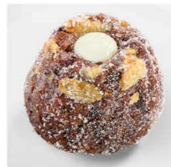
Куглоф шоколадный NEW Кекс с тёмным шоколадом, грецким орехом, миндальные лепестки 75 г 159.-