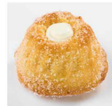
Куглоф с апельсином NEW Кекс с цедрой и соком апельсина 75 г 159.-