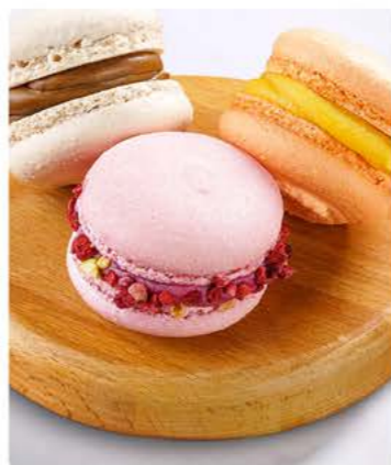
Макарены домашние Манго-маракуйя / карамельный капучино / малина 40 г / 1 шт 159.-