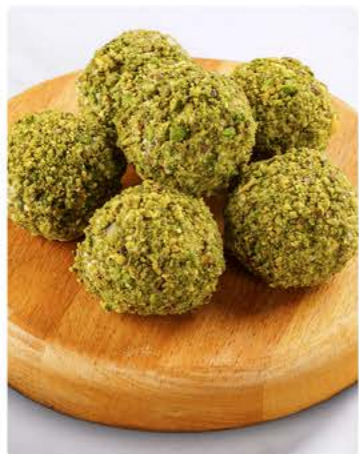
Трюфель фисташка 20 г / 1 шт 89.-