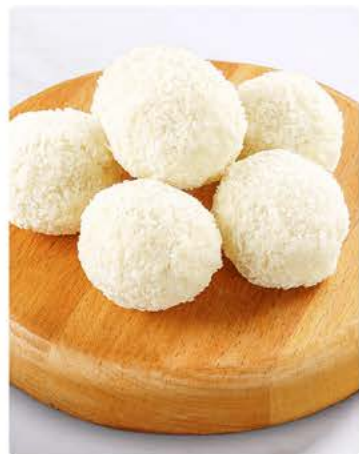
Трюфель кокос 20 г / 1 шт 89.-