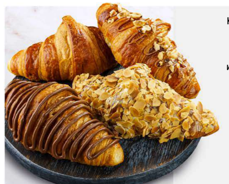
Классический круассан 60 г 179.-