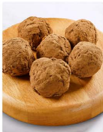
Трюфель классический 20 г / 1 шт 89.-