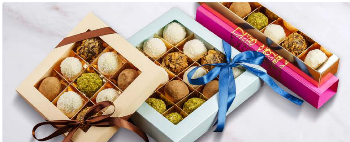
Конфеты ручной работы