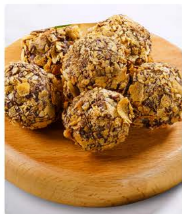
Трюфель изюм-клюква 20 г / 1 шт 89.-