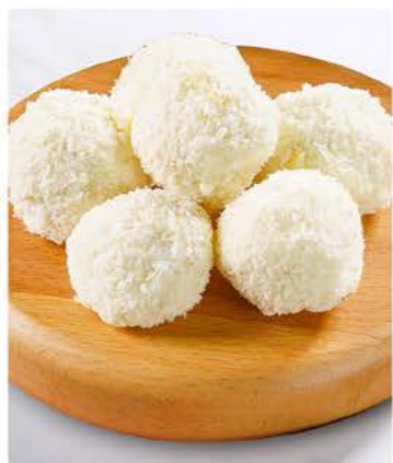
Белый шоколад манго-маракуйя 20 г / 1 шт 89.-