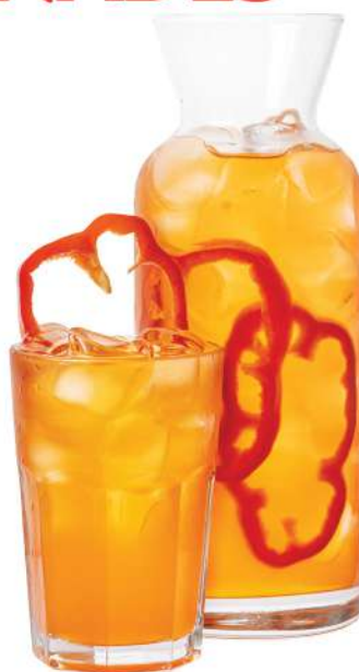
FRESH BOOM 0,3л. - 340 Р 1л. - 800 Р

Кисло-сладкий лимонад. В составе: пюре маракуйи, малиновый сироп, сок лимона и газированная вода. Смешивается в большом стакане. Подается со льдом и свежим лимоном.