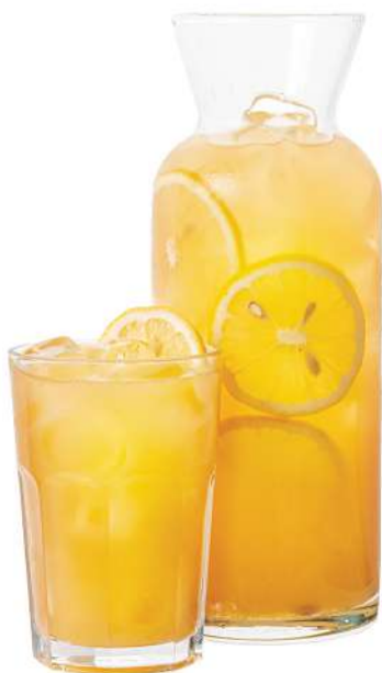
FRUIT & BERRY 0,3л. - 350 Р 1л. - 999 Р

Кисло-сладкий лимонад. В составе: пюре маракуйи, малиновый сироп, сок лимона и газированная вода. Смешивается в большом стакане. Подается со льдом и свежим лимоном.