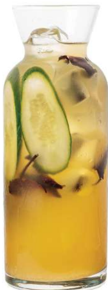
PINA COLADA 0,3л. - 350 Р 1л. - 999 Р

Свежий вкус огурца и пряный аромат базилика феерично соединяются в единый ансамбль и раскрываются по-новому, благодаря кисло-сладкому балансу сиропа личи и лимонного фреша. Все ингредиенты разминаются и тщательно взбиваются в шейкере и подаются в резном хайболе с веточкой базилика и 2 рингами огурца.