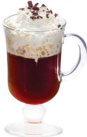
GLUHENDE WEIN - 490 Р

Этот коктейль был создан барменом, работающим в аэропорту Ирландии, где садилось много самолетов для остановки и дозаправки. Было очень холодно, и был необходим супер-согревающий коктейль. Встречайте, Кофе по-ирландски! Великолепное сочетание ирландского виски, эспрессо и взбитых сливок.