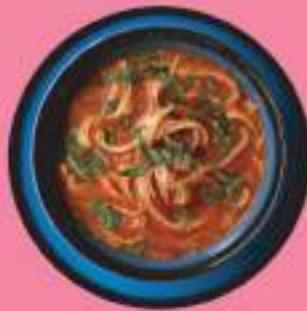
ПРЯНЫЙ ЧИЛИ СУП С ЛАПШОЙ И ЦЫПЛЕНКОМ 350 гр 420 P КУРИНЫЙ БУЛЬОН, ЛАПША, РВАНАЯ КУРИЦА, ТОМАТЫ С/С