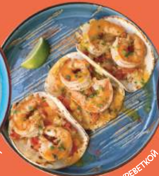
ТАКО С КРЕВЕТКОЙ