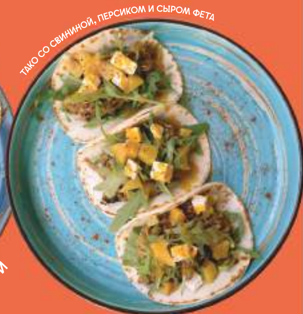
ТАКО СО СВИНИНОЙ, ПЕРСИКОМ И СЫРОМ ФЕТА

*ПШЕНИЧНАЯ ТОРТИЛЬЯ С РАЗНООБРАЗНОЙ НАЧИНКОЙ НА ВЫБОР