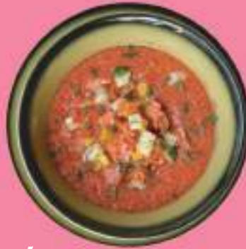
ГАСПАЧО С ЧОРИЗО (ПИКАНТНАЯ КОЛБАСКА) 250 гр 420 P С КРЕВЕТКОЙ 300 гр 480 P ТОМАТНЫЙ СУП ПОДАЕТСЯ В ТЕПЛЫЙ ПЕРИОД ГОДА – ХОЛОДНЫМ, А В ХОЛОДНЫЙ ПЕРИОД ГОДА – ГОРЯЧИМ