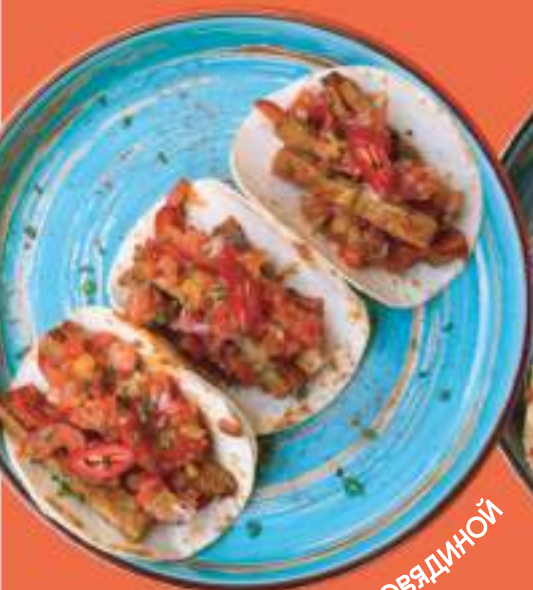
ТАКО С ГОВЯДИНОЙ