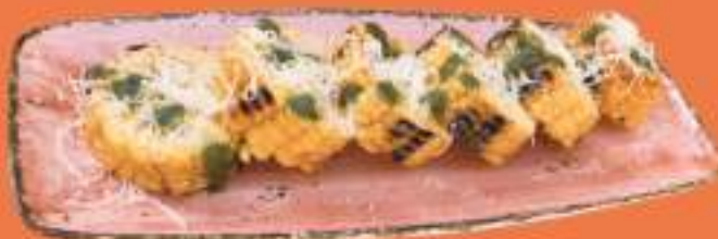
ЗАПЕЧЕННАЯ КУКУРУЗА С СЫРОМ ПОДАЕТСЯ С СОУСОМ ЧИМИЧУРРИ И ЛАЙМОМ 380 гр 450 Р