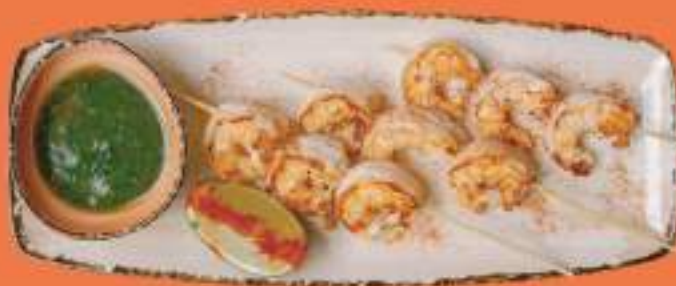
КРЕВЕТКИ С СОУСОМ ЧИМИЧУРРИ ПОДАЕТСЯ С ЛАЙМОМ 100/40 гр 550 Р