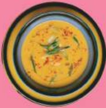
СЛИВОЧНЫЙ СУП С КРЕВЕТКАМИ 360 гр 480 P КРЕВЕТОЧНЫЙ БУЛЬОН, КРЕВЕТКИ, САЛАТ АЙСБЕРГ, ПЕРЕЦ БОЛГАРСКИЙ, ЛУК