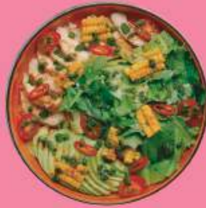
САЛАТ С ЦЫПЛЕНКОМ 200 гр 550 P МИКС САЛАТ, ЦЫПЛЕНОК, АВОКАДО, ТОМАТЫ, КУКУРУЗА, СОУС ЧИМИЧУРРИ