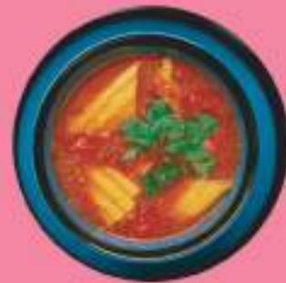
СУП ЧИЛИ КОН КАРНЕ 340 гр 450 P БУЛЬОН ИЗ ГОВЯДИНЫ, ФАСОЛЬ, КУКУРУЗА, ТОМАТЫ