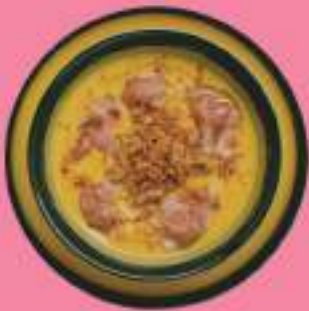
КУКУРУЗНЫЙ СЛИВОЧНЫЙ СУП 290 гр КУКУРУЗА, МОРКОВЬ, ЛУК, СЛИВКИ, СЕЛЬДЕРЕЙ, ЛУК КРИСПИ С ЖАРЕНЫМ БЕКОНОМ 420 P С КРЕВЕТКАМИ 480 P