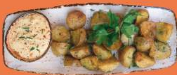
КАРТОФЕЛЬ ЖАРЕННЫЙ С ОСТРЫМ СЫРНЫМ СОУСОМ 200/70 гр 300 Р