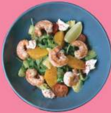
САЛАТ С КРЕВЕТКАМИ 290 гр 600 P КРЕВЕТКИ, АПЕЛЬСИН, РУККОЛА, СЫР ФЕТА, СОУС ЦИТРУСОВЫЙ