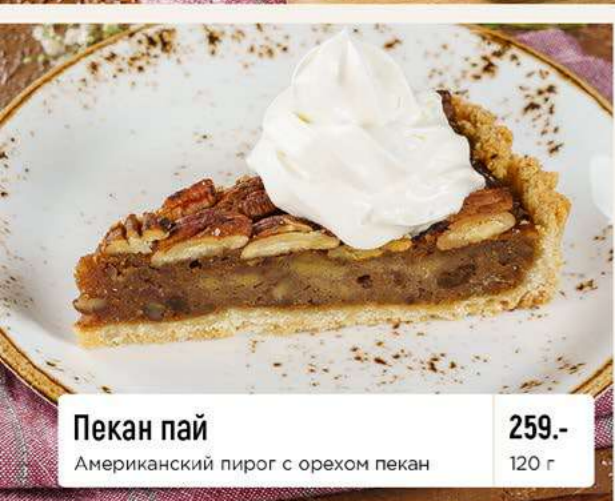
Пекан пай Американский пирог с орехом пекан