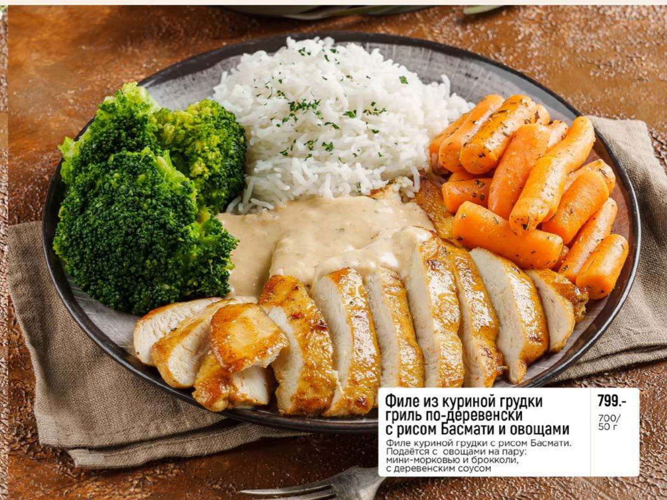
Филе из куриной грудки гриль по-деревенски с рисом Басмати и овощами 799.- Филе куриной грудки с рисом Басмати. Подается с овощами на пару: мини-морковью и брокколи, с деревенским соусом 700/ 50 г