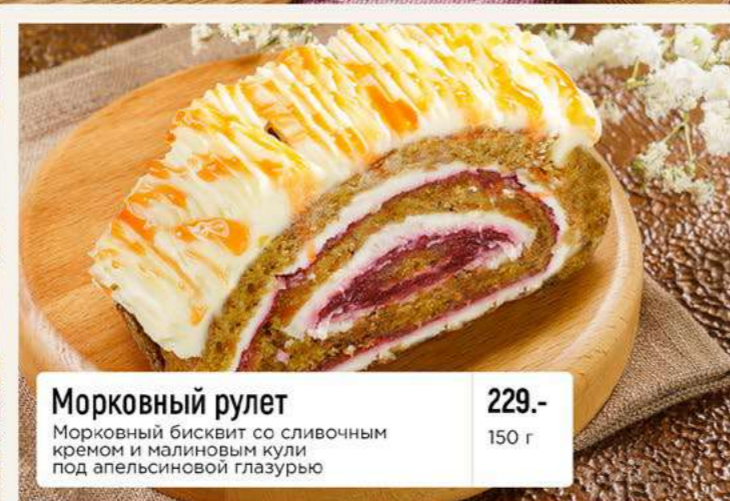
Морковный рулет Морковный бисквит со сливочным кремом и малиновым кули под апельсиновой глазурью