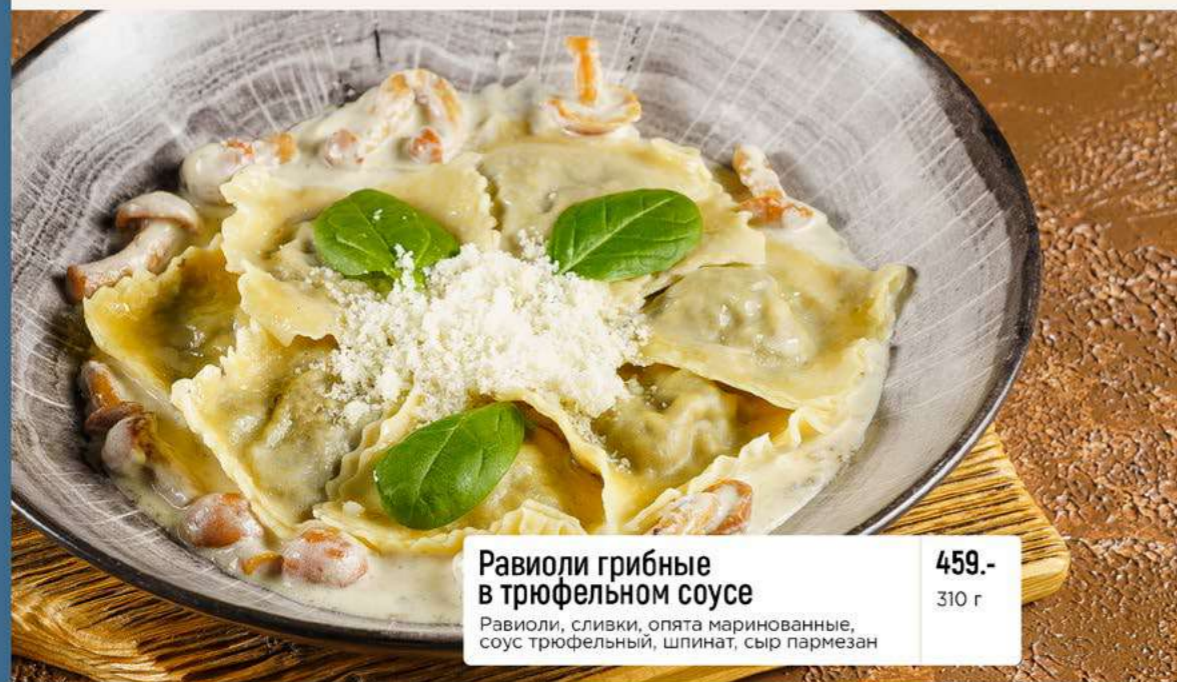
Равиоли грибные в трюфельном соусе 459.- 310 г Равиоли, сливки, опята маринованные, соус трюфельный, шпинат, сыр пармезан