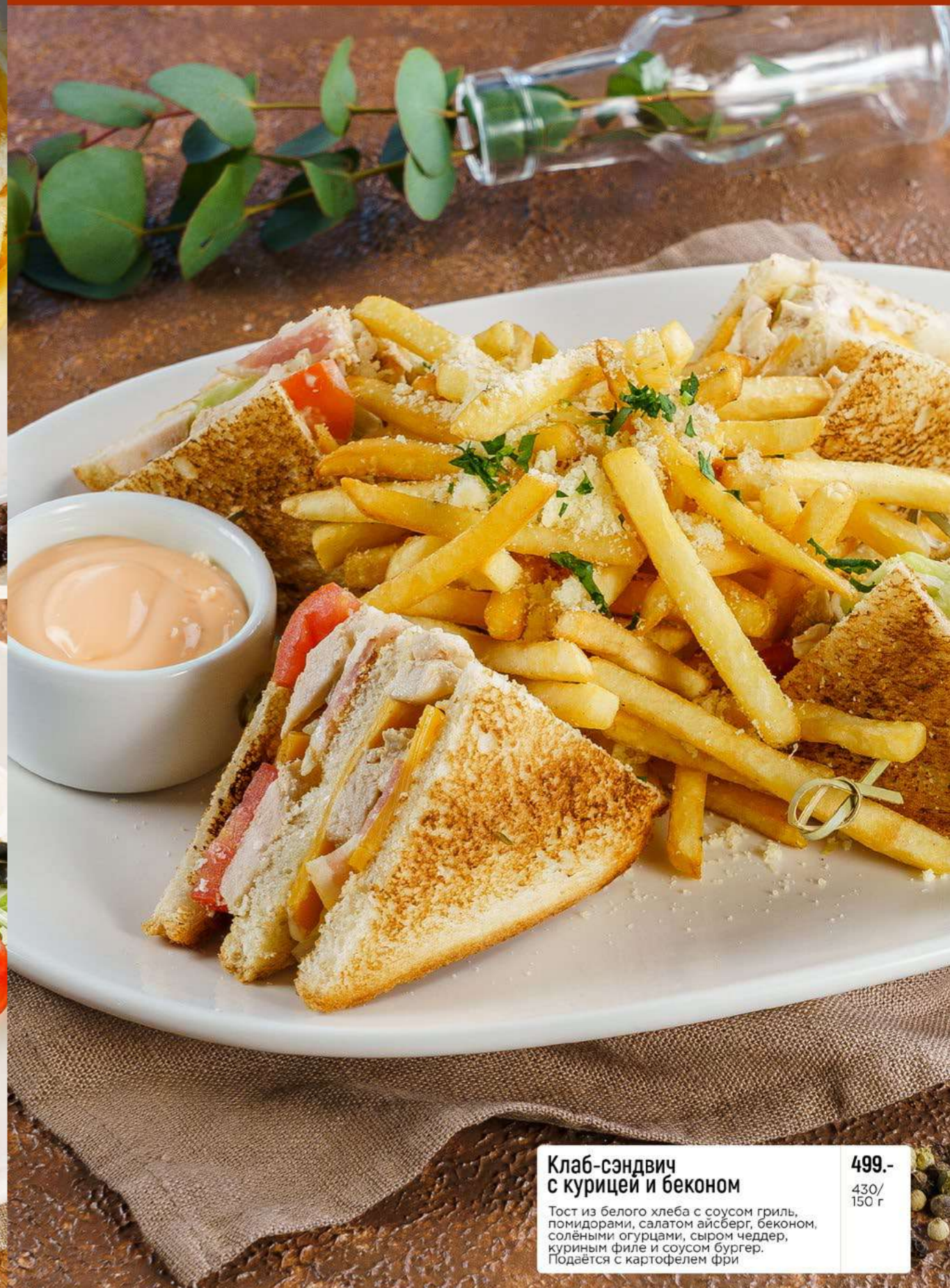
Клуб-сэндвич с курицей и беконом 499.- 430/150 г Тост из белого хлеба с соусом гриль, помидорами, салатом айсберг, беконом, солёными огурцами, сыром чеддер, куриным филе и соусом бургер. Подается с картофелем фри