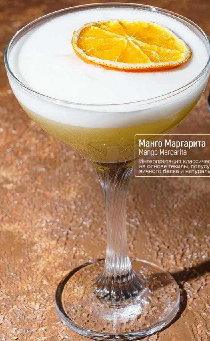
Манго Маргарита Mango Margarita

Нежное сочетание полусухого вина, персикового сока и ликёра, лимонного сока, сиропа личи, яичного белка и карамельного топпинга