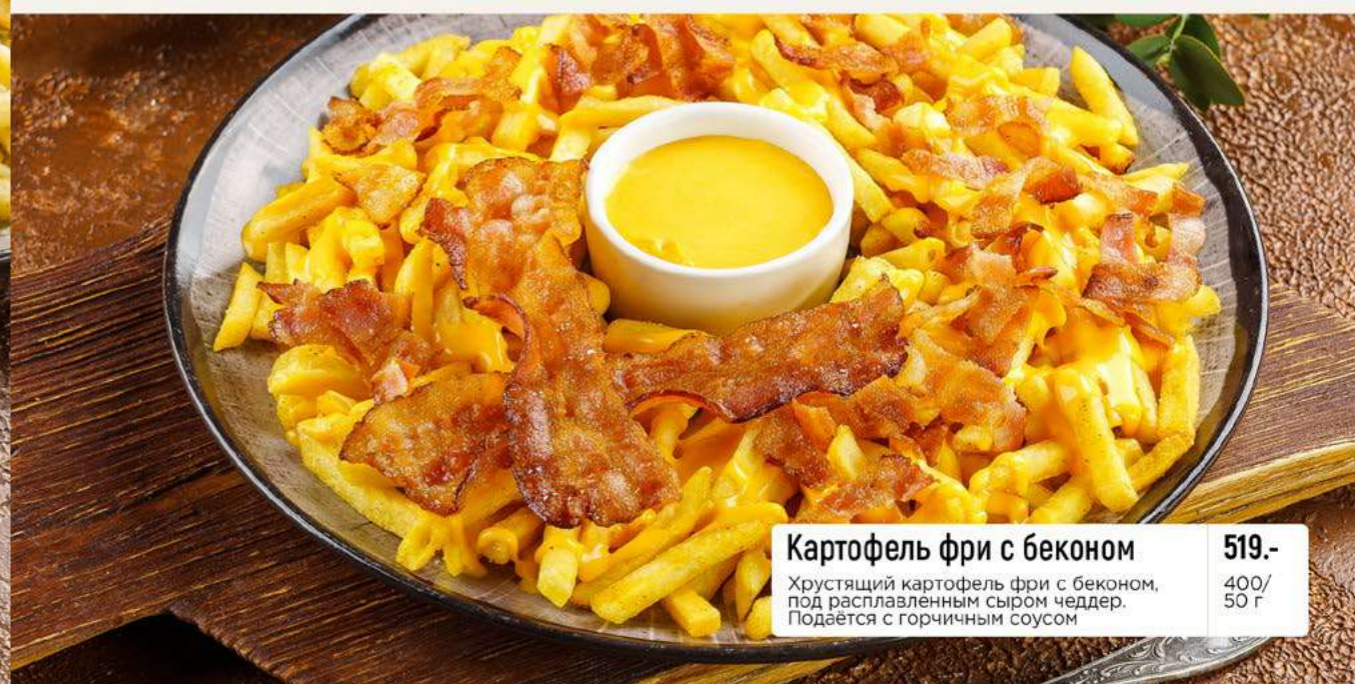
Картофель фри с беконом 519.- Хрустящий картофель фри с беконом, под расплавленным сыром чеддер. Подается с горчиный соусом 400/50 г