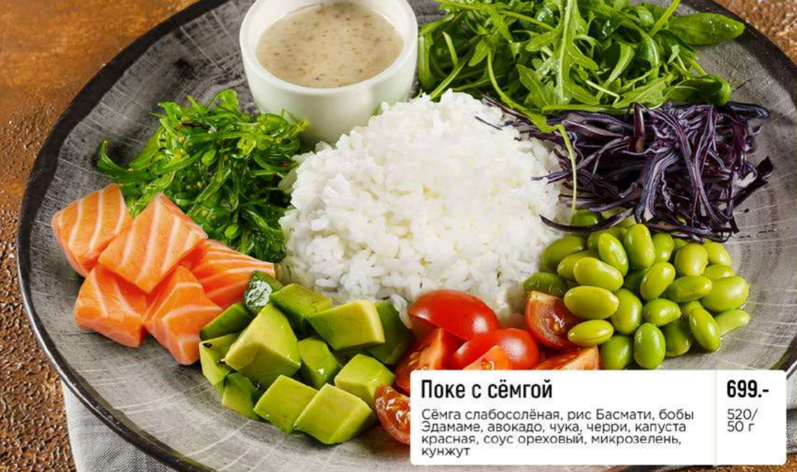
Покс с сёмгой 699.- Сёмга слабосоленая, рис Басмати, бобы Эдамаме, авокадо, чука, черри, капуста красная, соус ореховый, микрозелень, кунжут