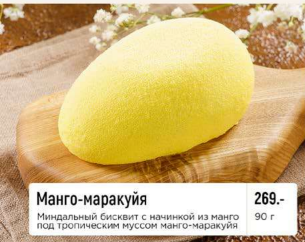
Манго-маракуйя Миндальный бисквит с начинкой из манго под тропическим муссом манго-маракуйя 269.- 90 г