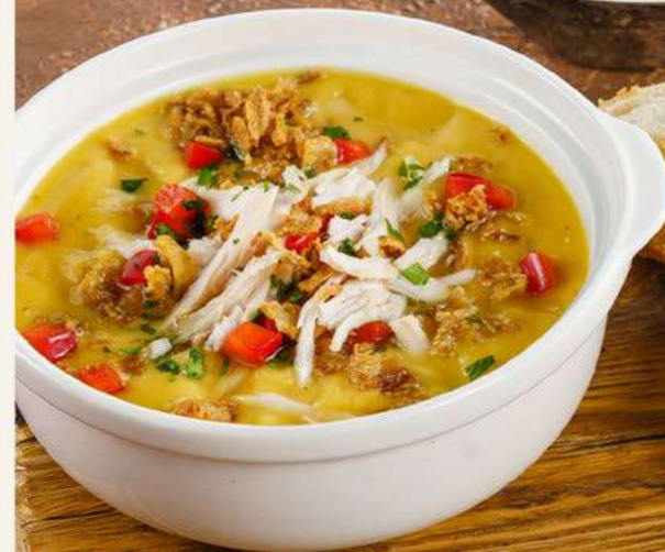
Суп чечевичный с индейкой

Пикантный крем-суп с чечевицей. Подается с подкопченной индейкой, болгарским перцем, жареным луком и сметаной