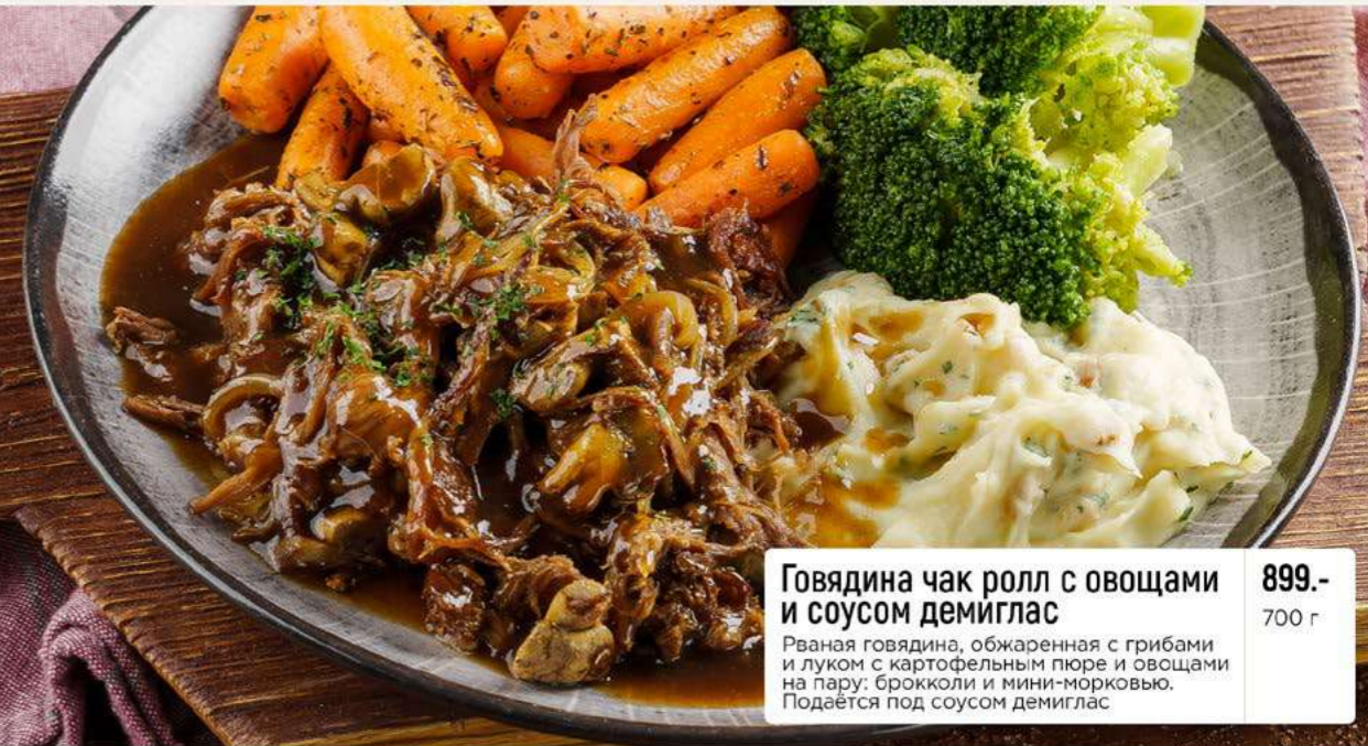
Говядина чак ролл с овощами и соусом демиглас 899.- 700 г Рваная говядина, обжаренная с грибами и луком с картофельным пюре и овощами на пару: брокколи и мини-морковью. Подается под соусом демиглас