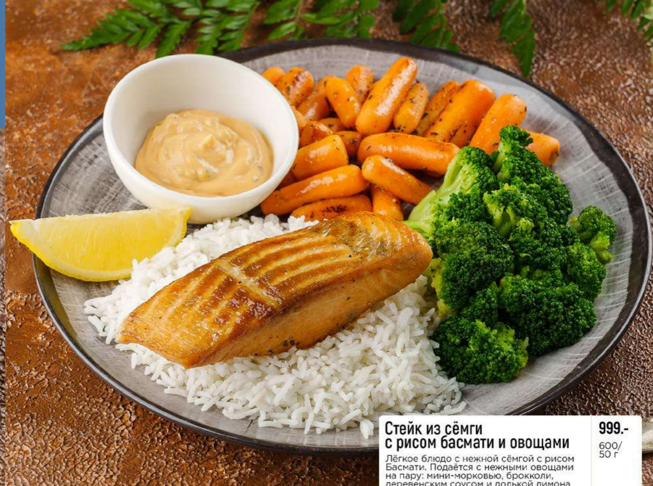
Стейк из сёмги с рисом басмати и овощами 999.- 600/ 50 г Лёгкое блюдо с нежной сёмгой с рисом Басмати. Подается с нежными овощами на пару: мини-морковью, брокколи, деревенским соусом и долькой лимона