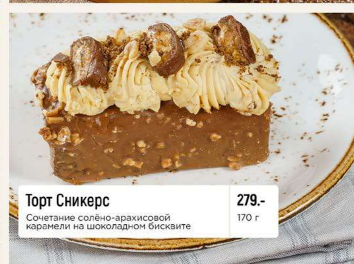
Торт Сникерс Сочетание солёно-арахисовой карамели на шоколадном бисквите