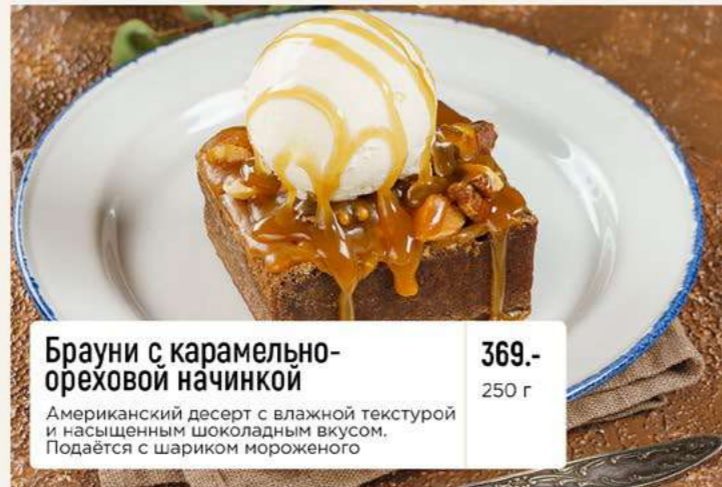
Брауни с карамельно-ореховой начинкой Американский десерт с влажной текстурой и насыщенным шоколадным вкусом. Подается с шариком мороженого 369.- 250 г