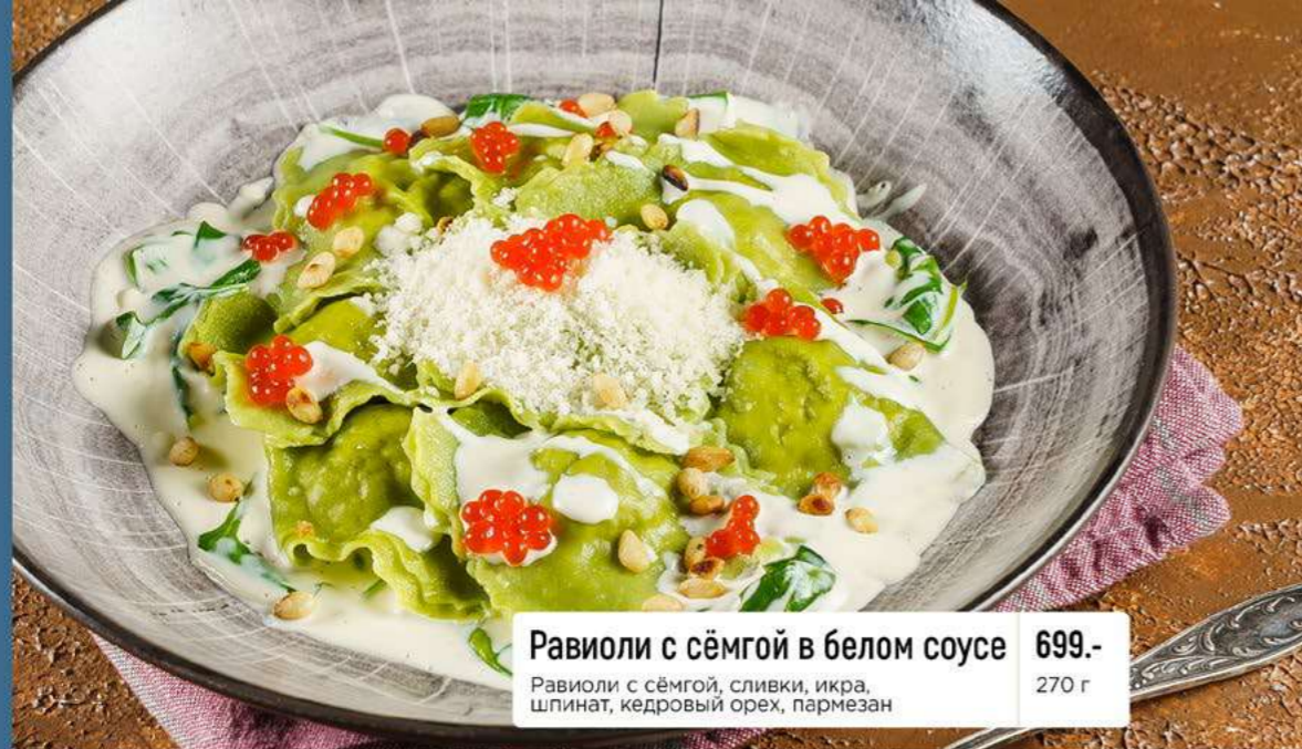
Равиоли с сёмгой в белом соусе 699.- 270 г Равиоли с сёмгой, сливки, икра, шпинат, кедровый орех, пармезан