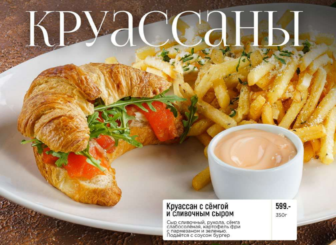
Круассан с сёмгой и сливочным сыром 599.- 350г Сыр сливочный, руккола, сёмга слабосоленая, картофель фри с пармезаном и зеленью. Подается с соусом бургер