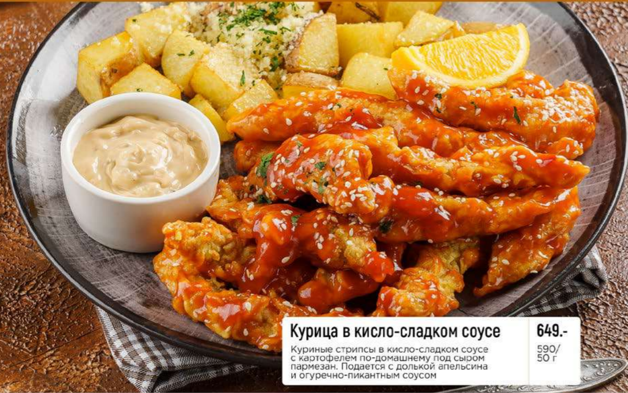
Курица в кисло-сладком соусе 649.- Куриные стрипсы в кисло-сладком соусе с картофелем по-домашнему под сыром пармезан. Подается с долькой апельсина и огуречно-пикантным соусом 590/ 50 г