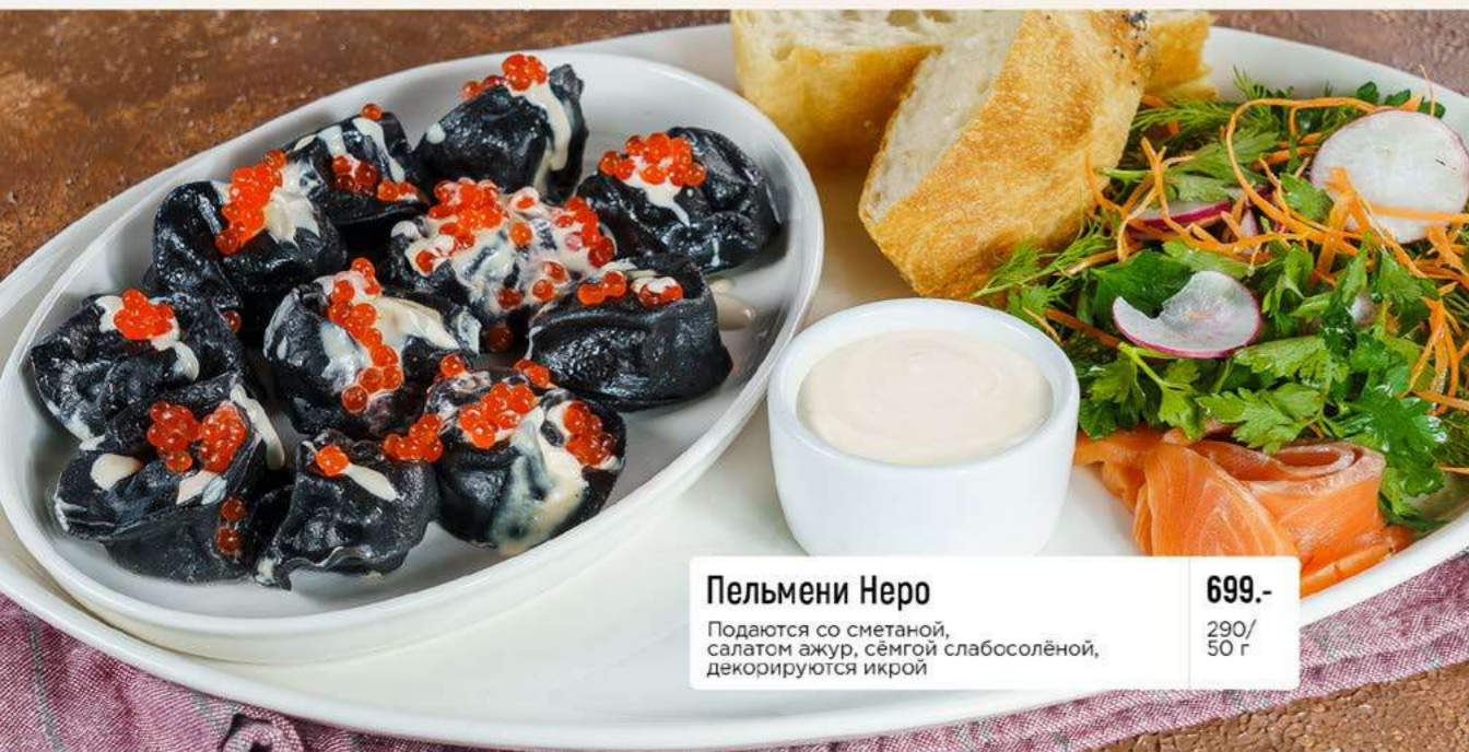
Пельмени Неро 699.- 290/50 г Подаются со сметаной, салатом ажур, сёмгой слабосолёной, декорируются икрой