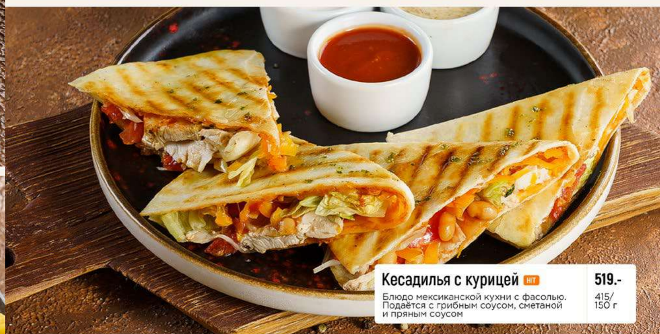
Кесадилья с курицей НП 519.- Блюдо мексиканской кухни с фасолью. Подается с грибным соусом, сметаной и пряным соусом 415/150 г