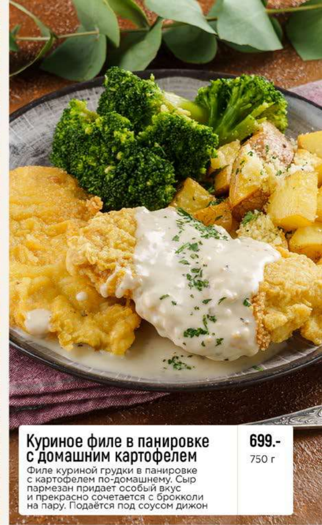
Куриное филе в панировке с домашним картофелем 699.- Филе куриной грудки в панировке с картофелем по-домашнему. Сыр пармезан придает особый вкус и прекрасно сочетается с брокколи на пару. Подается под соусом дижон 750 г