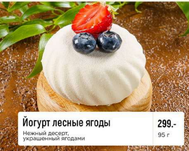
Йогурт лесные ягоды Нежный десерт, украшенный ягодами 299.- 95 г