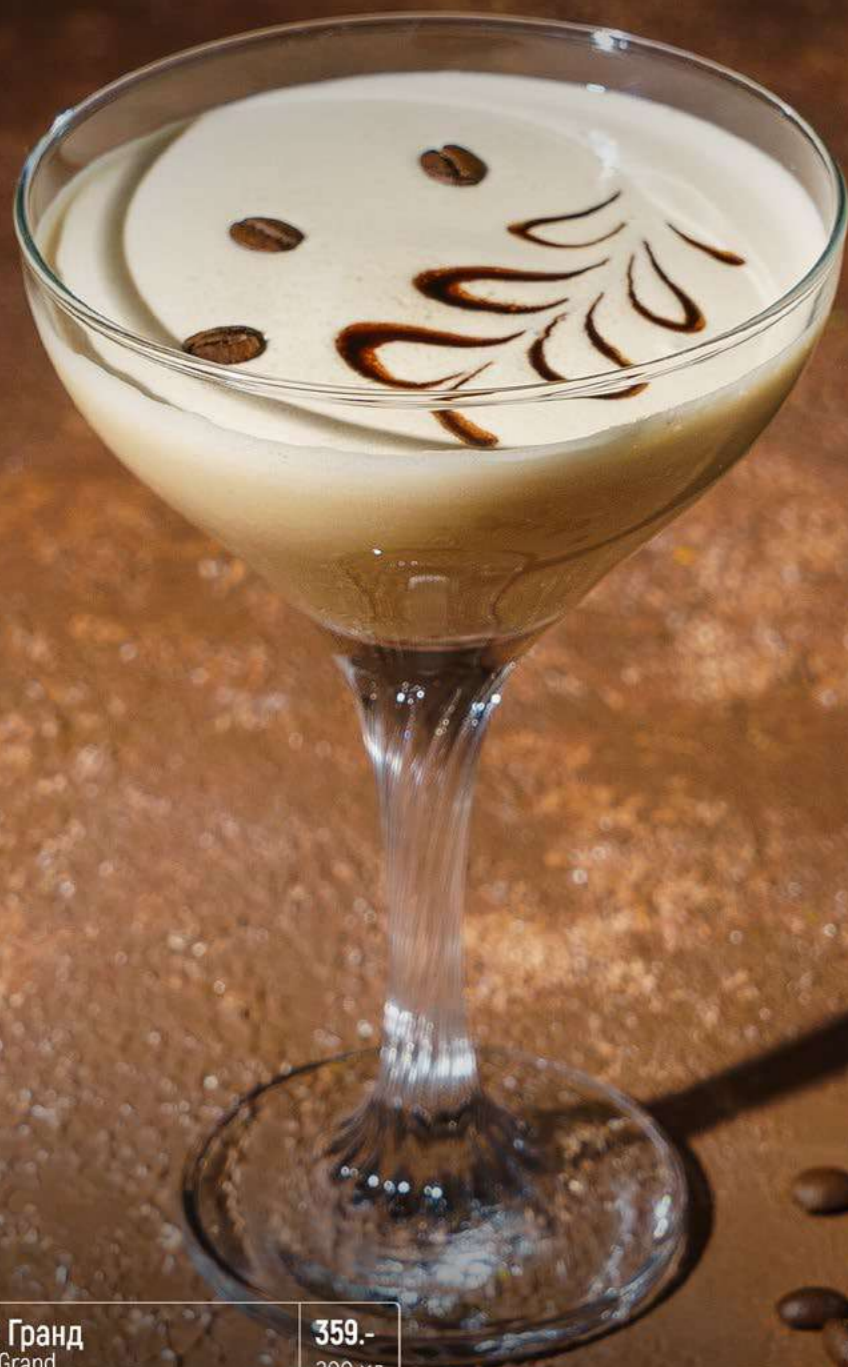
Бинхартс Гранд Beanhearts Grand