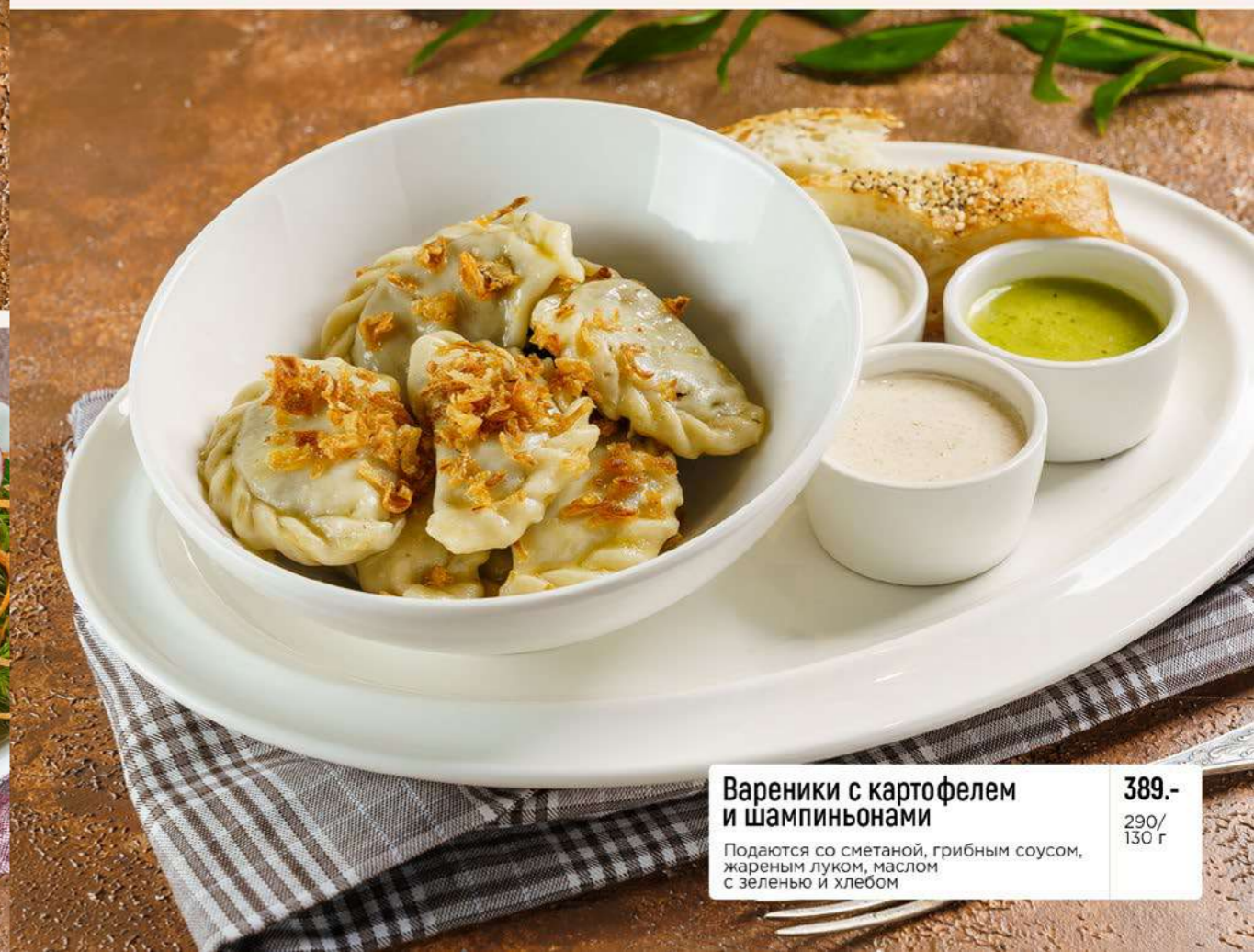
Вареники с картофелем и шампиньонами 389.- 290/130 г Подаются со сметаной, грибным соусом, жареным луком, маслом с зеленью и хлебом