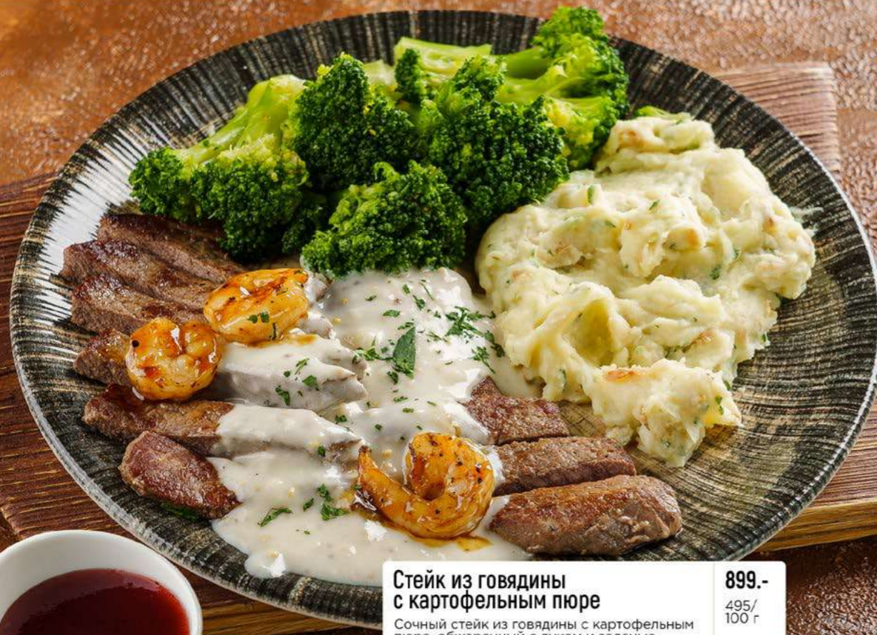
Стейк из говядины с картофельным пюре 899.- 495/100 г Сочный стейк из говядины с картофельным пюре, обжаренный с луком и зеленью. Подается с брокколи на пару, креветками в соусе терияки и соусами дижон на основе горчицы и брусничным конфитюром