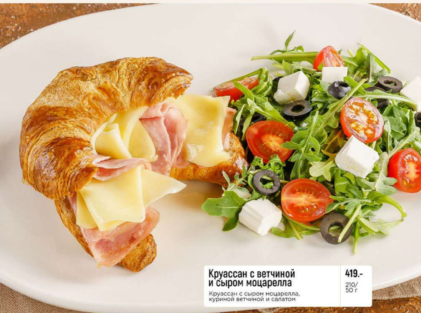
Круассан с ветчиной и сыром моцарелла 419.- 210/50 г Круассан с сыром моцарелла, куриной ветчиной и салатом