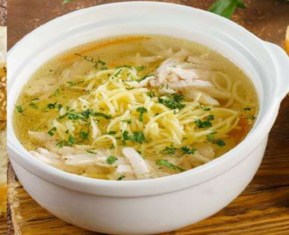
Домашний суп с лапшой

Суп с лапшой на курином бульоне с куриным филе и зеленью