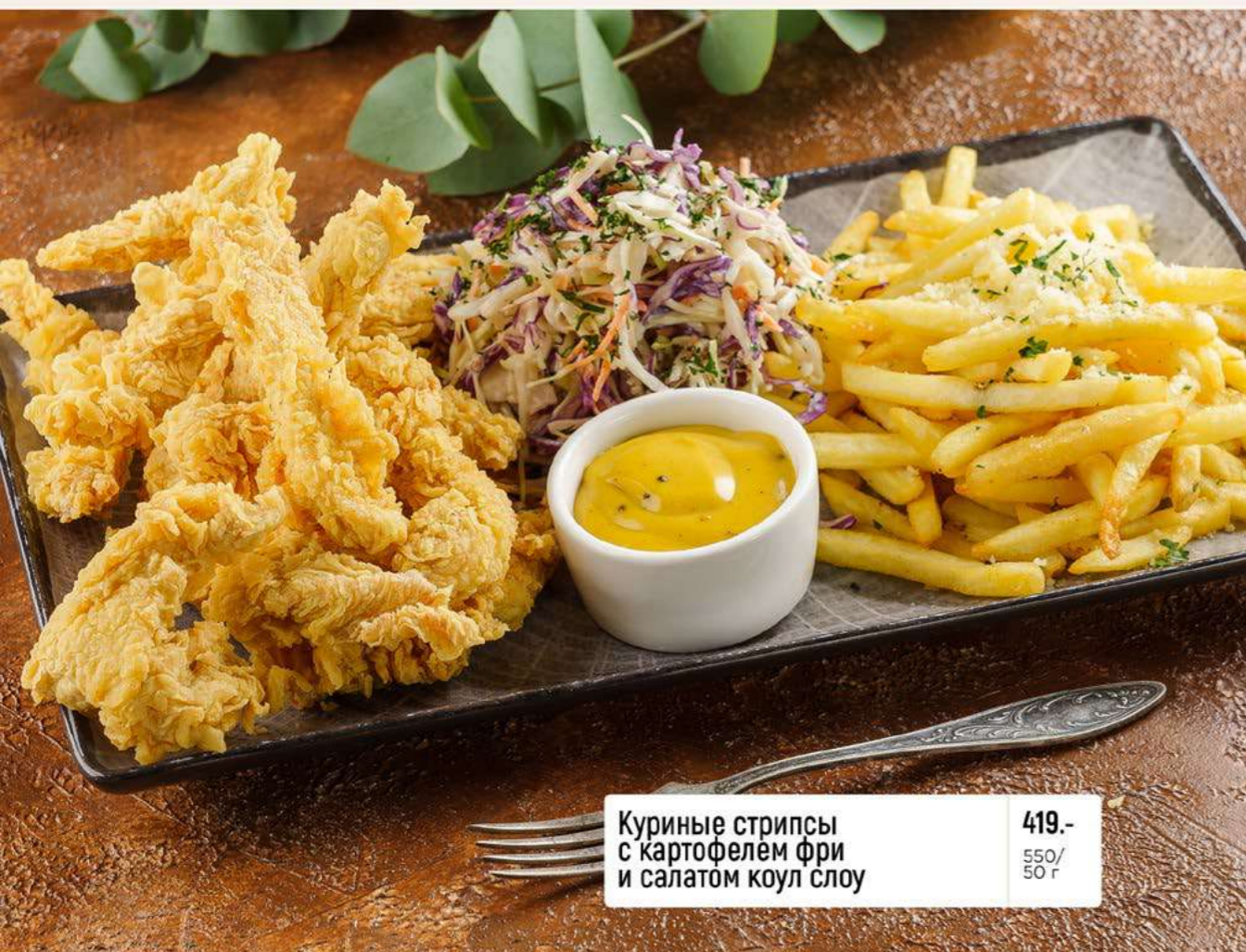
Куриные стрипсы с картофелем фри и салатом коул слоу 419.- 550/50 г