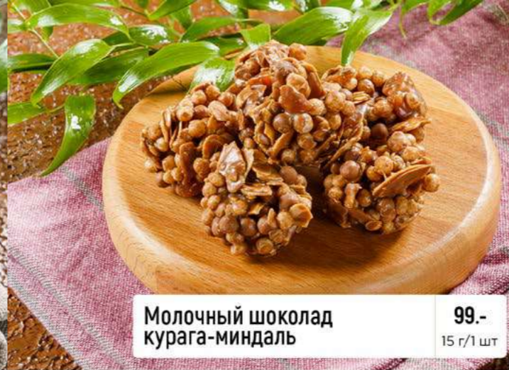
Молочный шоколад курага-миндаль