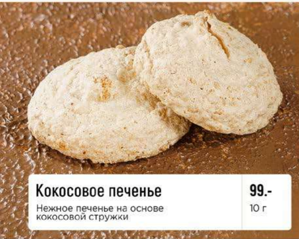
Кокосовое печенье Нежное печенье на основе кокосовой стружки 99.- 10 г