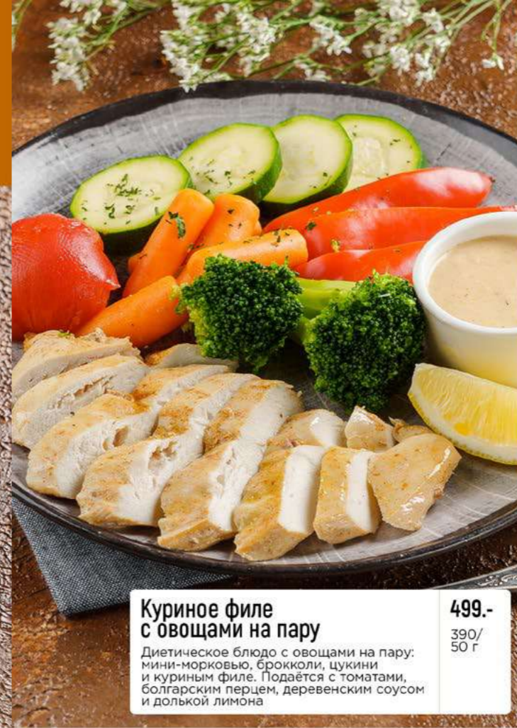
Куриное филе с овощами на пару 499.- Диетическое блюдо с овощами на пару: мини-морковью, брокколи, цукини и куриным филе. Подается с томатами, болгарским перцем, деревенским соусом и долькой лимона 390/ 50 г