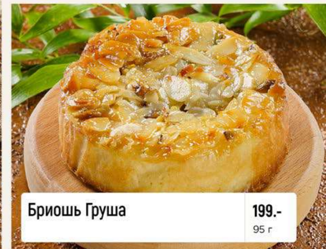
Бриошь Груша 199.- 95 г