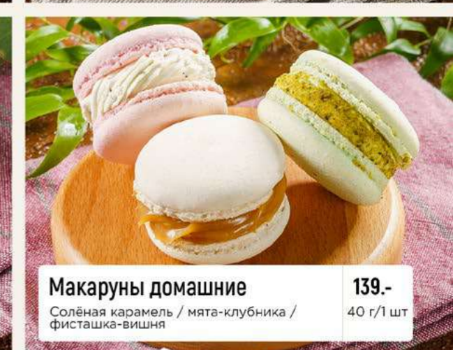
Макаруны домашние Солёная карамель / мята-клубника / фисташка-вишня