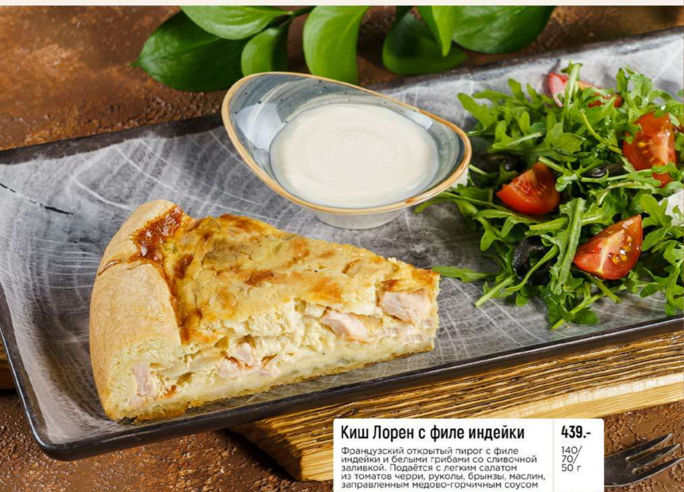
Киш Лорен с филе индейки 439.- Французский открытый пирог с филе индейки и белыми грибами со сливочной заливкой. Подается с легким салатом из томатов черри, руколы, брынзы, маслин, заправленным медово-горчичным соусом