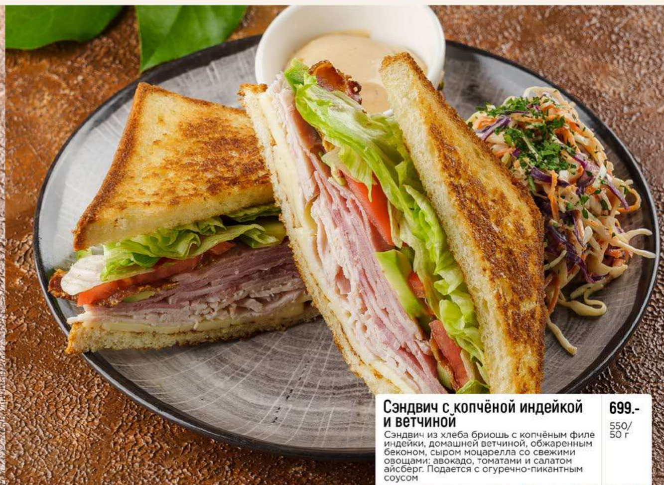
Сэндвич с копчёной индейкой и ветчиной 699.- Сэндвич из хлеба бриошь с копчёным филе индейки, домашней ветчиной, обжаренным беконом, сыром моцарелла со свежими овощами: авокадо, томатами и салатом айсберг. Подается с огуречно-пикантным соусом 550/ 50 г