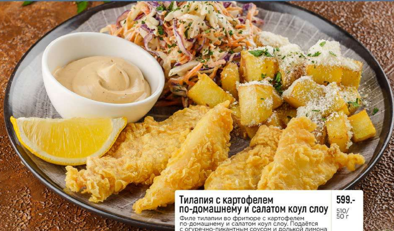
Тилапия с картофелем по-домашнему и салатом коул слоу 599.- 510/ 50 г Филе тилапии во фритюре с картофелем по-домашнему и салатом коул слоу. Подается с огуречно-пикантным соусом и долькой лимона