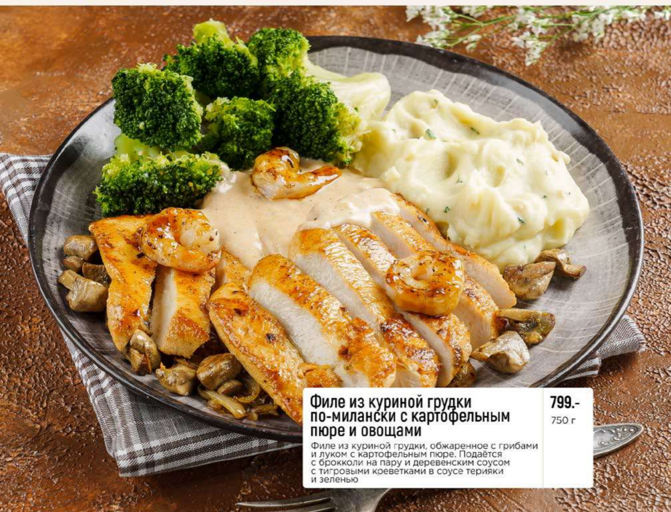
Филе из куриной грудки по-милански с картофельным пюре и овощами 799.- Филе из куриной грудки, обжаренное с грибами и луком с картофельным пюре. Подается с брокколи на пару и деревенским соусом с тигровыми креветками в соусе терияки и зелению 750 г