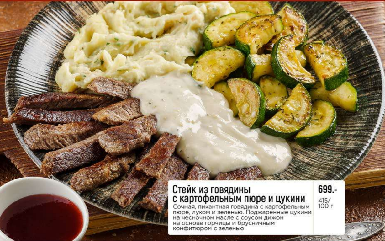
Стейк из говядины с картофельным пюре и цукини 699.- 415/100 г Сочная, пикантная говядина с картофельным пюре, луком и зеленью. Поджаренные цукини на чесночном масле с соусом дижон на основе горчицы и брусничным конфитюром с зеленью