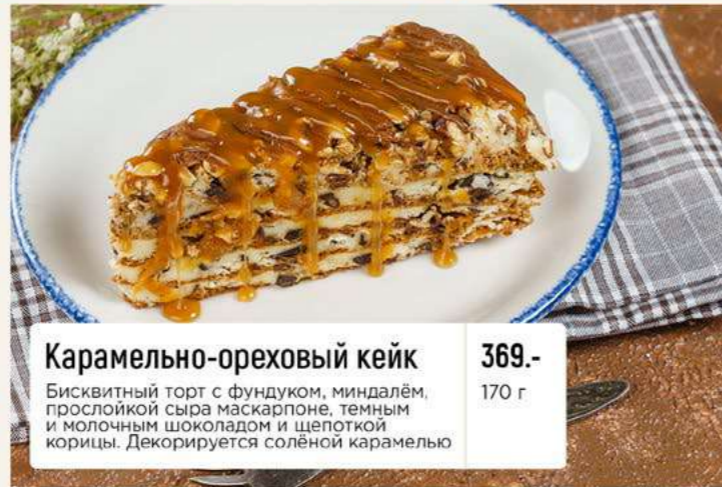
Карамельно-ореховый кейк Бисквитный торт с фундуком, миндалём, прослойкой сыра маскарпоне, темным и молочным шоколадом и щепоткой корицы. Декорируется солёной карамелью 369.- 170 г