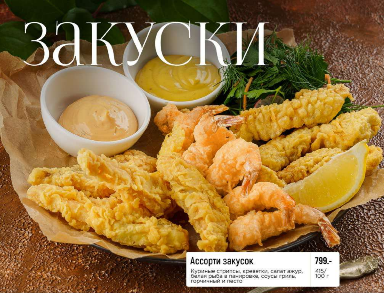
Ассорти закусок 799.- Куриные стрипсы, креветки, салат ажур, белая рыба в панировке, соусы гриль, горчиный и песто 415/100 г