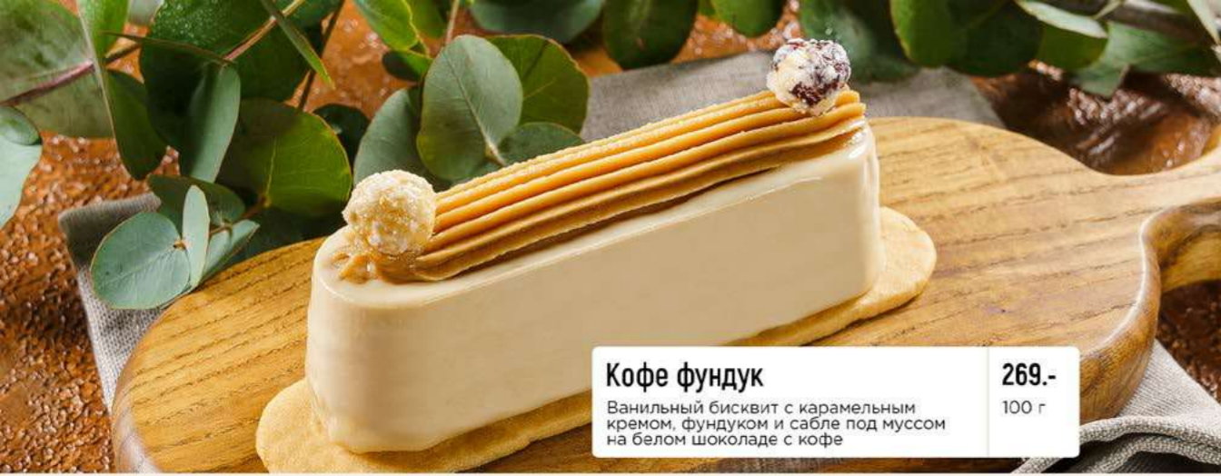
Кофе фундук Ванильный бисквит с карамельным кремом, фундуком и сабле под муссом на белом шоколаде с кофе 269.- 100 г