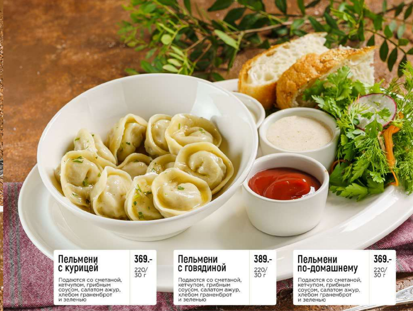
Пельмени с курицей 369.- 220/30 г Подаются со сметаной, кетчупом, грибным соусом, салатом ажур, хлебом граненброт и зеленью