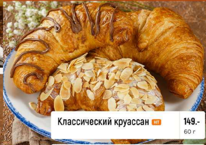
Классический круассан HIT 149.- 60 г