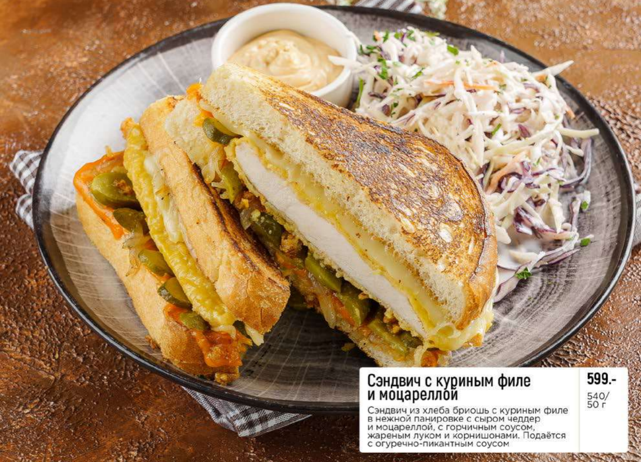
Сэндвич с куриным филе и моцареллой 599.- Сэндвич из хлеба бриошь с куриным филе в нежной панировке с сыром чеддер и моцареллой, с горчичным соусом, жареным луком и корнисионами. Подается с огуречно-пикантным соусом 540/ 50 г