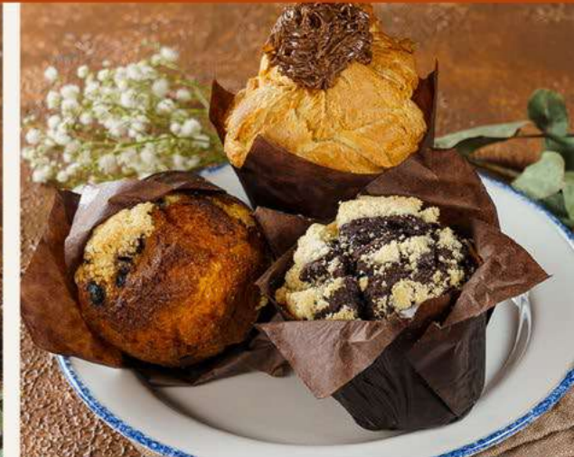
Маффин классический с черникой HIT 139.- 90 г