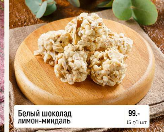
Белый шоколад лимон-миндаль