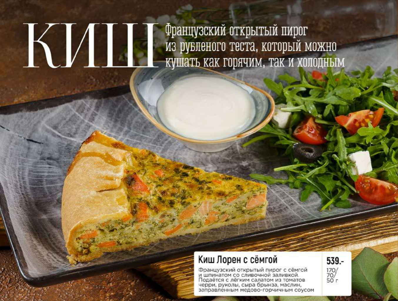
Киш Лорен с сёмгой 539.- Французский открытый пирог с сёмгой и шпинатом со сливочной заливкой. Подается с легким салатом из томатов черри, руколы, сыра брынза, маслин, заправленным медово-горчичным соусом