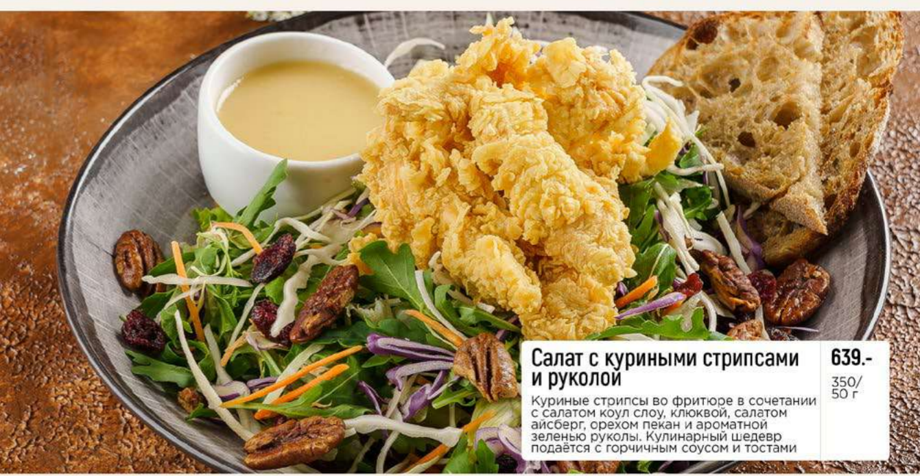
Салат с куриными стрипсами и руколой 639.- Куриные стрипсы во фритюре в сочетании с салатом коул слоу, клюквой, салатом айсберг, орехом пекан и ароматной зеленью руколы. Кулинарный шедевр подается с горчичным соусом и тостами