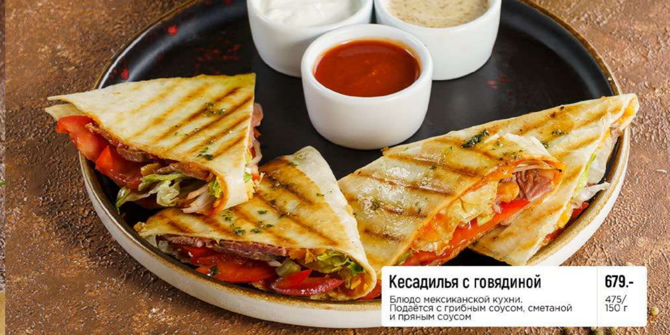
Кесадилья с говядиной 679.- Блюдо мексиканской кухни. Подается с грибным соусом, сметаной и пряным соусом 475/150 г