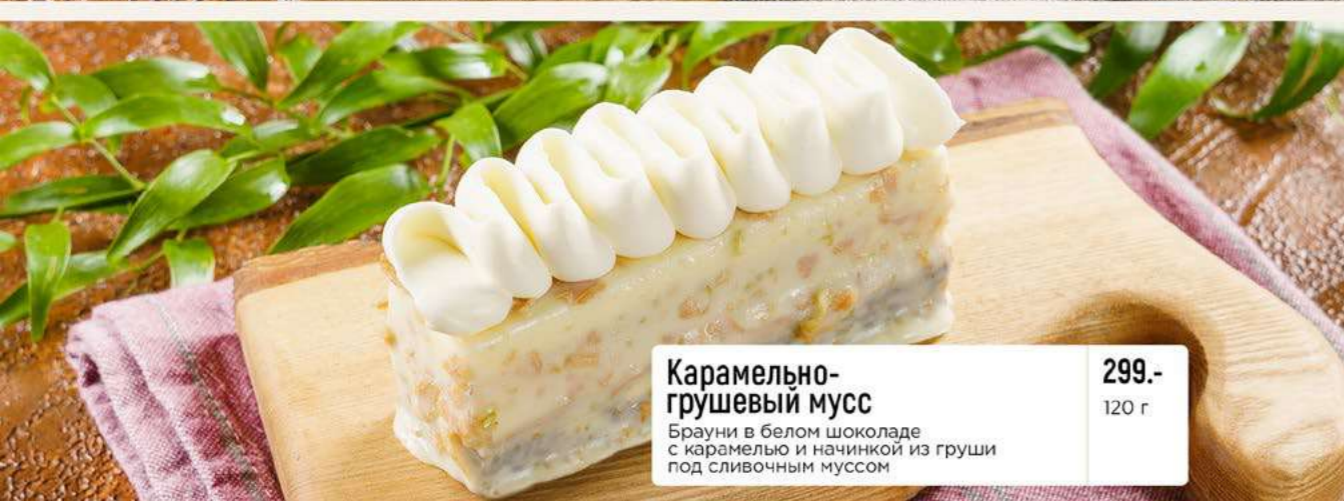
Карамельно- грушевый мусс Брауни в белом шоколаде с карамелью и начинкой из груши под сливочным муссом