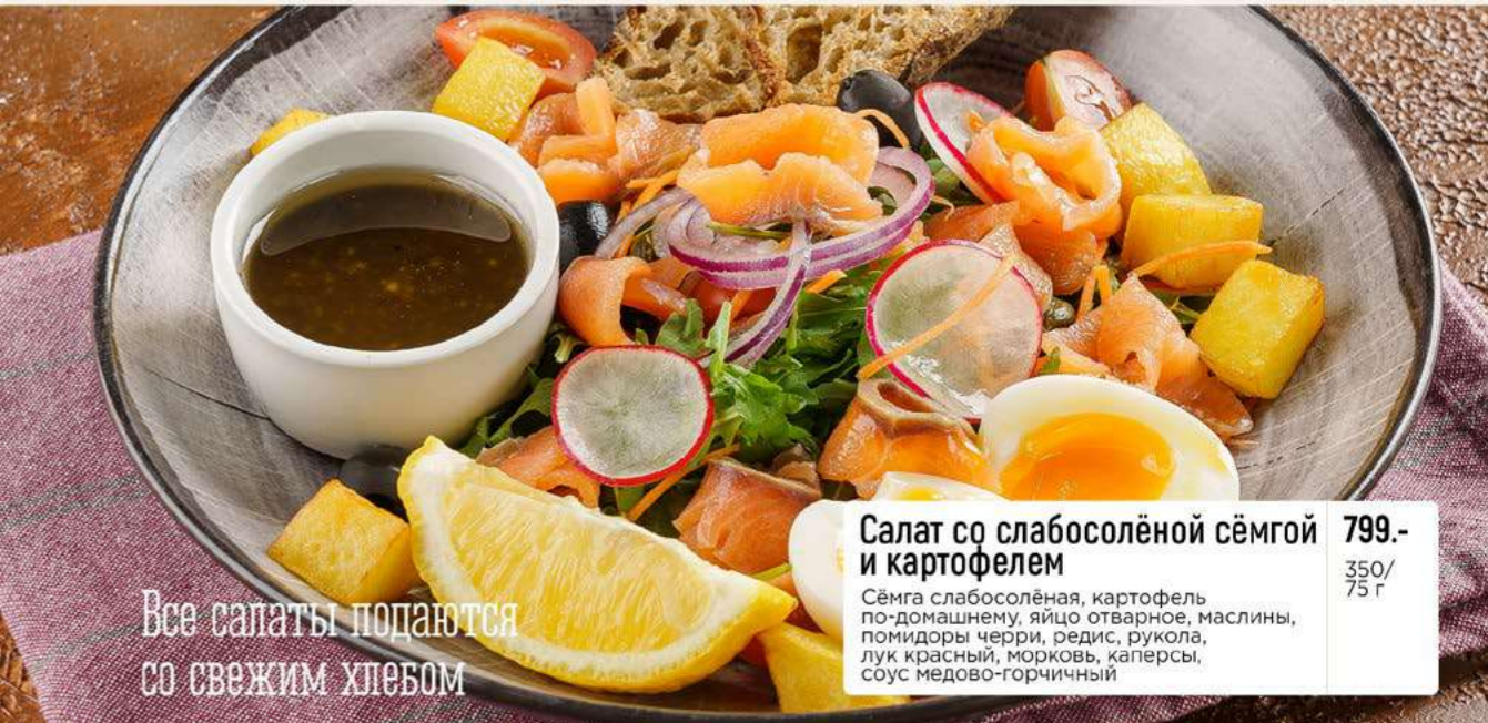
Салат со слабосоленой сёмгой и картофелем 799.- Сёмга слабосоленая, картофель по-домашнему, яйцо отварное, маслины, помидоры черри, редис, рукола, лук красный, морковь, каперсы, соус медово-горчичный