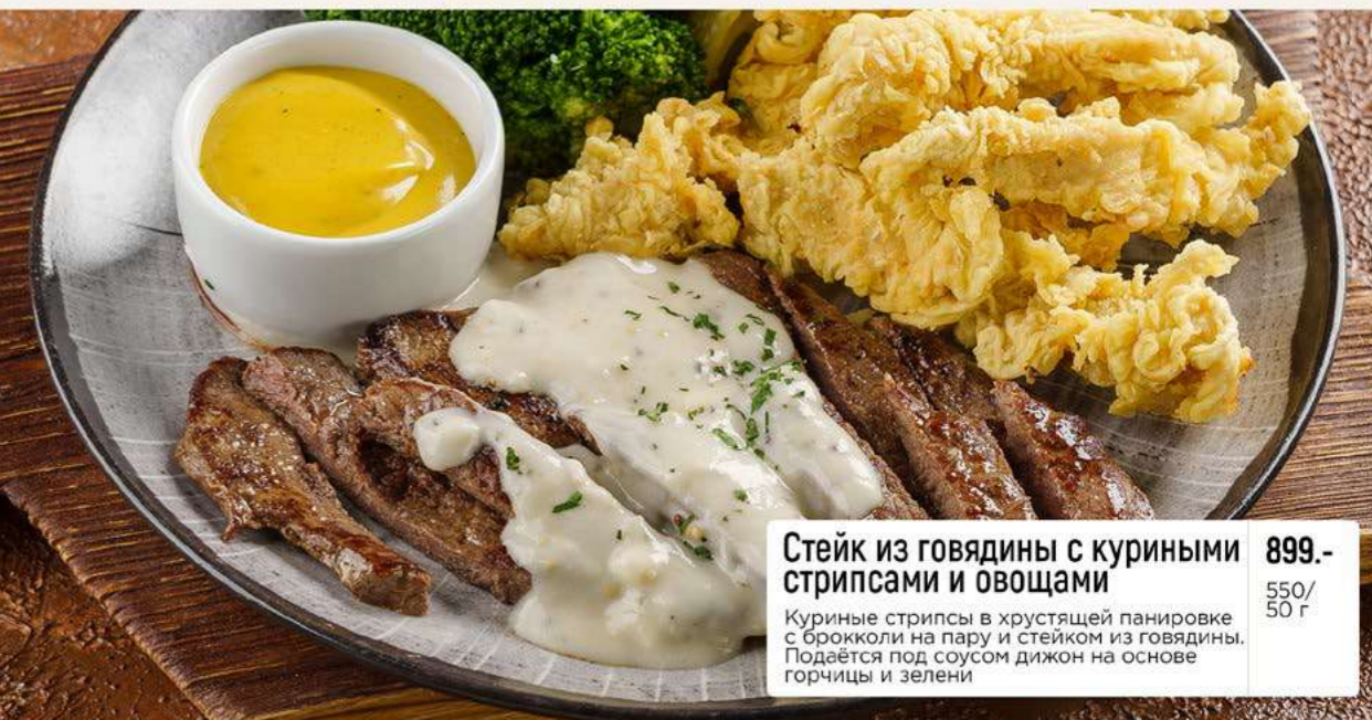
Стейк из говядины с куриными стрипсами и овощами 899.- 550/50 г Куриные стрипсы в хрустящей панировке с брокколи на пару и стейком из говядины. Подается под соусом дижон на основе горчицы и зелени