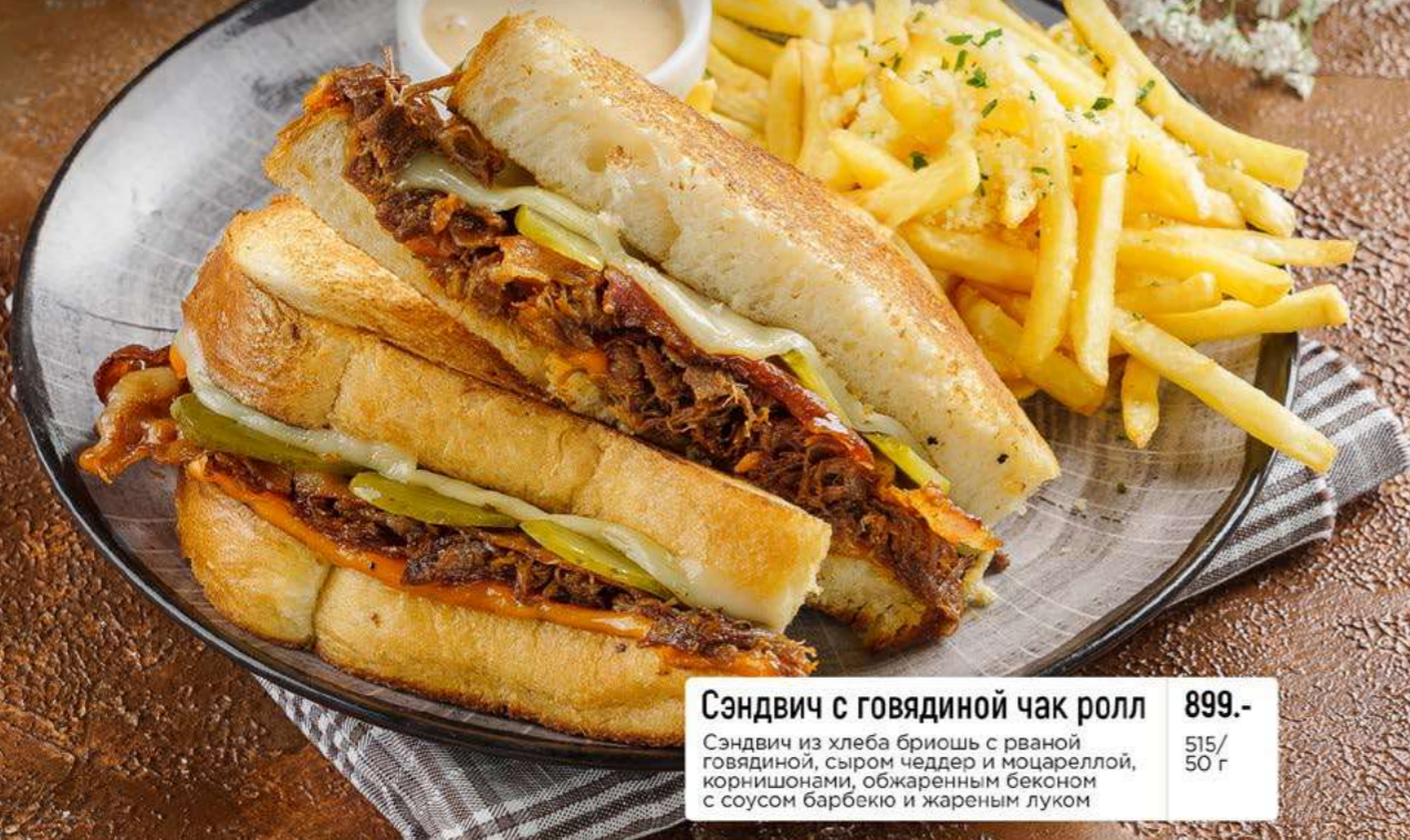
Сэндвич с говядиной чак ролл 899.- Сэндвич из хлеба бриошь с рваной говядиной, сыром чеддер и моцареллой, корнисионами, обжаренным беконом с соусом барбекю и жареным луком 515/ 50 г