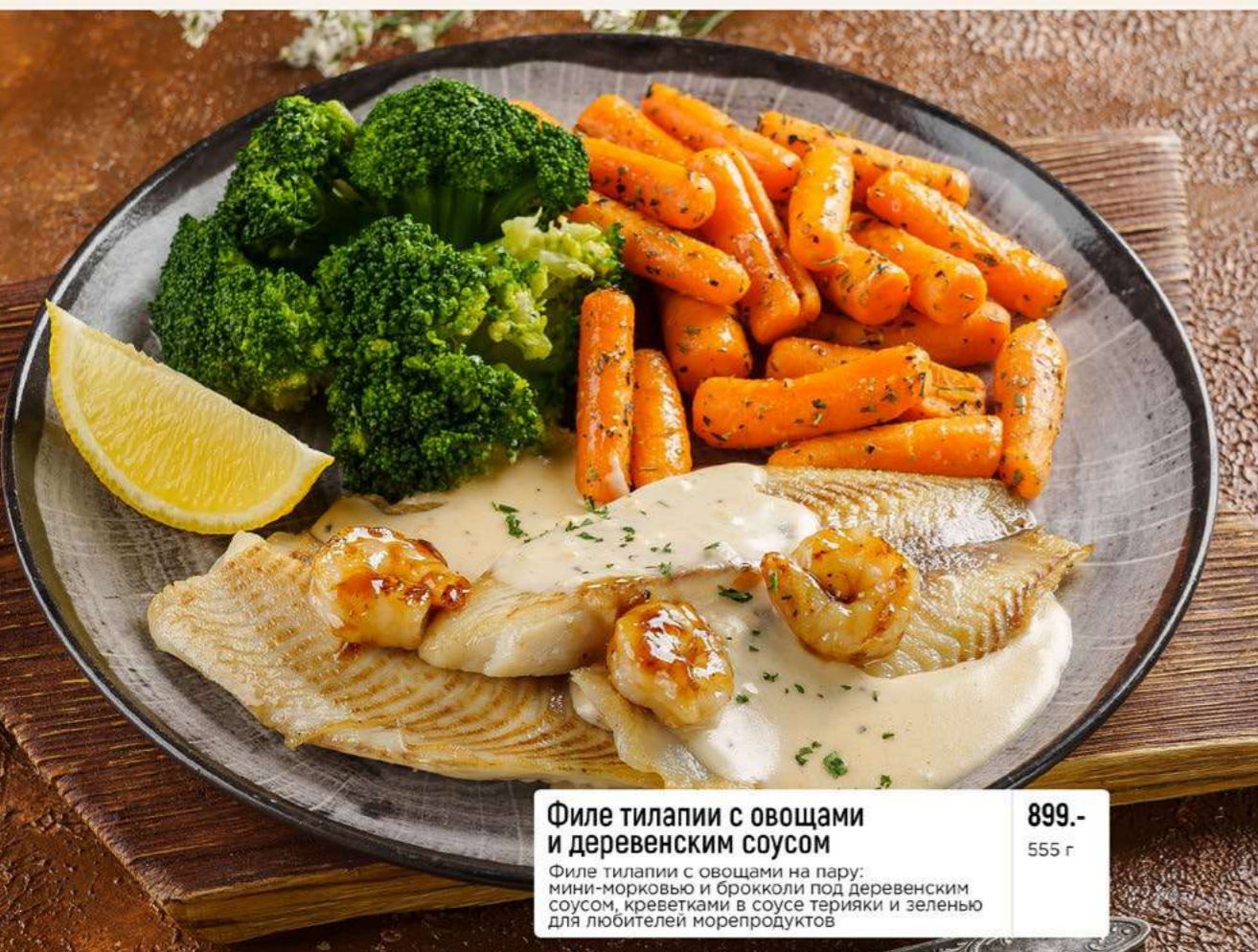
Филе тилапии с овощами и деревенским соусом 899.- 555 г Филе тилапии с овощами на пару: мини-морковью и брокколи под деревенским соусом, креветками в соусе терияки и зеленью для любителей морепродуктов