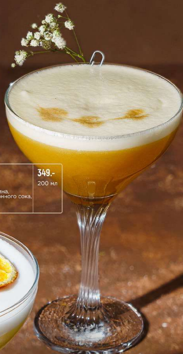
Сердце Афродиты Heart of Aphrodite

Фирменный коктейль с бодрящим сочетанием кофе и терпкого шотландского виски и с нежным сливочным послевкусием