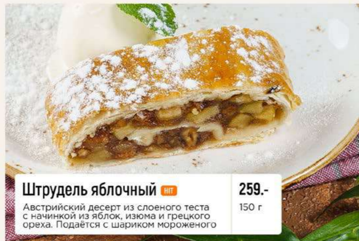
Штрудель яблочный HIT 259.- 150 г