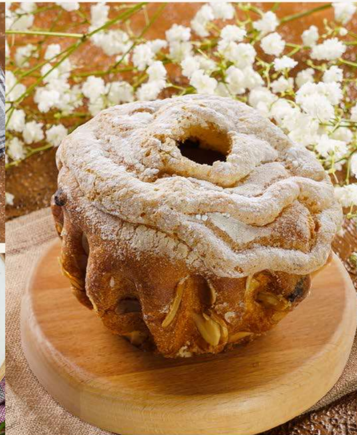
Бриошь шоколадный 229.- 120 г