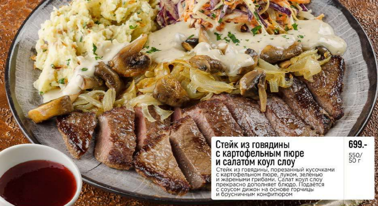
Стейк из говядины с картофельным пюре и салатом коул слоу 699.- 550/50 г Стейк из говядины, порезанный кусочками с картофельным пюре, луком, зеленью и жареными грибами. Салат коул слоу прекрасно дополняет блюдо. Подается с соусом дижон на основе горчицы и брусничным конфитюром