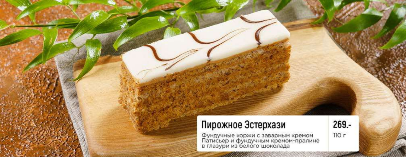
Пирожное Эстерхази Фундучные коржи с заварным кремом Патисьер и фундучным кремом-пранлине в глазури из белого шоколада