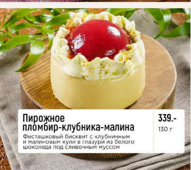
Пирожное плёмбир-клубника-малина Фисташковый бисквит с клубничным и малиновым кули в глазури из белого шоколада под сливочным муссом