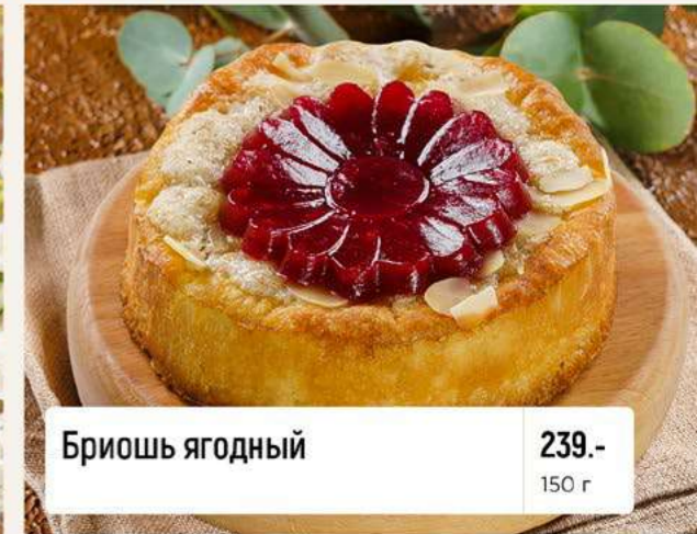
Бриошь ягодный 239.- 150 г