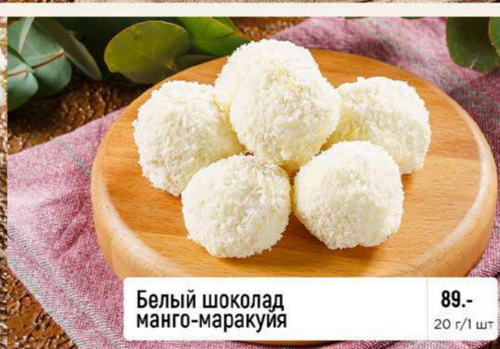
Белый шоколад манго-маракуйя