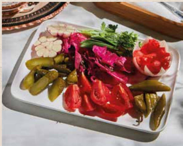
ДОМАШНИЕ СОЛЕНЬЯ 900₽ TURSU TABAGI 700г

свежие сезонные овощи fresh seasonal vegetables