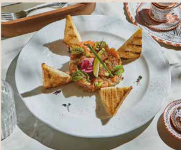
ТАРТАР 1100₽ TARTAR говядина 1200₽ 200г лосось

шесть видов домашних солений с зеленью six types of homemade pickles