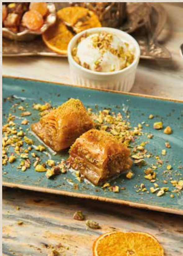
С ФИСТАШКАМИ 650₽ FISTIKLI BAKLAVA 2шт