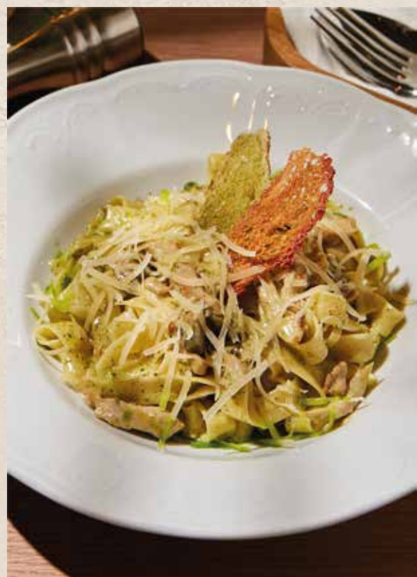
ФЕТУЧИНИ С ЦЫПЛЕНКОМ TAVUK VE MANTARLI FETTUCCHINE

with salmon, onion, garlic, pesto sauce and Parmesan cheese