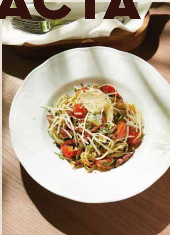
СПАГЕТТИ С ТЕЛЯТИНОЙ DANA SPAGETTI

tiger prawns, cherry tomatoes, garlic, onion and cheese, in cream sauce and pesto