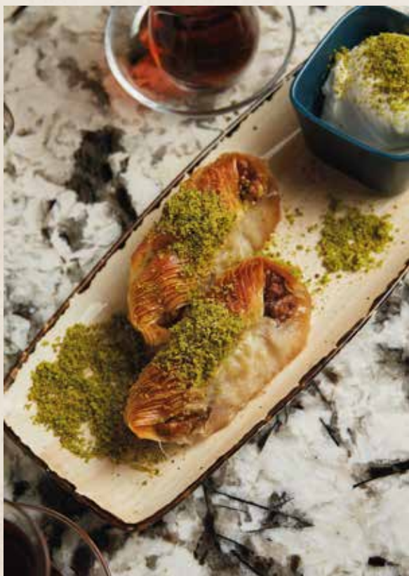
СЛИВОЧНАЯ ПАХЛАВА 690₽ CREMALI BAKLAVA 2шт