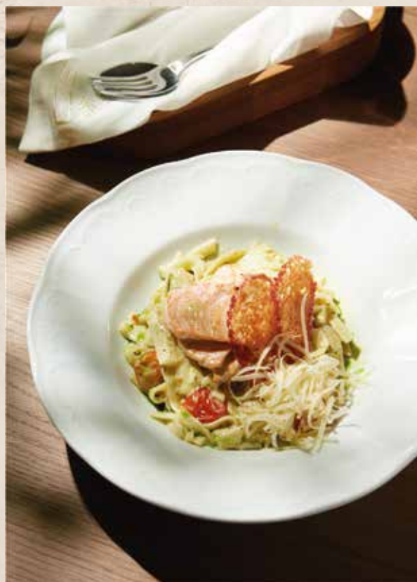
ТАЛЬЯТЕЛЛЕ С ЛОСОСЕМ SOMONLU TAGLIATELLE

with veal, sun-dried tomatoes, bell peppers, garlic, Parmesan cheese and pesto sauce