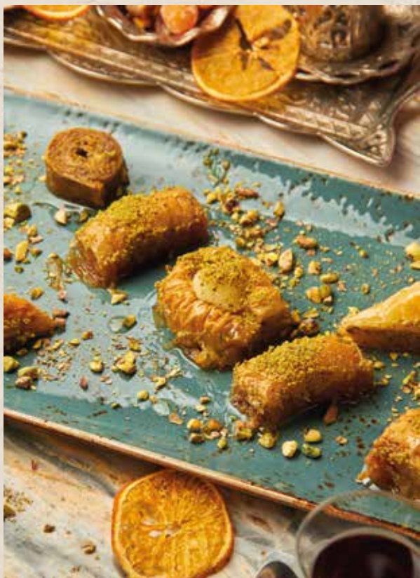
АССОРТИ ПАХЛАВЫ 1750₽ BAKLAVA TABAGI 500г