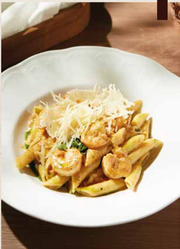
ПЕННЕ С КРЕВЕТКАМИ KARIDESLI PENNE