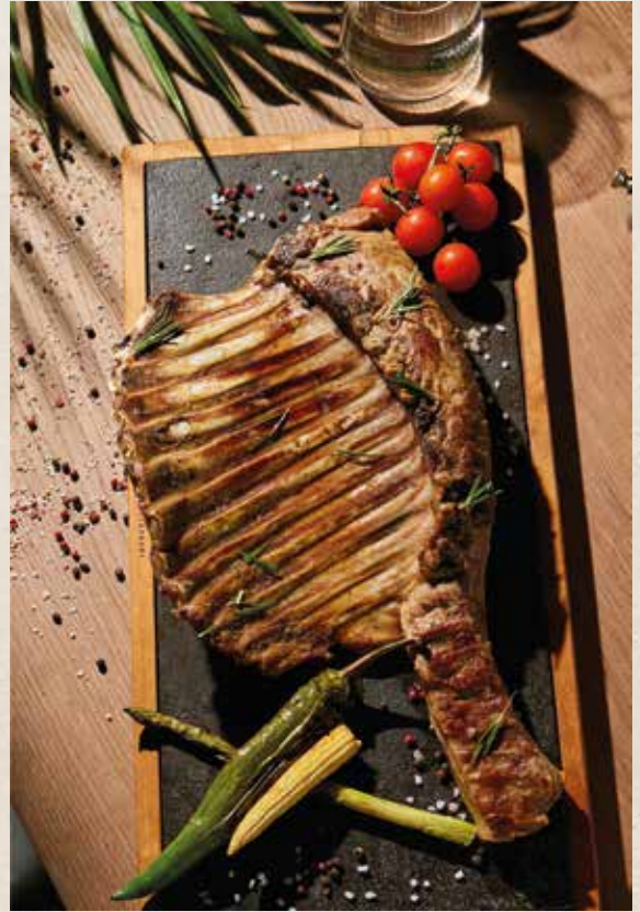
БАРАНЬИ РЕБРЫШКИ 8500₽ KUZU KABURGA 1500г