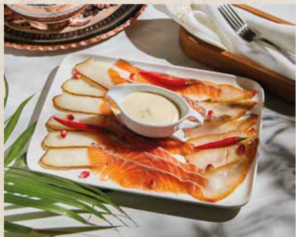
РЫБНОЕ ПЛАТО 1750₽ BALIK TABAGI 550г

пять видов сырных деликатесов, виноград, орехи и мёд six types of deli meats, served with special sauce.