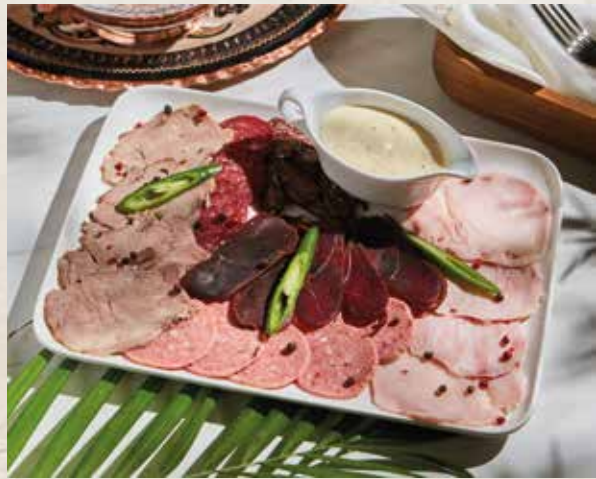
МЯСНАЯ ТАРЕЛКА 1700₽ ET TABAGI 600г

шесть видов мясных деликатесов, подаётся со специальным соусом и острым перцем six types of deli meats, served with special sauce.