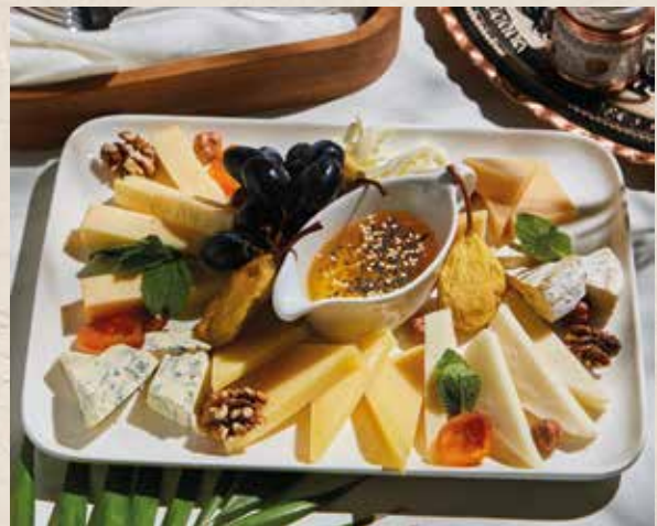
СЫРНОЕ ПЛАТО 1500₽ PEYNIR TABAGI 750г

шесть видов мясных деликатесов, подаётся со специальным соусом и острым перцем six types of deli meats, served with special sauce.