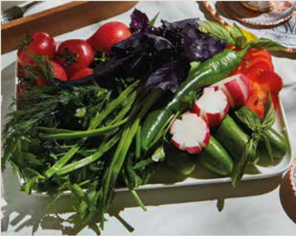
СЕЗОННЫЕ ОВОЩИ 1500₽ MEVSIM SEBZELERI 800г

свежие сезонные овощи fresh seasonal vegetables