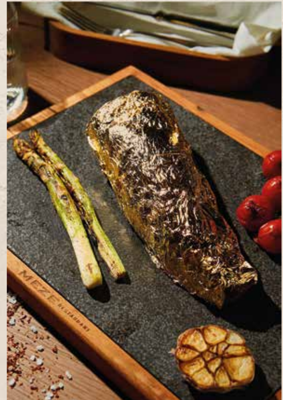
ЗОЛОТОЙ СТЕЙК БОНФИЛЕ ALTIN STEAK «BONFILE»

special serving from the chef. please note that serving time is over 1 hour