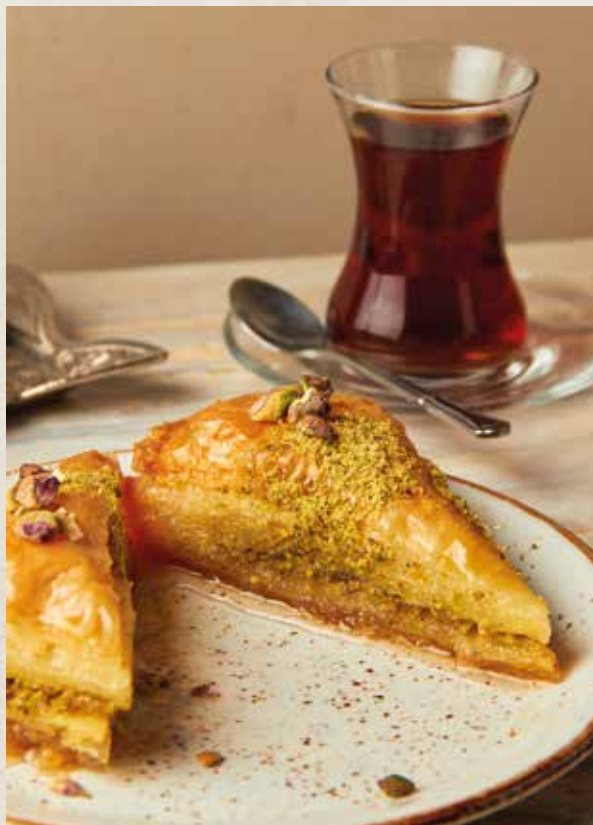
ХАВУЧ ДИЛИМИ 750₽ HAVUC DILIMI 1шт