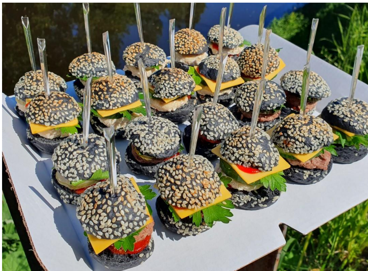
Чёрный бургер (20 штук)