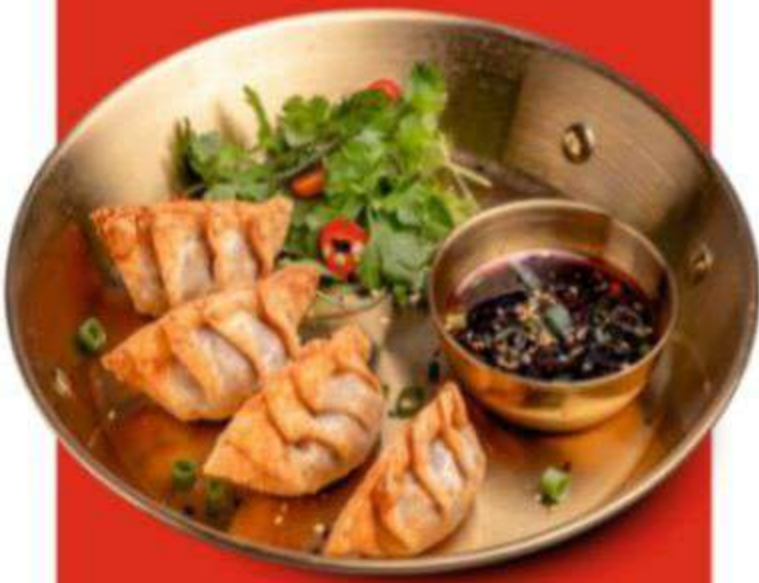
ГЕДЗА С КУРИЦЕЙ 380 ГЕДЗА С КРЕВЕТКОЙ 450