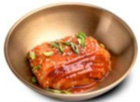
КАПУСТА КИМЧИ 180