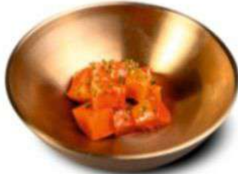
МАРИНОВАННАЯ РЕДЬКА 180