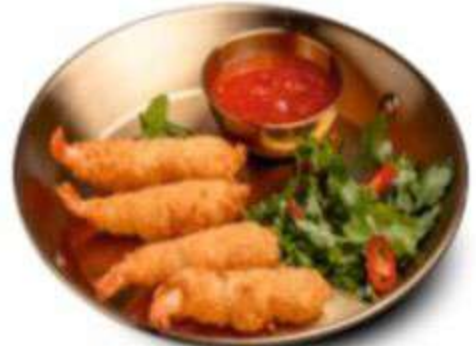
КРЕВЕТКИ В ПАНИРОВКЕ С ЧИЛИ-СЛАДКИМ СОУСОМ 490