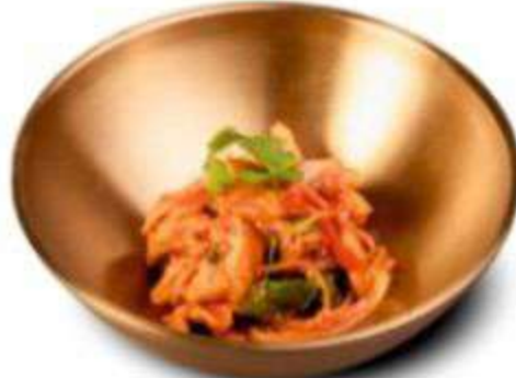
ХЕ ИЗ МОРСКОГО ОКУНЯ 250