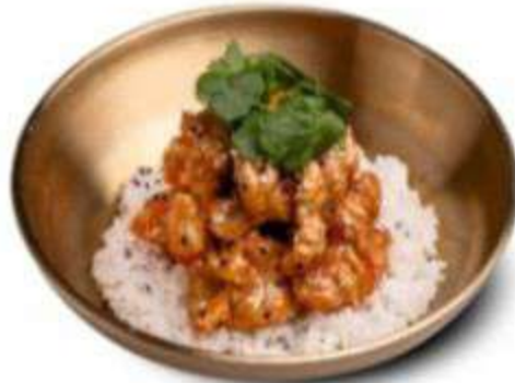
ЦЫПЛЕНОК ТЕМПУРА В ЧИЛИ-СЛАДКОМ СОУСЕ 390