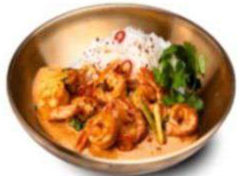
КУРИЦА ТОМ ЯМ | КРЕВЕТКИ ТОМ ЯМ 490 590