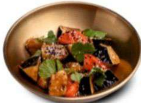
ХРУСТЯЩИЕ БАКЛАЖАНЫ С ТОМАТАМИ 390