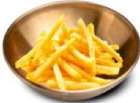
КАРТОФЕЛЬ ФРИ СО СПАЙСИ СОУСОМ 180