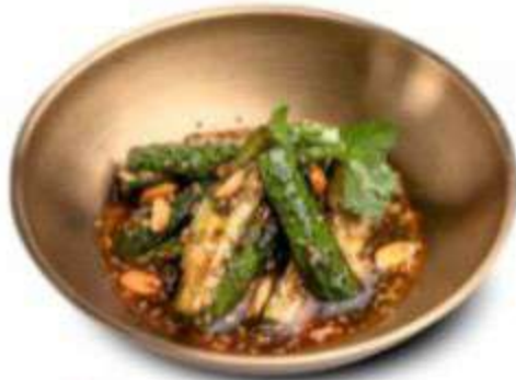
БИТЫЕ ОГУРЦЫ 200