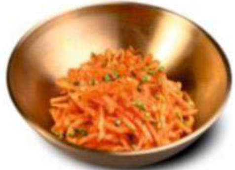
МОРКОВЬ ПО-КОРЕЙСКИ 180