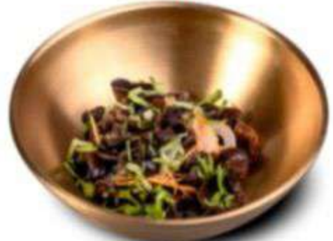
ДРЕВЕСНЫЕ ГРИБЫ МОЗР 180