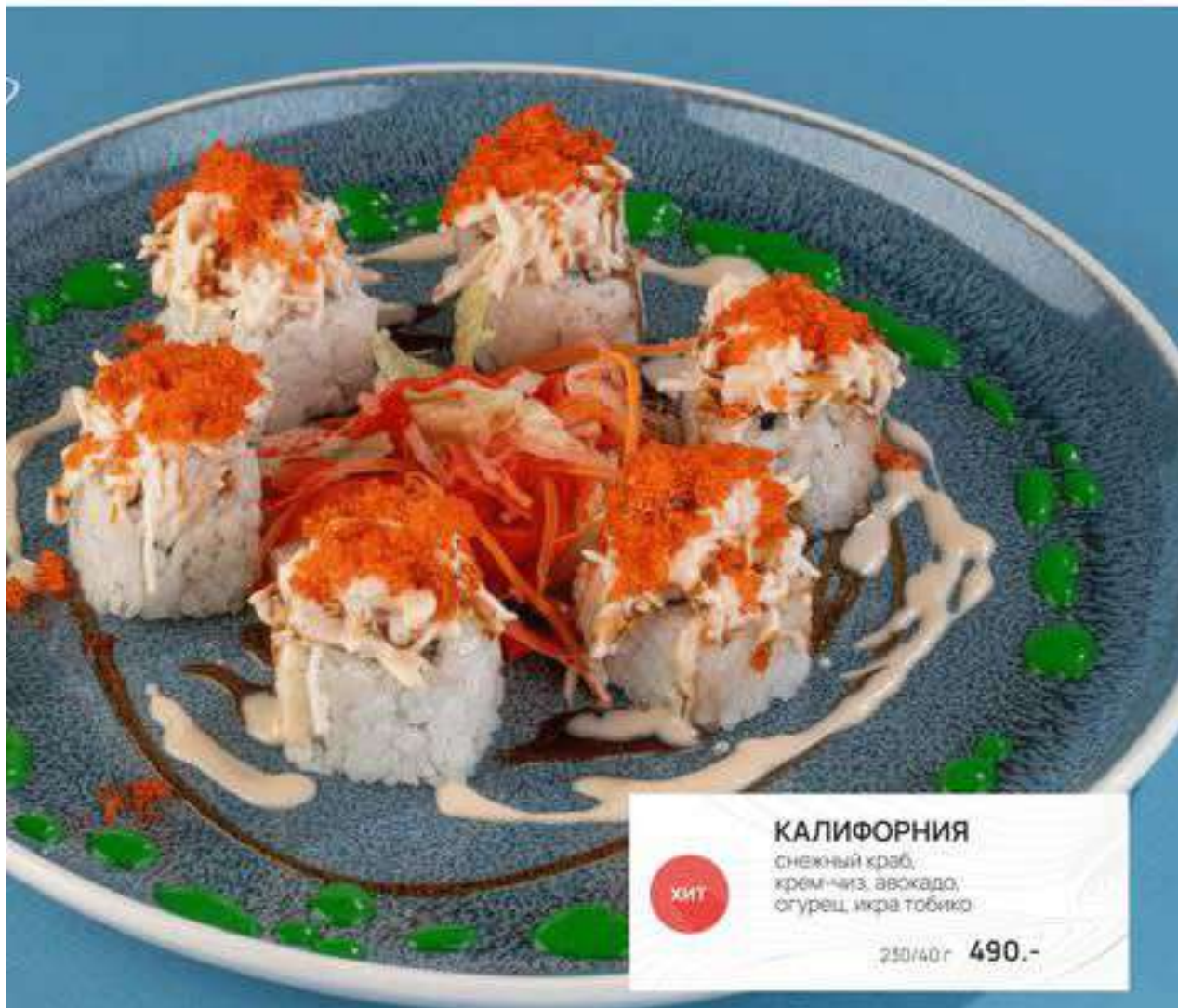
КАЛИФОРНИЯ снежный краб, крем-чиз, авокадо, огурец, икра тобико 250/40г 490.-