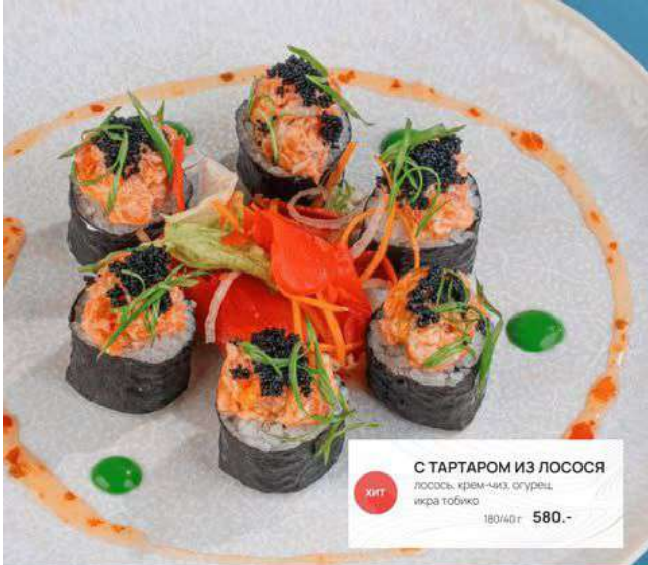
С ТАРТАРОМ ИЗ ЛОСОСЯ лосось, крем-чиз, огурец, икра тобико 180/40г 580.-