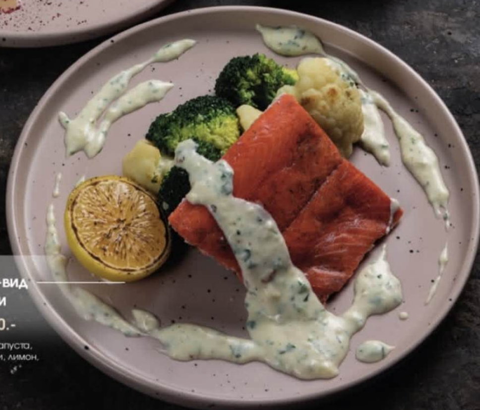
Нерка Су-вид с овощами 280г | 1200.-

куриная грудка, баклажан, сладкий перец, шампиньоны, цукини, соус чимичурри