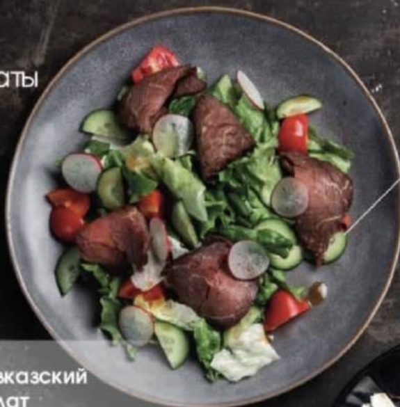
Салат с ростбифом 200г | 620.-

ростбиф, микс салата, огурец, редис, черри, заправка азиатская