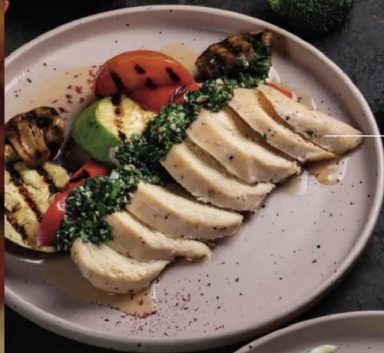
Куриная грудка су-вид с овощами гриль 300г | 520.-

куриная грудка, баклажан, сладкий перец, шампиньоны, цукини, соус чимичурри