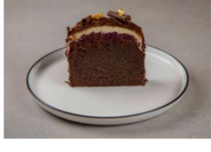
Кекс темный лес