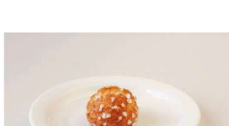
Профитроль с ванильным кремом