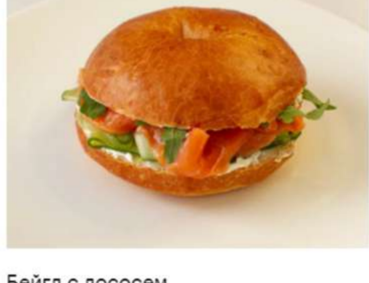
Бейгл с лососем