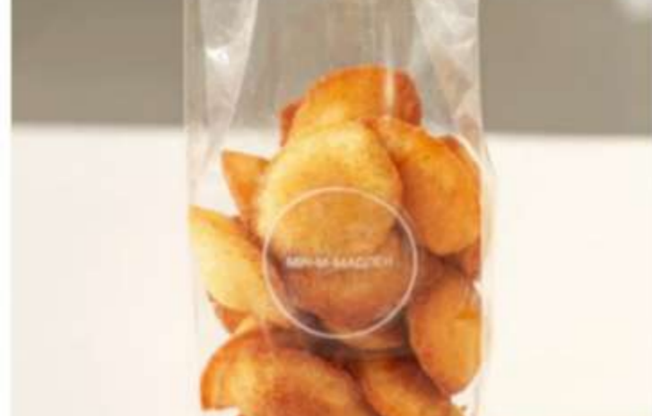
Мини-мадлен — лимон