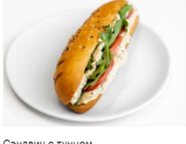
Сэндвич с тунцом