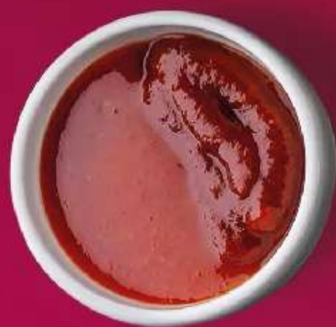
ОСТРЫЙ СОУС НА ОСНОВЕ КИМЧИ И ШРИРАЧА 30мл 90