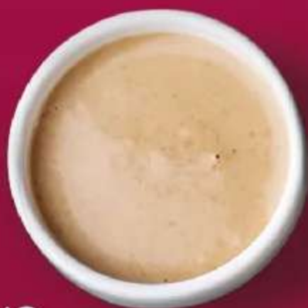
СОУС ГАМАДАРИ 30мл 90