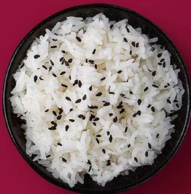
РИС ЖАСМИН 100ГР 150