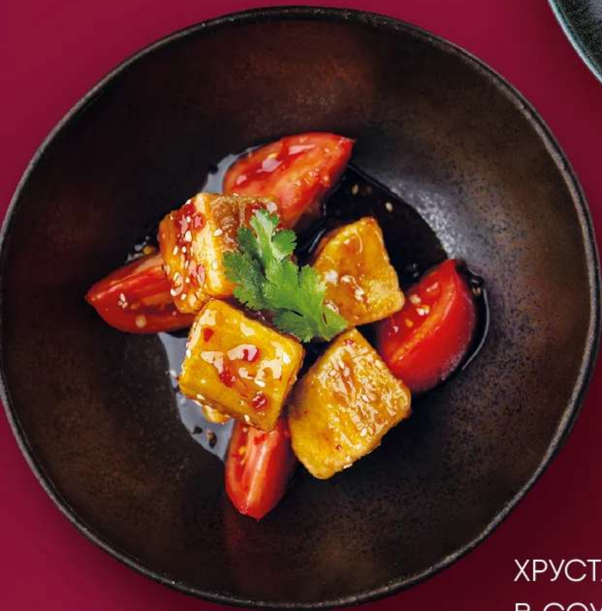
ХРУСТЯЩИЕ БАКЛАЖАНЫ В СОУСЕ СЛАДКИЙ ЧИЛИ 240ГР 490