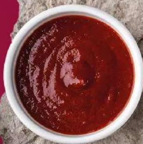
СОУС КИМЧИ 30мл 90