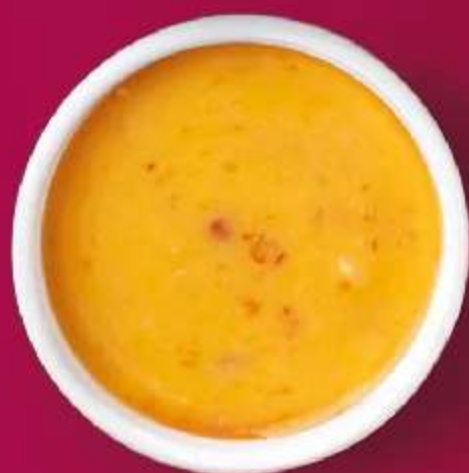
СОУС ОСТРО-СЛИВОЧНЫЙ 30мл 90