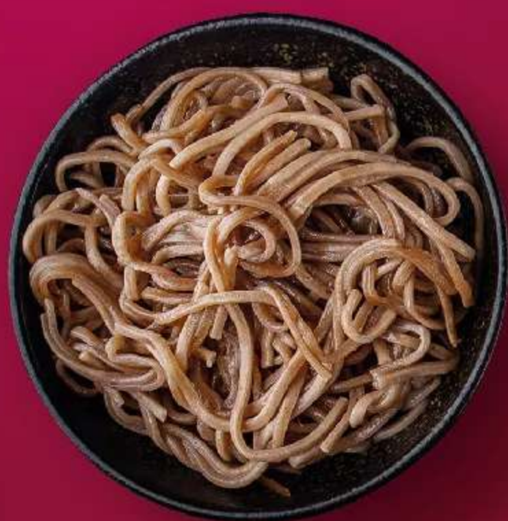
ЛАПША СОБА 120ГР 150