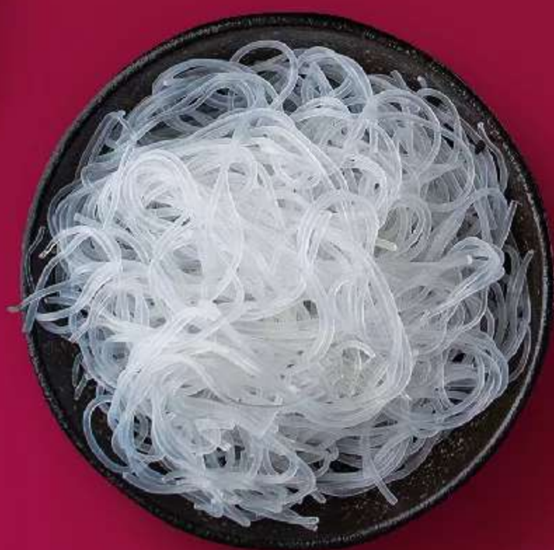
СТЕКЛЯННАЯ ЛАПША 120ГР 150