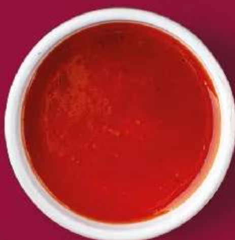
СОУС ШРИРАЧА 30мл 90