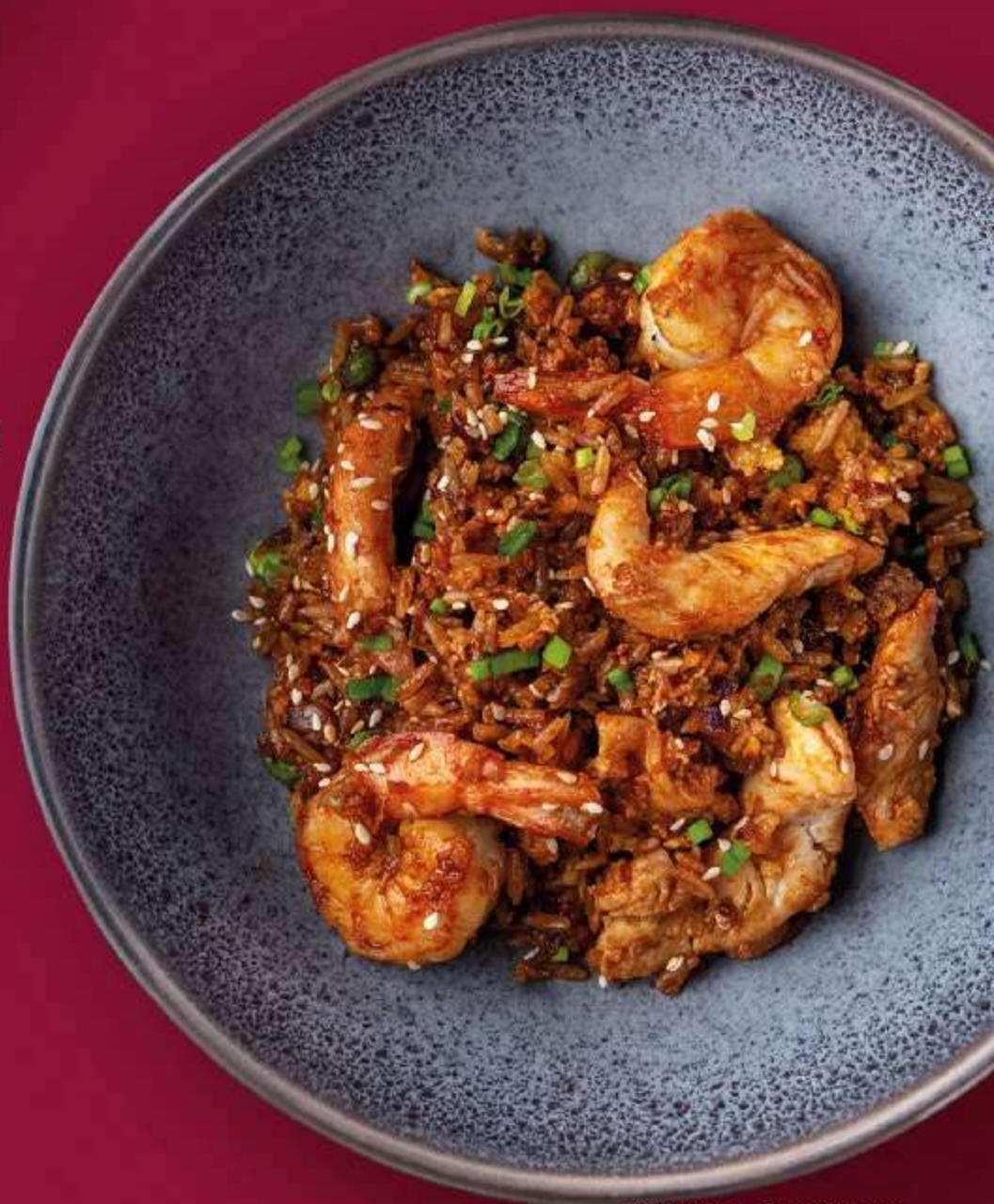
РИС ЖАСМИН, ТИГРОВЫЕ КРЕВЕТКИ, КУРИНОЕ ФИЛЕ, ЯЙЦО, СОУС КИМЧИ