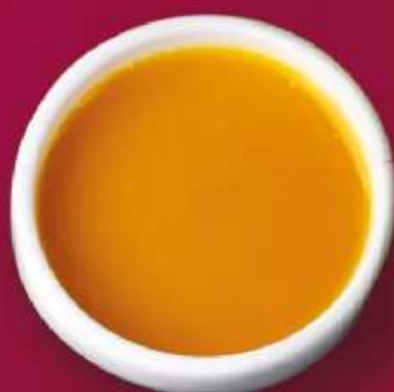
СОУС МАНГОВЫЙ 30мл 90