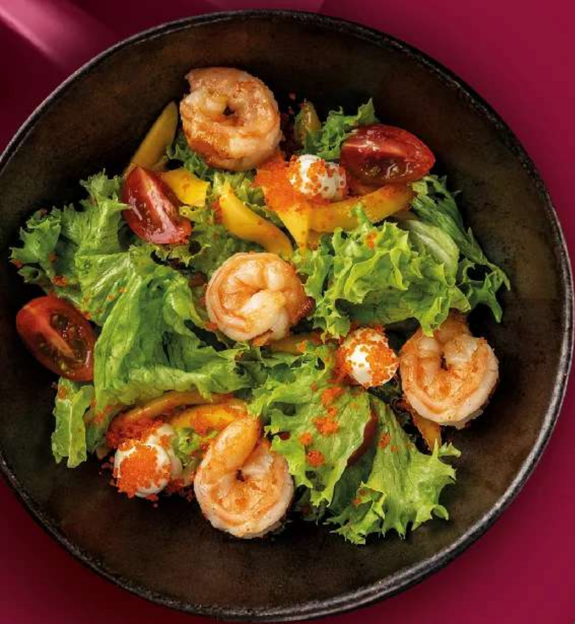
САЛАТ С КРЕВЕТКАМИ В СОЕВО-КУНЖУТНОМ СОУСЕ 190ГР 590

ТИГРОВЫЕ КРЕВЕТКИ, МИКС САЛАТОВ, ЖЕЛТЫЙ МАНГО, ЧЕРРИ, ФРУКТОВЫЙ СЫР, РОССЫПЬ ТОБИКИ, СОЕВО-КУНЖУТНЫЙ СОУС