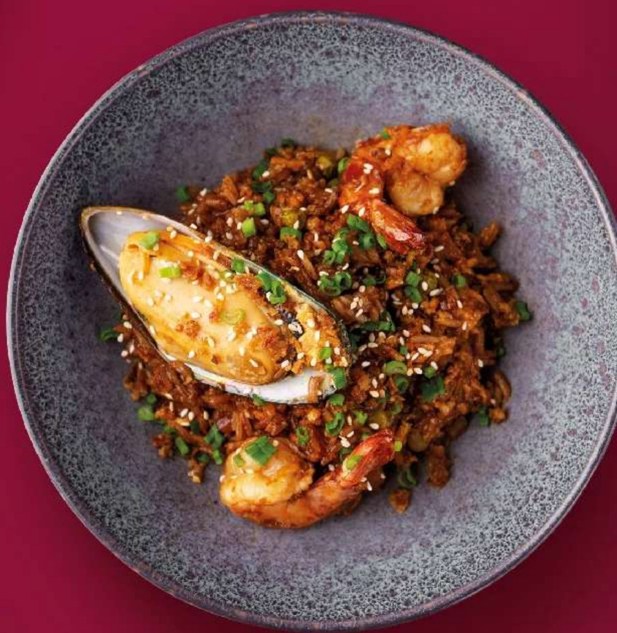
РИС ЖАСМИН, ТИГРОВЫЕ КРЕВЕТКИ, НОВОЗЕЛАНДСКАЯ МИДИЯ, ЯЙЦО, ЛУК