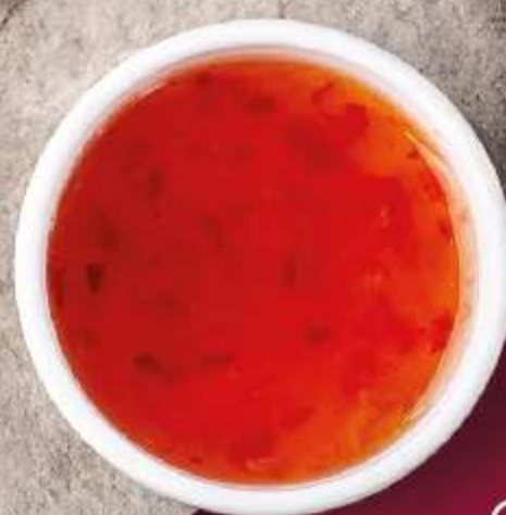
СОУС СЛАДКИЙ ЧИЛИ 30мл 90