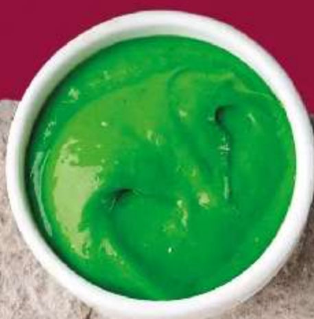
СОУС ВАСАБИ- СГУЩЕННОЕ МОЛОКО 30мл 90