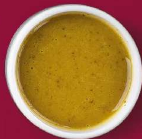
СОУС ТАЙСКИЙ 30мл 90