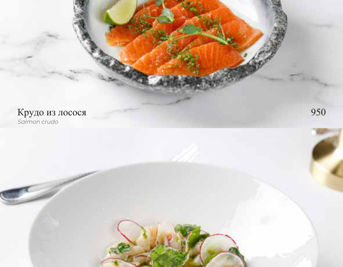
Крудо из сибаса с апельсином Sea bass with orange crudo