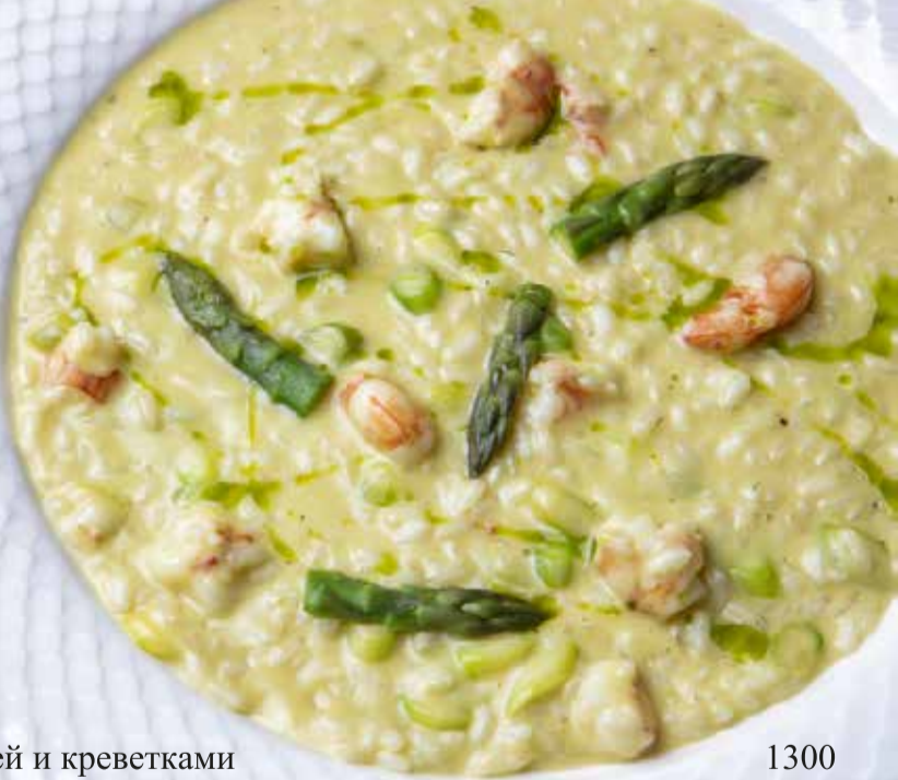
Ризотто со спаржей и креветками Asparagus and shrimp risotto