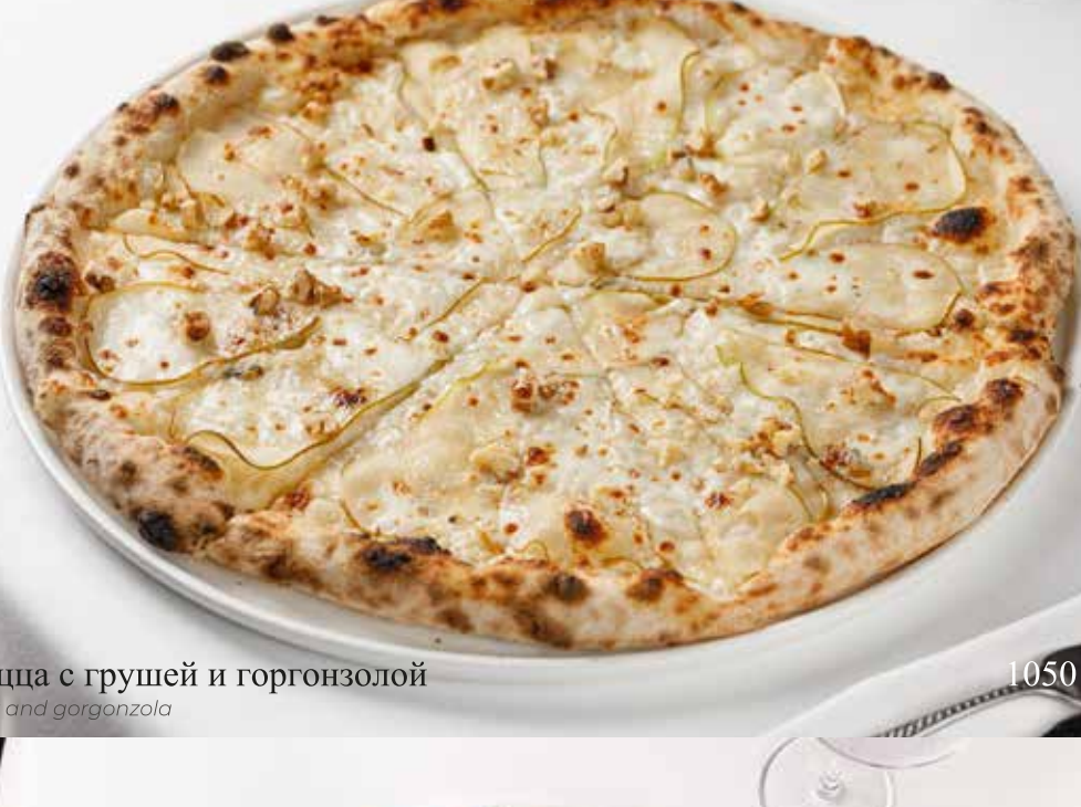
Пицца с грушей и горгонзолой