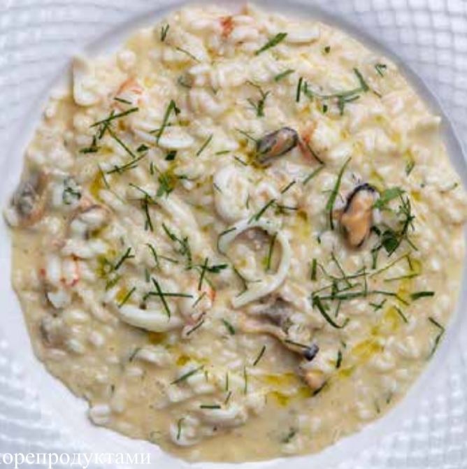
Ризотто с морепродуктами Seafood risotto