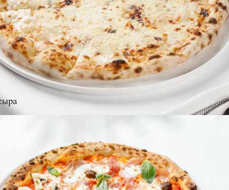
Пицца 4 сезона