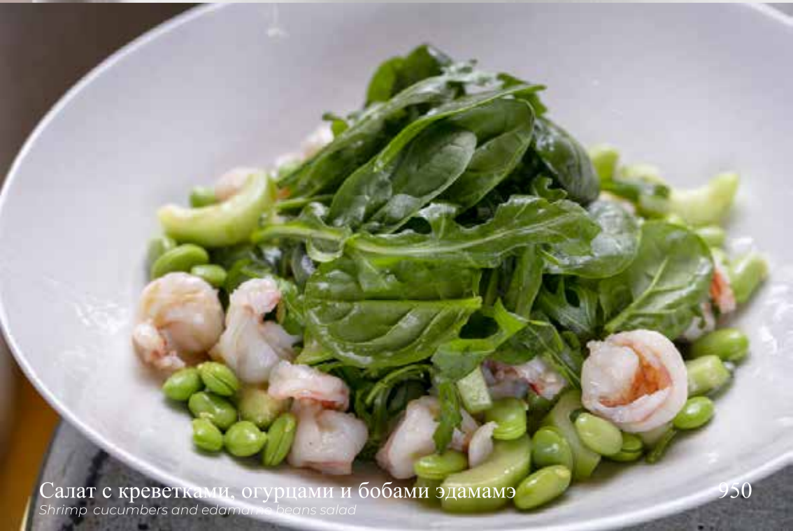
Салат с креветками, огурцами и бобами эдамаэ

Shrimp, cucumbers and edamame beans salad