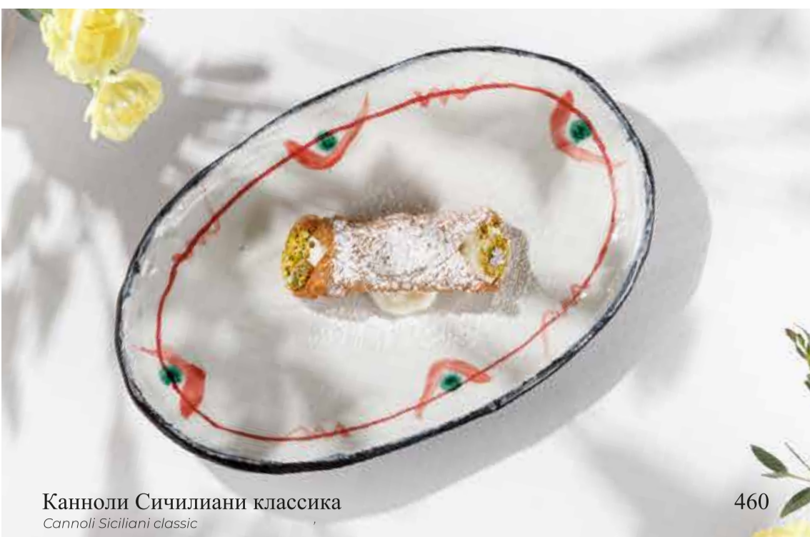
Канноли Сичилиани классика