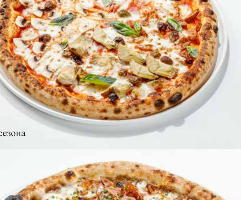
Пицца с белыми грибами и прошутто котто