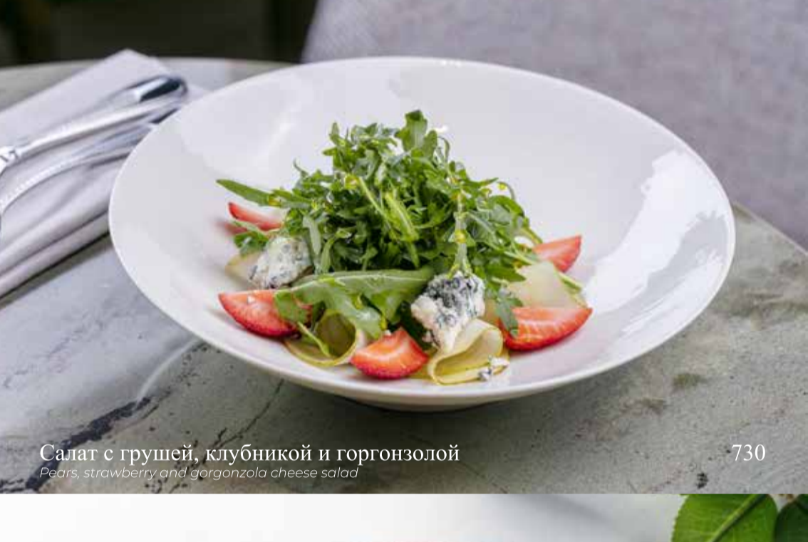
Салат с грушей, клубникой и горгонзолой

Pears, strawberry and gorgonzola cheese salad