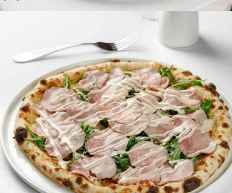
Пицца Вителло Тоннато