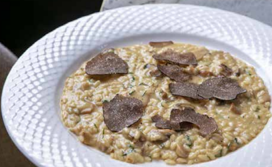
Ризотто с белыми грибами и чёрным трюфелем Porcini mushrooms and black truffle risotto