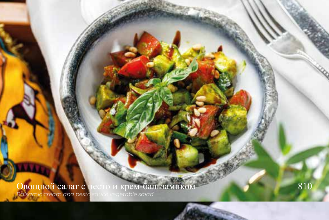
Овощной салат с песто и крем-бальзамиком

Balsamic cream and pesto sauce vegetable salad