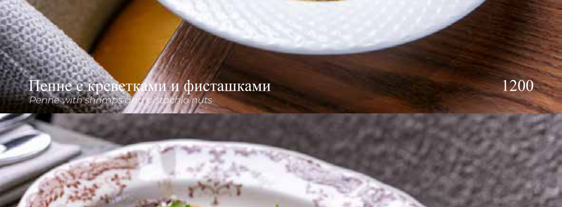
Пенне с креветками и фисташками