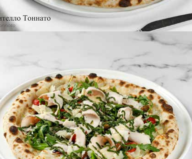
Пицца с курицей