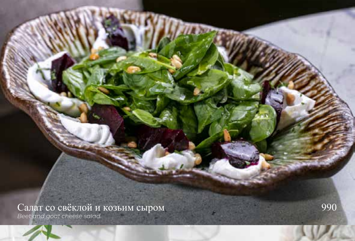
Салат со свёклой и козьим сыром