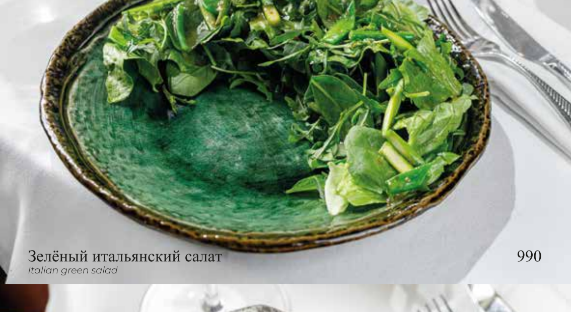
Зелёный итальянский салат