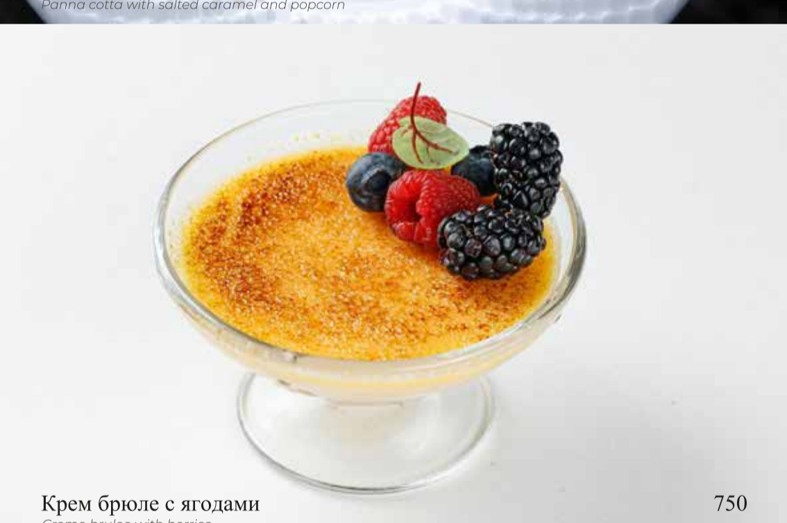
Крем брюле с ягодами