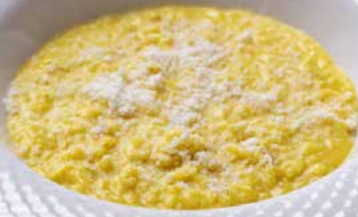
Ризотто с шафраном Saffron risotto