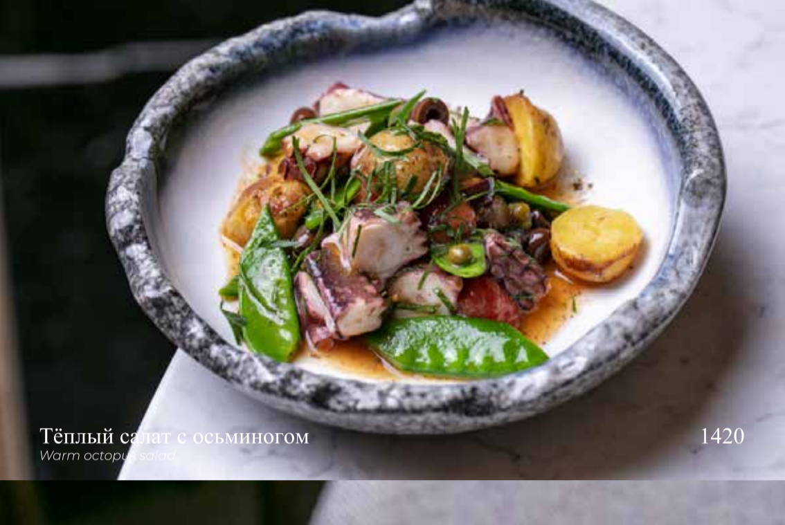
Тёплый салат с осьминогом