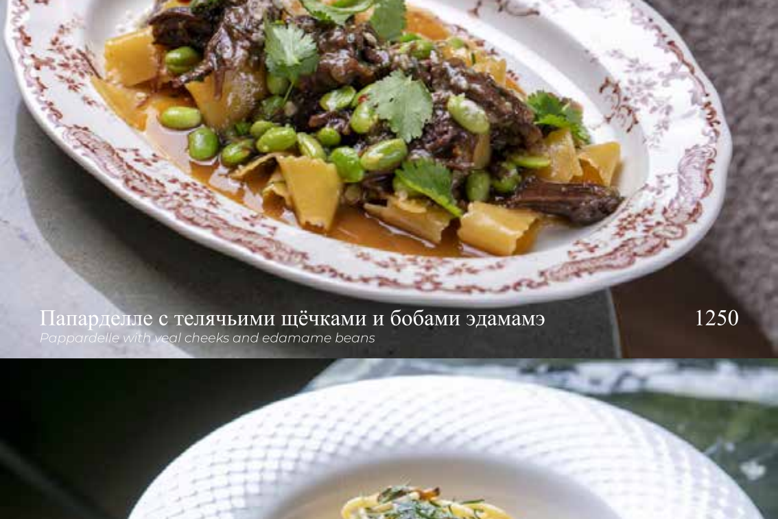
Папарделле с телячьими щёчками и бобами эдамамэ

Pappardelle with veal cheeks and edamame beans