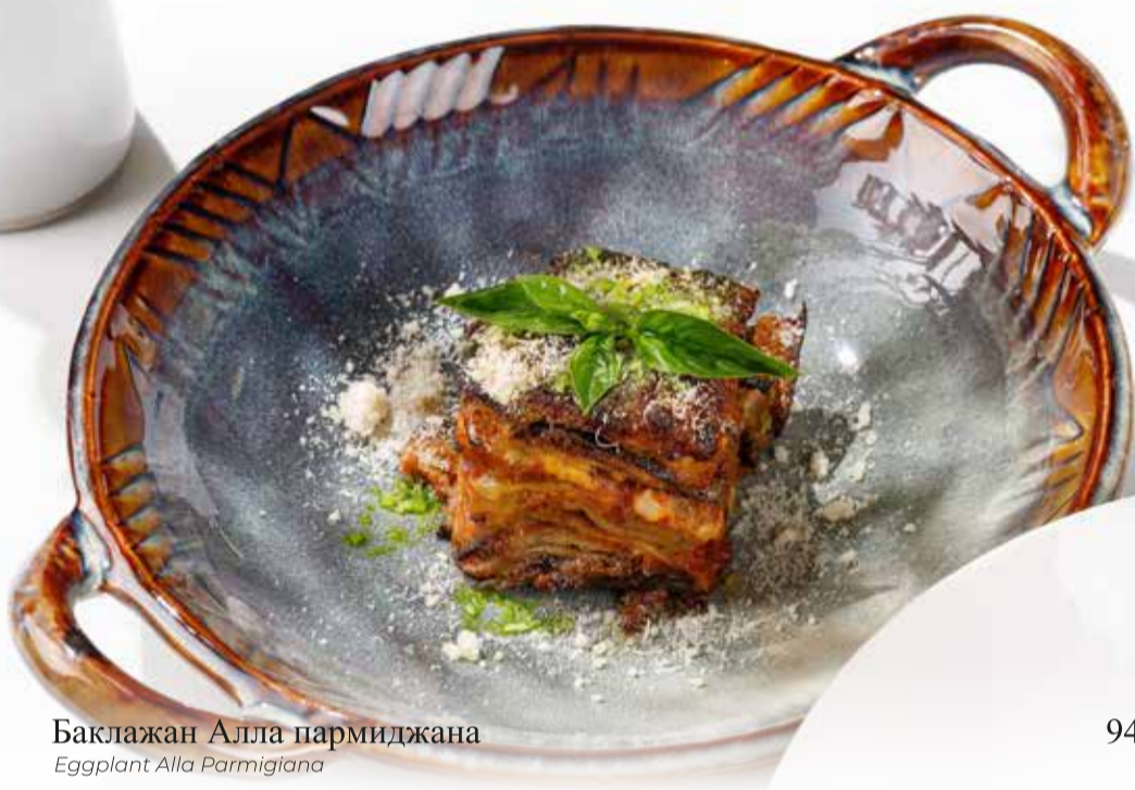
Баклажан Алла пармиджана Eggplant Alla Parmigiana