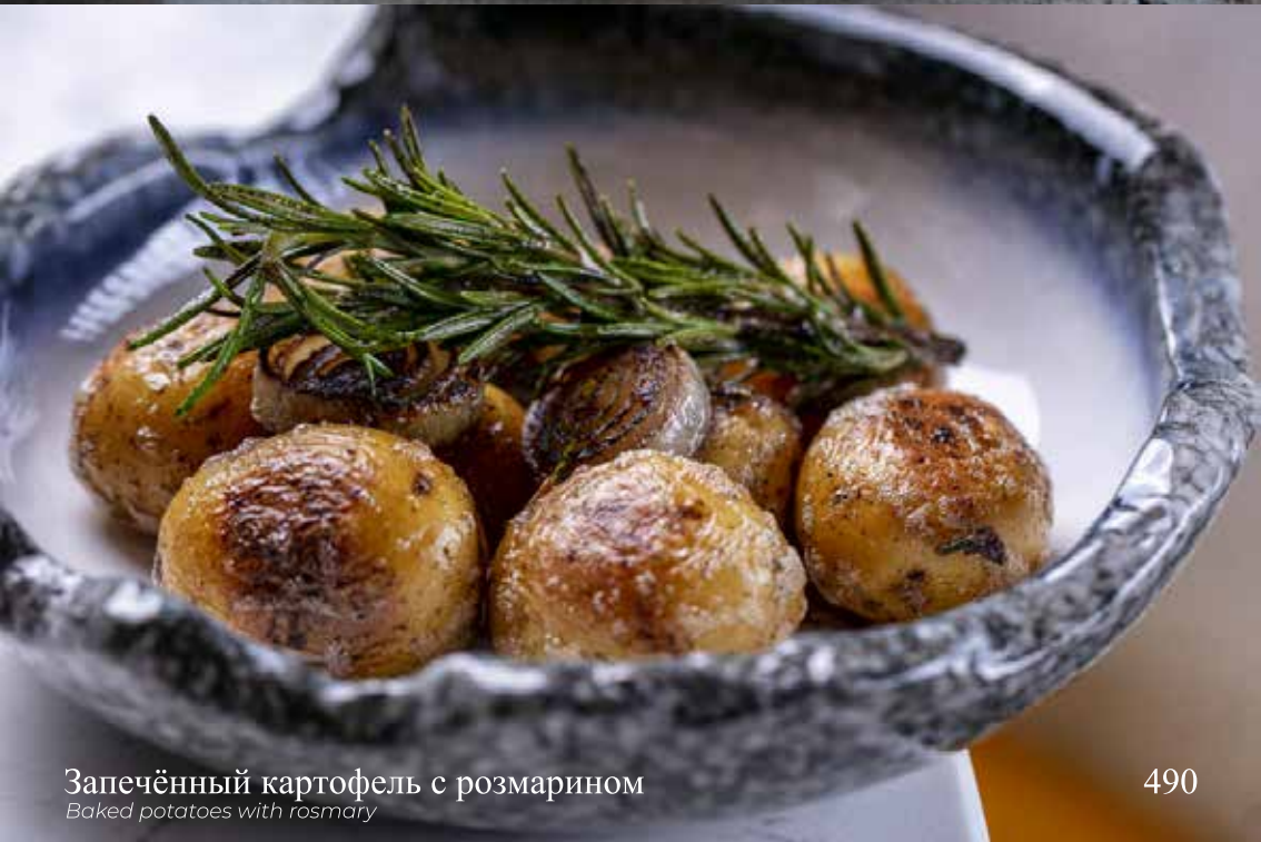
Запечённый картофель с розмарином