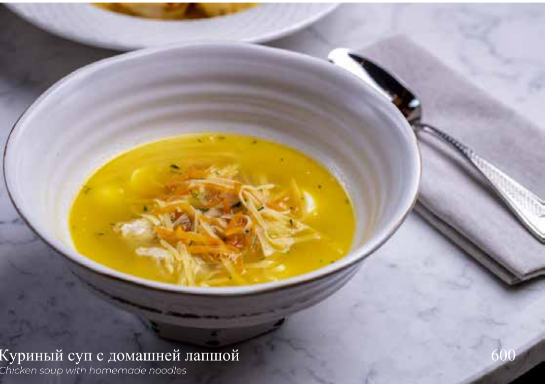
Куриный суп с домашней лапшой