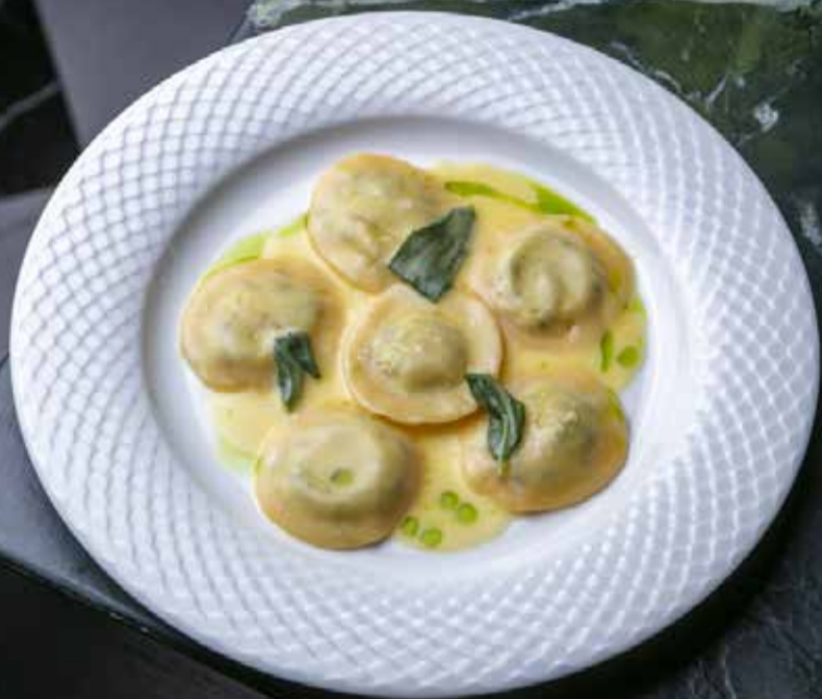
Равиоли с рикоттой и шпинатом Ricotta and spinach ravioli