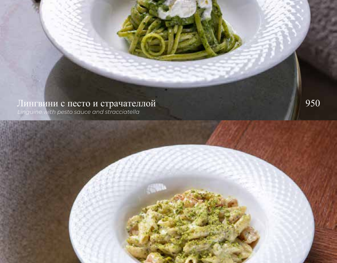
Лингвини с песто и страчattelлой

Linguine with pesto sauce and stracciatella