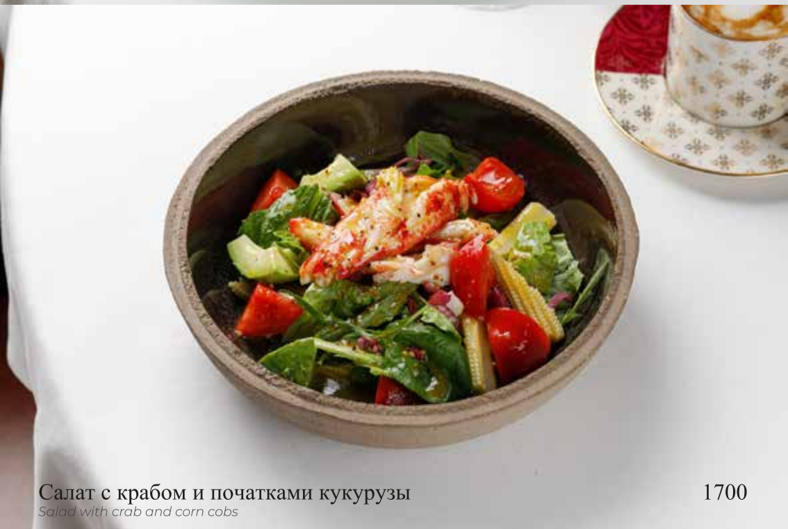
Салат с крабом и початками кукурузы