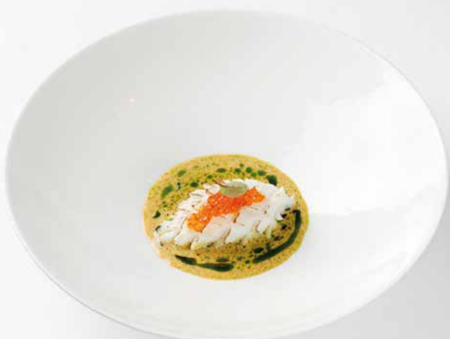
Фаршированный кальмар с лангустинами Stuffed calamar with langoustines