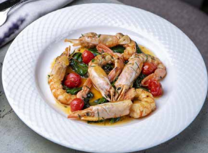
Лангустины рипассати со шпинатом и чесноком Ripassati langoustines with spinach and garlic