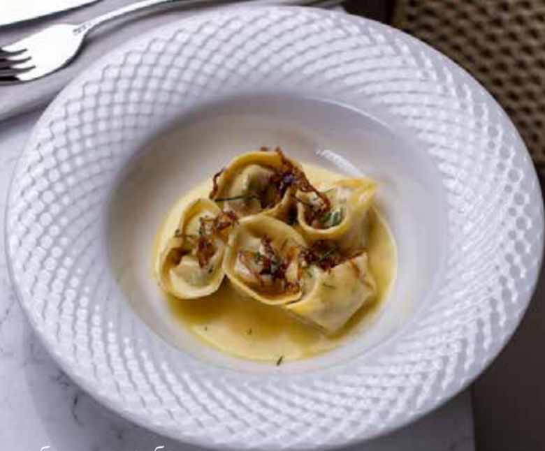
Равиоли с белыми грибами Porcini mushroom ravioli