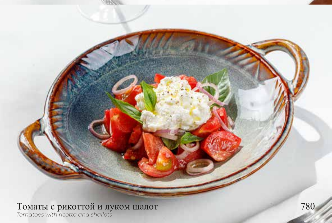
Томаты с рикоттой и луком шалот