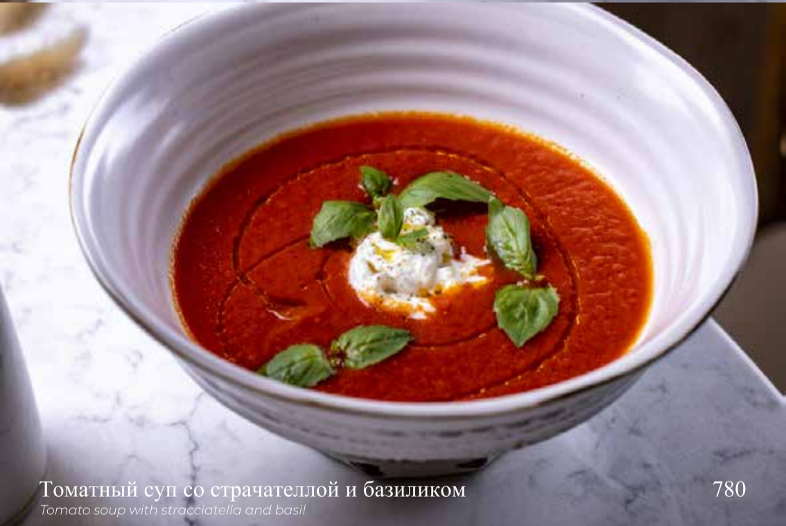
Томатный суп со страчателлой и базиликом

Tomato soup with stracciatella and basil