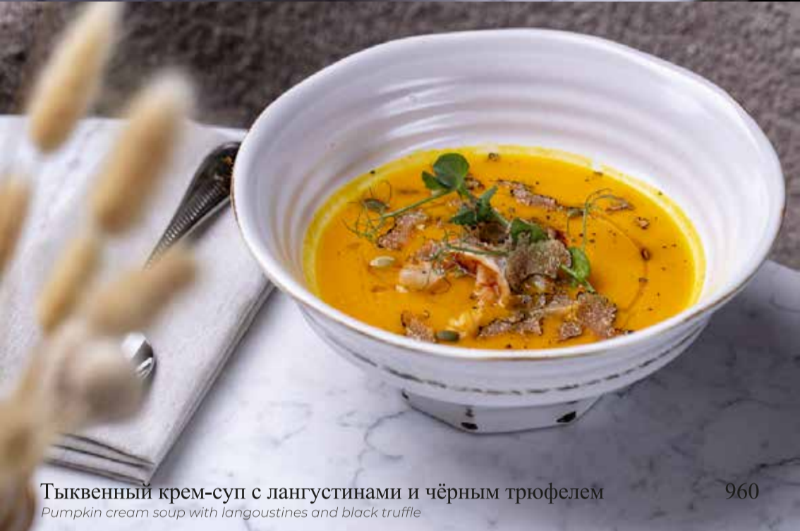
Тыквенный крем-суп с langoustинами и чёрным трюфелем

Pumpkin cream soup with langoustines and black truffle