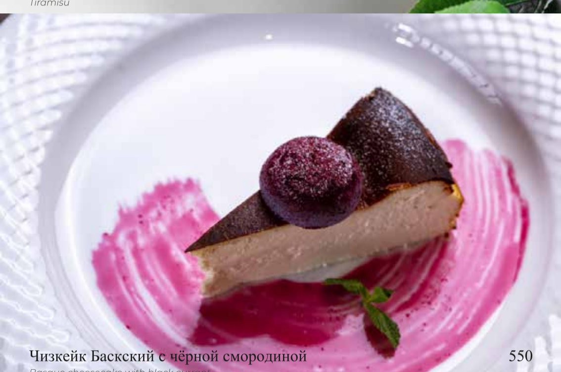
Чизкейк Баскский с чёрной смородиной