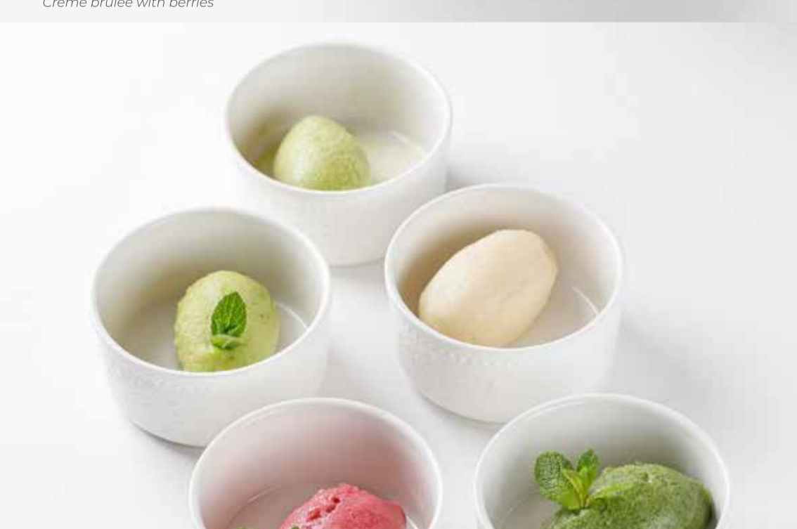
Сорбет собственного приготовления 50гр