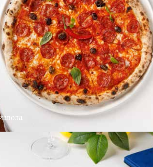
Пицца Алла диавола