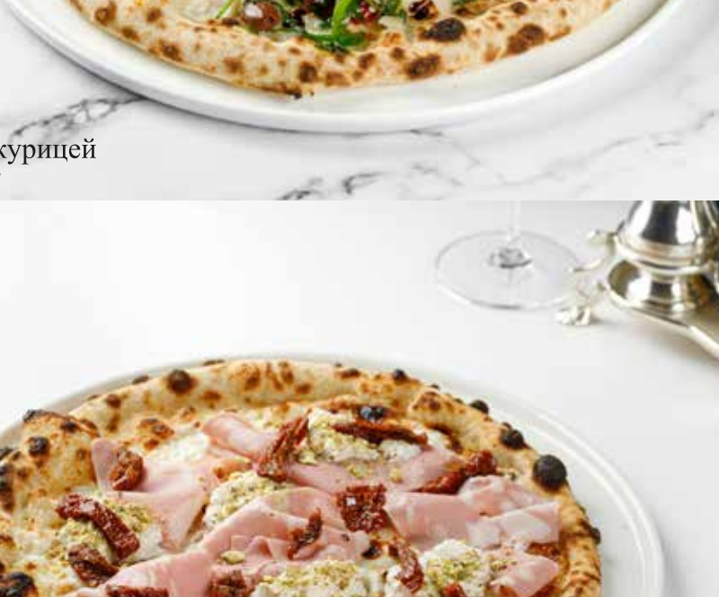
Пицца с мортаделлой, страчателлой и фисташками

Pizza with mortadella stracciatella and pistachios