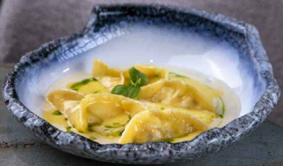
Равиоли с крабом Crab ravioli