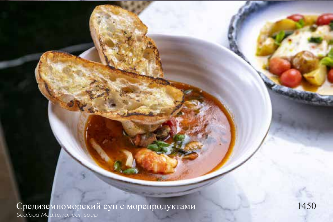
Средиземноморский суп с морепродуктами