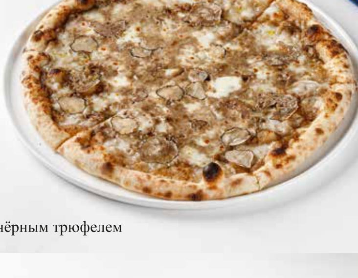
Пицца с чёрным трюфелем