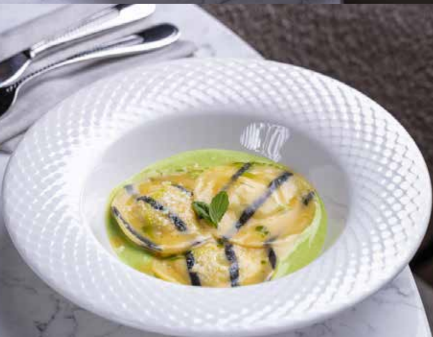
Равиоли с креветками Shrimp ravioli