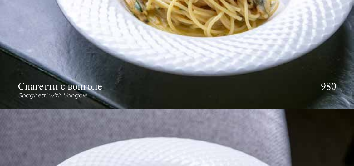
Спагетти с вонголе