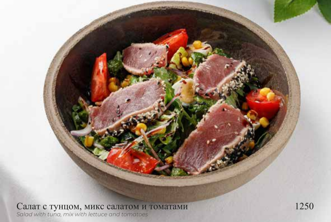
Салат с тунцом, микс салатом и томатами

Salad with tuna, mix with lettuce and tomatoes