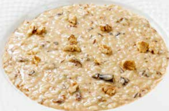
Ризотто с горгонзоллой и черносливом Risotto with gorgonzola and prunes