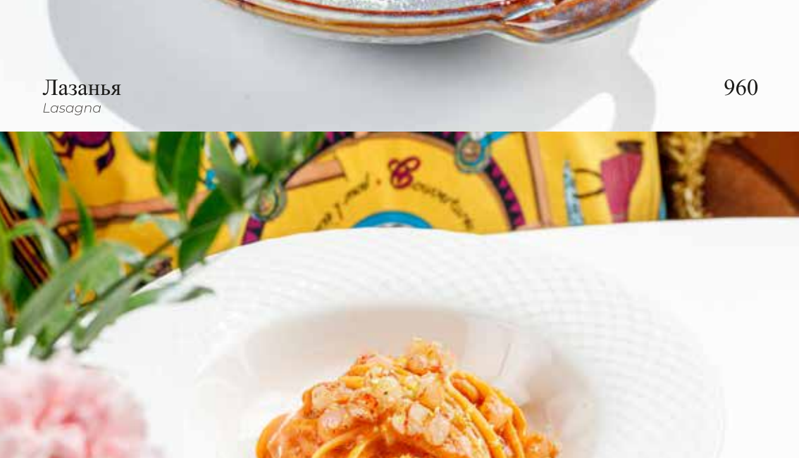
Лингвини с морским ежом