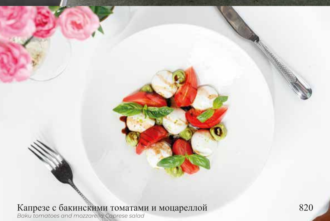
Капрезе с бакинскими томатами и моцареллой

Baku tomatoes and mozzarella, Caprese salad