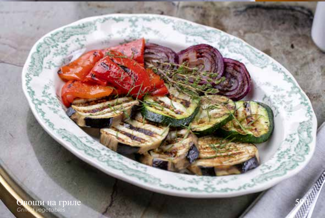
Овощи на гриле