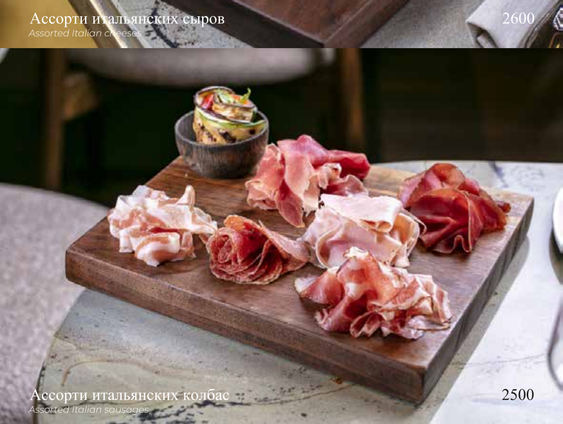
Ассорти закусок Италия Assorted appetizers Italy