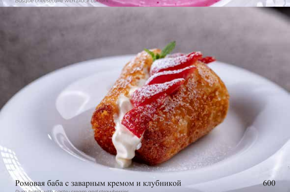
Ромовая баба с заварным кремом и клубникой

Rum baba with pastry cream and strawberries