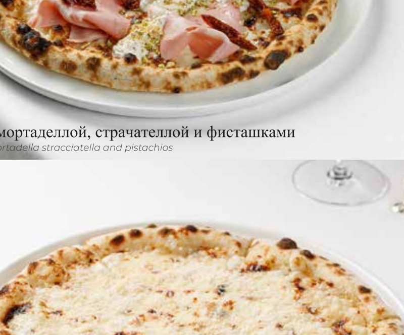
Пицца 4 сыра