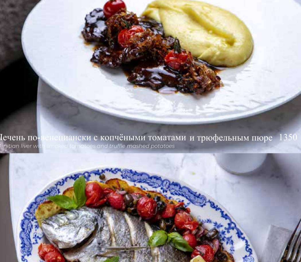
Лопатка ягнёнка с картофельно-трюфельным пюре

Lamb shoulder with potato truffle mashed potatoes