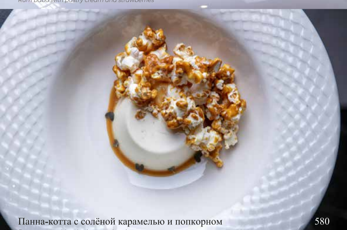
Панна-котта с солёной карамелью и попкорном

Panna cotta with salted caramel and popcorn