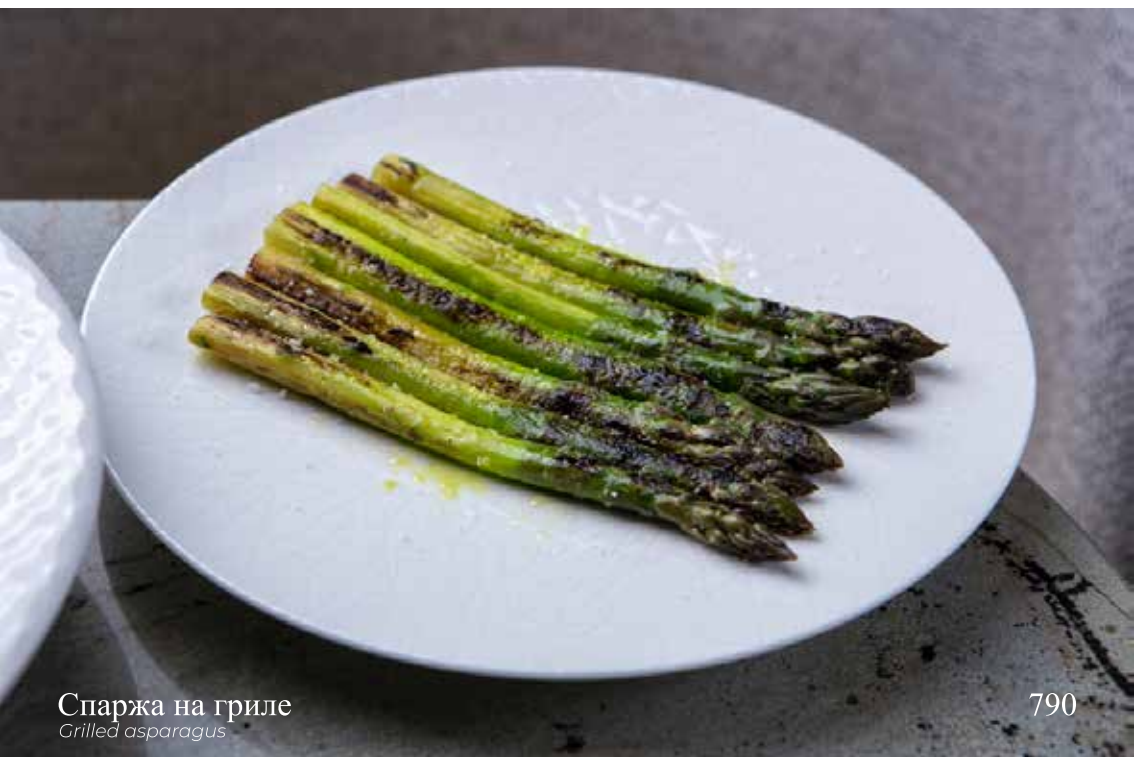
Спаржа на гриле