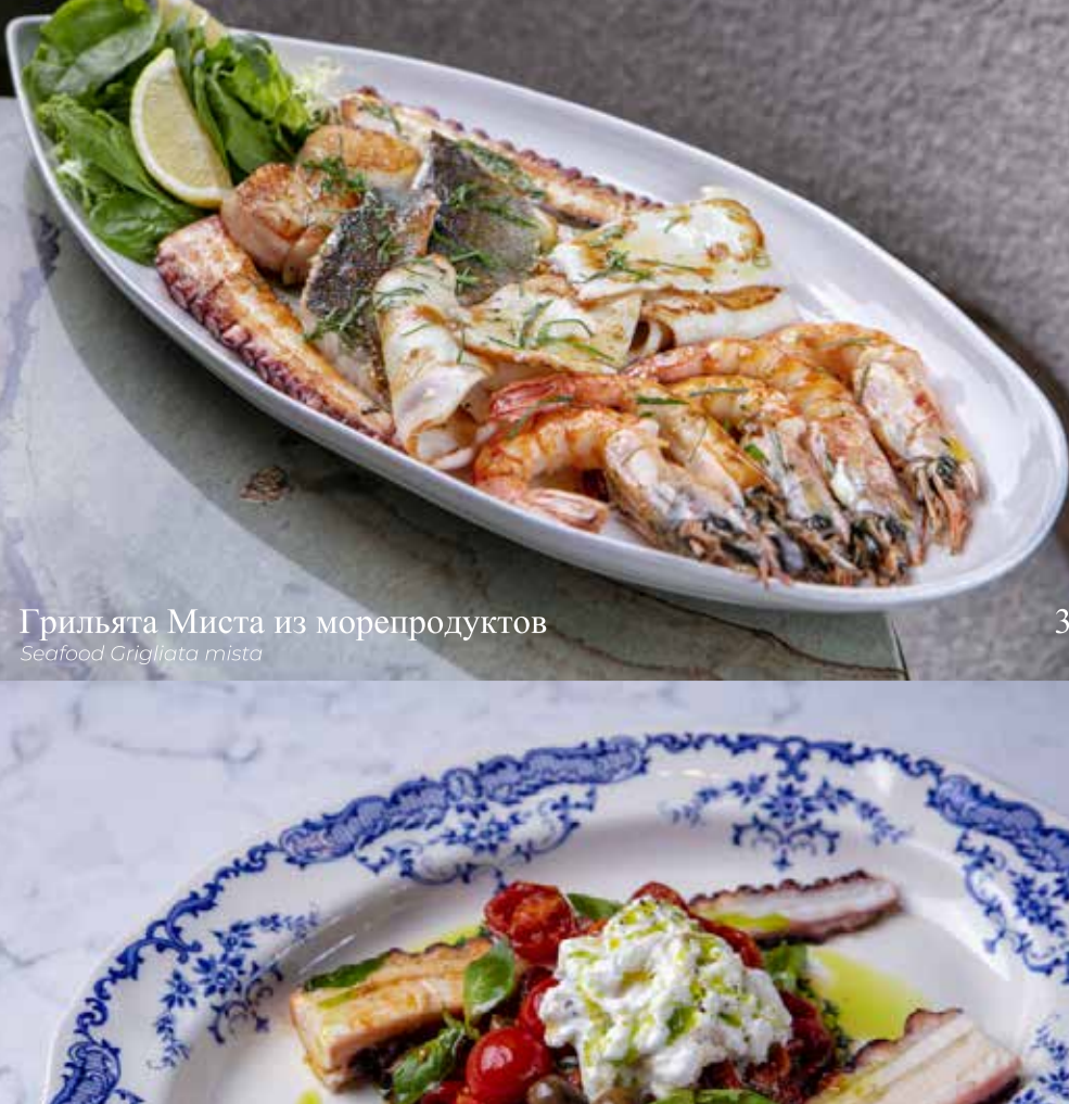
Грильята Миста из морепродуктов