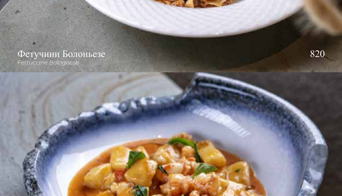
Ньокки с креветками