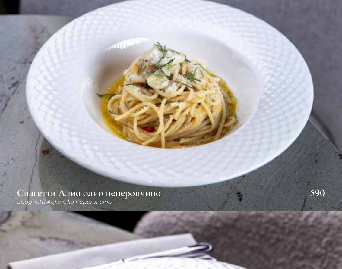
Спагетти Алио олио пеперончино