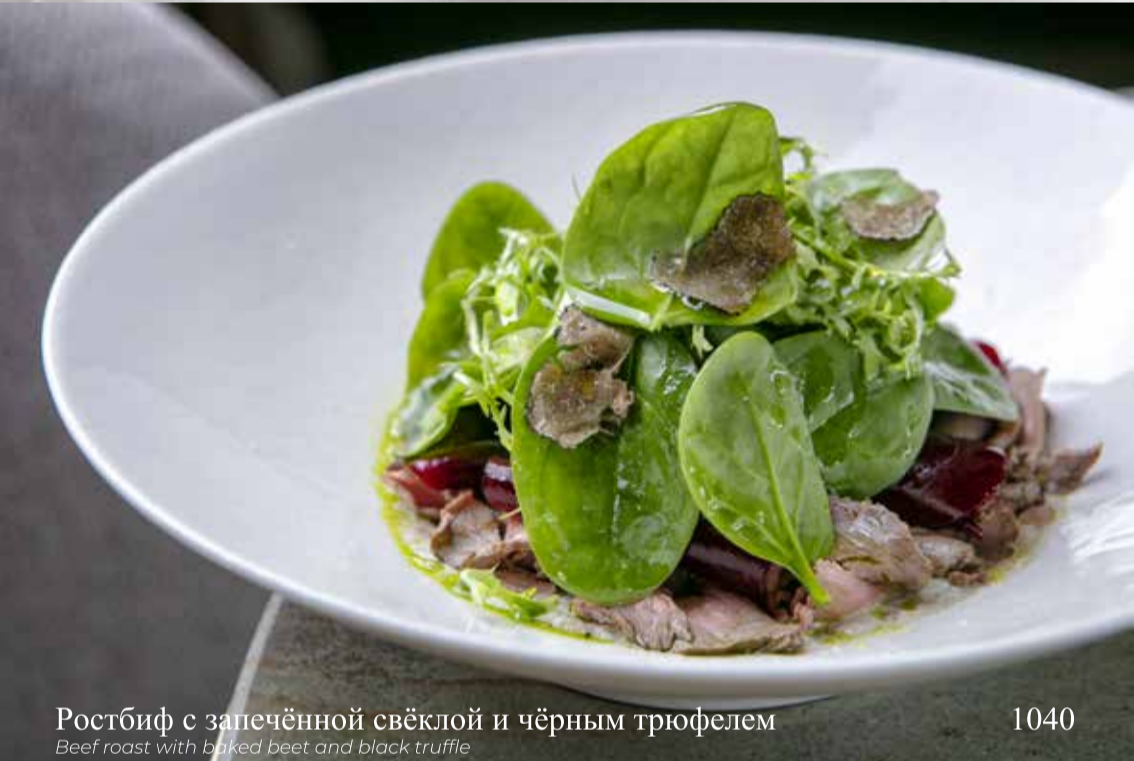
Ростбиф с запечённой свёклой и чёрным трюфелем

Beef roast with baked beet and black truffle