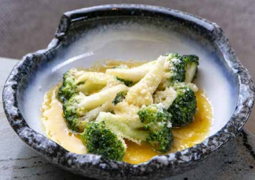
Брокколи с чесноком и пармезаном Garlic and parmesan broccoli