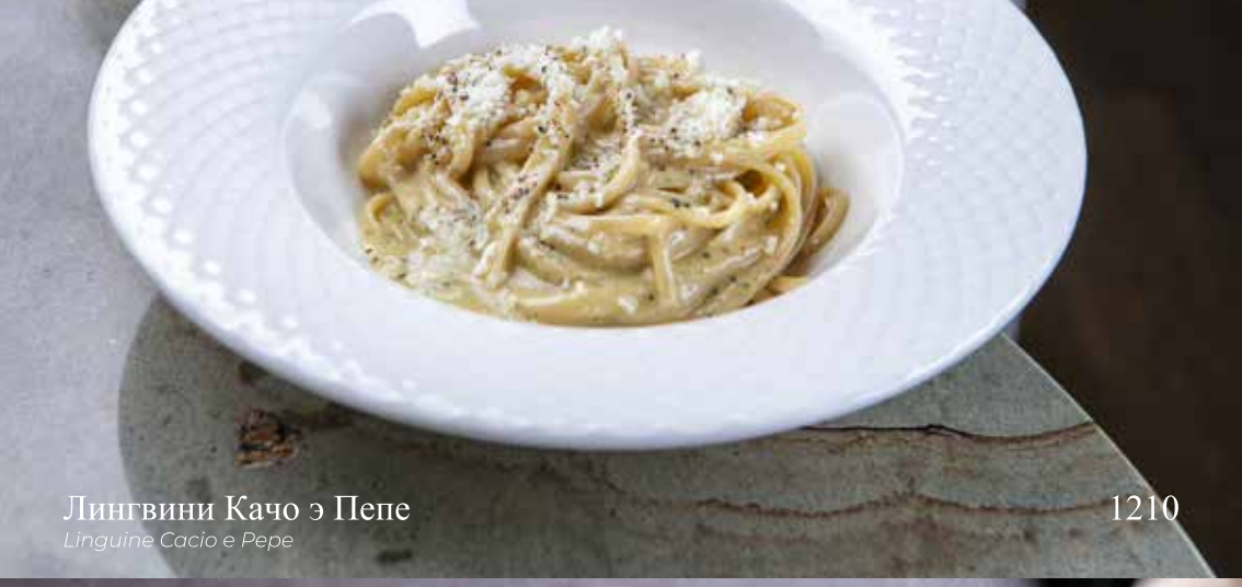
Лингвини Качо э Пепе