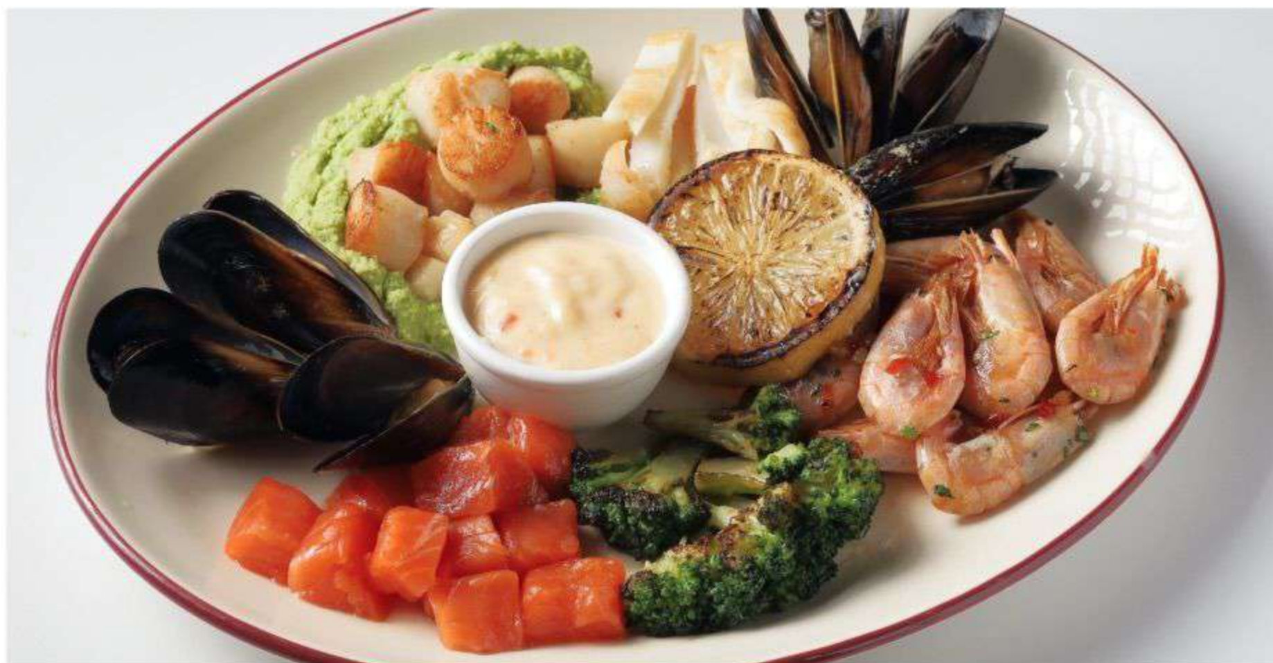
БАРЕНЦЕВО МОРЕ – ГРЕБЕШКИ, РОЗОВЫЕ КРЕВЕТКИ, МОРСКАЯ ФОРЕЛЬ, КАЛЬМАРЫ, МИДИИ, БРОККОЛИ