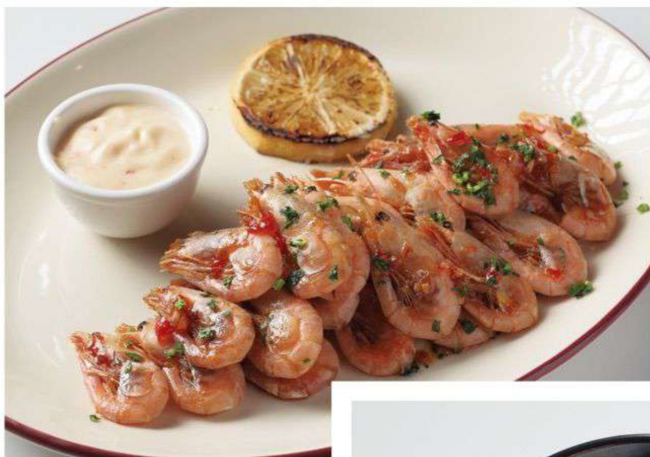
МУРМАНСКИЕ РОЗОВЫЕ КРЕВЕТКИ В ПРЯНОМ МАРИНАДЕ