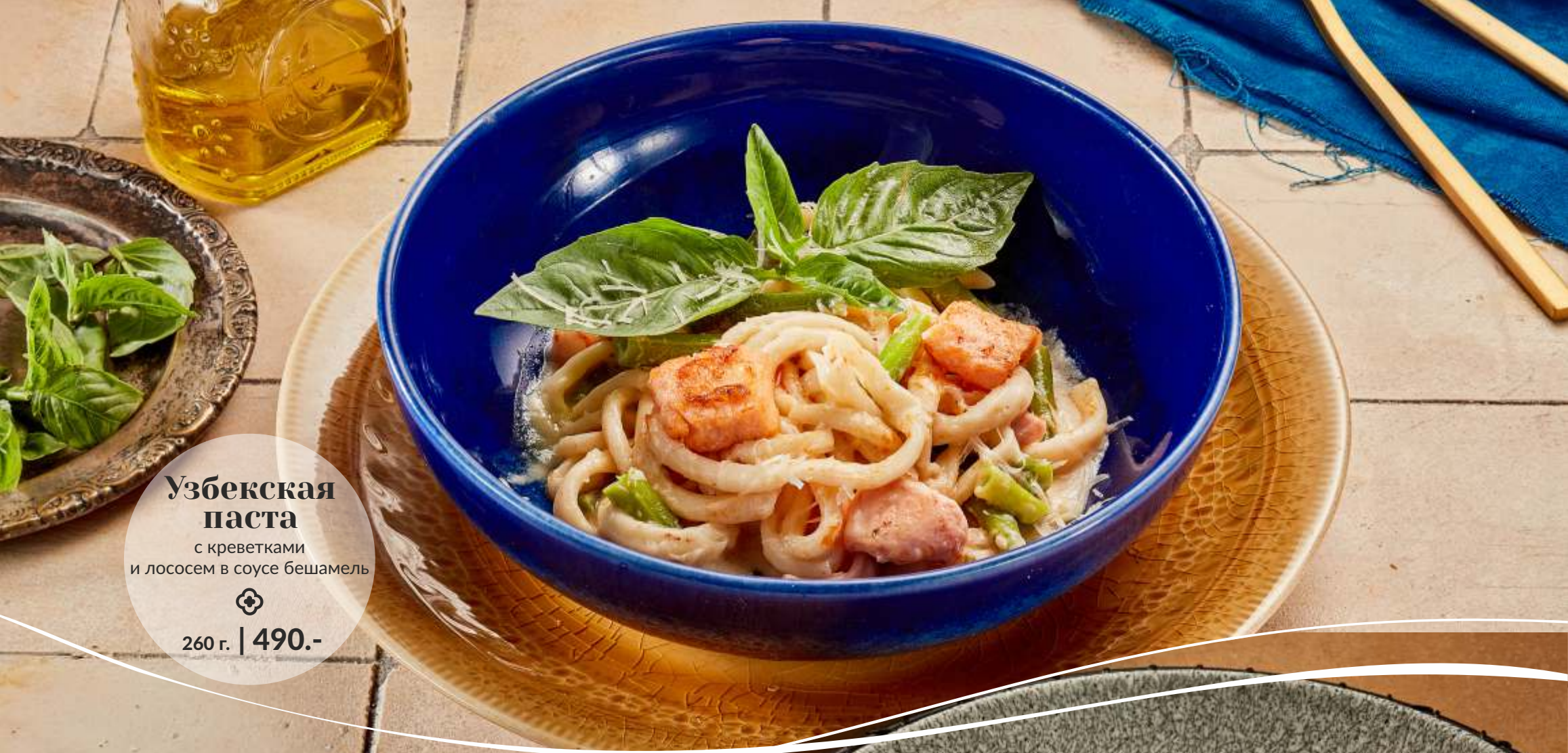
Узбекская паста с креветками и лососем в соусе бешамель ⊕ 260 г. | 490.-