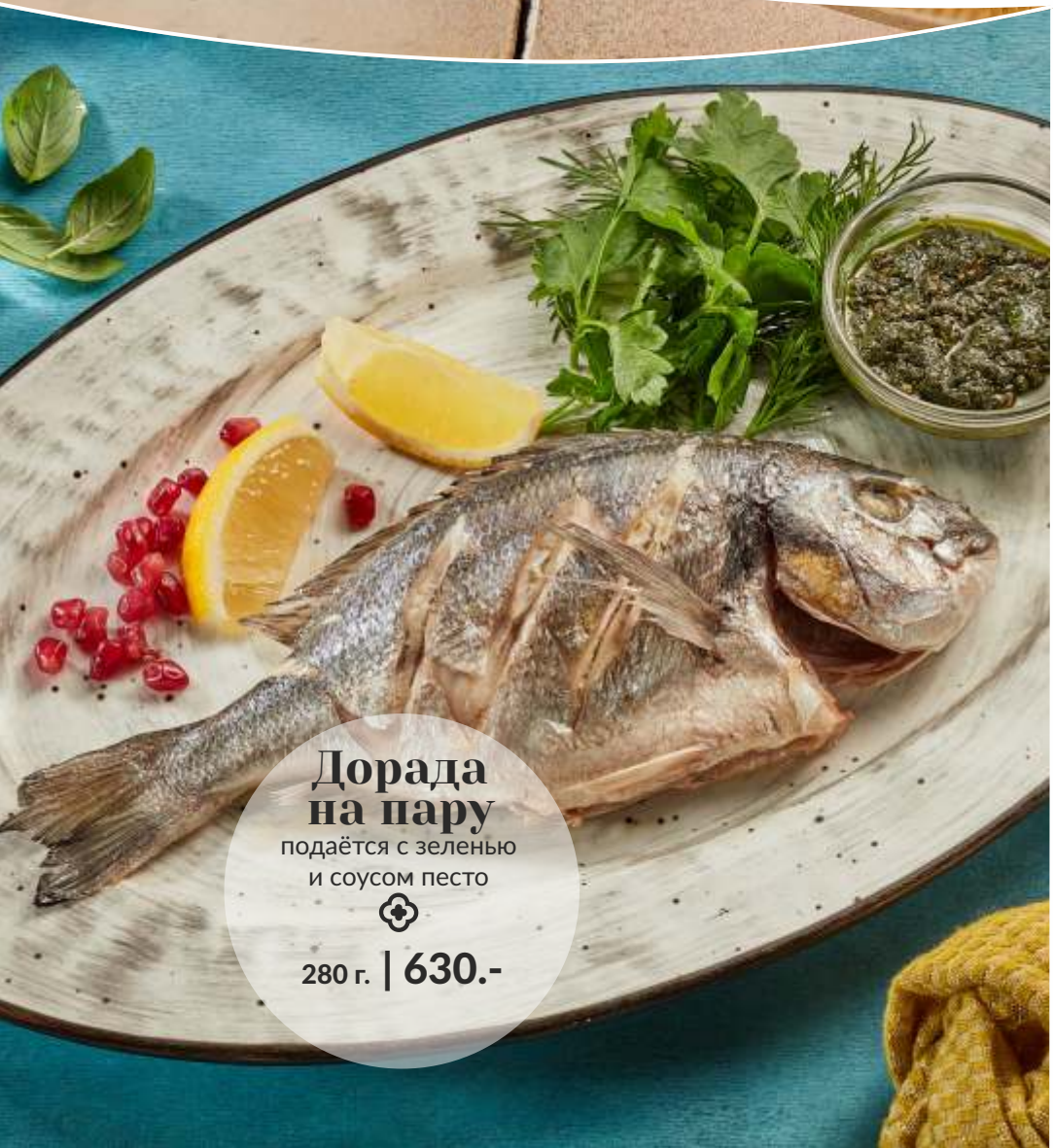
Дорада на пару подаётся с зеленью и соусом песто ⊕ 280 г. | 630.-