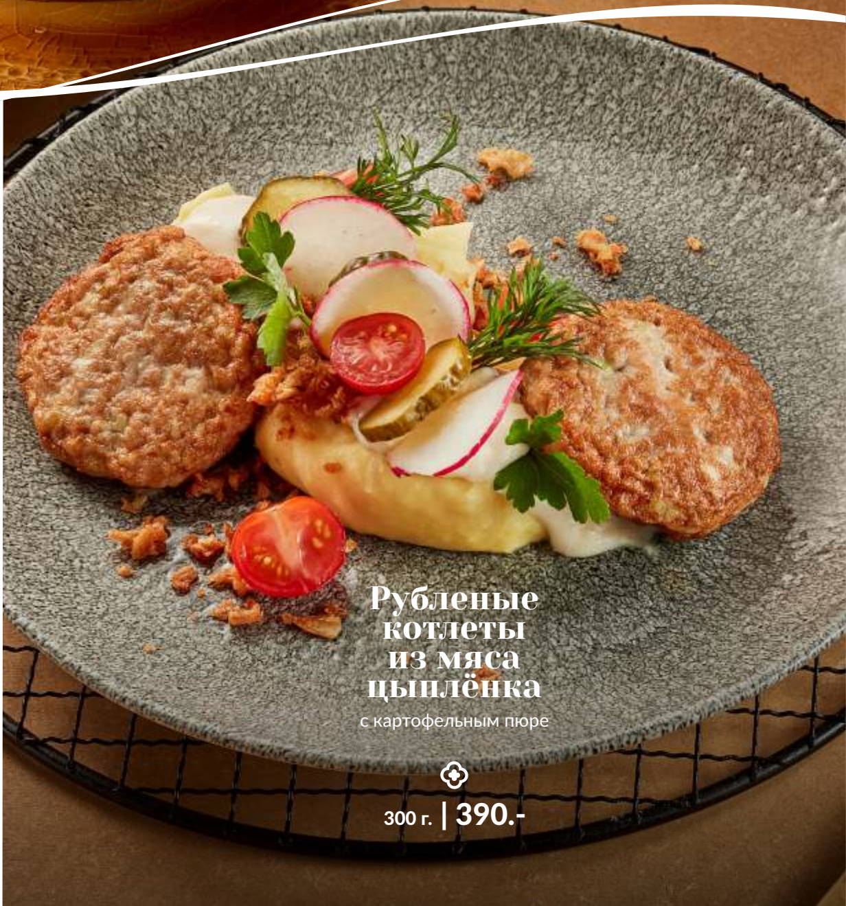
Рубленые котлеты из мяса цыпленка с картофельным пюре ⊕ 300 г. | 390.-