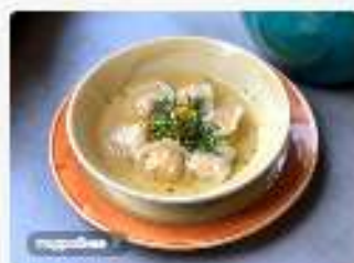
Пельмени из семги