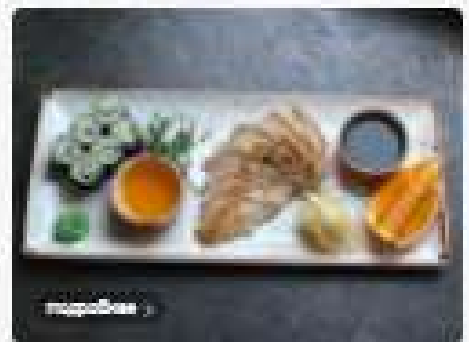
Куриная грудка с апельсиновым соусом