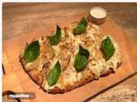
С грушей и сыром Горгонзола 3800 руб.