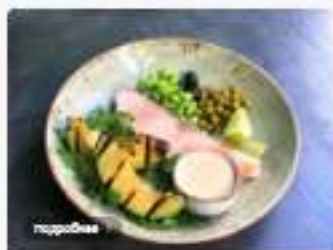
Лосось на пару с авокадо