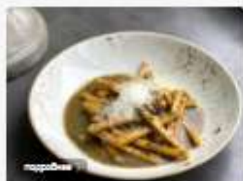
Паста домашняя с стрюфелем