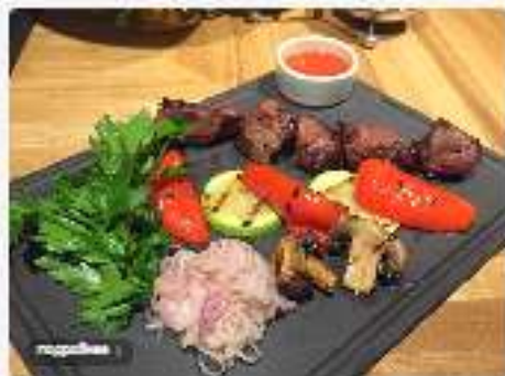
Шашлык из мраморной говядины