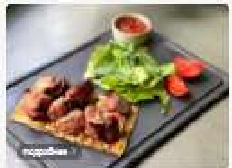
Шашлык из индейки