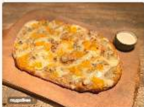
4 сыра 3800 руб.