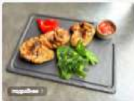
Цыпленок на косточках