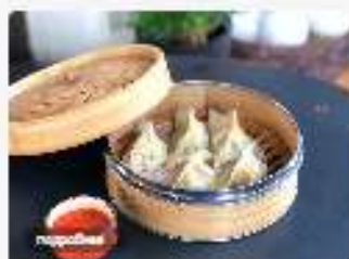
Гёдза с креветками