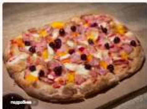
Вишневый конфи 3800 руб.