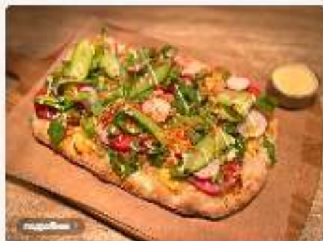
С цурицей и овощами 3800 руб.