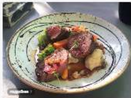
Филе-миньон с овощами на пару