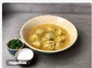
Пельмени из телятины