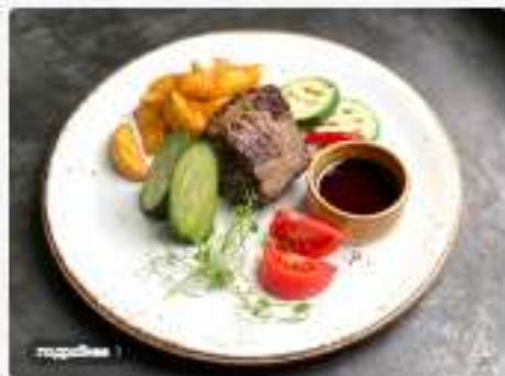
Филе — миньон