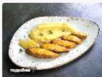
Палтус копченый с картофельным пюре