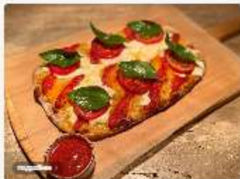
С томатами и сыром Страчателла 3800 руб.