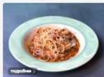
Спагетти с соусом Песто и томатами