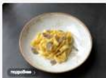
Паста сливочная с стрюфелем