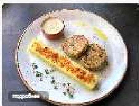
Куриные котлеты с картофельным пюре