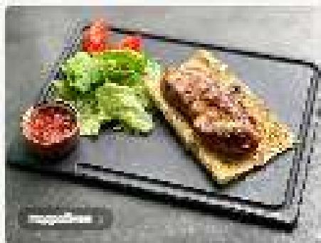
Стейк из индейки