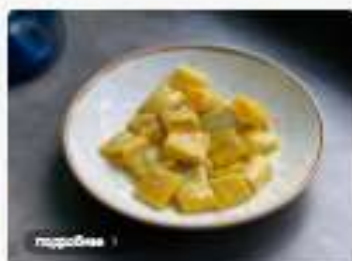
Паста Римская с сыром Горгонзола