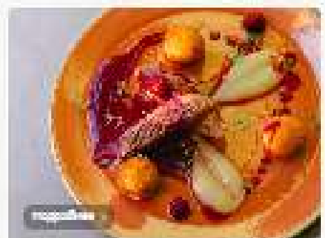
Утиная грудка в вишневом соусе