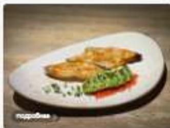
Стейк палтуса в Мисо-Чили пасте