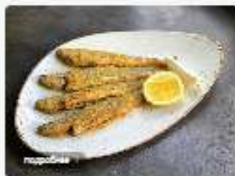
Корюшка в хрустящей панировке