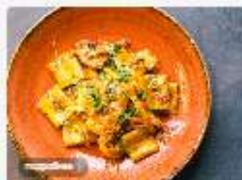
Паккери с морепродуктами