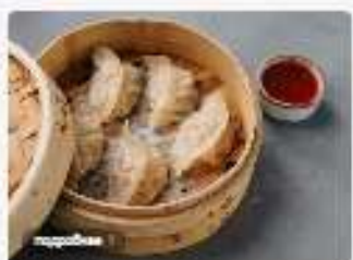
Гёдза с семгой