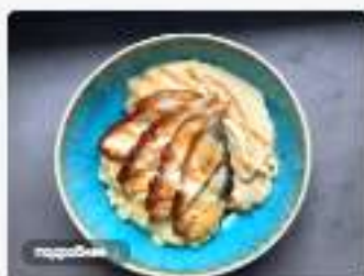
Маринованный угорь с булгуром