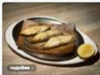
Шашлык из палтуса