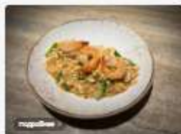
Паста Падуй с креветками