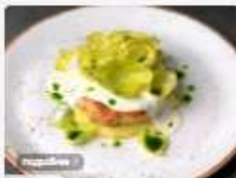
Котлета из щуки