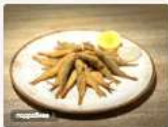
Барбулька черноморская в хрустящей панировке