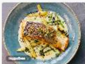
Лосось с кукурузным кремом