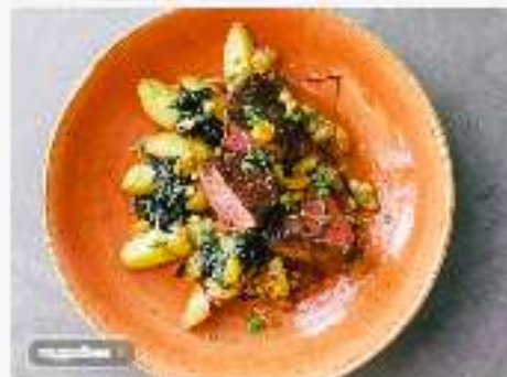
Филе-миньон с картофелем и шпинатом