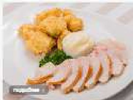
Грудка индейки с голландским соусом