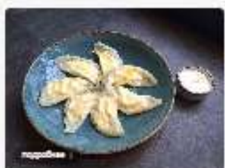
Вареники с телятиной