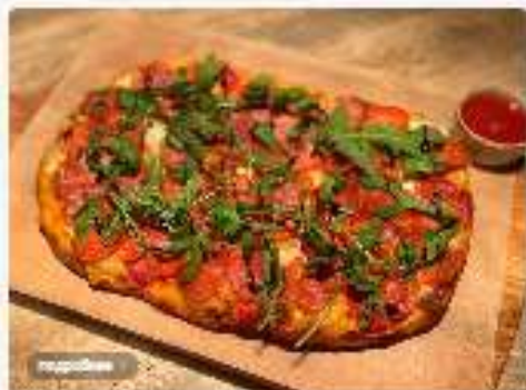
Пепперони 3800 руб.