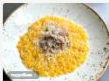
Паста Орзо с уткой конфи