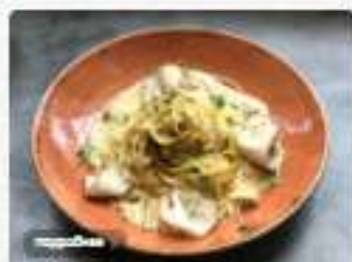
Тальятелле с карбонадом и белыми грибами