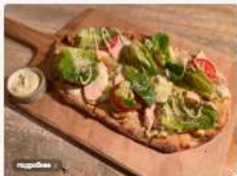
С цурицей и соусом Цезарь 3800 руб.