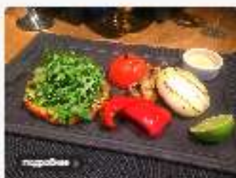
Котлета из семги с перечным соусом