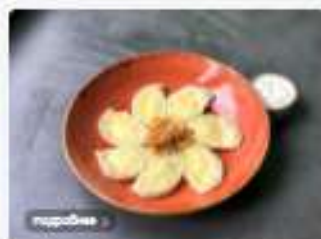
Вареники с картофелем