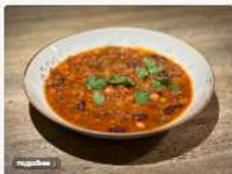
Чили кон карне