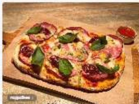
С харпаччо на говядине и сливой 3800 руб.