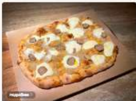
Стрюфелем и сыром Страчателла 3800 руб.