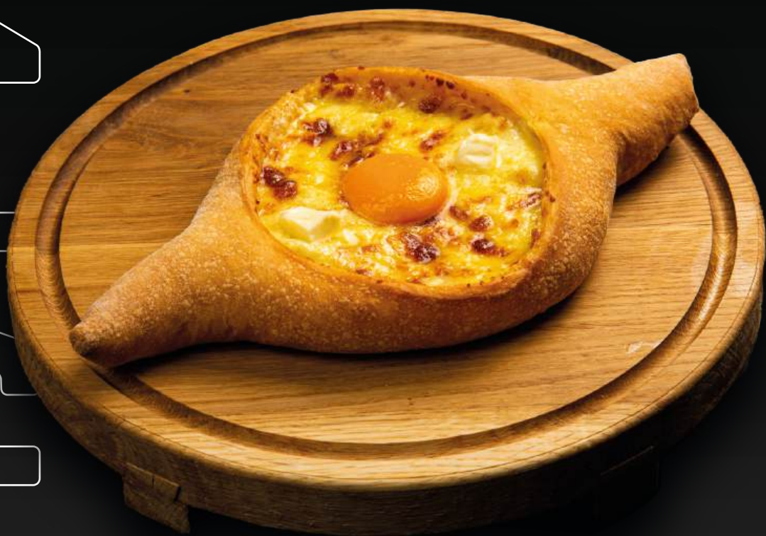
ХАЧАПУРИ 630 по-аджарски