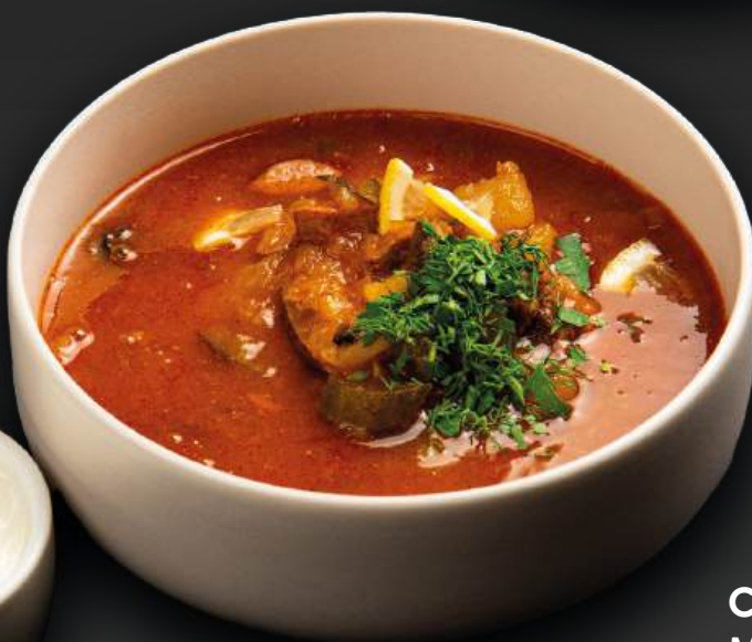
СОЛЯНКА 570 МЯСНАЯ