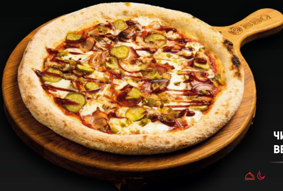
ЧИКЕН 850 BBQ