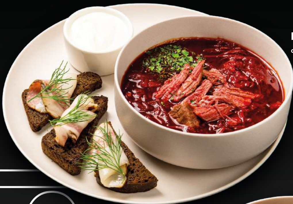
БОРЩ 590 с копченой говядиной