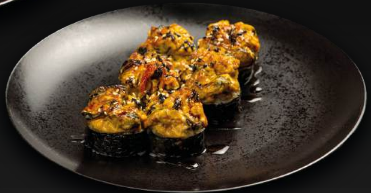
ЗАПЕЧЕННЫЙ РОЛЛ СО СНЕЖНЫМ КРАБОМ 590 под сырной шапкой