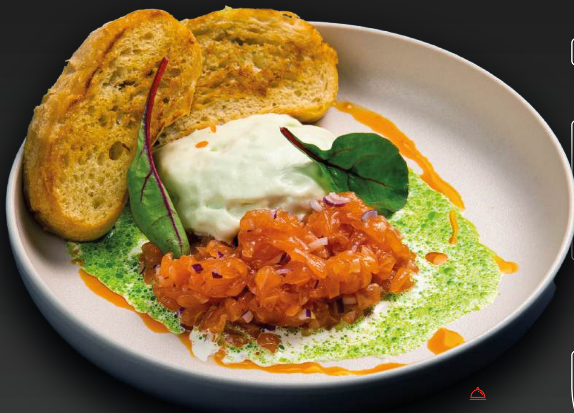
ТАРТАР ИЗ МОРСКОЙ ФОРЕЛИ с соусом сливочный васаби