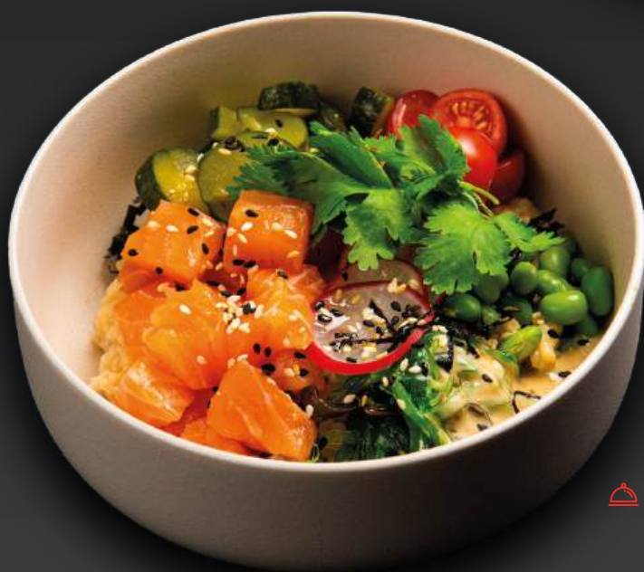
ПОКЕ С ЛОСОСЕМ 890