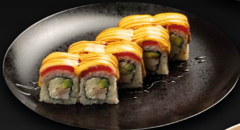
СЛИВОЧНЫЙ ТУНЕЦ 890