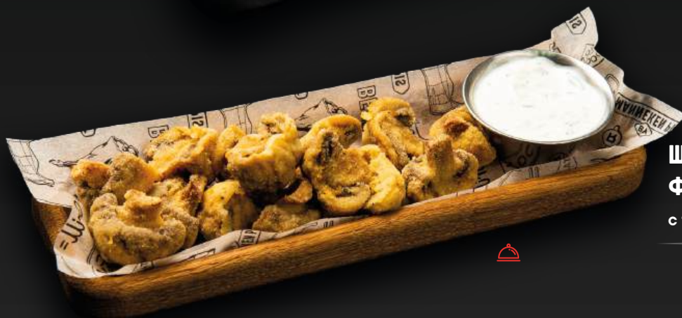
ШАМПИньОНЫ ФРИ 550 с трюфельной сметаной