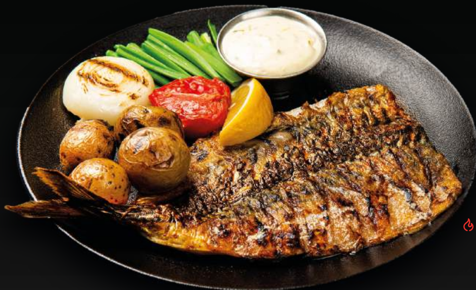
СКУМБРИЯ НА ГРИЛЕ 850 с печеными овощами