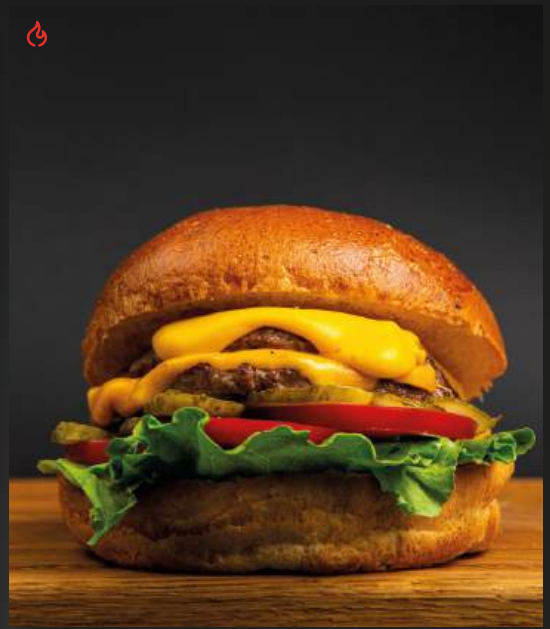
БОЛЬШОЙ КЛАССИЧЕСКИЙ БУРГЕР BBQ 850

свиной рульки, маринованными огурцами и халапеньо