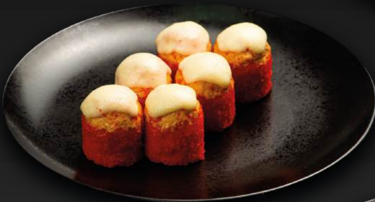
ЗАПЕЧЕННЫЙ РОЛЛ 650 С КРЕВЕТКАМИ И АВОКАДО