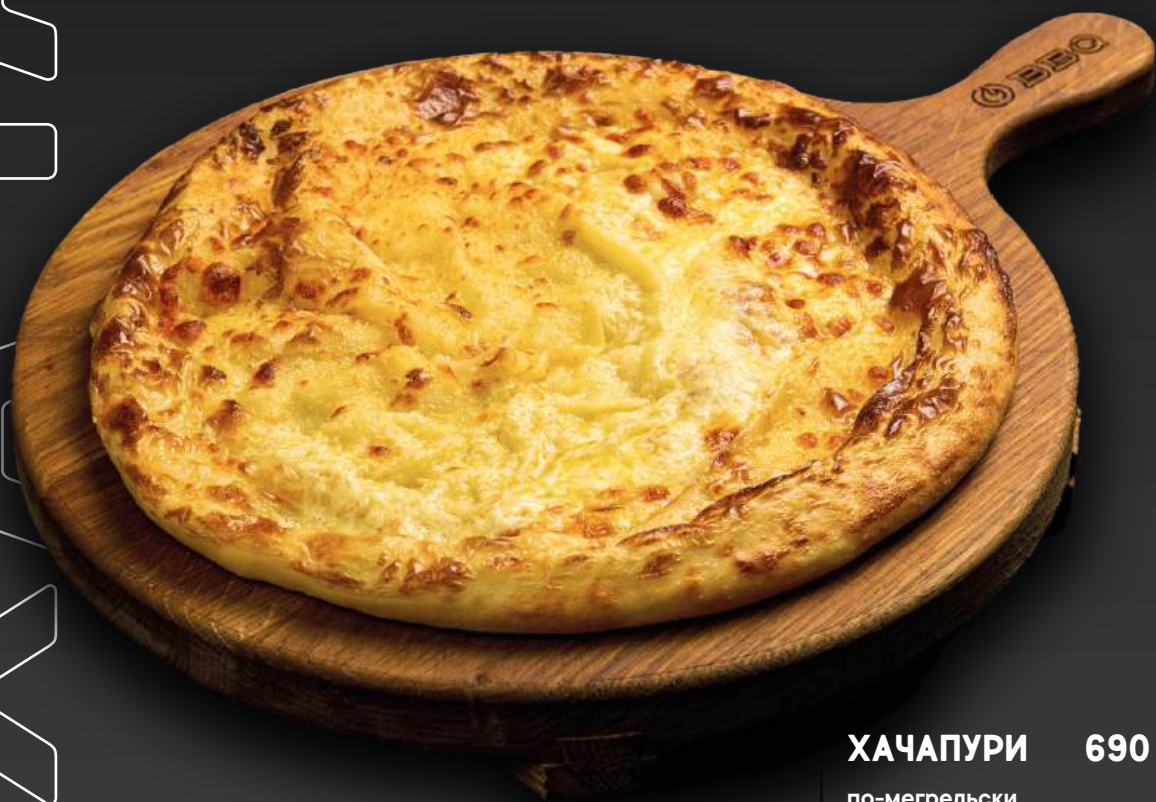
ХАЧАПУРИ 690 по-мегрельски