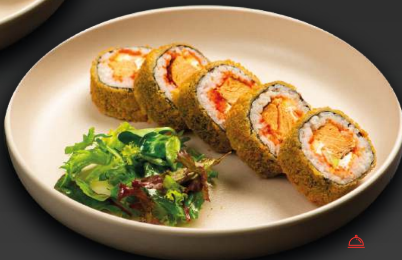
РОЛЛ ТЕМПУРА С ЛОСОСЕМ 750