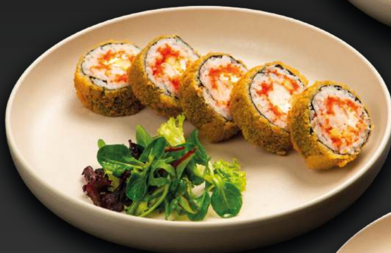
РОЛЛ ТЕМПУРА С КРЕВЕТКОЙ 690