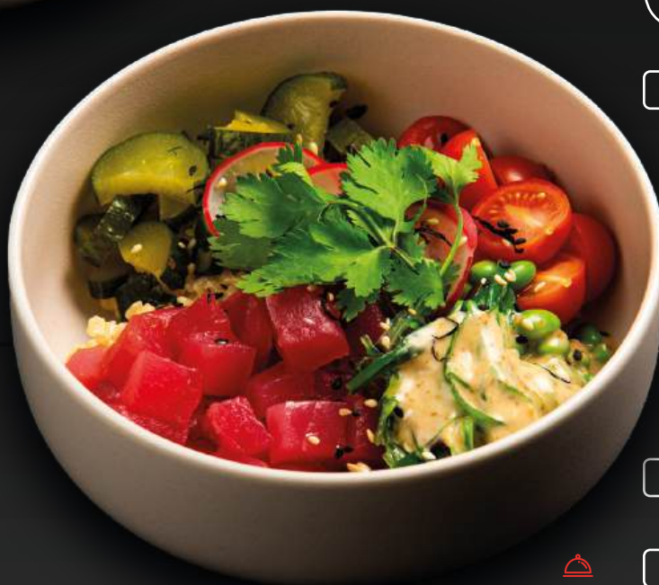
ПОКЕ С ТУНЦОМ 790