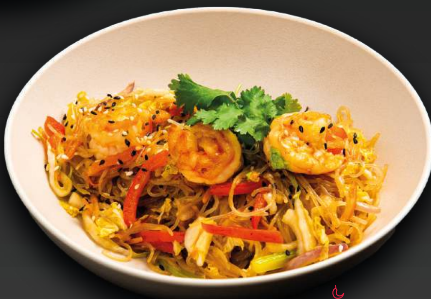
ВОК С ТИГРОВЫМИ КРЕВЕТКАМИ 890 лапша на выбор/рис