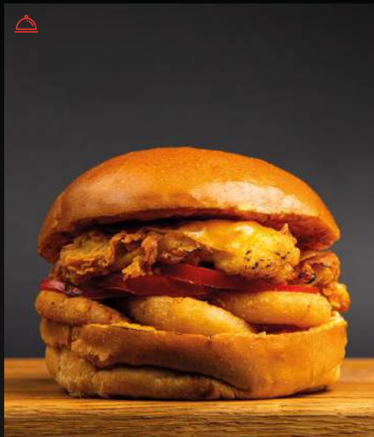
БУРГЕР С КУРИНЫМИ СТРИПСАМИ 690