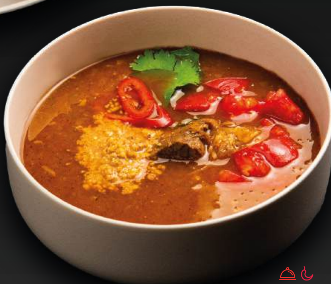
ХАРЧО 590 с говядиной