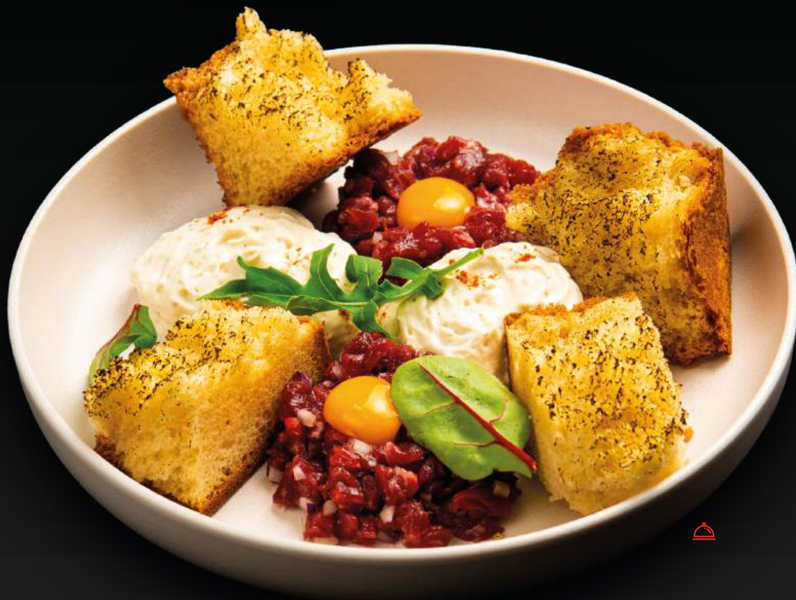
ТАРТАР ИЗ ГОВЯДИНЫ