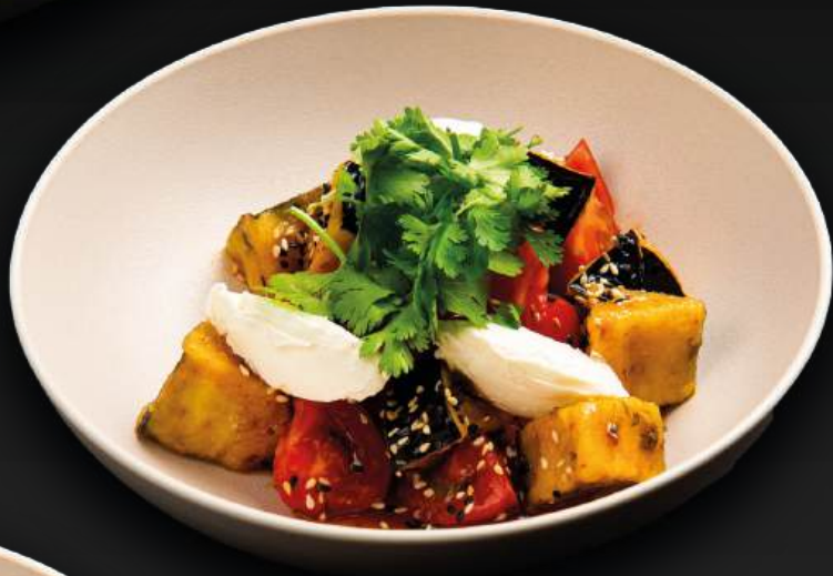
С ХРУСТЯЩИМИ БАКЛАЖАНАМИ 650