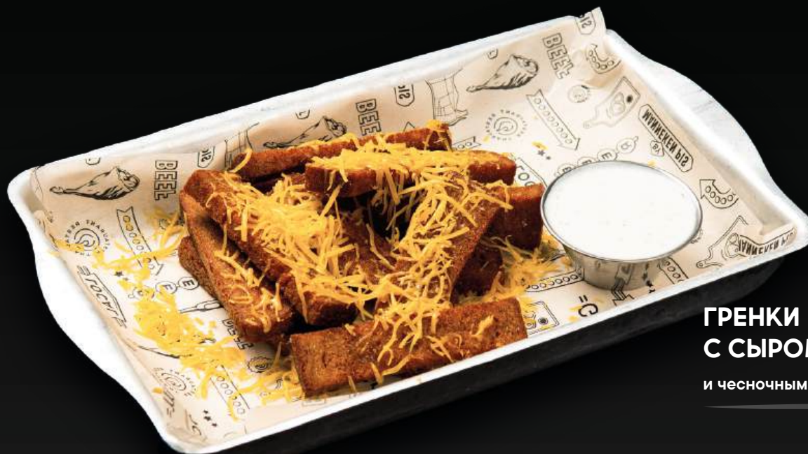
ГРЕНКИ С СЫРОМ 390 и чесночным соусом