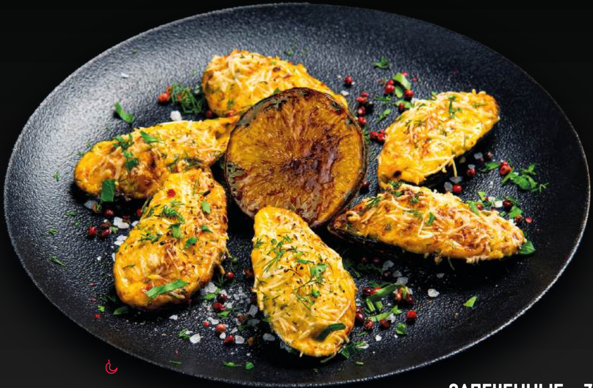
ЗАПЕЧЕННЫЕ МИДИИ 750 6 штук