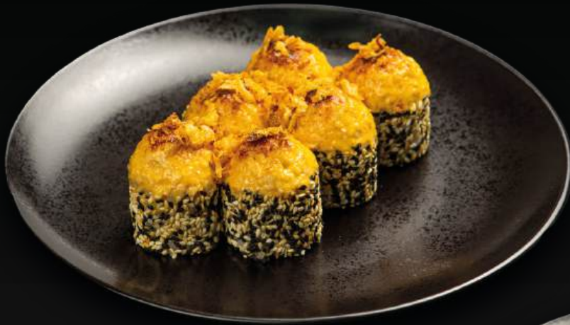
ЗАПЕЧЕННЫЙ РОЛЛ С ГРИБАМИ И КУРИЦЕЙ 450