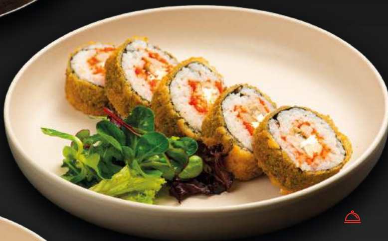
РОЛЛ ТЕМПУРА С КУРИЦЕЙ 490