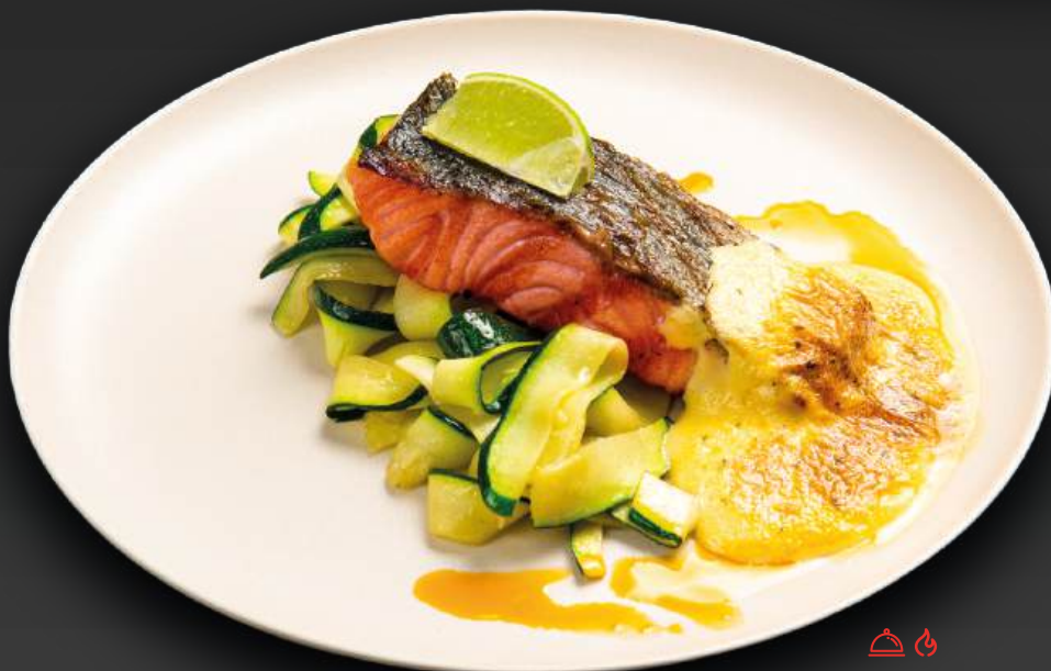
СТЕЙК ИЗ МОРСКОЙ ФОРЕЛИ 1350 с тальятелле из цукини и соусом бешарнез