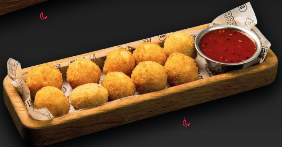
ОСТРЫЕ СЫРНЫЕ ШАРИКИ 550