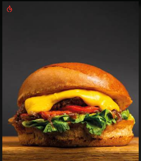
ЧИЗБУРГЕР С ПЕЧЕНЫМ ПЕРЦЕМ 750

котлетой из мраморной говядины, сыром чеддер и луковым мармеладом