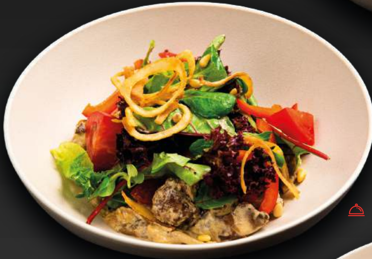
ТЕПЛЫЙ С КУРИНОЙ 590 ПЕЧЕНЬЮ,