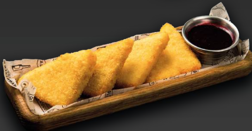
ЖАРЕННЫЙ СЫР ЧЕДДЕР 570