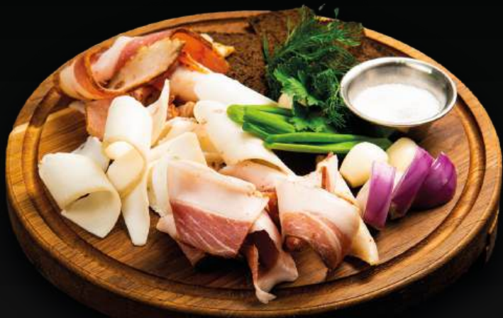
АССОРТИ ИЗ ТРЕХ 750 ВИДОВ САЛА