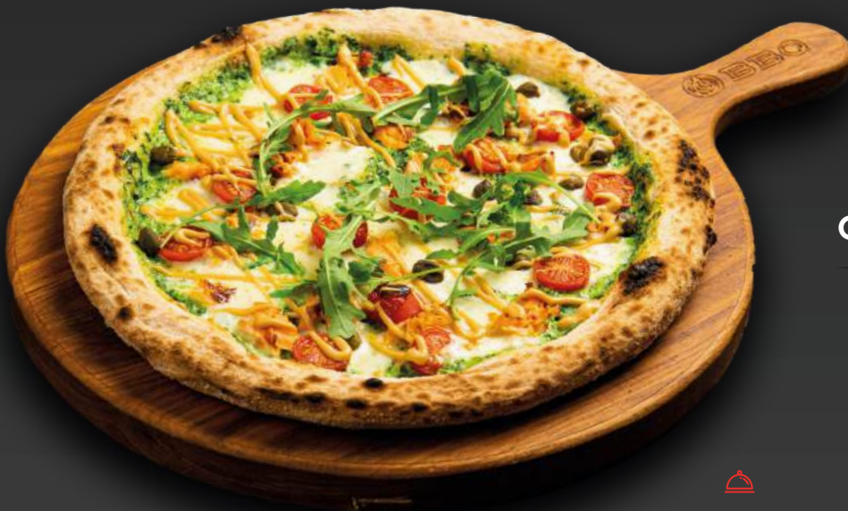
С ЛОСОСЕМ 980