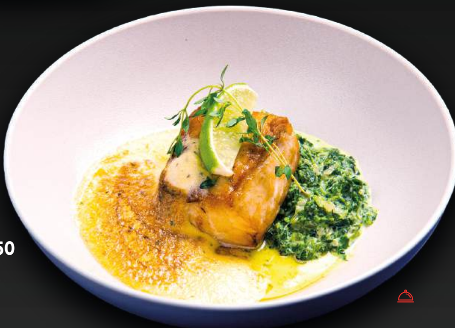
КЛЫКАЧ СО ШПИНАТОМ 1250 в сливках и соусом бешарнез