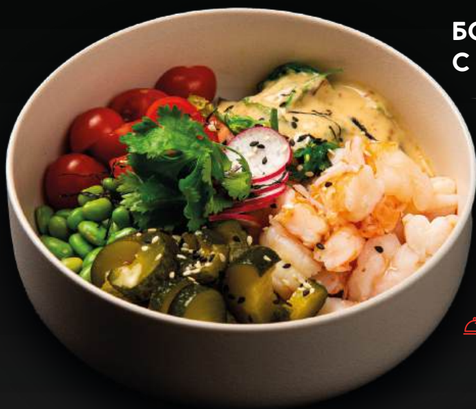
БОУЛ С КРЕВЕТКАМИ 850