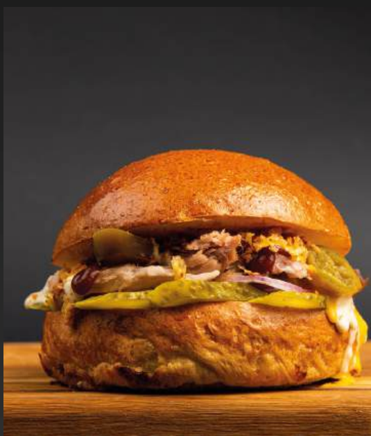
БУРГЕР С РВАНЫМ МЯСОМ 750

котлетой из мраморной говядины, сыром чеддер и луковым мармеладом