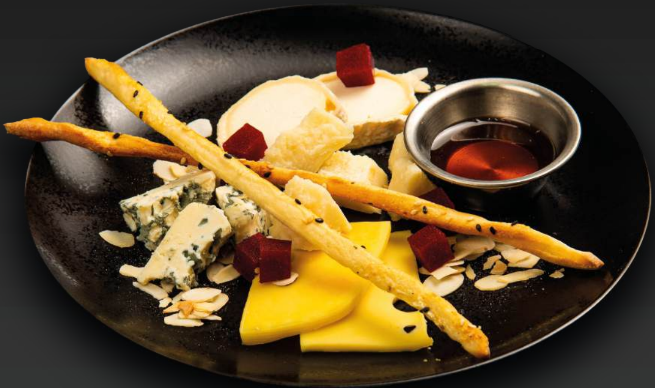
СЕТ СЫРОВ 960