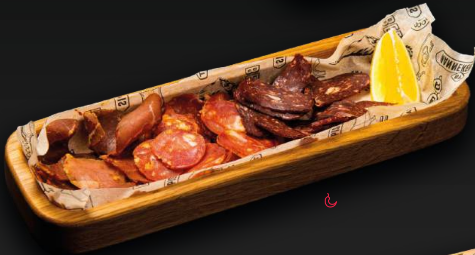
МИКС ВЯЛЕННОГО МЯСА 650