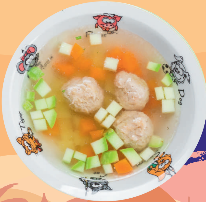
ОВОЩНОЙ СУП С ФРИКАДЕЛЬКАМИ 215