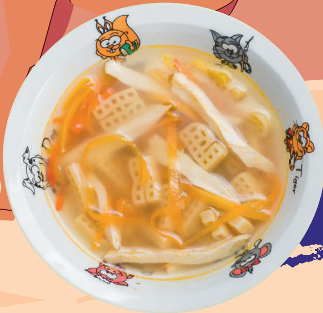
КУРИНЫЙ СУП С ЛАПШОЙ 215