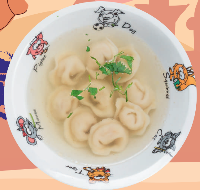
ПЕЛЬМЕНИ ИЗ ЦЫПЛЁНКА С БУЛЬОНОМ 215