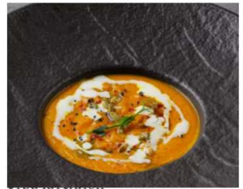
крем суп из тыквы со страчателлой 250 мл.