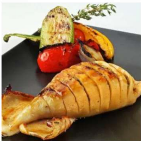
Кальмар на гриле командорский кальмар на гриле с соусом от Шефа, лимон 1 шт. 990 ₺