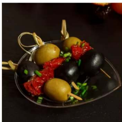
Антипаста с артишоками

гиганские маслины, оливки, вяленые томаты, тимьян