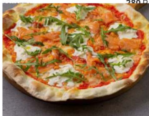
Пицца сёмга со страчателлой спец-цена

сёмга, сыр страчателла, томаты, маслины, орегано и моцарелла