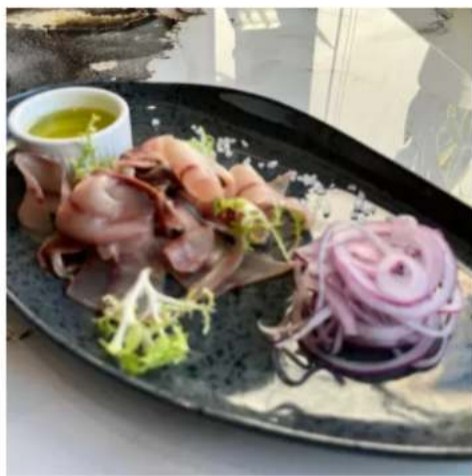
Строганина из пеламиды

филе пеламиды ( тунец ) замороженное, лук, уксус, масло оливковое