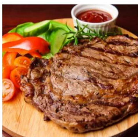
Стейк нежный говяжий говяжья вырезка, салат микс, томаты, зелень, соус деми гласс 260 гр. 2100 ₺