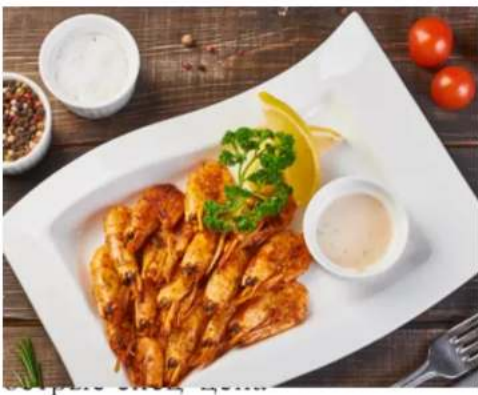
креветки обжаренные в чесночном масле с соусом 180 гр.