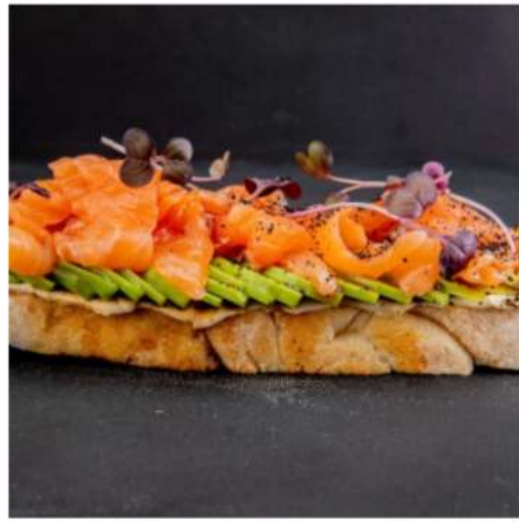
Брускетта с сёмгой и авокадо

сёмга, страчателла, бальзамическим крем, авокадо