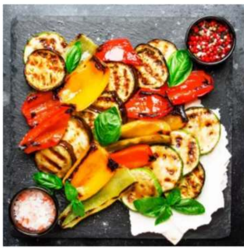
Овощи гриль в чесночном масле баклажан, кабачок, томат, перец сладкий, лук красный,