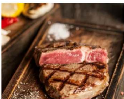
350 гр. 2350 ₺