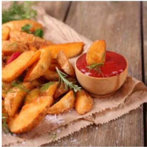
Картофельные дольки по-деревенски картофельные дольки по-деревенски с кетчупом 150\50 гр.