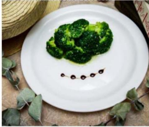
Брокколи в сливочном масле брокколи в сливочном масле 150 гр.