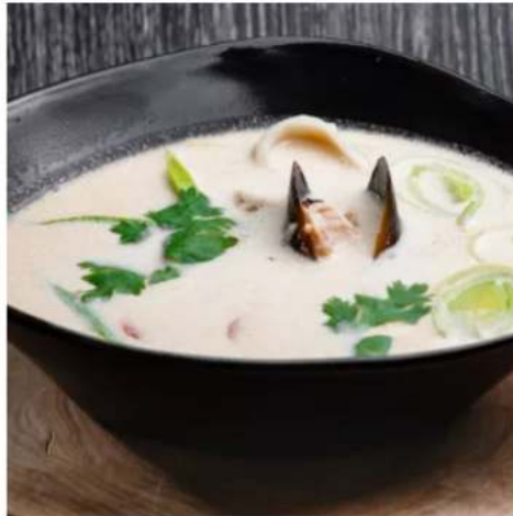
Сливочный суп с морепродуктами сливочный суп с морским коктейлем, луком пореем и черри 250 мл.