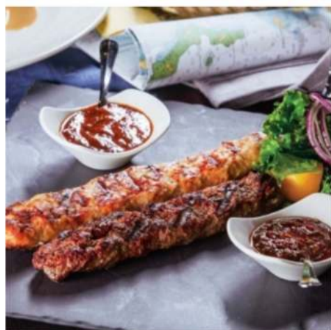
Люля - кебаб из утки утиное мясо на гриле с зеленью и аджикой 250 гр. 990 ₺