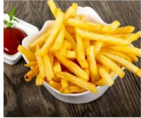
Картофель фри картофель фри с кетчупом 150\50 гр.