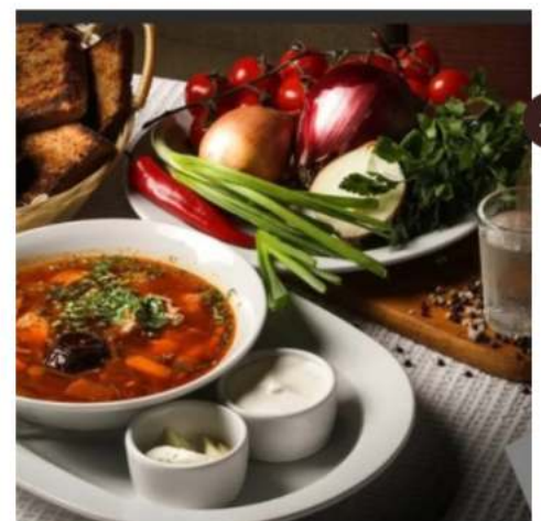
Солянка мясная с салом и хреновухой солянка мясная, сало, хреновуха 50 гр. 250 мл.