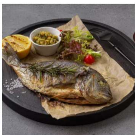
Дорадо на гриле спец-цена дорадо на пару или гриль, цукини, сладкий перец, чери, лук порей, шампиньоны и тар-тар 1 шт. 999 ₺