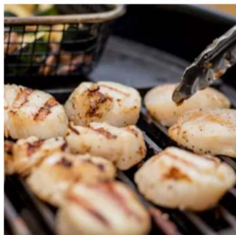
Морской гребешок на гриле морской гребешок обжаренный с луком порей 180 гр. 1100 ₺