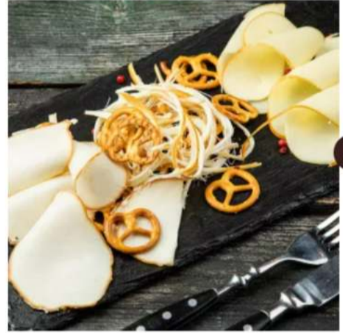
Ассорти подкопченных сыров сыр чечил косичка жареная и подкопченные палочки, сулугуни круг подкопченный 120 г.