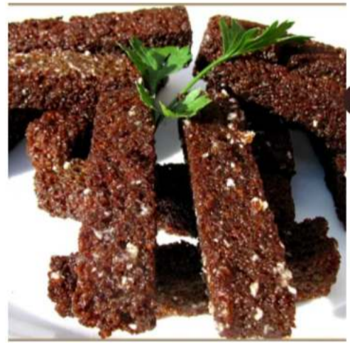
Гренки чесночные с соусом гренки из бородинского хлеба с чесночным соусом 120 г.