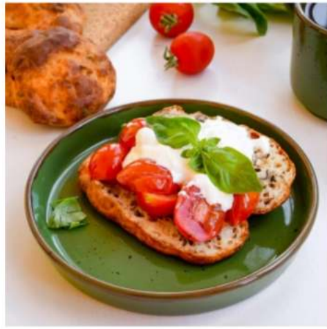
Брускетта со страчателлой