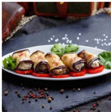
Рулетки из баклажан с творожным сыром

баклажаны, творожный сыр, орехи, чеснок, зелень