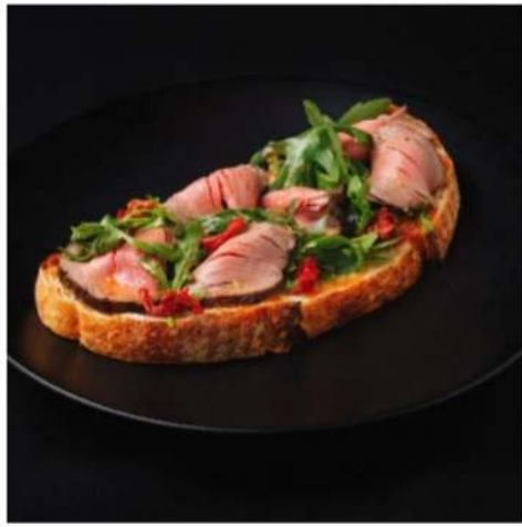
Брускетта с ростбифом