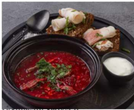
хреновухой борщ домашний с говядиной с салом и гренками, хреновуха 50 гр. 250 мл.