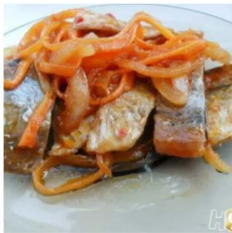
Скумбрия в томатном маринаде с гренками

скумбрия маринованная, лук репчатый, перец душистый и гренки