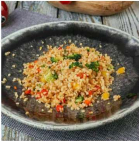
Булгур с овощами булгур, перец болгарский, цукини, брокколи 150 гр.