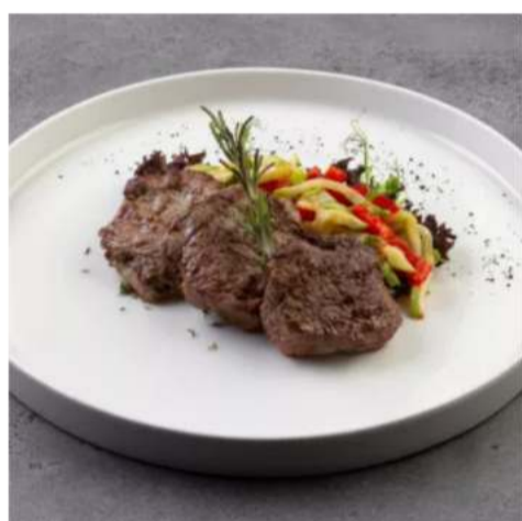
Медальоны из оленины мякоть оленины 310 гр. 2350 ₺