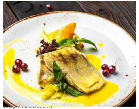
филе судака запеченное под пармезаном, цитрусовый соус и зелень