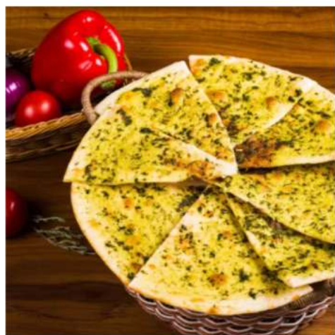
Фокачча классическая лепёшка фокачча с прованскими травами по итальянскому