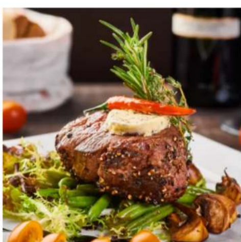
Стейк перечный вырезка говяжья в пяти перцах с соусом демиглас 350 гр. 2300 ₺