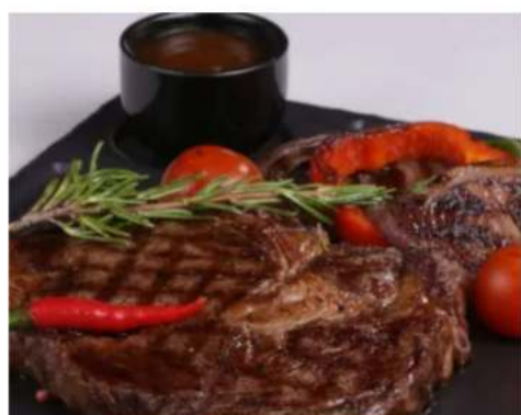
350 гр. 1999 ₺