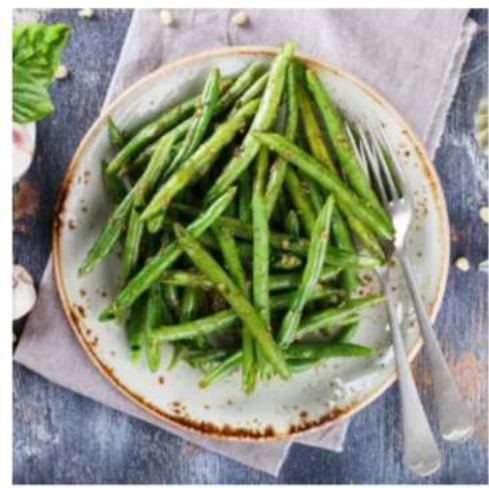
Фасоль кенийская с луком фасоль кенийская, лук репчатый 150\50 гр.