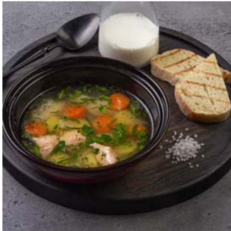
Уха из сёмги с судаком уха из сёмги и судака 250 мл.