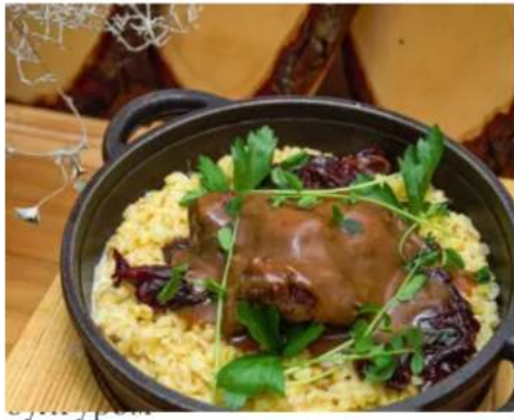
томленые щёчки говяжьих с булгуром