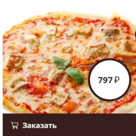
Пицца морской коктейль спец-цена

морской коктейль, маслины, каперсы, с соусом Цезарь