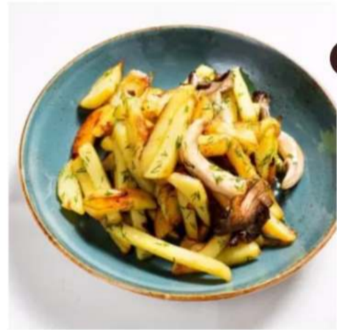
Картофель жареный с вешенками картофель, лук шалот, вешенки 180 гр.