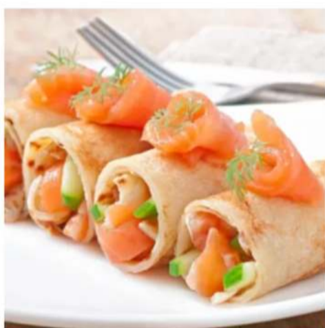
Блинчики с сёмгой и авокадо

блины, сёмга с/с, творожный сыр и авокадо