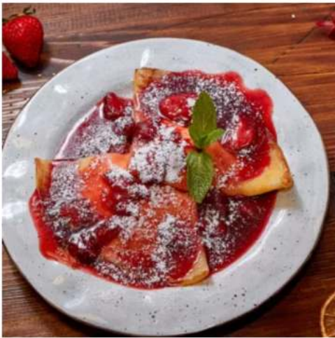
Блинчики с клубникой и маскарпоне спец-цена