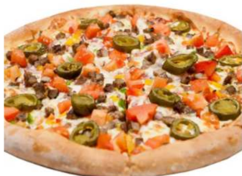
Пицца телятина с халапеньо спец-цена

томатный соус, фарш из телятины, сладкий перец, халапеньо, томаты, лук красный, маслины и моцарелла