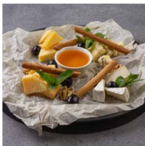
Ассорти сыров с мёдом

дор-блю, бри, пармезан, чеддер, мед, виноград, орех грецкий