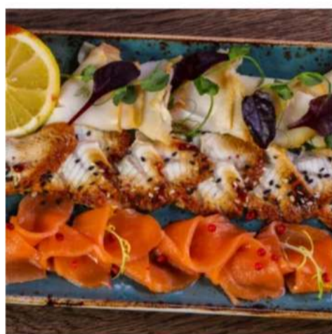
Ассорти рыбное спец.

семга с/с, масляная хол. копчения, угорь г/к, маслины, оливки и лимон