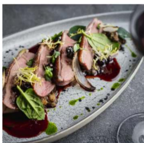
Утиная грудка с брусничным соусом филе утиной грудки на гриле, кенийская фасоль, жареные вешенки, лук красный, жареные чери, брусничный и кисло-сладкий соус 260 гр. 1350 ₺