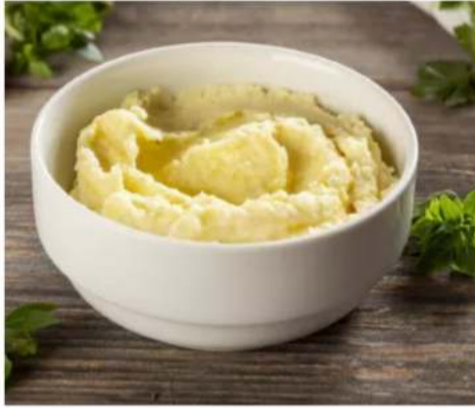
Картофельное пюре картофель, масло сливочное и молоко 150\50 гр.