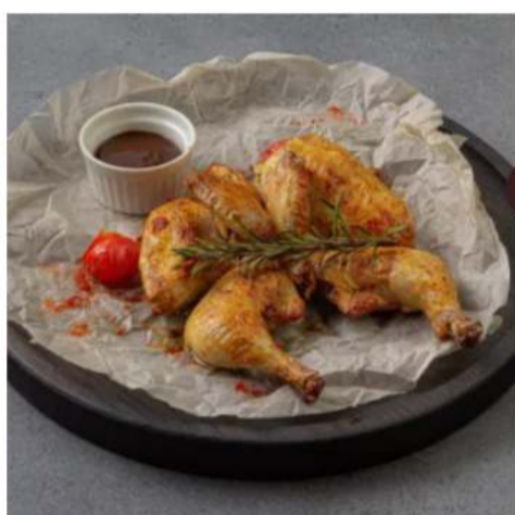
Фермерский цыпленок Табака цыпленок на гриле, микс салат с кисло-сладким соусом, томаты, огурец, зелень, соус аджика 1шт. 1100 ₺