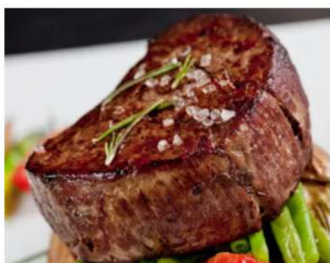
мраморная говядина и соус деми гласс 320 гр. 2250 ₺