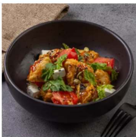
Хрустящий баклажан с томатами и сыром фета

баклажан, сыр фета, томаты, кинза, соус кисло-сладкий