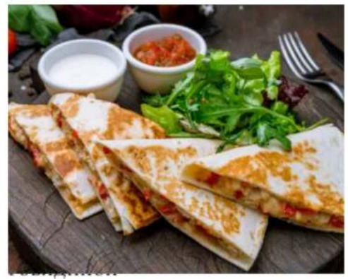
сырная лепёшка с мраморной говядиной, фасолью, перцем сладким, цукини, баклажаном, сыром, сальсой и сметаной 330 гр.