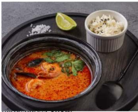
острый тайский суп с креветками и кальмаром 250 мл.