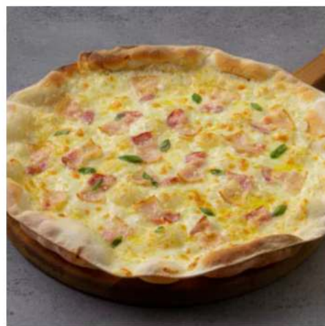
Пицца Карбонара спец- цена