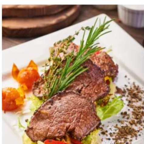
Медальоны из мраморной говядины мраморная говядина и соус деми гласс 310 гр. 2350 ₺