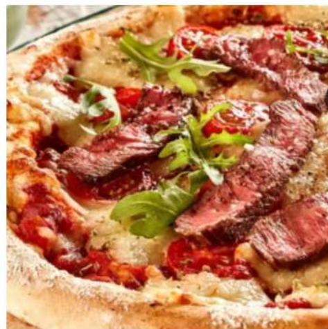
Пицца сочный ростбиф спец-цена