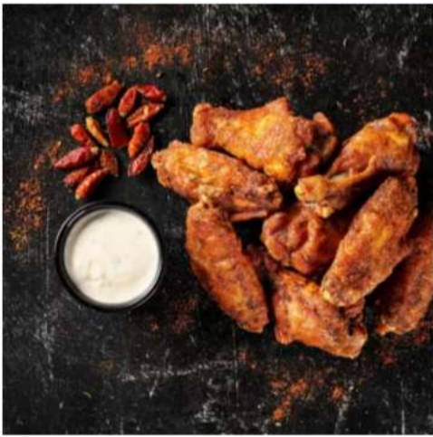
Куриные крылья Барбекю барбекю крылышки с соусом блю-чиз, с морковкой, сельдереем и картофелем фри 280 г.