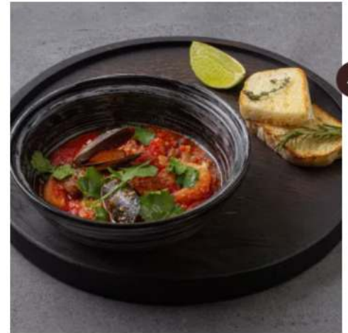
Томатный суп с морепродуктами томатный суп с морским коктейлем, черри и соусом песто 250 мл.