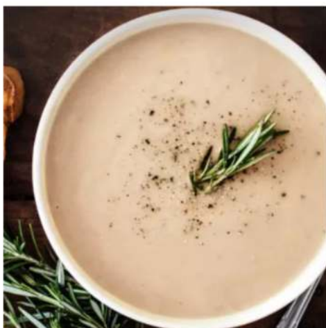
Суп крем из вешенок крем суп из вешенок с чабаттой 250 мл.