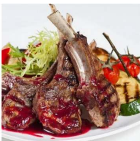
Каре ягнёнка спец-цена корейка ягнёнка с томатами, зеленью и соусом аджика 180/60 гр. 1111 ₺