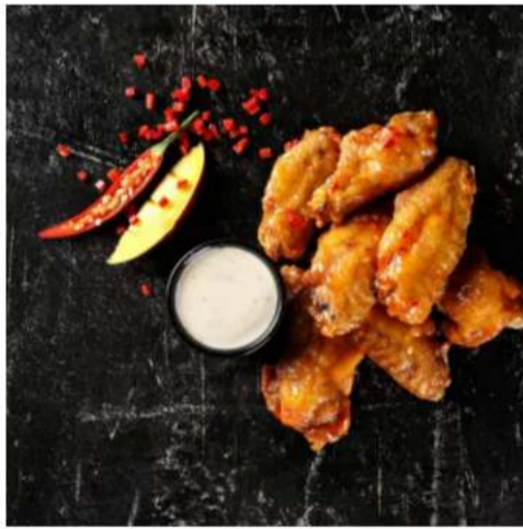
Куриные крылья острые острые крылышки с соусом блю-чиз, с морковкой, сельдереем и картофелем фри 280 г.