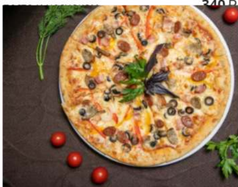
Пицца утиная грудка подкопченная спец-цена

магре утиная, сладкий перец, маслины, лук, моцарелла