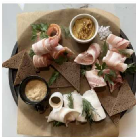
Сало с ржаными тостами

сало соленое с прослойкой, сало копченое, шпиг, гренки, горчица, хрен