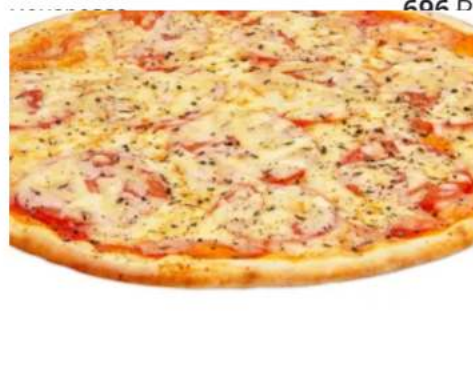
Пицца Маргарита спец- цена