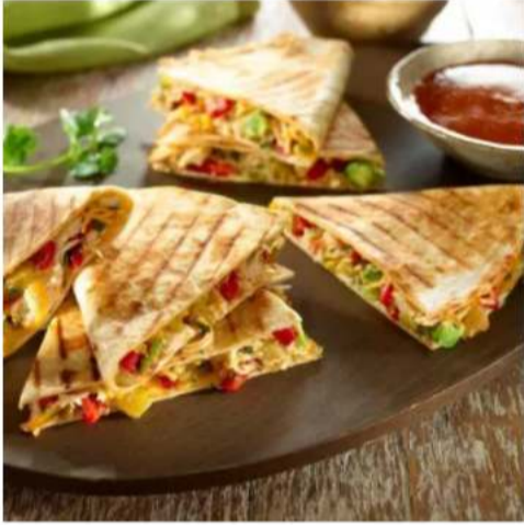
Кесадилья с морепродуктами сырная лепёшка с морепродуктами, фасолью, перцем сладким, цукини, баклажаном, сыром, сальсой и сметаной 380 гр.