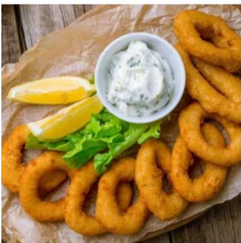
Кольца кальмара в кляре кольца кальмара в кляре собственного производства с соусом тар-тар 220 гр.