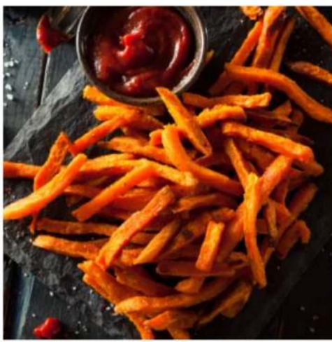
Фри из батата фри из батата с кетчупом 150\50 гр.