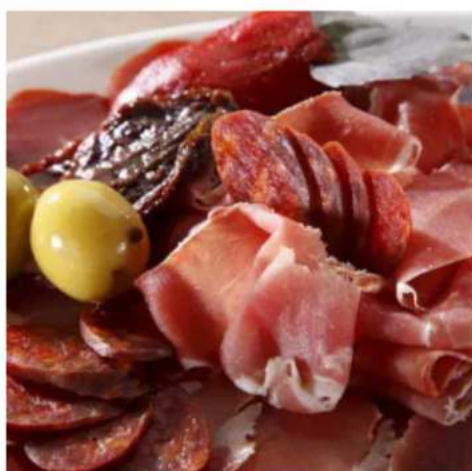
Хамон с грушей и сыром дор-блю спец-цена