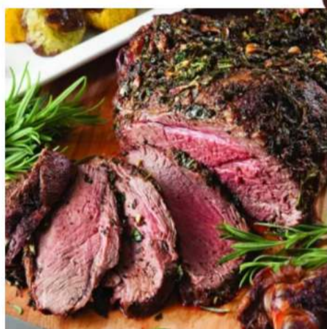
Мясные домашние деликатесы

буженина из свиной шейки, сочный ростбиф из говяжьей вырезки, язык говяжий отварной, хрен, горчица и зелень