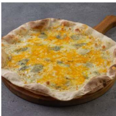
Пицца Четыре сыра спец-цена

сыр дор-блю, моцарелла, пармезан, чеддер с соусом Цезарь