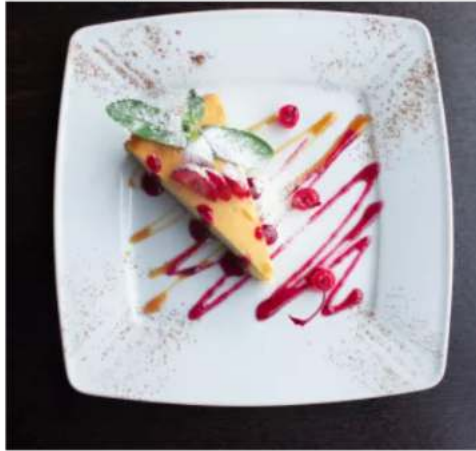
Чизкейк манго маракуйя