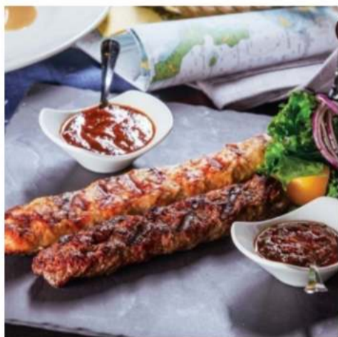
Люля - кебаб из оленины люля из мякоти оленя на гриле с зеленью и аджикой 250 гр. 1390 ₺