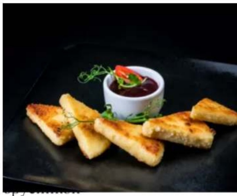
жареный сыр халлуми, сладкий соус 180 гр.