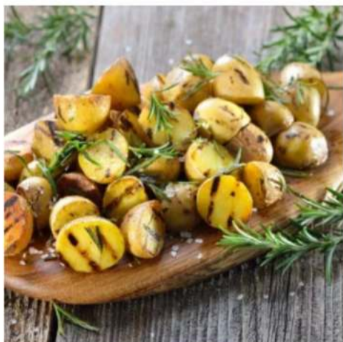
Бэби картофель с розмарином и чесноком бэби картофель запеченный с розмарином и чесноком 150 гр.