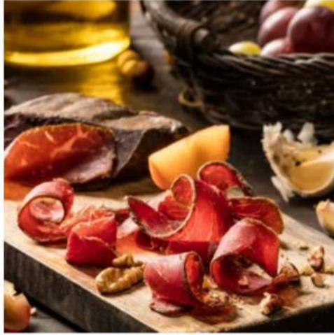
Сыровяленые деликатесы сыровяленая говядина, суджук, бастурма 160 г.