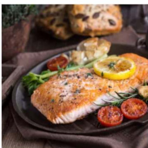
Сёмга стейк спец-цена стейк из сёмги с красной икрой, цукини, томатом и с соусом от Шефа 180/80 гр. 1111 ₺