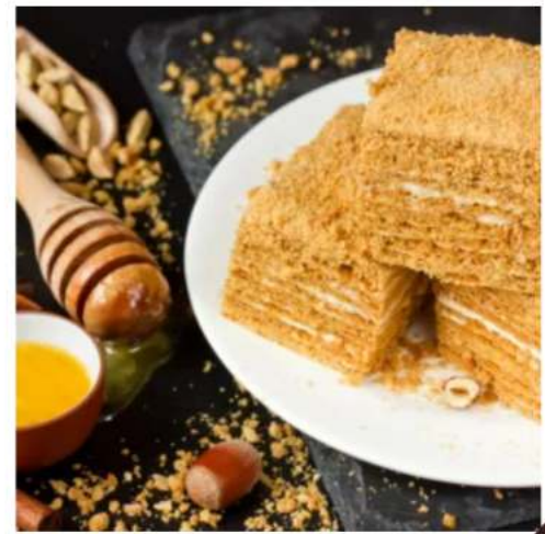
Медовик с брусникой