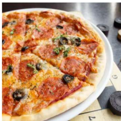
Пицца пепперони спец- цена

томатный соус, пепперони, маслины и сыр моцарелла