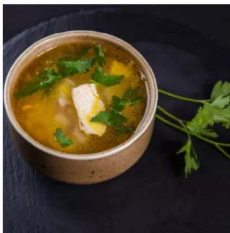
Суп куриный с лапшой суп-лапша с курицей классический 250 мл.