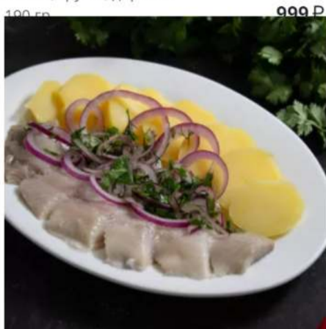
Сельдь с картошечкой и лучком

слабо солёная сельдь с отварной картошечкой и лучком