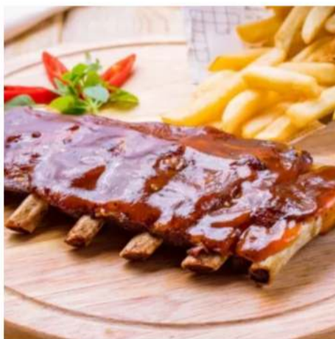
Рёбрышки свиные барбекю с фри запеченные свиные рёбрышки под соусом барбекю с картофелем фри и кетчупом 320 гр.