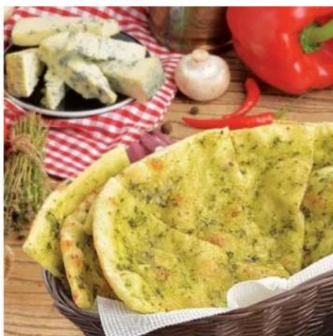
Фокачча с пармезаном и песто