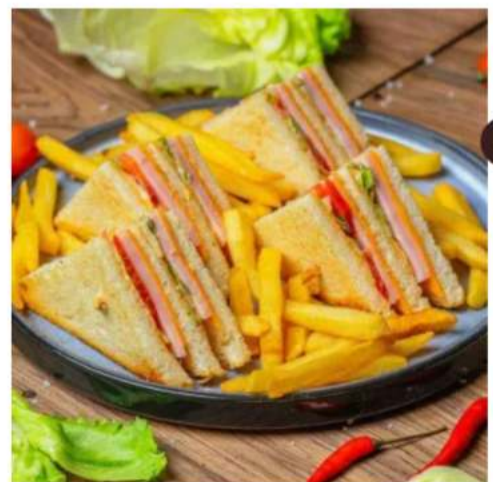
Клуб - сэндвич с индейкой и беконом с фри