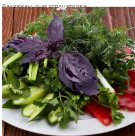
Свежие овощи с зеленью сладкий перец, огурцы, томаты, зелень, лук