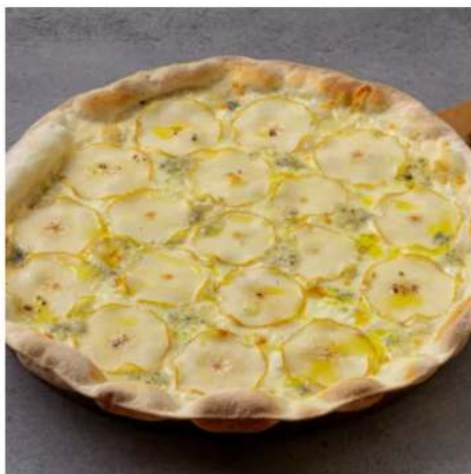
Пицца Дор - блю с грушей спец-цена

сыр дор-блю, груша, сыр моцарелла, соус цезарь