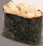
С КРАБОМ 300