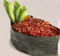
КРАСНАЯ ИКРА 300