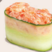
С ЛОСОСЕМ В ОГУРЦЕ 250