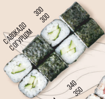
САВОКАДО С ОГУРЦОМ 300