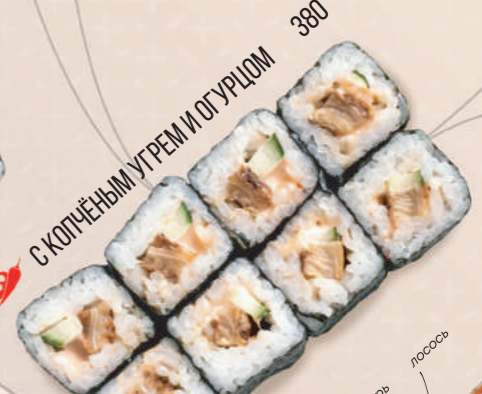
С КОПЧЁНЫМ УГОРЕМ И ОГУРЦОМ 380