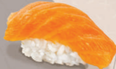
КОПЧЁНЫЙ ЛОСОСЬ* 250