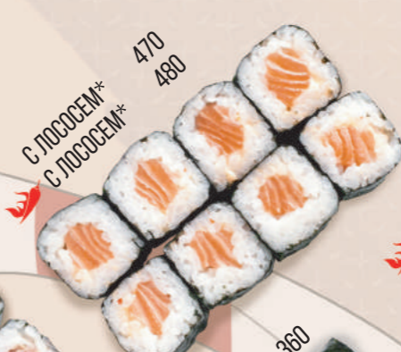
С ЛОСОСЕМ* С ЛОСОСЕМ* 470 480