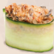
С КОПЧЁНЫМ УГОРЕМ В ОГУРЦЕ 250