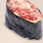
С ТУНЦОМ 250