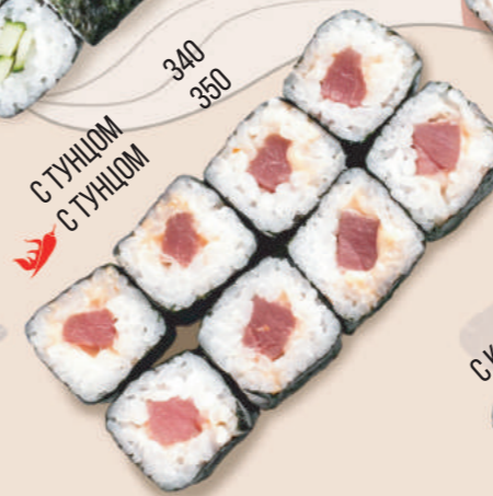
С ТУНЦОМ С ТУНЦОМ 340 350