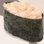
С ГРЕБЕШКОМ 300