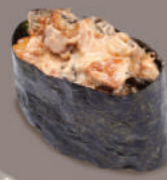
С КОПЧЁНЫМ УГОРЕМ 250