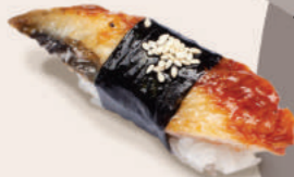
КОПЧЁНЫЙ УГОРЬ 300