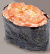
С ЛОСОСЕМ 250