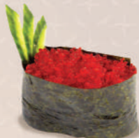
ИКРА ЛЕТУЧЕЙ РЫБЫ 250