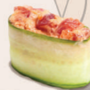
С ТУНЦОМ В ОГУРЦЕ 250