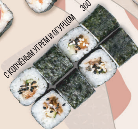
С КОПЧЁНЫМ УГОРЕМ И ОГУРЦОМ 360