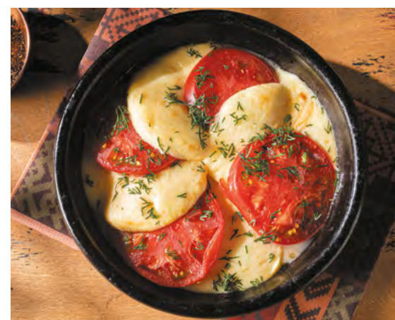
Запечённый сулугуни с томатами ХИТ 620 ₺ 240 г