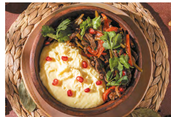
Ташмиджаби с говядиной и жареными овощами с картофельным пюре и сулгуни