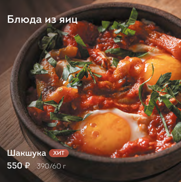
Шакшука ХИТ 550 ₺ 390/60 г