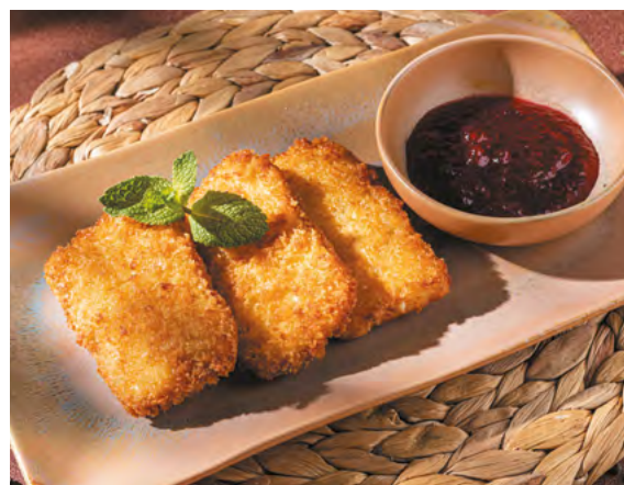
Сулугуни домашнего копчения в панировке с клюквенным соусом 350 ₺ 140/30 г