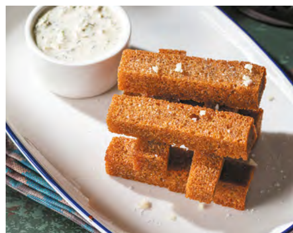
Чесночные гренки с соусом тартар 265 ₺ 90/30 г