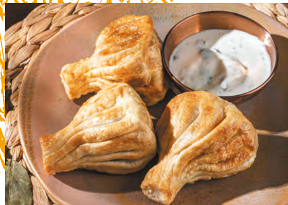
Жареные хинкали с говядиной и свининой с чесночным соусом