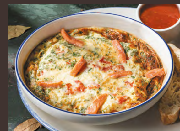
Чирбули с лососем 200/50/40 г 490 ₺ Воздушный омлет со сливками, лососем, томатами и сыром сулугуни