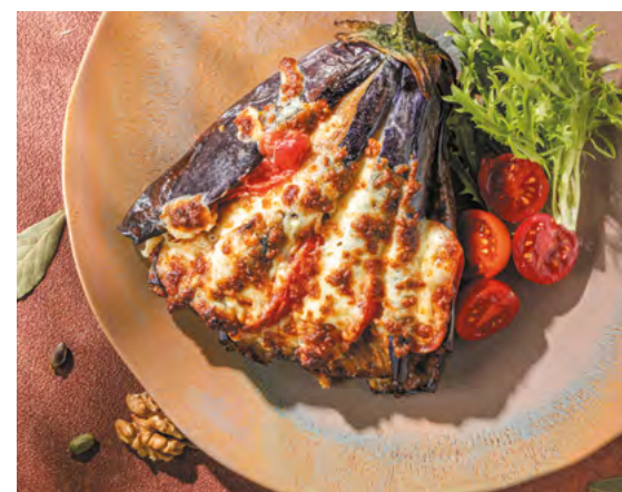
Запечённый баклажан 640 ₺ 260/25/5 г