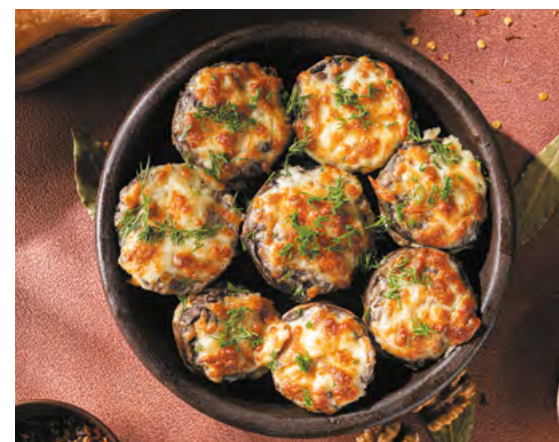
Запечённые шампиньоны с сулугуни 390 ₺ 175 г ХИТ