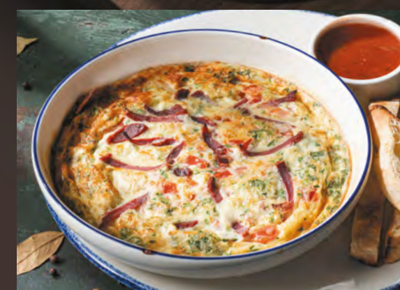
Чирбули с бастурмой 200/50/40 г 450 ₺ Воздушный омлет со сливками, бастурмой, томатами и сыром сулугуни