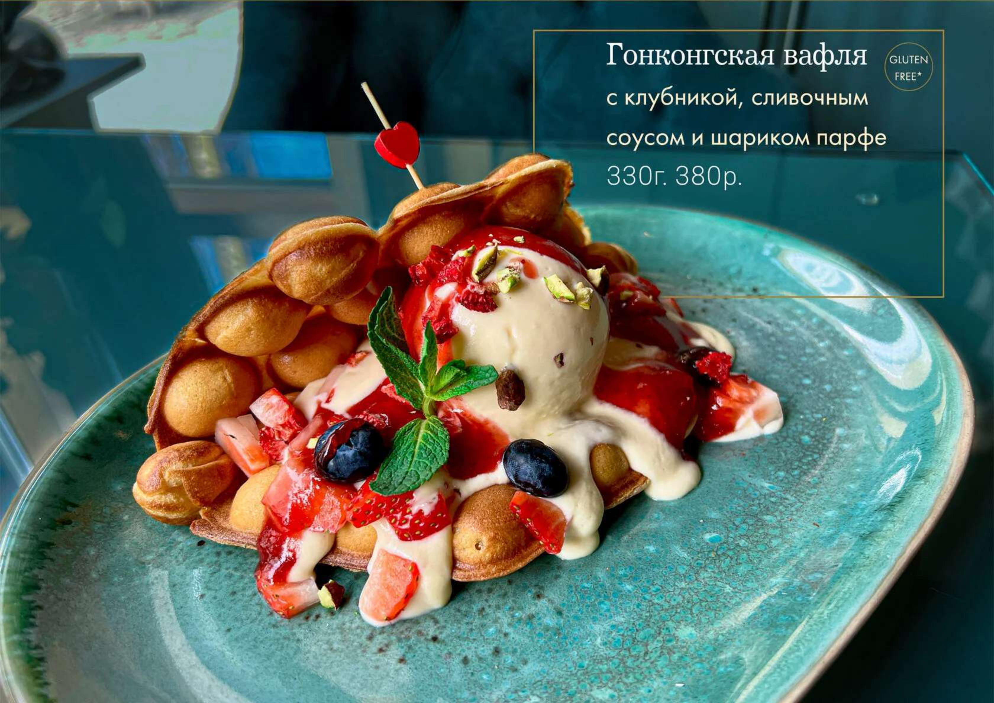
Гонконгская вафля с клубникой, сливочным соусом и шариком парфе 330г. 380р.