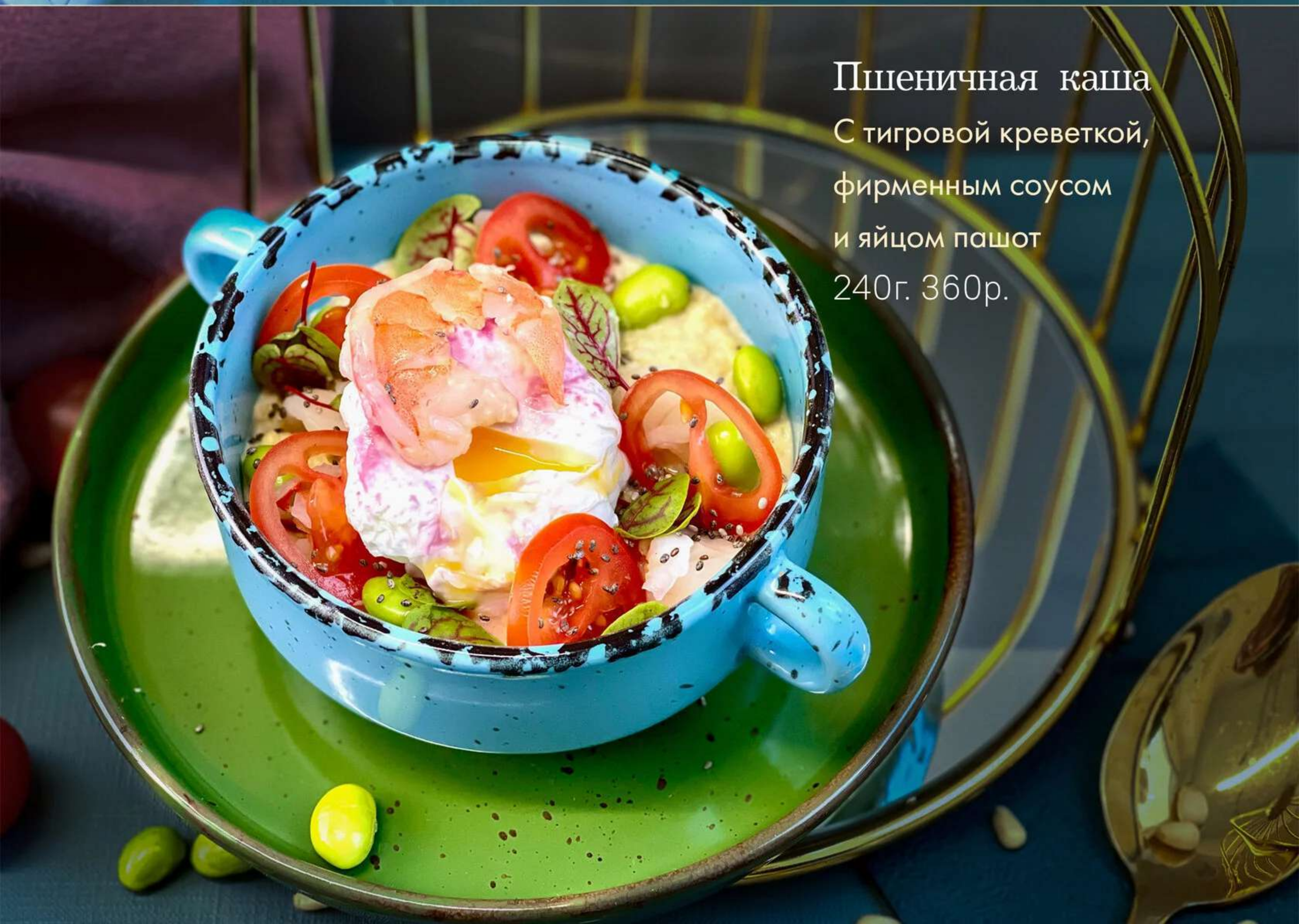
Пшеничная каша С тигровой креветкой, фирменным соусом и яйцом пашот 240г. 360р.