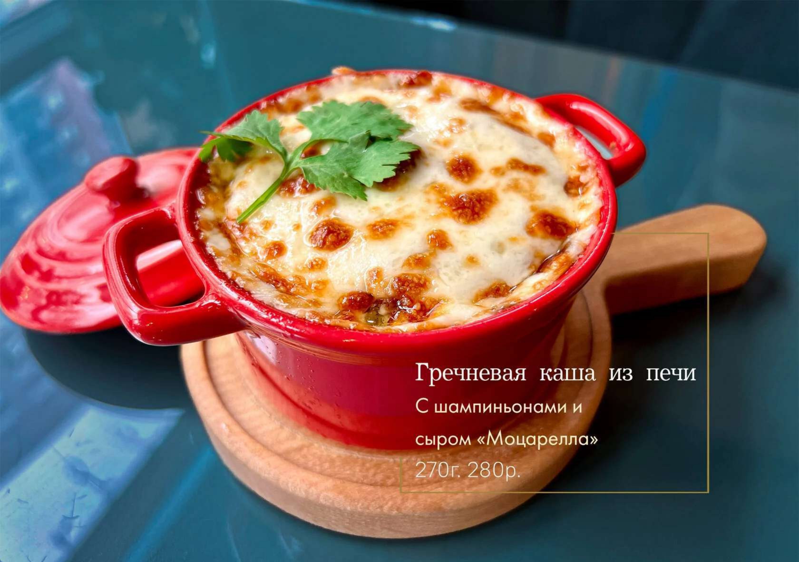
Гречневая каша из печи С шампиньонами и сыром «Моцарелла» 270г. 280р.