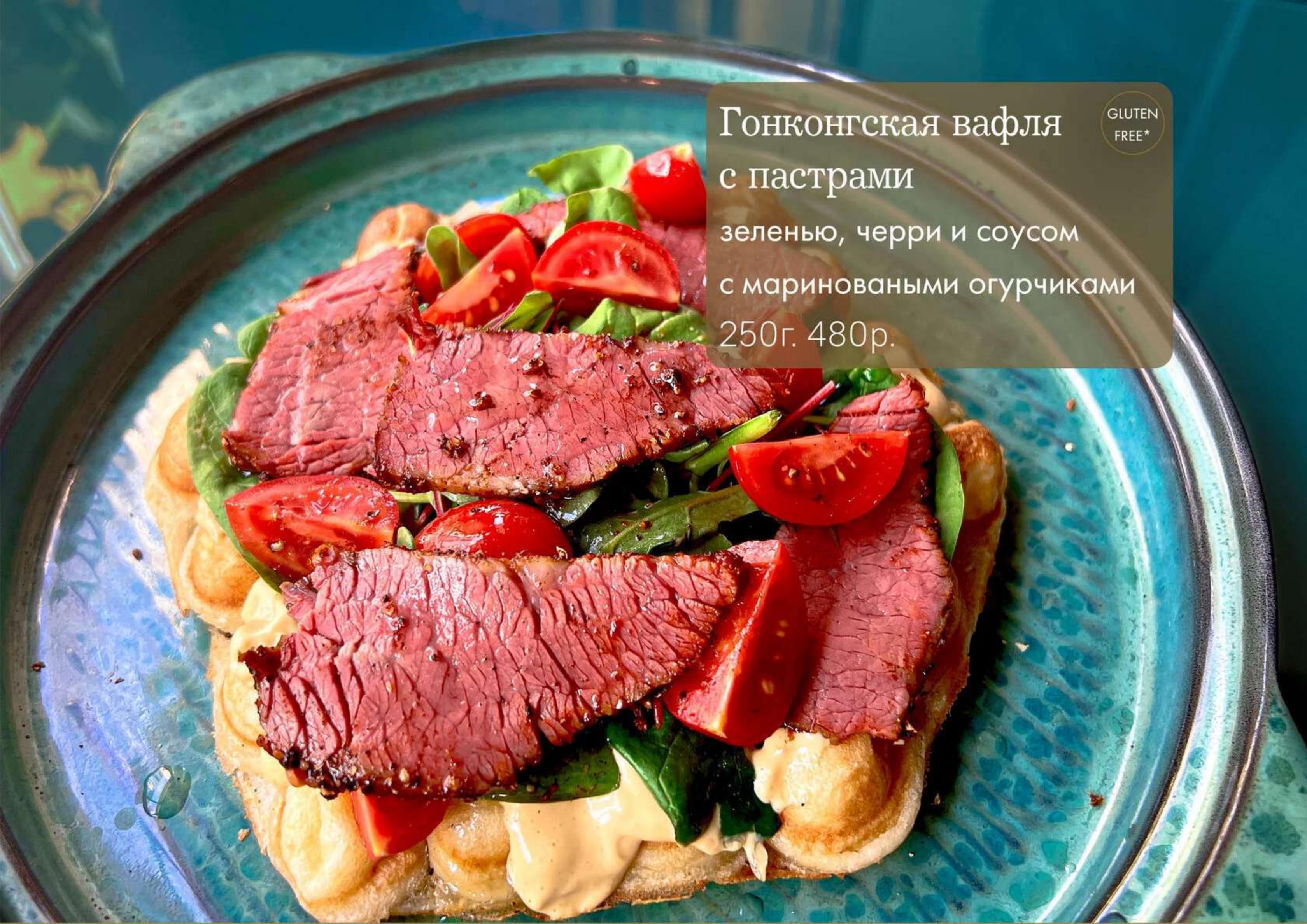
Гонконгская вафля с пастроми зеленью, черри и соусом с маринованными огурчиками 250г. 480р.