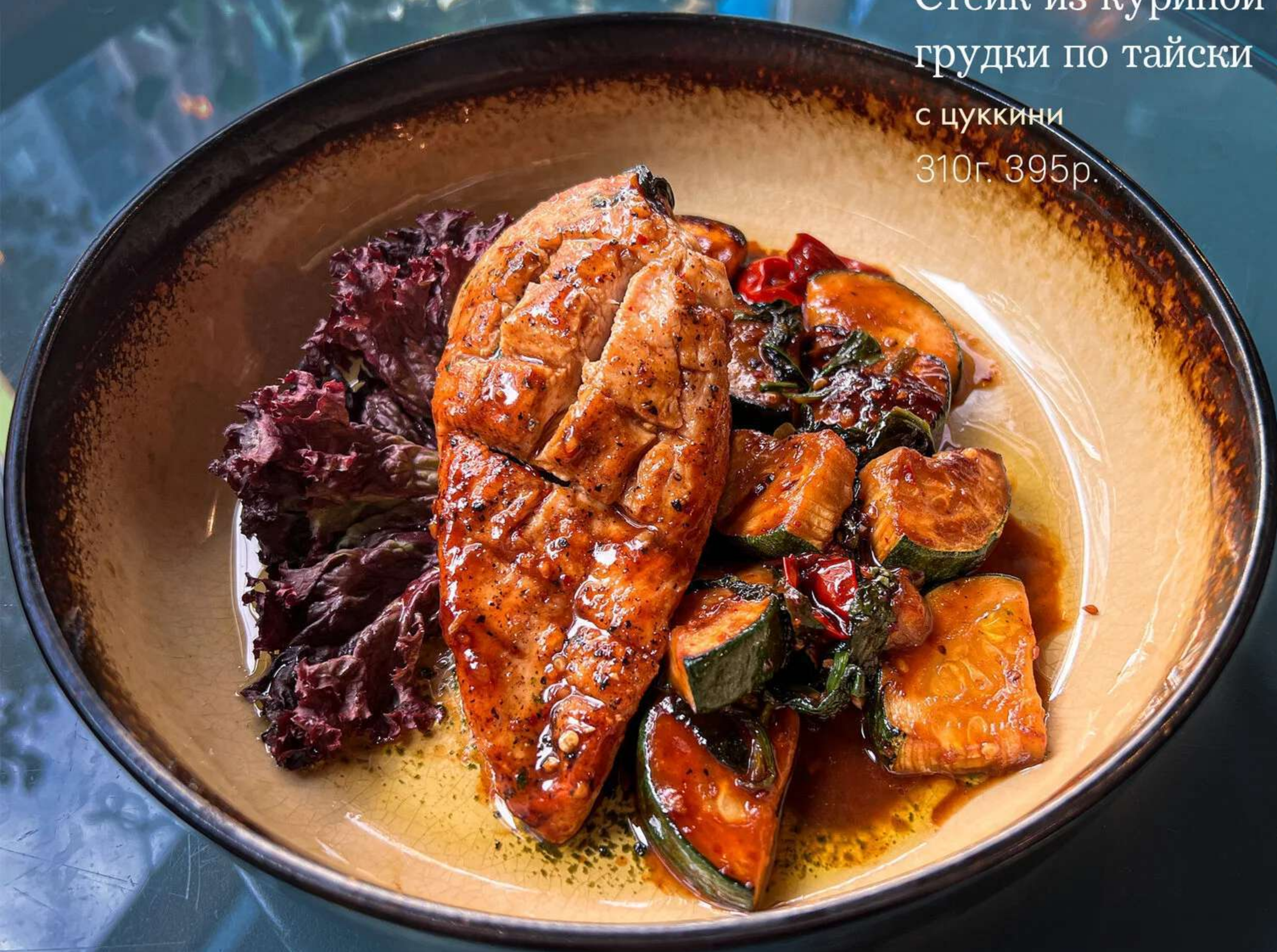
Стейк из куриной грудки по тайски с цуккини 310г. 395р.