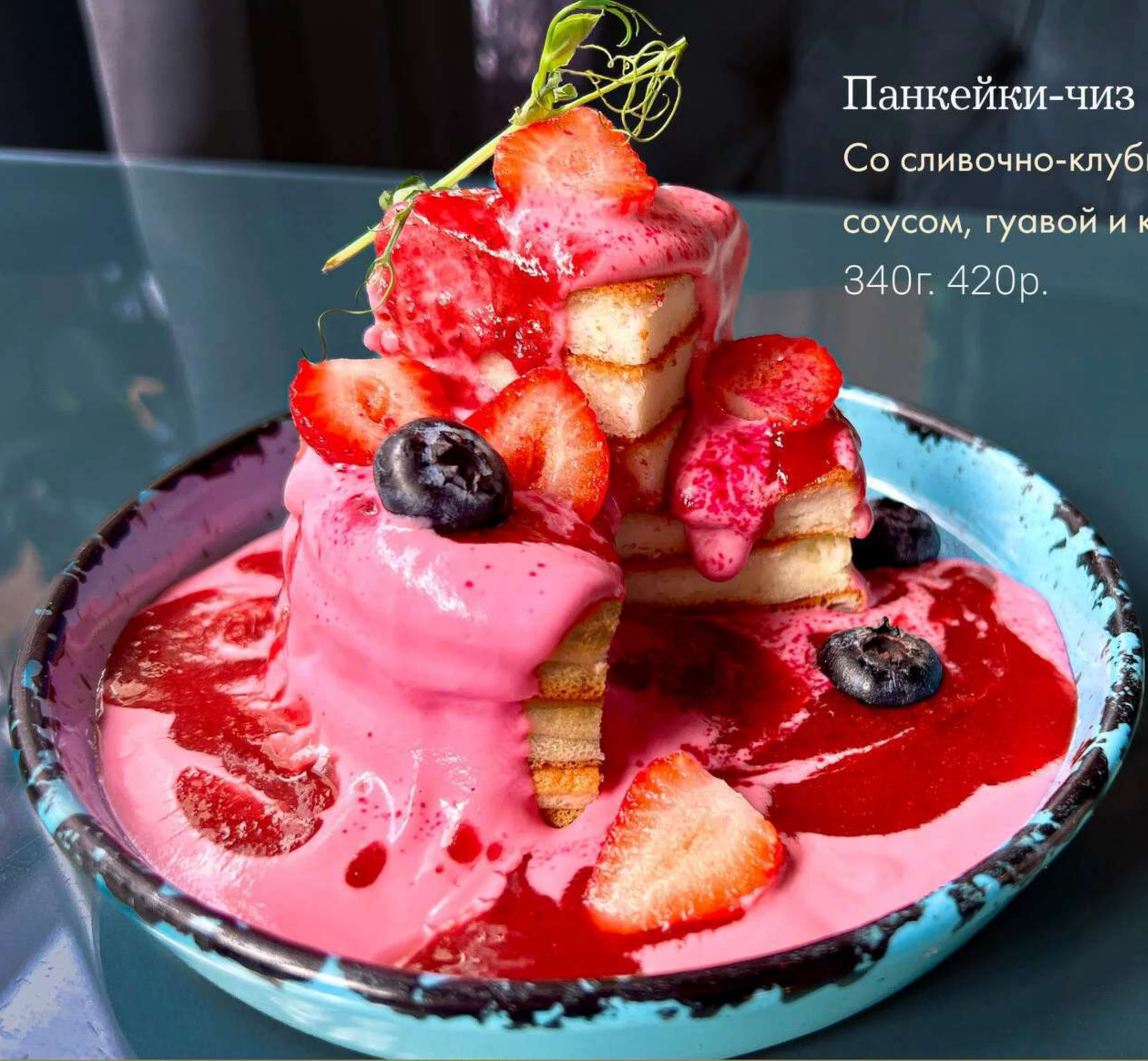
Панкейки-чиз GLUTEN FREE* Со сливочно-клубничным соусом, гуавой и клубникой 340г. 420р.