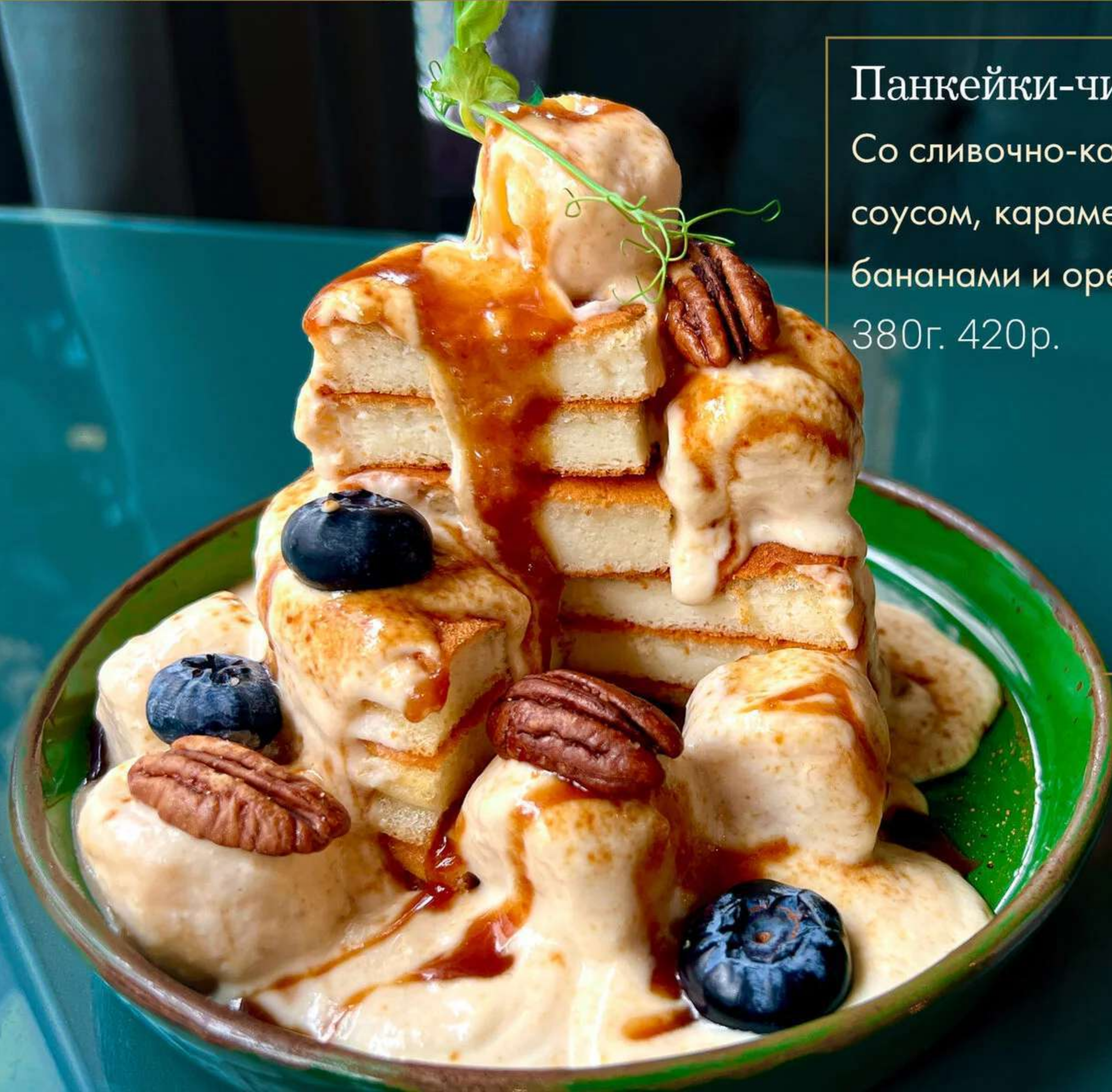
Панкейки-чиз GLUTEN FREE* Со сливочно-карамельным соусом, карамелизированными бананами и орехом пекан. 380г. 420р.