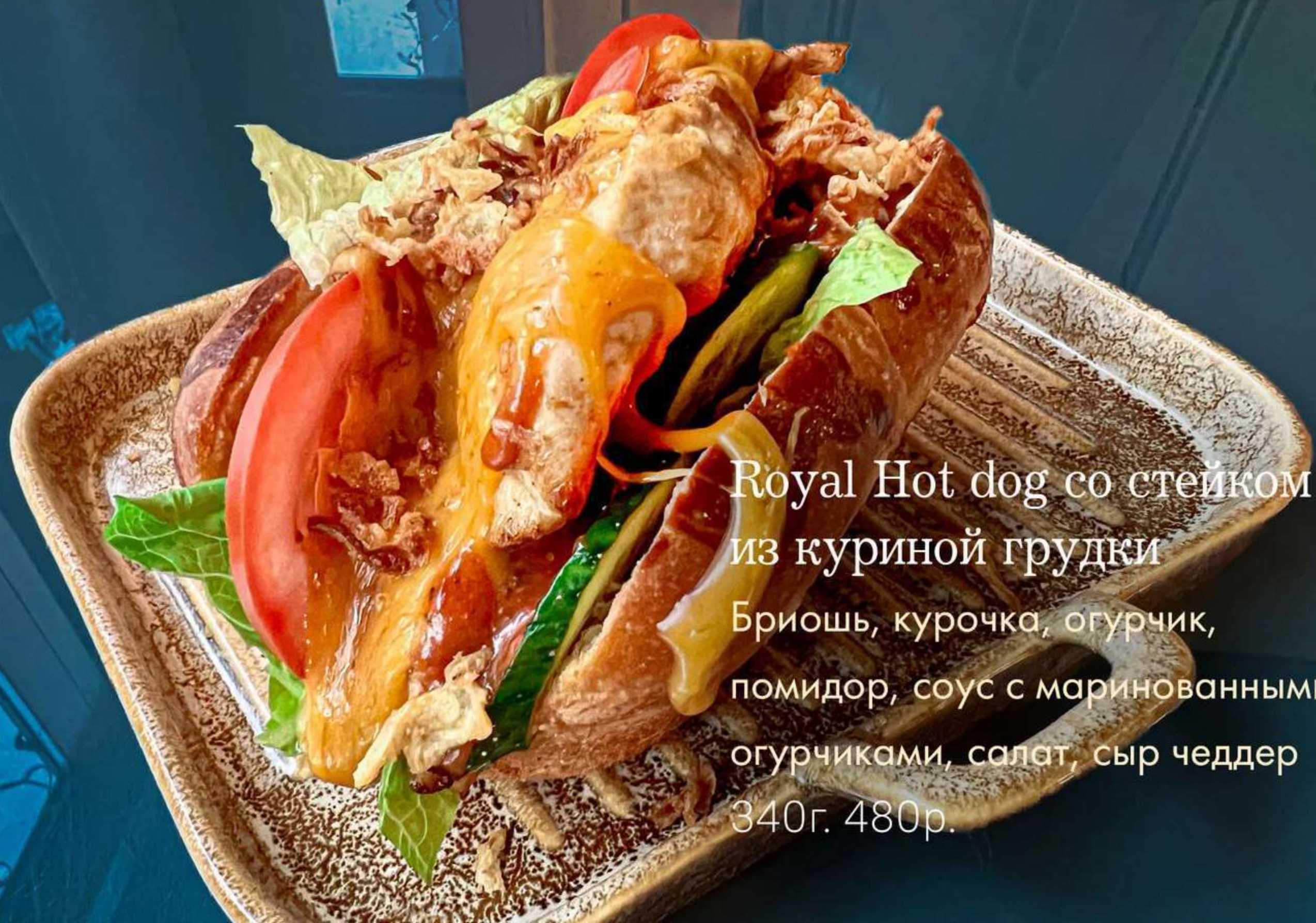
Royal Hot dog со стейком из куриной грудки Бриошь, курочка, огурчик, помидор, соус с маринованными огурчиками, салат, сыр чеддер 340г. 480р.