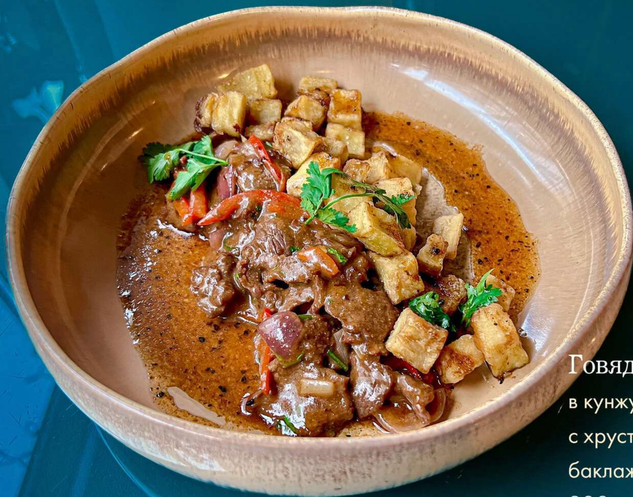
Говядина в кунжутном соусе с хрустящими баклажанами 300г. 470р.