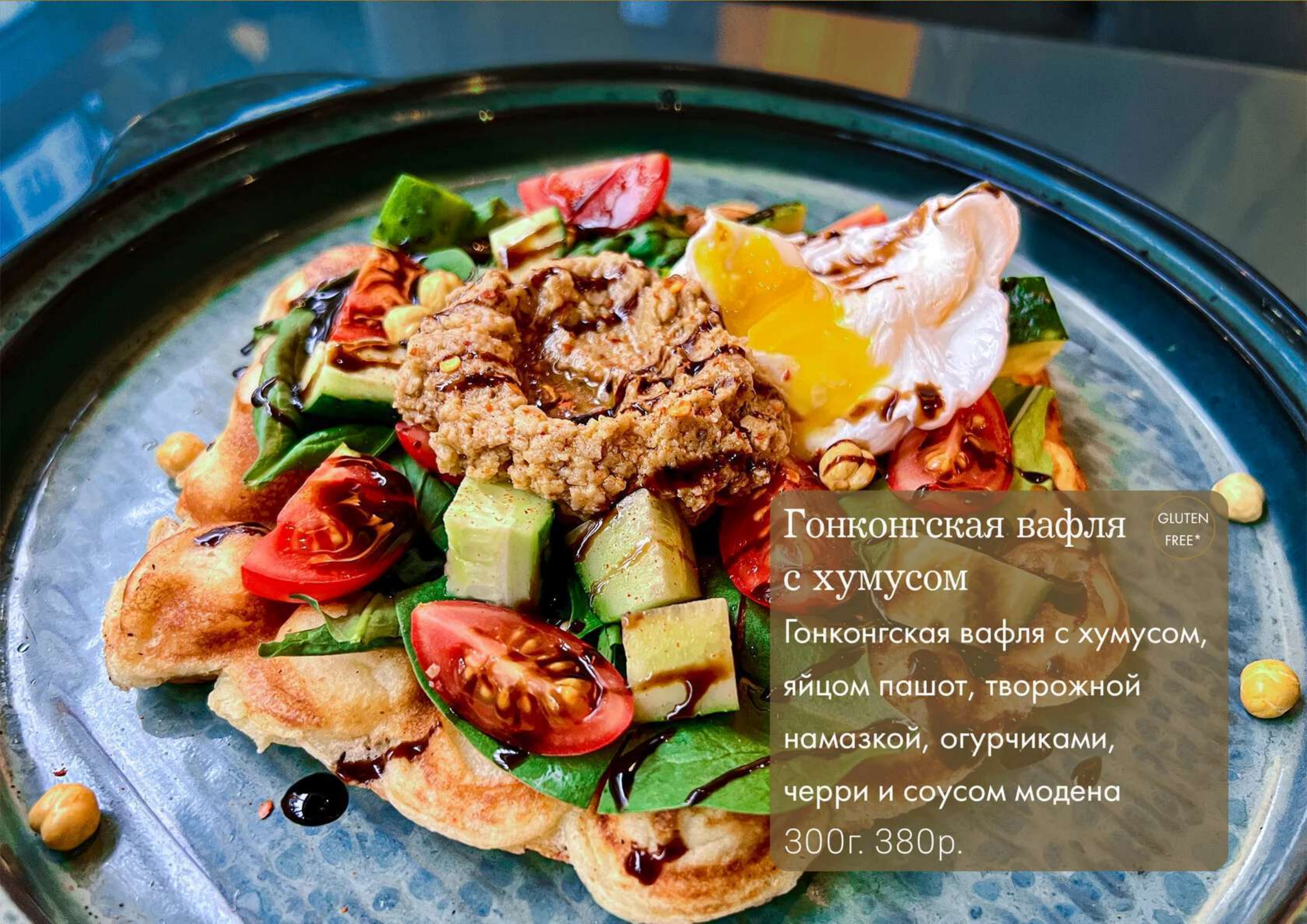
Гонконгская вафля с хумусом Гонконгская вафля с хумусом, яйцом пашот, творожной намазкой, огурчиками, черри и соусом модена 300г. 380р.