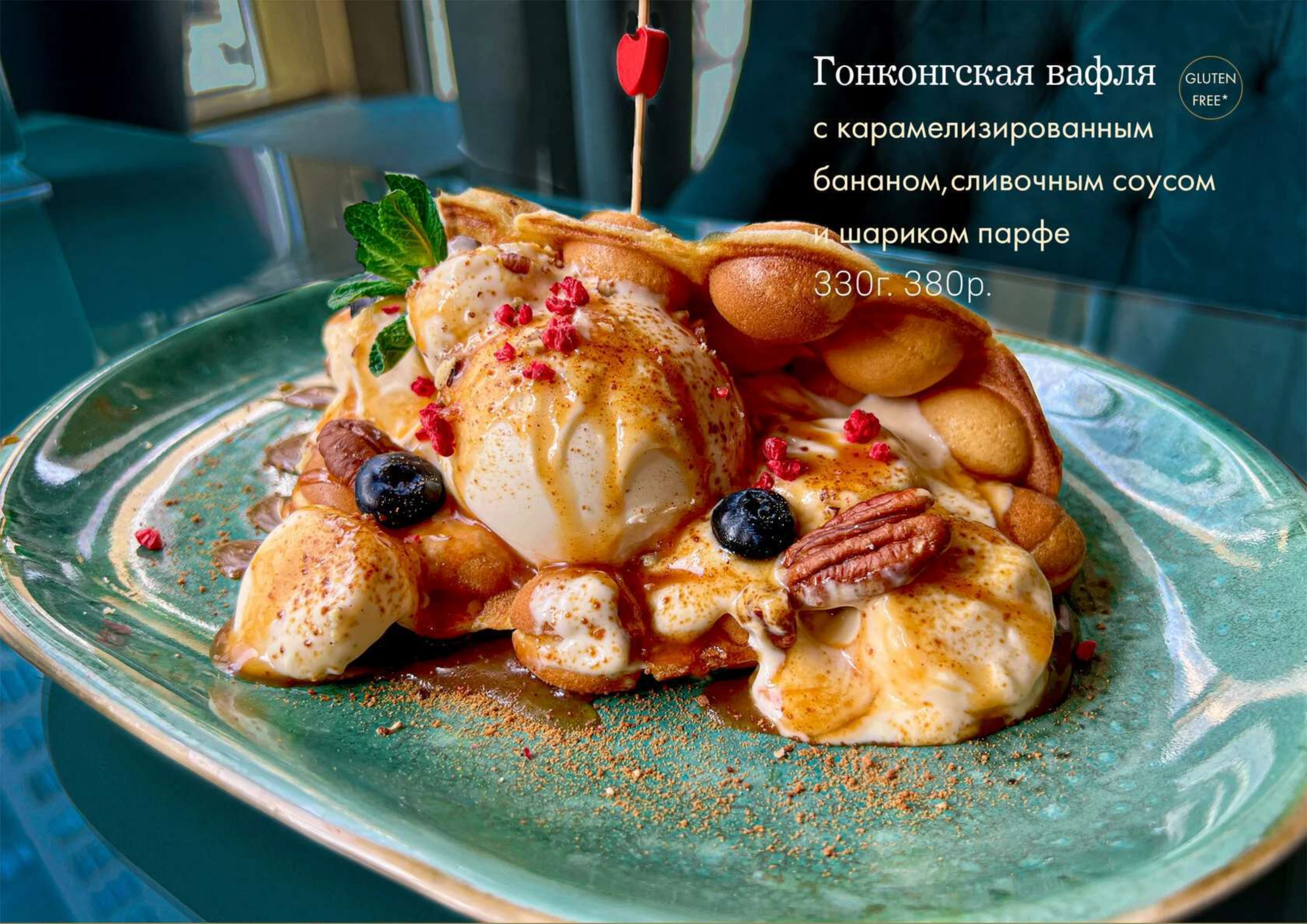
Гонконгская вафля с карамелизированным бананом, сливочным соусом и шариком парфе 330г. 380р.